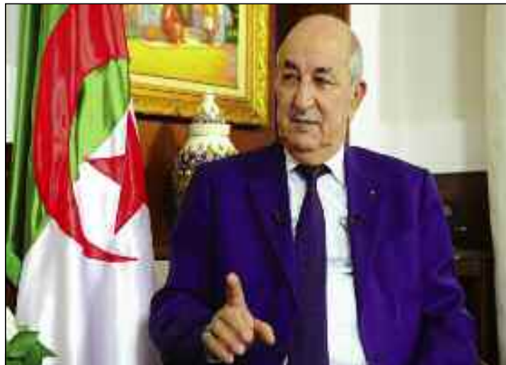
■ Nécessité de renforcer le contrôle de la qualité sur les médicaments

Le président de la République, Abdelmadjid Tebboune a appelé, avant-hier dimanche, à la révision du système de santé du pays. «Cette crise du coronavirus était l'occasion pour une révision, dans le fond et en détail, du système sanitaire, afin d'asseoir un système de santé moderne garantissant au citoyen une prise en charge décente», a indiqué le chef de l'Etat lors de la réunion périodique du Conseil des ministres en visioconférence qu'il a présidée.