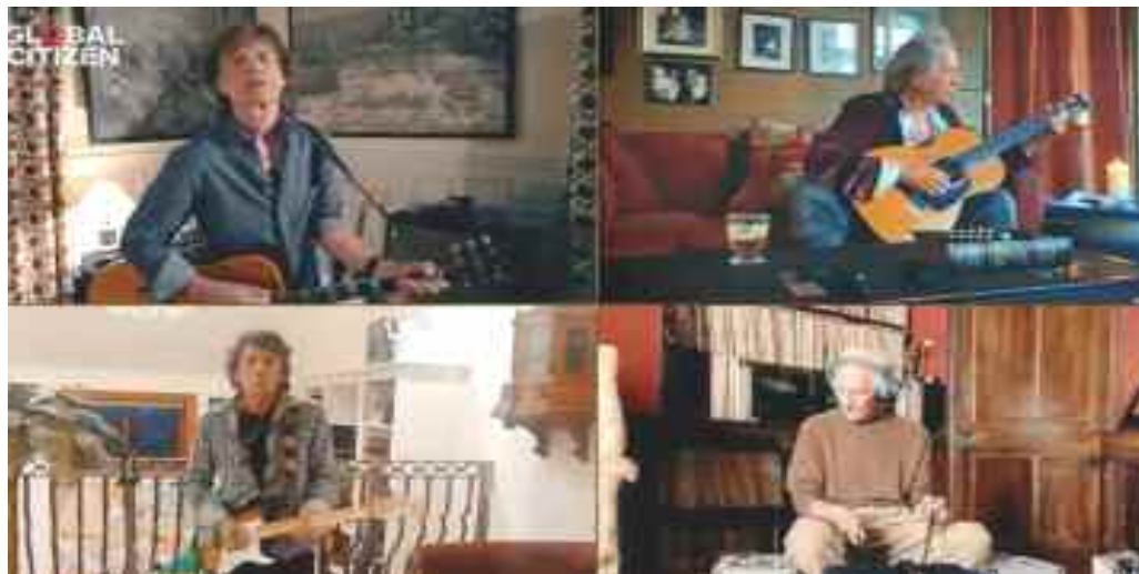
De nombreux artistes se sont relayés durant huit heures lors du concert virtuel géant en hommage aux soignants intitulé «One World : Together at Home».

concert de deux heures, retransmis sur les grandes chaînes américaines et présenté par le trio d'animateurs des principaux late-night shows : Jimmy Fallon, Jimmy Kimmel et Stephen Colbert. A l'affiche, les plus grandes stars de la planète, en direct depuis leur domicile, dont Billie Eilish, Elton John, Jennifer Lopez, Céline Dion, Paul McCartney ou encore Stevie Wonder. La soirée a été ponctuée par de nombreuses vidéos montrant les applaudissements du personnel soignant à travers le monde ou des actes de bonté à l'égard des personnes isolées et fragiles. Jimmy Fallon et les Roots ont chanté Safety Dance pour rendre hommage aux travailleurs de la santé.