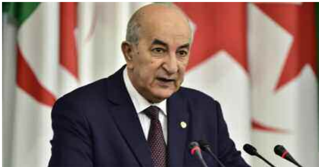
■ La véritable démocratie ne saurait se construire que dans le cadre d'un Etat fort avec sa justice et sa cohésion nationale.

Edifier «un Etat fort et équitable sans aucune ambiguïté entre la liberté et l'anarchie» garant d'une «véritable démocratie, étant une revendication populaire irréversible, une démocratie accordant à tout un chacun la place qu'il mérite indépendamment de sa position sociale». Cette orientation a été soulignée par le Président Abdelmadjid Tebboune, au cours du Conseil des ministres dont il a présidé la réunion, dimanche 19 avril 2020, par visioconférence.