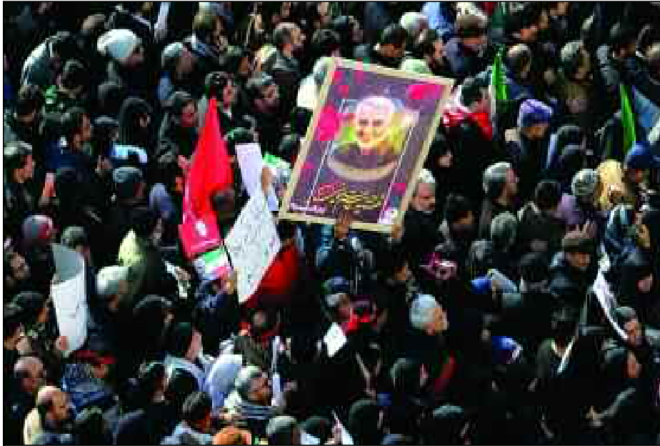
■ Obsèques du Général Qassem Soleimani à Téhéran.

L'ambassade d'Arabie saoudite à Washington a averti que toute modification du Plan global d'action conjoint (PGAC) mettrait en danger la région du Moyen-Orient dans son ensemble, a écrit Arab News. L'ambassade a déclaré que le compte Twitter de ArabiaNow a été piraté et que les pirates s'en étaient servis pour publier de fausses informations au nom du