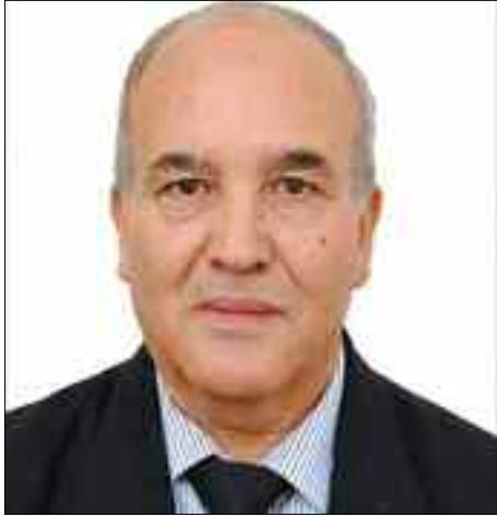
Professeur des universités, expert international D' Abderrahmane Mebtoul

-Premier axe, améliorer l'efficacité énergétique par une nouvelle politique des prix (prix de cession du gaz sur le marché intérieur (environ un dixième du prix) occasionnant un gaspillage des ressources qui sont gelées transitoirement pour des raisons sociales, dossier que j'ai dirigé avec le bureau d'études américain Ernest Young et avec les cadres du ministère de l'Énergie et de Sonatrach que j'ai présenté personnellement à la commission économique de l'APN en 2008, renvoyant à une nouvelle politique des prix (prix de cession du gaz sur le marché intérieur environ un dixième du prix international occasionnant un gaspillage des ressources qui sont gelées transitoirement pour des raisons sociales. C'est la plus grande réserve pour l'Algérie, ce qui implique une révision des politiques de l'habitat, du transport et une sensibilisation de la population. L'on doit durant une période transitoire ne pas pénaliser les couches les plus défavorisées. A cet effet, une réflexion doit être engagée pour la création d'une chambre nationale de compensation, que toute subvention devra avoir l'aval du Parlement pour plus de transparence.