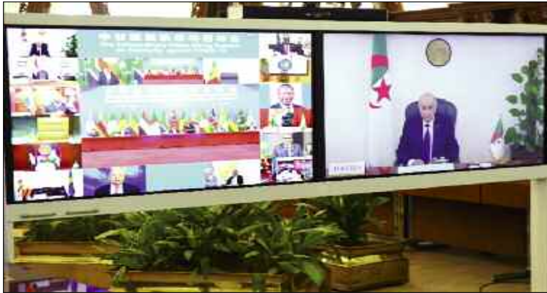
■ les pays africains ont franchi de grandes étapes dans la solidarité et la coopération.

Le président Abdelmadjid Tebboune, a participé, hier, mercredi par visioconférence au sommet extraordinaire Chine-Afrique, sur la solidarité contre la propagation de la pandémie de la Covid-19. Dans son intervention, le président Tebboune, a rappelé que l'Algérie est l'un des premiers pays à coopérer pleinement avec la Chine dans les circonstances difficiles.