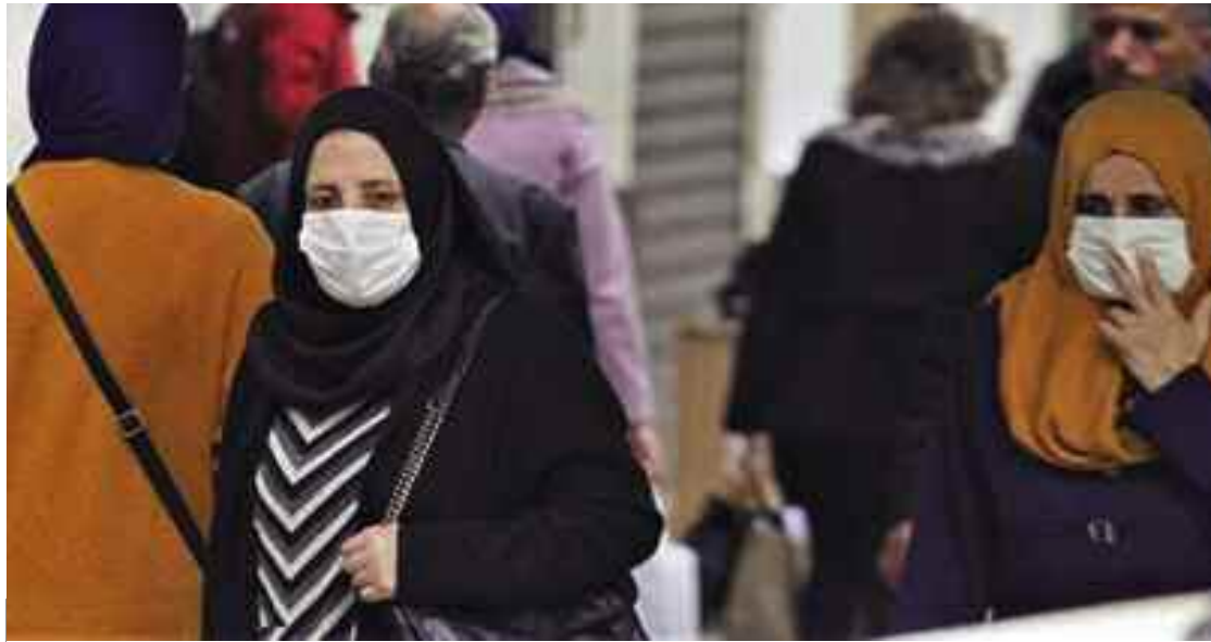
■ Intensification des efforts de prévention et de lutte contre la propagation de l'épidémie. citoyens.

Deux jours après la mise en application des mesures de levée du confinement et de reprise de certaines activités commerciales, économiques et sociales, au titre de la deuxième phase de la feuille de route qui a tracé le plan de sortie progressive et flexible du confinement, le Premier ministre, Abdelaziz Djerad, après consultation du Président de la République, a adressé aux membres du gouvernement, une instruction contenant un certain nombre de mesures complémentaires, en conformité avec le caractère progressif et flexible de la démarche adoptée par le gouvernement.