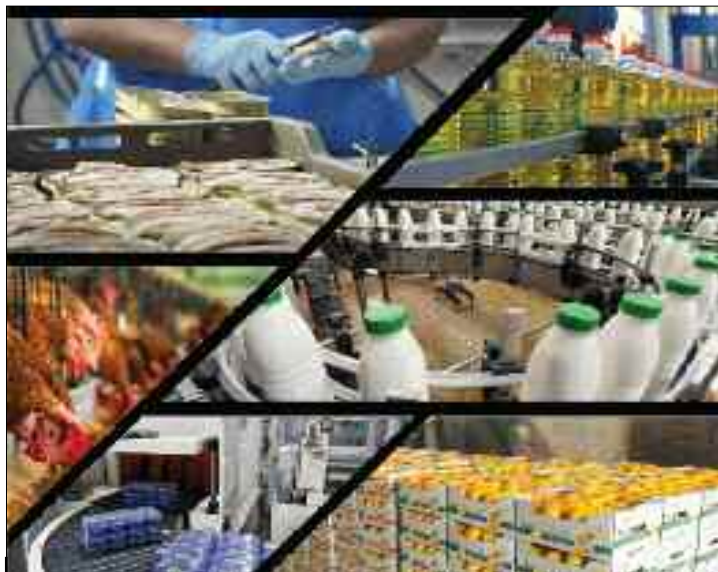
Les gains de productivité auraient dû être plus importants avec un potentiel élevé de créations d'emplois.

Notamment ceux liés à la réalisation de nouvelles unités de transformation de légumes dont la tomate industrielle. Il en est ainsi des nouvelles unités implantées dans les régions de l'extrême-Sud du pays. Malgré la faiblesse du brix, deux unités de transformation de la tomate activent sans discontinu. Tout autant que beaucoup d'autres que leurs homologues des régions du Nord, ils ont été stimulés par les dernières décisions prises par le président de la République lors du dernier Conseil des ministres. Elles portent entre autres sur l'interdiction d'importation des produits agricoles pendant la saison des récoltes. Sur aussi, la stimulation des industries de la transformation agricole à même de réduire la facture des importations. Il est précisé que cette dernière démarche est à appliquer particulièrement en cette conjoncture financière difficile induite par la pandémie du nouveau coronavirus et la baisse des prix du pétrole. Des sources ont affirmé que ces dernières années, le secteur privé national se plaint de sa mise à l'écart des marchés et de la concurrence déloyale qui