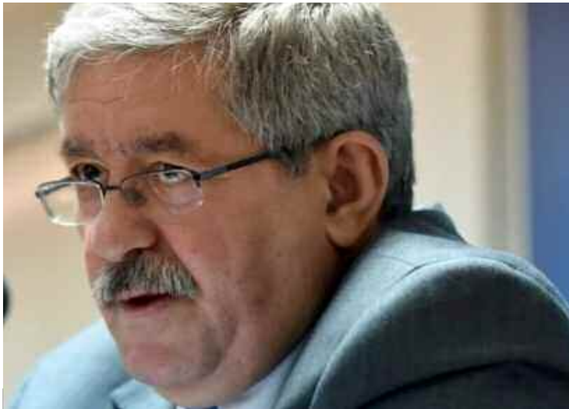
■ Ahmed Ouyahia lors de l'enterrement de son frère.

Une peine de 12 ans de prison a été prononcée hier mercredi par le tribunal de Sidi M'hamed (Alger) à l'encontre de l'ancien Premier ministre Ahmed Ouyahia dans l'affaire du groupe Sovac dont les inculpés ont été accusés de corruption, notamment pour blanchiment et transfert à l'étranger de capitaux issus des revenus criminels, corruption, trafic d'influence, et pression sur des fonctionnaires publics pour l'obtention d'indus privilégiés.