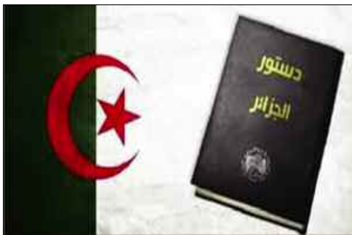
Le comité est attaché à traduire les revendications du Hirak populaire en dispositions prévues dans les sept axes.