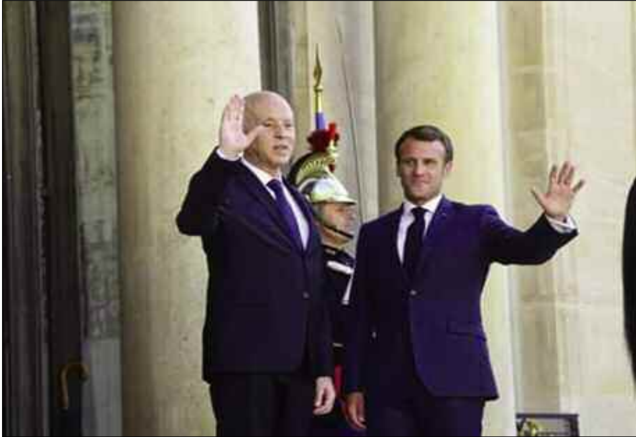
■ La France s'est engagée financièrement envers la Tunisie à hauteur de 1,7 milliard d'euros jusqu'en 2022.