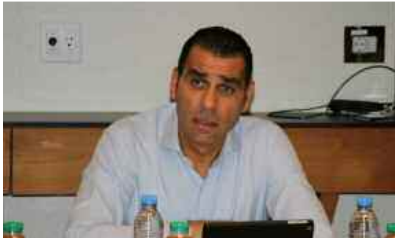
■ Désigner les relégables, un vrai casse-tête chinois pour la FAF.

«Dans le cas où l'option d'arrêter le championnat à la dernière journée sera prise, je ne considère pas qu'on doit déclarer un champion, parce que le championnat ne s'est pas terminé. Un champion est celui qui va au terme de la compétition, c'est-à-dire jusqu'à la 30 e journée. Par contre, on va devoir désigner des représentants pour les compétitions africaines, et c'est à ce moment-là qu'il faudra tenir compte du classement avant l'arrêt de la com-