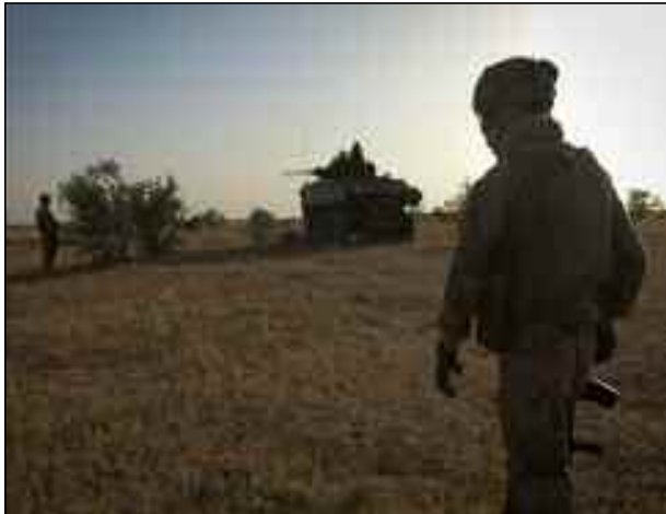
■ La Task force Tabuka en opération de lutte contre le terrorisme au Sahel.

Dans les faits, selon des observateurs, il s'agit beaucoup plus d'une force avec une dimension politique que militaire, destinée à briser l'isolement de la France sur le théâtre sahélien. Sur le terrain, le déploiement de forces spéciales à vocation offensive répond en particulier au souci d'atteindre des objectifs stratégiques comme la libération de