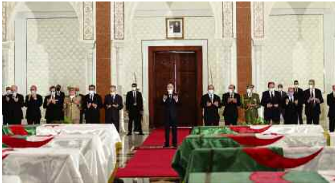
■ La cérémonie d'accueil des cercueils a été présidée par le Président Abdelmadjid Tebboune.

Paris où elles sont «conservées» depuis un siècle et demi. Le Président de la République avait annoncé, jeudi, lors d'une céré-