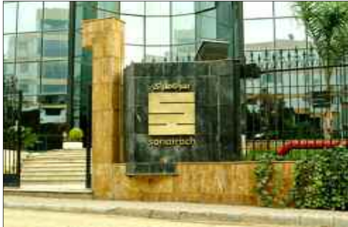
Le marché, actuellement, est déstabilisé et rien n'indique le retour rapide comme espéré des prix aux sommets.

En effet, la crise sanitaire n'est qu'un argument de plus au profit d'un soutien substantiel des politiques publiques en procédant à « la réduction de son plan d'investissement et de ses dépenses de 50 % durant les derniers mois, suite aux instructions du gouvernement », selon les dernières déclarations, mercredi passé, à Alger du P-dg de Sonatrach, Toufik Hakkar, assurant, cependant, que « ces restrictions n'impacteront pas l'activité de production, ni les acquis des travailleurs ». Ainsi, il a répondu à toute polémique sociale découlant de cette décision. Porté par un sentiment d'urgence face à la double crise économique et sanitaire que traverse le pays dont les recettes budgétaires proviennent à plus de 96% des revenus des hydrocarbures, la Sonatrach décide de réduire son budget de 50% et ne retenait de ses projets d'investissements que les plus importants. Cette démarche s'inscrit dans le cadre d'optimisation de sa gouvernance qui a été toujours remise en question. La compagnie tenterait, de ce fait, tirer profit de la gestion inconséquente de l'offre mondiale par certains pays producteurs qui n'ont pas adhéré sérieusement ou suffisamment à l'accord