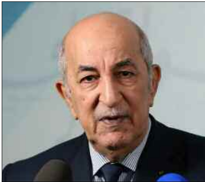
■ Ne jamais renoncer à une quelconque partie de notre patrimoine historique et culturel.

Le président de la République, Abdelmadjid Tebboune, a affirmé, avant-hier jeudi, au Palais du Peuple (Alger), que la célébration de la Fête de l'indépendance constituera, cette année, l'un des moments forts de l'histoire de la nation. A la faveur, a-t-il indiqué, de la récupération des restes mortuaires de glorieux Chouhada de la Résistance populaire, ces héros qui ont affronté l'occupation française brutale, entre 1838 et 1865 et que l'ennemi sauvage a décapité en représailles avant de transférer leurs crânes outre-mer afin que leurs sépultures ne soient pas un symbole de la Résistance et une illustration du rejet de l'occupation.