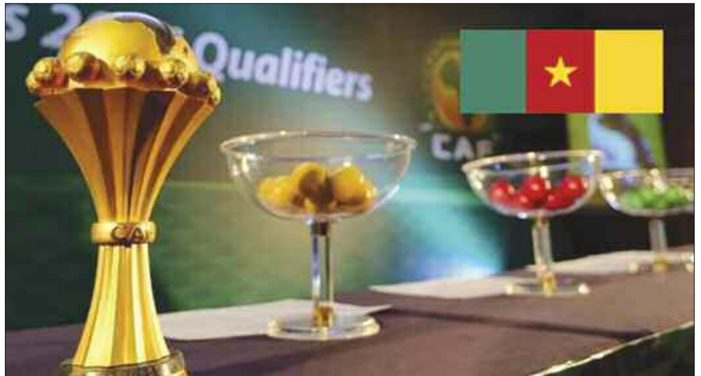
■ Il va falloir encore attendre pour voir la CAN au Cameroun.

La faiblesse de la CAF a eu raison de sa gestion puisqu'elle n'aurait pas réussi à éviter toutes ces interférences qui ne manqueraient certainement pas, demain, de susciter questionnements et hypothèses. Voilà que l'Algérie, tenante du titre après son triomphe en Égypte l'été 2019, conservera symboliquement la couronne continentale, un an de plus. D'autres grands événements sportifs tombent aussi, en l'occurrence les Jeux olympiques, la Copa America et l'Euro. Le Covid-19 serait, dit-on, la cause de cet emballement ? La prochaine Coupe d'Afrique des nations, initialement programmée en janvier 2021 au Cameroun, se tiendra donc en 2022. «Le CHAN-2020 est