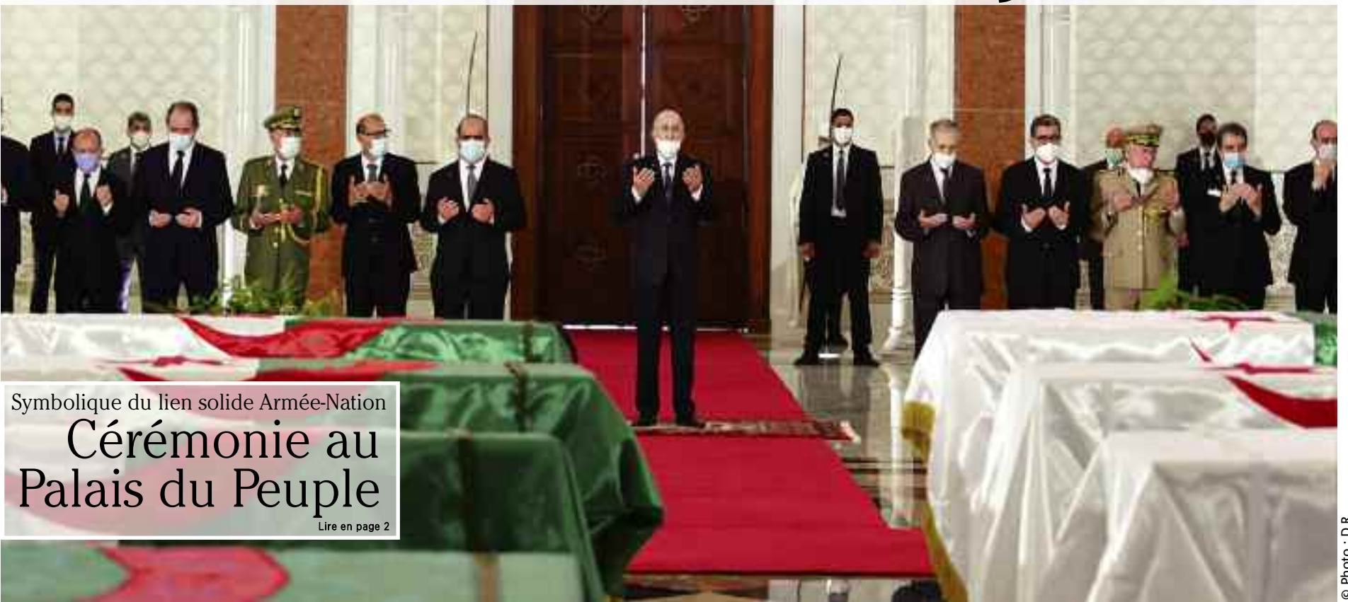
Symbolique du lien solide Armée-Nation Cérémonie au Palais du Peuple Lire en page 2