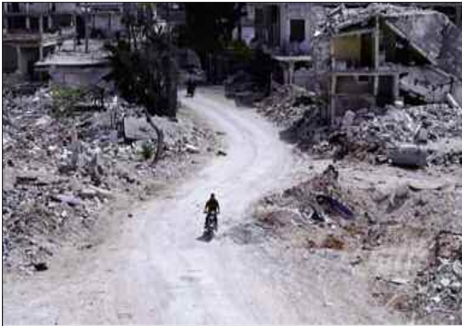
■ Un crime contre l'humanité : des centaines de morts et près d'un million de déplacés.