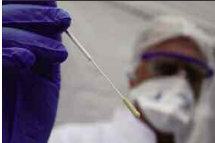
Le dépistage massif doit être au cœur de cette nouvelle stratégie en assurant au grand public la disponibilité des moyens.

Le personnel soignant exposé quotidiennement au risque de contamination au Covid-19, paie un lourd tribut dans sa lutte contre la propagation du Coronavirus en Algérie. Plusieurs victimes à déplorer ces derniers jours en raison de l'importante affluence des malades de Covid-19 dans les établissements de la santé, ce qui a provoqué la saturation de certains services dédiés au Covid-19 dans certaines régions hautement affectées par le Coronavirus.