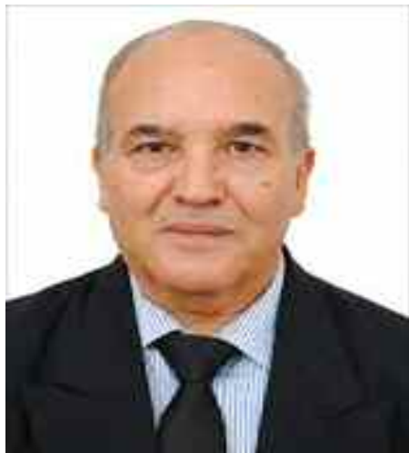
Professeur des universités, expert international D' Abderrahmane Mebtoul

L'objet de cette contribution, en m'en tenant au segment socio-économique, devant être élargi à l'anthropologie culturelle, est de poser cette problématique stratégique inséparable de la bonne gouvernance et de l'efficacité des institutions. Contrairement aux idées de certains bureaucrates rentiers, qui ont peur de perdre une parcelle de leur pouvoir, la régionalisation économique renforce le rôle de l'Etat régulateur, améliore l'efficacité économique et contribue à l'unité nationale par la cohésion sociale régionale.