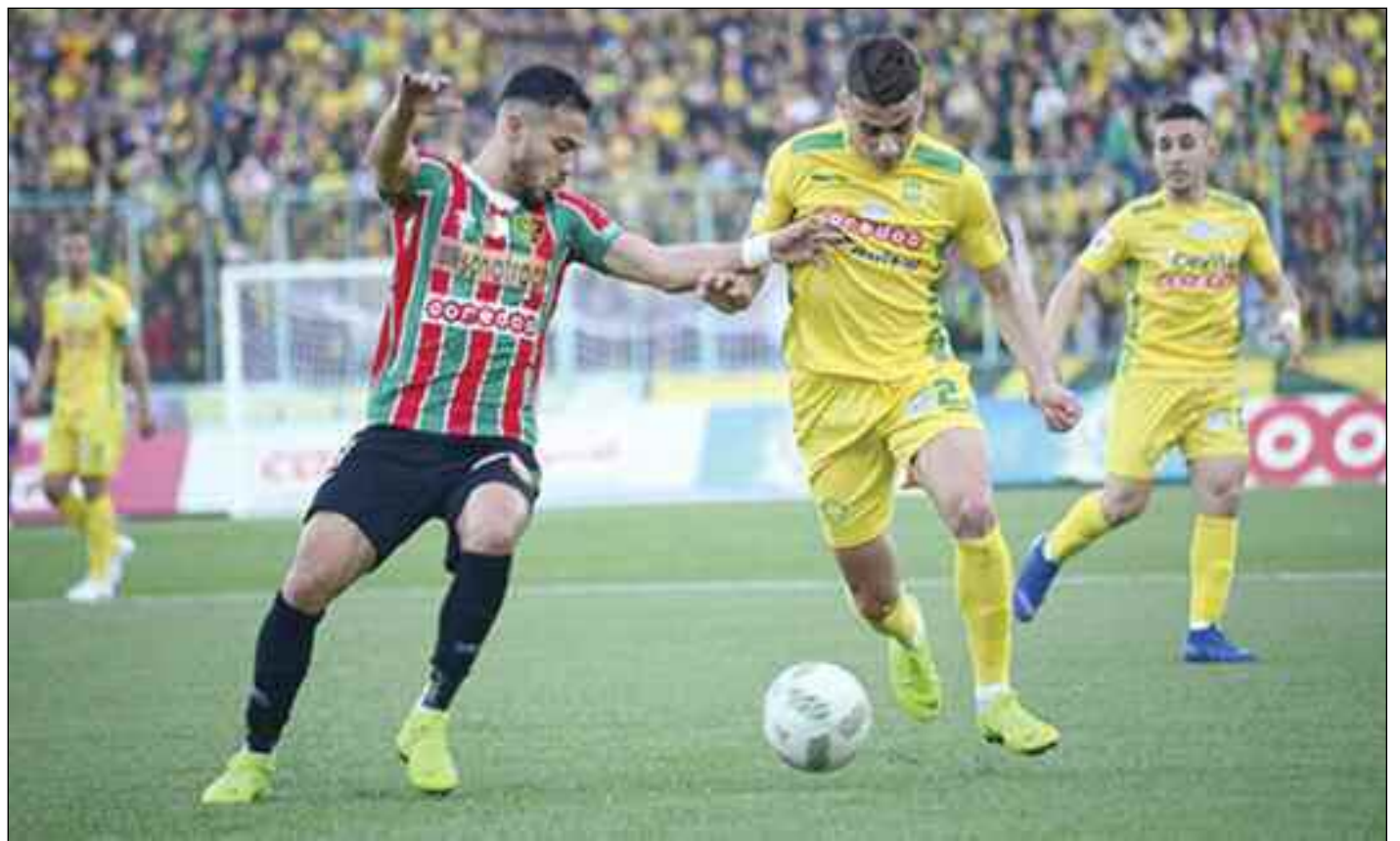
■ Les joueurs du MCA et de la JSK retrouvent le sourire.