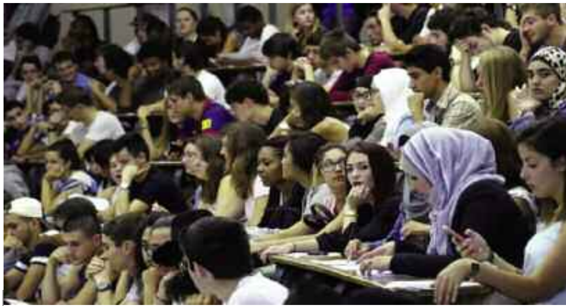
■ Mettre en place des mécanismes idoines permettant aux universités d'améliorer le niveau de l'encadrement pédagogique et scientifique.

Le ministre de l'Enseignement supérieur et de la recherche scientifique, Abdelbaki Benziane a déclaré, lundi à Alger, que toutes les mesures préventives contre la pandémie du coronavirus seront prises lors de la prochaine rentrée universitaire qui se fera progressivement à partir du 23 août. «Au vu de la conjoncture sanitaire que traverse le pays, ces mesures préventives seront appliquées aussi bien dans les universités que dans les résidences universitaires», a précisé le représentant du gouvernement.