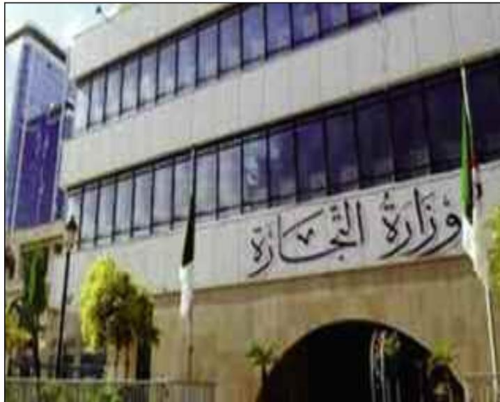
■ La vente au rabais, la vente promotionnelle et la liquidation ne sont pas une priorité actuellement.

L'opération de vente au rabais ou soldes, rappelle la même source, est régie par les dispositions du décret exécutif du 18 juin 2006