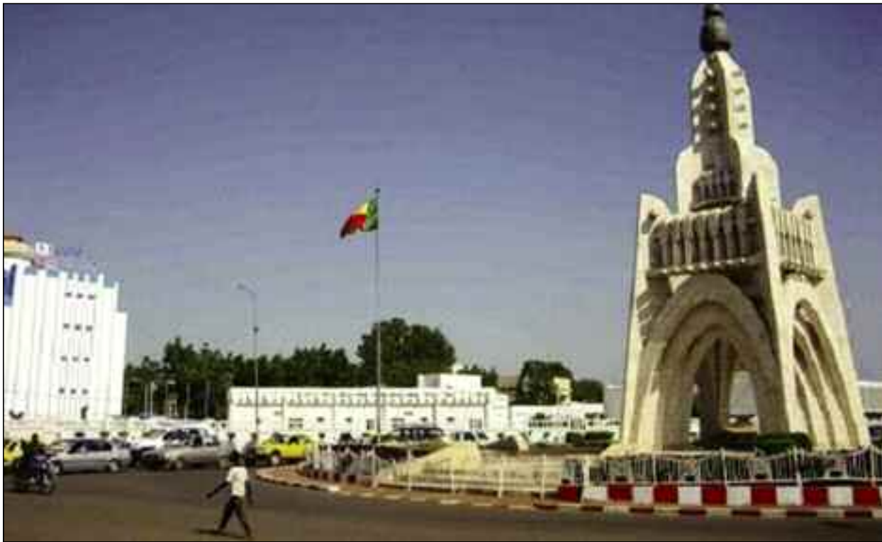
■ Sortie de crise : des chefs d'Etat à Bamako.