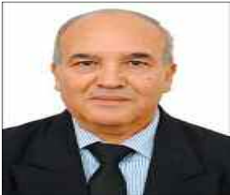
Professeur des universités, expert international D' Abderrahmane Mebtoul

Le second scénario est le déconfinement total avec le risque d'un désastre sanitaire avec des millions de morts, qu'aucun Etat et système sanitaire ne pourraient supporter avec le risque d'une déstabilisation politique de bon nombre de pays qui n'ont pas d'assises populaires. La solution médiane est un déconfinement progressif maîtrisé conciliant l'aspect. Le choc de 2020 dû au coronavirus aura des effets durables sur l'économie du monde 2020/2021.