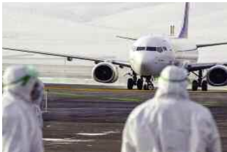
■ «Nos représentations consulaires seront mobilisées tous les jours de la semaine pour l'opération de rapatriement».

Comme annoncé jeudi 16 juillet par les Services du Premier ministre, une opération de rapatriement des Algériens bloqués à l'étranger suite à la propagation de la pandémie du Coronavirus, a été engagée depuis lundi. Pour cela, la flotte aérienne et maritime a été mobilisée ainsi que les établissements hôteliers devant servir pour la période de quatorzaine sanitaire préventive applicable aux personnes rapatriées.