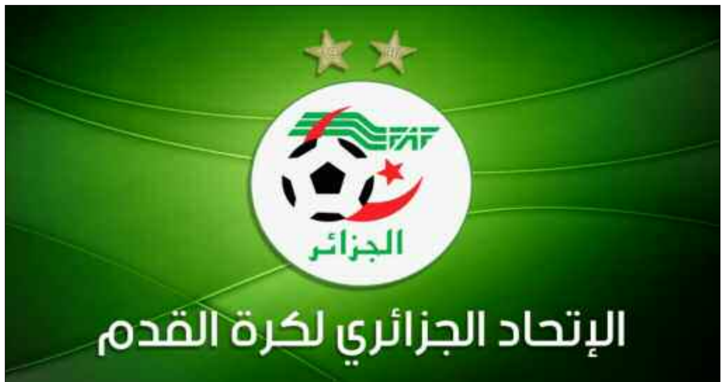
■ La FAF ne veut pas assumer le choix seule, elle préfère consulter les clubs.

Les informations continuent à se stocker et chacun aura demain à s'interroger sur son choix ou sur le choix de sa stratégie.