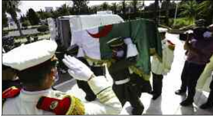
Un hommage a été rendu aux martyrs de la victorieuse Guerre de libération, dans une ambiance solennelle et émouvante.

La célébration du 58 ème anniversaire de la Glorieuse guerre de libération nationale le 5 juillet 1962, cette année, était exceptionnelle, marquée par une vive émotion des Algériens qui ont rendu, ces trois derniers jours, un vibrant hommage aux restes mortuaires de 24 résistants algériens à la colonisation française au 19 ème siècle, restitués, vendredi dernier, par la France.