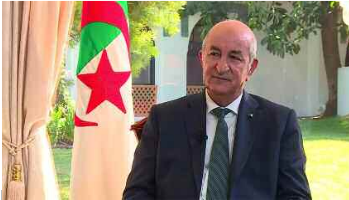
■ Tebboune : «Macron est un Président très honnête, sincère et très propre du point de vue historique».

Dans une interview accordée à la chaîne de télévision française «France 24», le Président Abdelmadjid Tebboune a fait connaître la position de l'Algérie sur les questions d'actualité, notamment celles ayant trait aux relations avec la France. Il a rappelé qu'entre l'Algérie et la France, «les contacts n'ont jamais été rompus depuis 1962», relevant que «les deux pays sont passés quelque fois à des relations d'un niveau supérieur, alors que parfois il y a eu du froid dans des relations compliquées, passionnelles et passionnées».