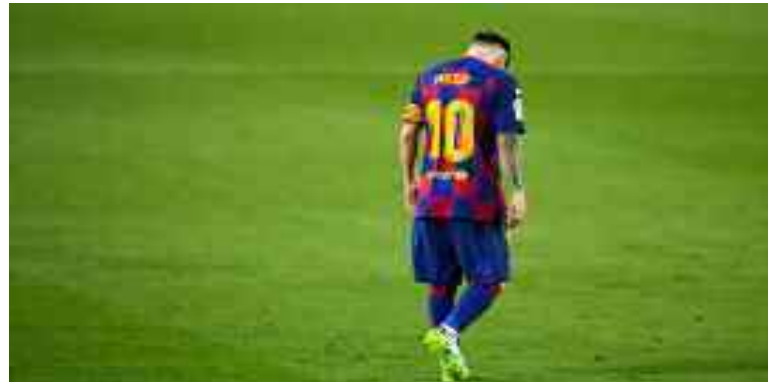
■ Messi en a marre de toutes les polémiques.

→ L'avenir de Lionel Messi à Barcelone agite l'Espagne ce vendredi. La Cadena Ser affirme que l'attaquant barcelonais a stoppé les discussions autour de sa prolongation et envisage un départ dans un an.