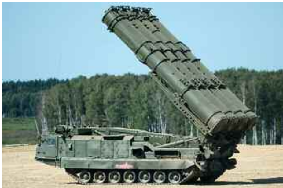
■ Batterie de défense anti-aérienne russe S-400 Triumph.

Selon le site d'armement russe, à l'heure actuelle, on sait qu'à 8 kilomètres de la ville d'Al-Yarubiya, la construction d'une base aérienne militaire américaine a débuté ces derniers jours, où il est prévu de déployer des hélicoptères de combat, tandis que la construction d'une piste devrait également transférer des avions de transport militaire dans la région pour livraison du personnel militaire, des armes, des munitions et d'autres ressources, tandis que l'armée américaine n'a pas déclaré son intention de construire ses installations militaires dans la région, ce qui évidemment laisse cacher certains secrets militaires. À en juger par l'imagerie satellite, la zone clôturée pour la construction d'une base aérienne militaire sera vraiment très grande et il est prévu de placer une piste, des hangars couverts pour l'équipement et de construire des casernes pour le personnel militaire. Le nombre estimé de militaires dans la nouvelle base aérienne américaine peut atteindre 500 personnes. «Selon des sources locales dans la province d'Al-Hassaka, l'armée américaine vient de créer une nouvelle base aérienne pour renforcer sa présence dans le nord-est de la Syrie. Il est