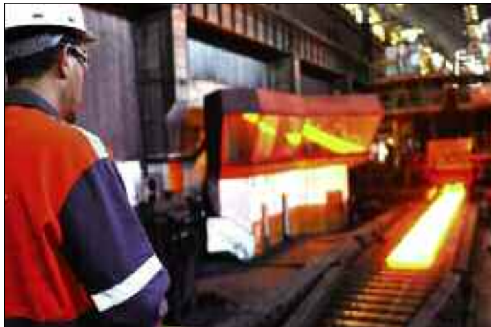
Le ministre n'est pas resté insensible aux explications des cadres gestionnaires.

A Annaba où il était en visite de travail et d'inspection du complexe sidérurgique El Hadjar, le ministre de l'Industrie Ferhat Ait Ali Braham s'est longuement attardé sur les différents projets de réhabilitation. Ils lui ont été soumis dans le cadre de projet de relance d'entités industrielles. La production sidérurgique notamment sous ses différentes formes.