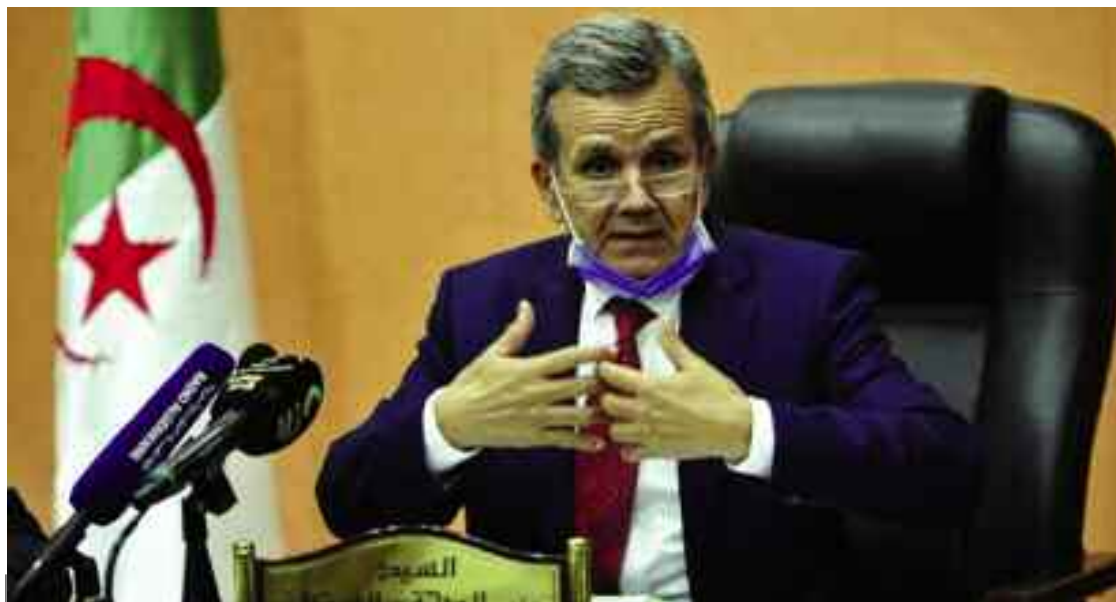
■ Le reconfinement ciblé est appliqué dans plusieurs pays du monde qui font face à la flambée du nombre des contaminations.

Le rebond des contaminations au Covid-19, ces deux dernières semaines, inquiète. La poussée record des infections au nouveau coronavirus, particulièrement, dans quelques wilayas du pays et la hausse des cas d'hospitalisation préoccupent les épidémiologistes et les spécialistes de la santé qui multiplient depuis plusieurs jours les messages d'alertes et les appels à l'intervention urgente des autorités afin d'endiguer la propagation du coronavirus.