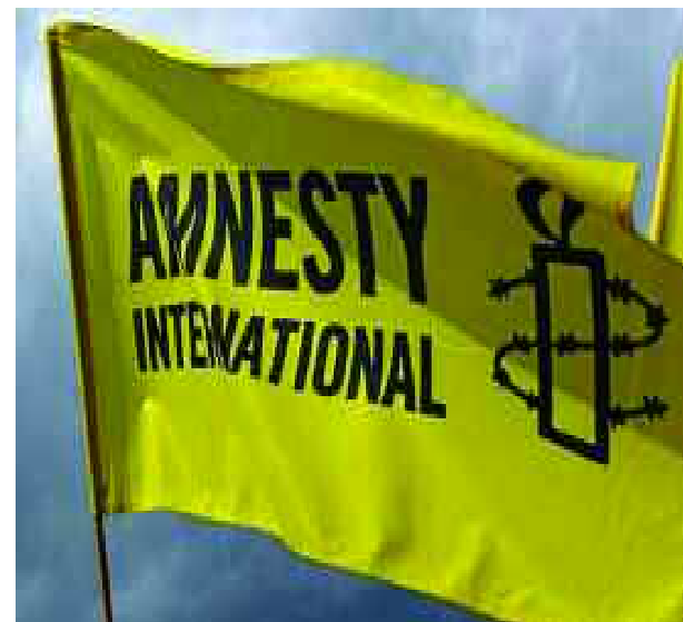
■ Amnesty International indésirable au Maroc.