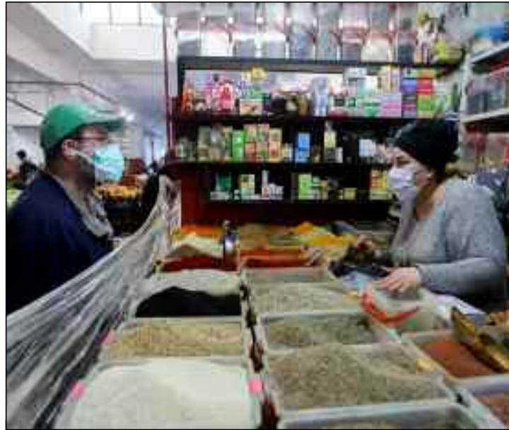
■ Il faut intensifier les opérations de contrôle et de sensibilisation des commerçants.

Faisant savoir qu'il s'agit d'exiger des commerçants