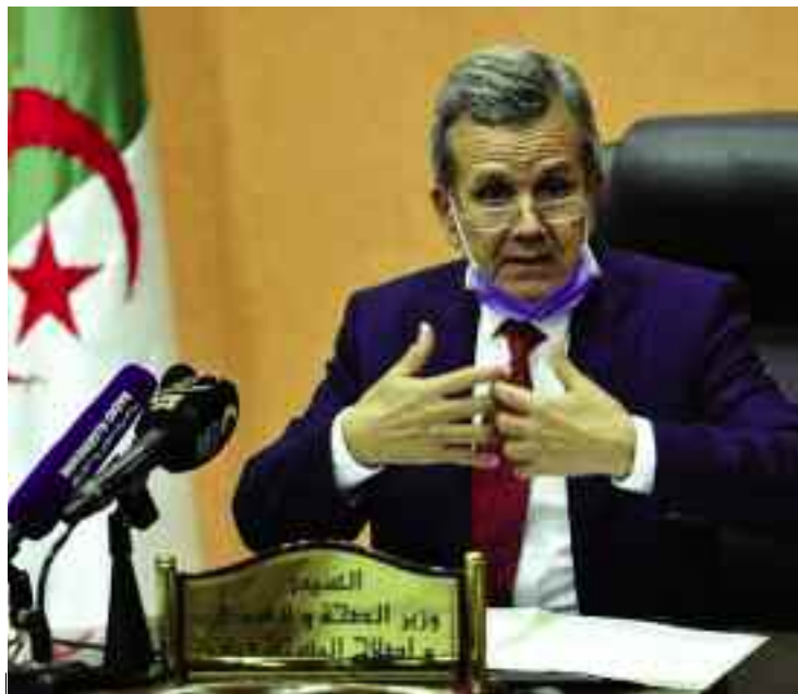
■ Le ministre a accordé un délai de 48 h aux responsables des structures sanitaires pour garantir les bonnes conditions aux patients.

La progression exponentielle du nouveau Coronavirus s'accélère sur le territoire national, affectant particulièrement le corps médical au front depuis le début de la crise sanitaire. Le nombre de décès dans le secteur de la santé est assez important et aussi inquiétant qui ne cesse d'inciter les citoyens à respecter les mesures de préventions et de sécurités afin d'éviter la saturation des hôpitaux et l'aggravation de la situation.