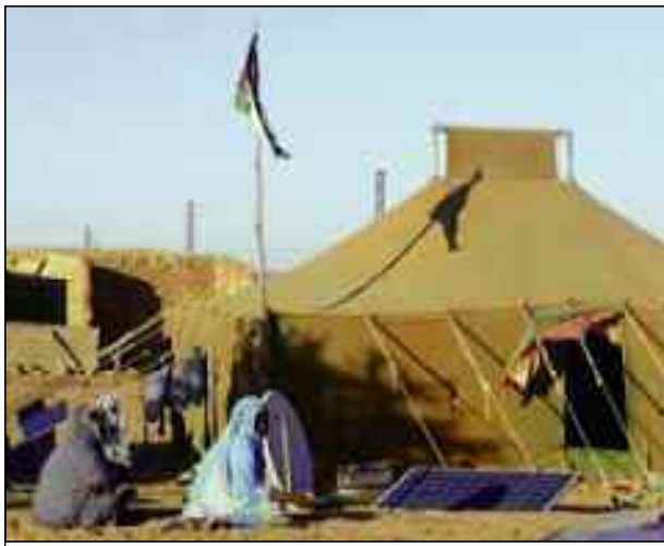
Camp de réfugiés sahraouis.