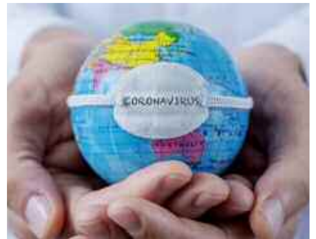
La solidarité mondiale à l'épreuve du Covid-19.