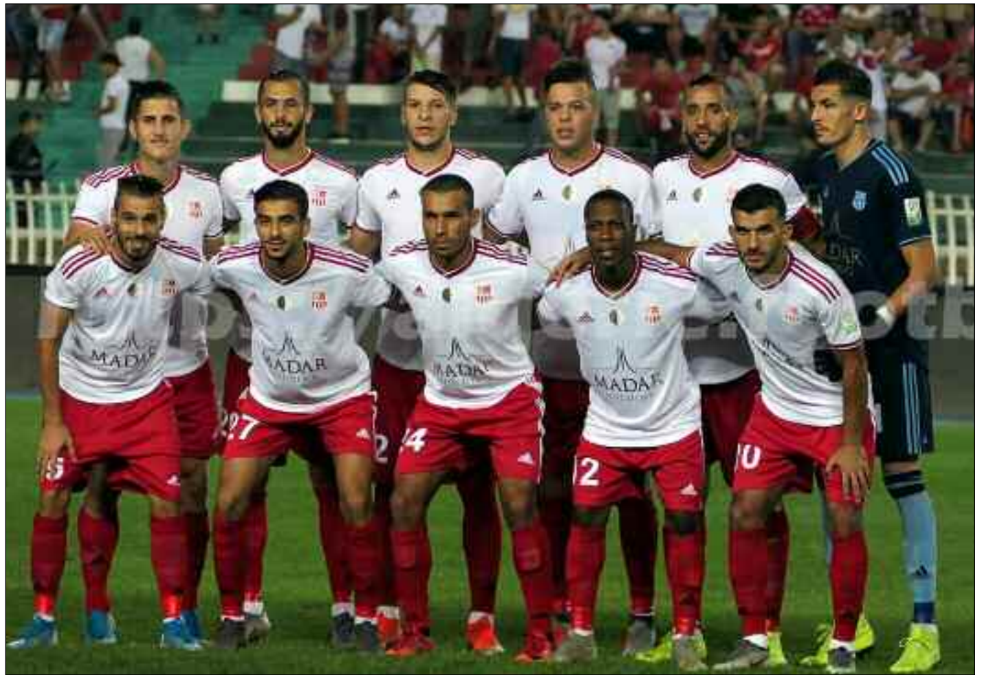
■ Le CRB ne désespère pas de terminer champion.