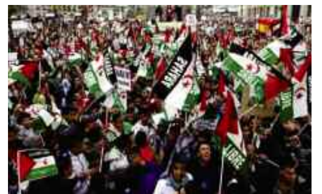
■ Manifestations pro-sahraouies en Espagne.