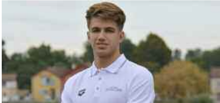
■ Syoud s'est engagé avec l'ONN, à la faveur d'un partenariat entre la FAN et le club.

Bénéficiaire d'une bourse de préparation octroyée par la FAN sur des