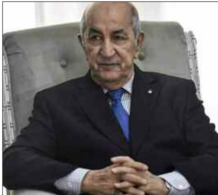
■ Tebboune : «Il existe une coopération humaine, scientifique et économique entre la France et l'Algérie.»

boune affirme que «l'Algérie est incontournable pour la France, et la France l'est pour l'Algérie. Il faut affronter ces événements douloureux pour repartir sur des relations profitables aux deux pays, notamment au niveau économique. La mémoire ne peut être estompée et nous ne pouvons pas en faire ce que nous voulons. La remise récente des restes mortuaires des combattants qui se sont opposés, il y a un siècle et demi, à l'installation de l'armée coloniale constitue un grand pas. D'autres crimes méritent d'être racontés, comme la prise de l'oasis de Zaâtcha où les troupes françaises du général Emile Herbillon ont massacré les combattants du cheikh Bouziane. Le maréchal de Saint-Arnaud a aussi perpétré de nombreux massacres, qui ont fait plus de victimes qu'à Oradour-sur-Glane. Beaucoup d'historiens français traitent ces événements historiques en toute honnêteté». Le Président Tebboune estime qu'«une fois ces problèmes de mémoires dépassés, nous pourrions avancer avec beaucoup de sérénité. Il existe une coopération humaine, scientifique et