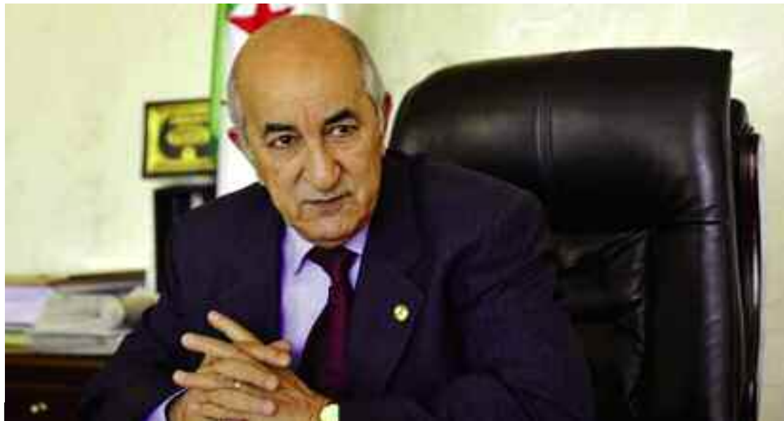
■ Le chef de l'Etat a fustigé les résultats mitigés et insignifiants comparé au potentiel existant, ces dernières années.

Devant les deux options qui se présentent pour faire face aux charges de la relance économique qui pèsent sur le budget de l'Etat, le président Tebboune a exclu l'endettement extérieur et a opté pour la fiscalité, en accélérant la mise en œuvre des réformes financières adaptant la fiscalité en niveau et en structure. Une remise à niveau qui devra concerner tous les secteurs économiques stratégiques du pays.