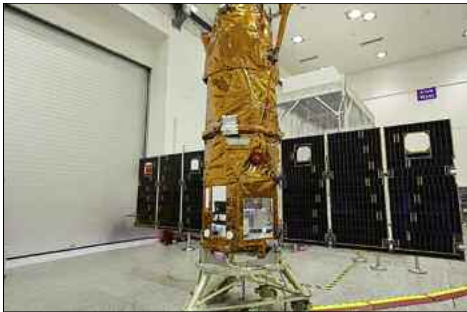
■ Ofek-16, le nouveau satellite espion israélien contre l'Iran

Le 6 juillet 2020, l'État d'Israël a procédé au lancement d'Ofek-16, son plus récent satellite espion à usage exclusivement militaire, a annoncé récemment le ministère israélien de la Défense. Le décollage de la fusée Shavit-2 est survenu juste en guise de réponse directe au lancement par l'Iran du satellite Noor (Lumière en Farsi et en Arabe) au mois d'avril 2020.