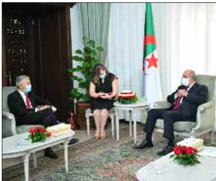
■ Cette visite intervient dans un contexte international assez particulier en raison de la pandémie du Covid-19.

Le président de la République, Abdelmadjid Tebboune, s'est entretenu, hier, à Alger avec le ministre de l'Intérieur du Royaume d'Espagne, Fernando Grande-Marlaska Gomez, en visite officielle d'un jour en Algérie. Plusieurs questions liées aux relations de coopération dans le domaine de l'intérieur ont été abordées lors de cette rencontre, à laquelle a pris part une importante délégation espagnole.