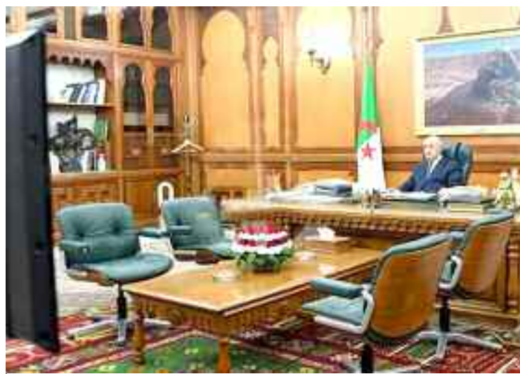
Le retour aux cours sera étalé dans le temps en tenant compte des impératifs liés aux conditions sanitaires et de leur évolution sur le terrain.

Les préparatifs de la rentrée universitaire 2020-2021 et la relance de l'économie imposent leurs priorités dans la mise au point des dispositifs de lutte contre l'épidémie du Coronavirus qui ne veut pas lâcher prise. Comment va se terminer l'année universitaire qui est encore inachevée et comment va commencer la prochaine ? Comment remettre en marche et faire atteindre la vitesse de croisière l'économie nationale ? Ces questions ont été au centre de la réunion périodique du Conseil des ministres, présidée dimanche par visioconférence par le Président Abdelmadjid Tebboune.