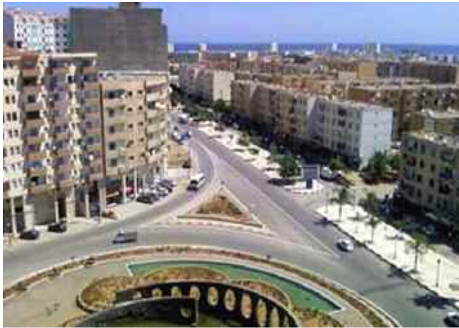
Depuis pas mal d'années, la ville de Bordj Ménaïel est devenue une localité sans âme. Pourquoi un tel constat amer qui n'honore en aucun cas les habitants de cette ville ?

Et dire que dans la vie «Akhertha Moute» (en fin de compte il y a la mort). Il n'y a pas de médaille qui n'ait son revers ! Voilà pourquoi Bordj Ménaïel est restée à la traîne en matière de développement économique, social, sportif et surtout culturel. Nos aïeux agissaient collectivement et cela pour le bien de la société et de la famille. Ce n'est plus le cas