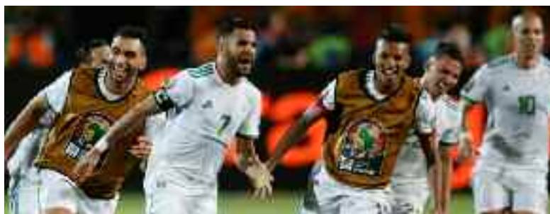
■ Les Verts reprendront du service en novembre.

Pour la CAN-2021, les qualifications reprendront du 9 au 17 novembre 2020 avec les matches des 3 e et 4 e journées, tandis que les deux dernières journées (5 et 6) auront lieu du 22 au 30 mars