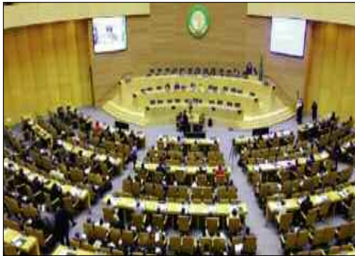
«La paix constituait un élément essentiel pour préserver la coopération internationale, le développement durable et la solidarité».

Les présidents des Parlements ont appelé, avant-hier jeudi, dans le communiqué final sanctionnant les travaux de leur 5 ème conférence, tenue par visioconférence et adopté à l'unanimité, la communauté internationale à saisir l'occasion du 75 ème anniversaire de l'Organisation des Nations unies (ONU) afin de réfléchir aux voies de réformer et de renforcer le système des Nations unies.