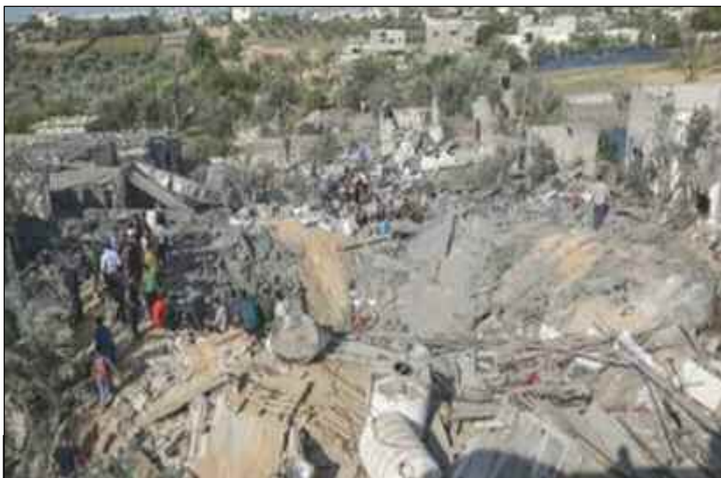
■ Importants dégâts sur le site à Ghaza.

Un avion de combat israélien a frappé un autre site à Beit Lahia, ville basée au nord de la bande de Ghaza, causant d'importants dégâts au site et aux propriétés des citoyens voisins. Aussi, l'artillerie de l'occupation a pris pour cible plusieurs endroits à l'est de la ville de Ghaza, sous blocus depuis plus de dix ans. La nuit dernière, l'aviation israélienne a bombardé avec six roquettes au moins un site à l'ouest de la ville de Khan Younis au sud de l'enclave, le détruisant et entraînant des dommages aux biens des citoyens dans la région. L'occupant israélien a récemment intensifié ses mesures punitives illégales