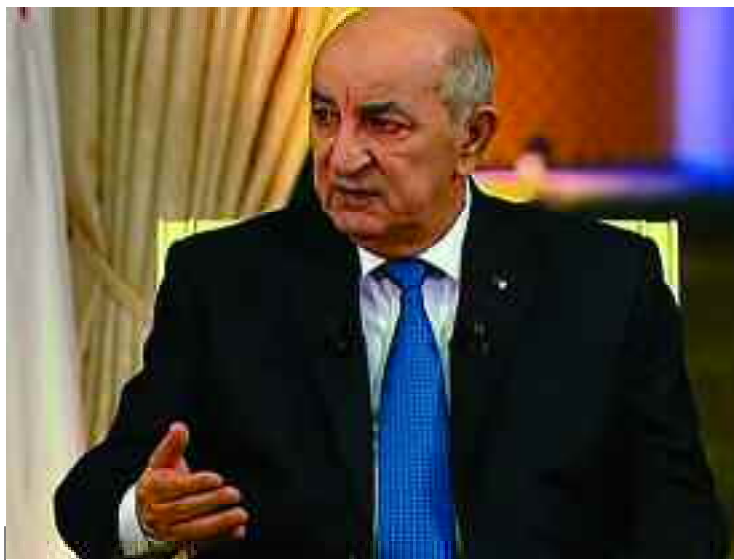
■ Tebboune : «Se mobiliser autour d'un seul objectif, celui de la renaissance de notre chère Algérie et son rayonnement régional.»

Saisissant l'occasion de la commémoration du double anniversaire de l'offensive du Nord constantinois (1955) et la tenue du Congrès de la Soummam (1956), qui ont eu lieu tous deux un 20 août, le Président Abdelmadjid Tebboune a appelé à «tourner la page des divergences et divisions pour une pleine adhésion à la bataille du changement radical que nous avons engagée aux plans politique et socio-économique. Cette même adhésion qui avait permis à nos aïeux de remporter la bataille de la libération en dépassant les calculs étriqués et les considérations personnelles pour se mobiliser autour d'un seul objectif, celui de la renaissance de notre chère Algérie et son rayonnement régional».