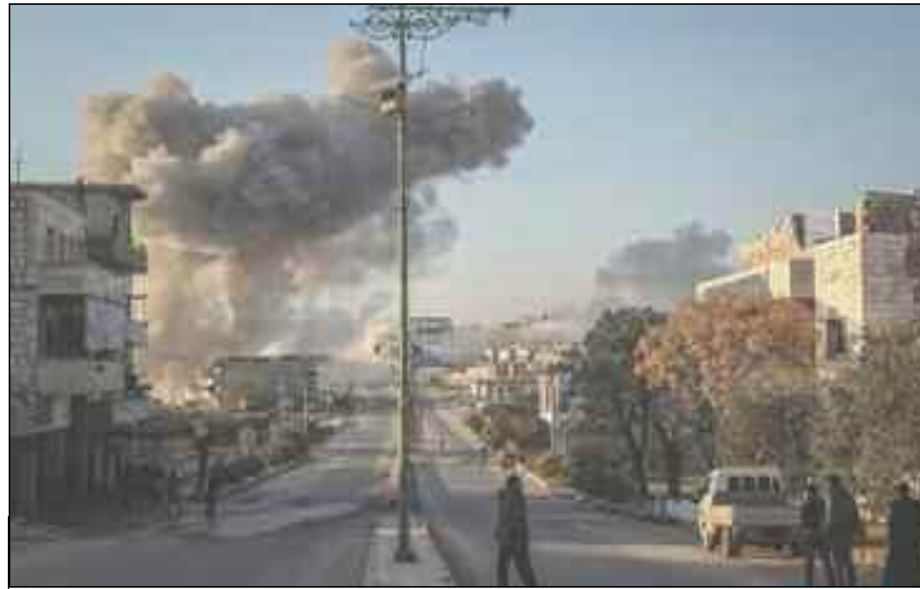
■ Bombardement dans la province d'Idlib.

Les terroristes se préparaient pour une attaque contre les positions de l'armée syrienne au sud d'Idlib et dans la plaine du Sahl al-Ghab, mais les forces syriennes ont lancé une opération préventive contre ces terroristes, a indiqué cette source médiatique. Haras al-Din est un groupe terroriste qui a déclaré son existence en 2016. Ce groupe est affilié à Al-Qaïda. Il est