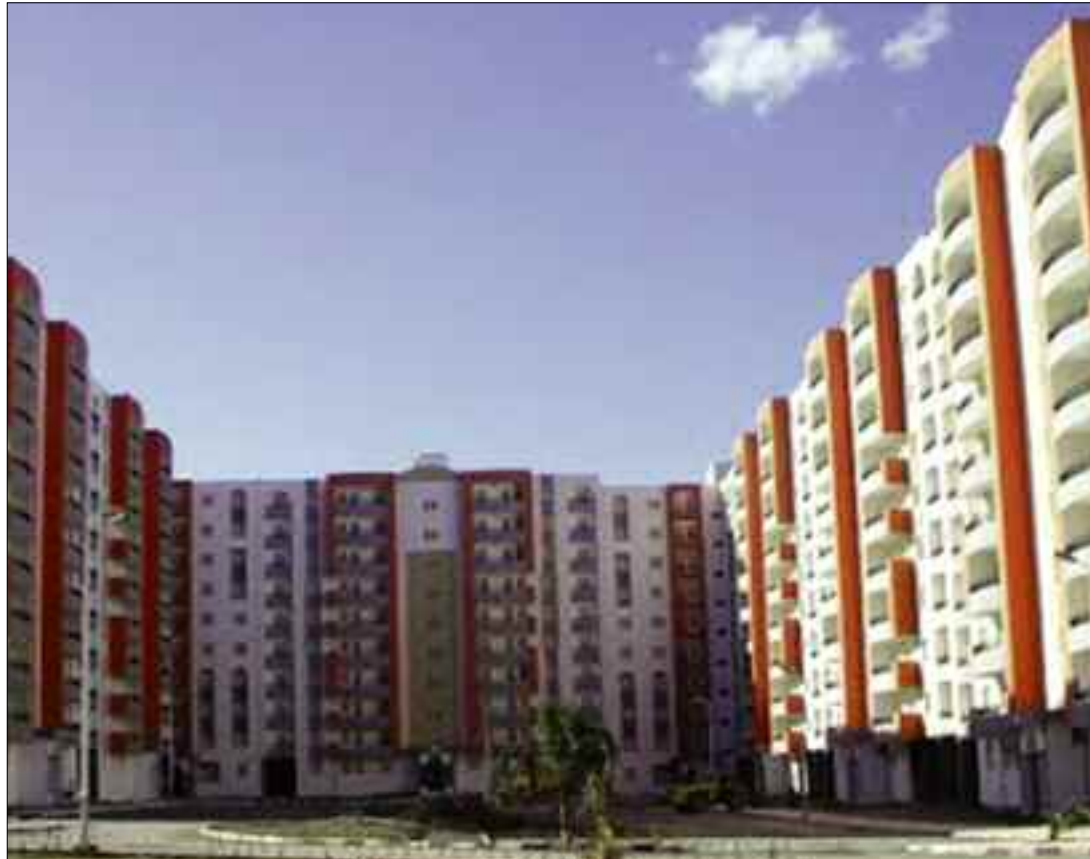
Les participants ont également préconisé le recours au mode de partenariat public-privé, comme solution pour financer et gérer les projets.

La nécessité de créer une banque de logement en vue de permettre de collecter l'épargne des ménages a été recommandée par un atelier sur l'Habitat, les Travaux publics et l'Hydraulique, organisé dans le cadre de la Conférence nationale sur le Plan de relance pour une économie nouvelle.