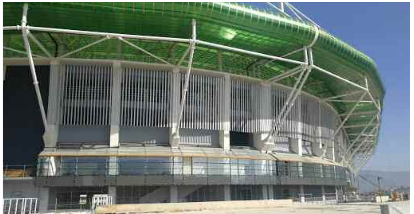
■ Le stade de Tizi-Ouzou a coûté beaucoup d'argent et de temps.

Récemment, un confrère faisait remarquer, à juste titre, «pratiquement dans tous les pays du monde, les délais de réalisation des infrastructures sportives sont en général respectés, sauf chez nous où ils jouent les prolongations au point de devenir ensuite des gouffres financiers». Cela ne peut être qu'une fatalité à laquelle est condamné le contribuable, sollicité à chaque fois pour compenser ces retards. En parcourant les écrits des confrères, on remarquera que les questions posées se complètent, elles se complètent avec des interrogations. «Pourquoi les auteurs de cette gabegie sont rarement inquiétés, on ne situe jamais les responsabilités dans