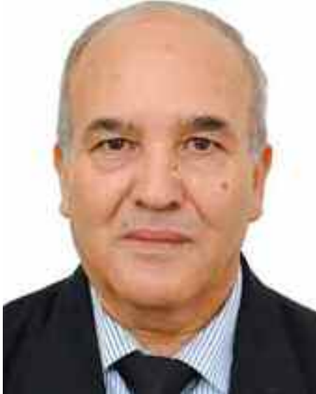
Professeur des universités, expert international D' Abderrahmane Mebtoul

- Quatrièmement sur le déficit budgétaire où les prévisions de la loi de Finances complémentaire 2020 qui se fonde sur le prix fiscal de 30 USD et sur le prix de marché de 35 USD est le prix au-delà duquel, si cela se réalise, le surplus sera versé au Trésor public, dans le Fonds de régulation des recettes, le fait le plus important est la baisse des exportations d'hydrocarbures à 17,7 milliards de dollars, contre 35, 2 milliards de dollars prévus dans l'ancienne loi de Finances. Le déficit budgétaire devrait atteindre -1 976,9 milliards de dinars, soit -10,4% du Produit intérieur brut (PIB) (contre -1 533,4 milliards de dinars, soit -7,2% du PIB dans la loi préliminaire). La balance des paiements enregistrant un solde négatif de -18,8 milliards de dollars, contre 8,5. Dans ce cadre, il faut éviter les utopies de la panacée de la finance islamique qui représente moins de 1% au niveau mondial, sa réussite reposant sur la visibilité de la politique socio-économique, la maîtrise de l'inflation liée à la cotation du dinar, et surtout de la confiance Etat-citoyens (voir notre interview mensuel financier Le Capital.fr-Tv France 24 avec l'AFP du 13 août 2020).