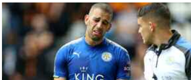
Leicester City a du mal à transférer Slimani.

→ L'attaquant international algérien Islam Slimani de Leicester City (Premier league anglaise de football), dont l'option d'achat n'a pas été levée par l'AS Monaco, devrait officialiser son transfert incessamment avec le Stade Rennais (Ligue 1/France), suite à un accord verbal trouvé entre les deux clubs, a rapporté vendredi soir le site Foot Mercato.