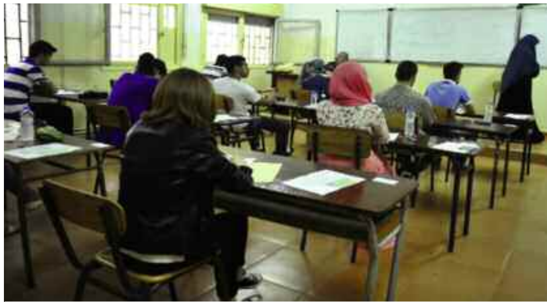
■ Ouadjaout : «La révision doit cibler toutes les matières concernées par les examens du BEM et du BAC»

Le ministre de l'Education nationale, Mohamed Ouadjaout s'est engagé, avant-hier samedi à Alger, à mettre en place des mécanismes pour le suivi du déroulement des opérations d'aménagement, de nettoyage et de désinfection des établissements scolaires en coordination avec les services compétents des collectivités locales et d'autres organismes, en vue de permettre leur ouverture pour la préparation psychologique et pédagogique des élèves.