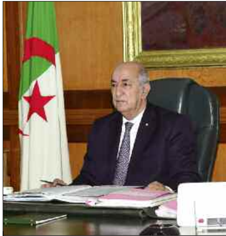
■ La conjoncture actuelle est marquée par la chute des prix des hydrocarbures et la pandémie du nouveau Coronavirus (Covid-19).

Cette réunion intervient après la conférence nationale sur le plan de relance socio-économique, qui a réuni, mardi 18 et mercredi 19 août, quelque 300 participants, dont des membres du Gouvernement, les partenaires sociaux et des personnalités indépendantes, notamment des experts nationaux vivant en Algérie et à l'étranger, afin d'asseoir les jalons d'un nouveau modèle de développement basé sur la diversification et le développement durable. Le Président Tebboune, avait rappelé à cette occasion, que la conjoncture actuelle est marquée par la chute des prix des hydrocarbures et la pandémie du nouveau Coronavirus (Covid-19), qui a fortement impacté les économies dans le monde. Mercredi dernier, le ministre de l'Energie, et président de l'Opep, Abdelmadjid Attar, a