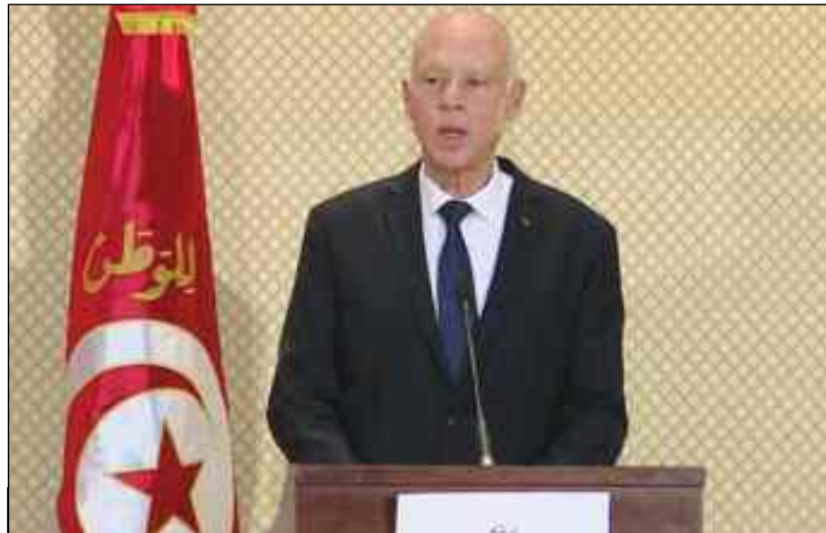
■ Kais Saïed, président de la République tunisienne, à l'issue d'une séance de travail Tunisie-Italie-Europe.