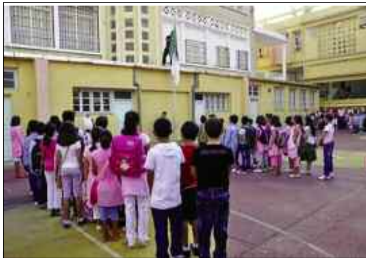
Les autorités vont maintenir les écoles fermées jusqu'à ce que le Comité scientifique approuve la décision de reprise.

Les premières directives concernant la rentrée scolaire prévue, au préalable, le 4 octobre prochain, ont été édictées au mois de juin dernier, lorsque la reprise en présentiel des cours pour les étudiants universitaires a été annoncée. Aujourd'hui, cette date a été reportée sine die par le gouvernement qui, depuis, n'arrive pas à se prononcer sur la date définitive de la rentrée scolaire.