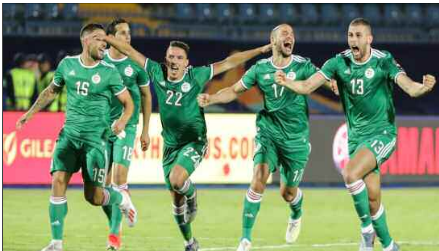
■ Les Algériens ont encore une année pour savourer le titre africain.

Les champions d'Afrique ne savent pas encore où disputer leur premier match amical. Programmé aux Pays-Bas, les autorités de ce pays n'ont pas donné leur accord, ils refusent de recevoir sur leur sol le match amical entre la sélection nationale algérienne de football, championne d'Afrique en titre, et son homologue camerounaise, à la fin du mois d'octobre prochain. Déception annoncée par ceux qui at-