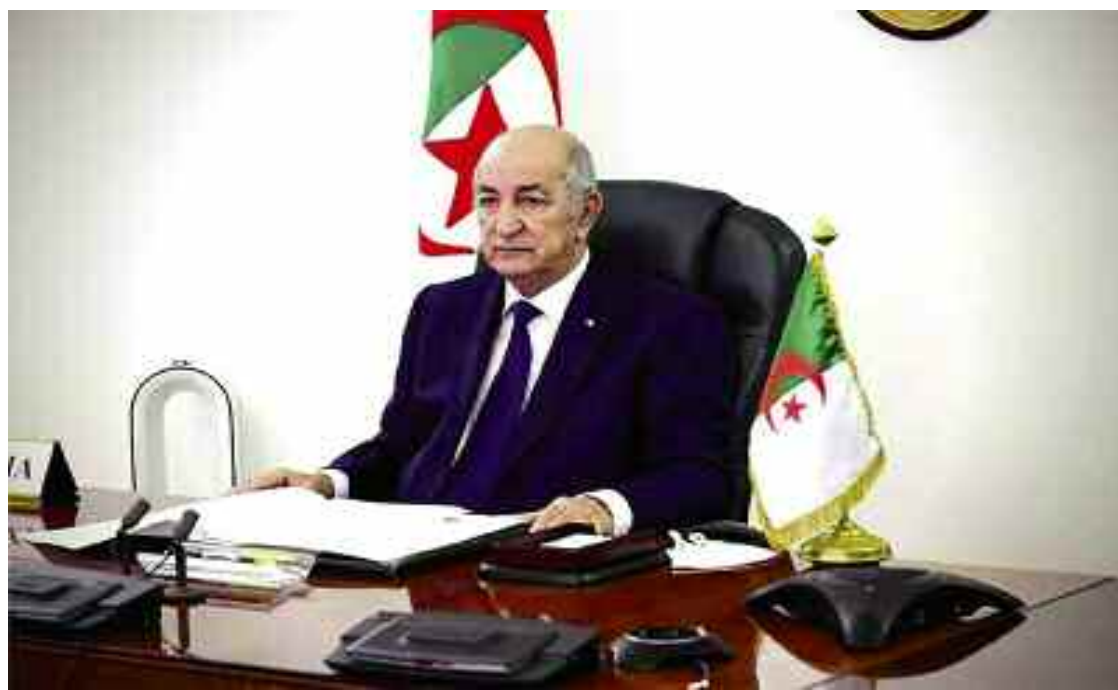
■ Tebboune : «L'Algérie s'est distinguée comme un pays pacifique, appliquant une politique de principes, notamment à travers sa médiation qui a permis de résoudre nombre de conflits».

avec l'entité sioniste, et son soutien constant à la cause palestinienne. Concernant le Sa-