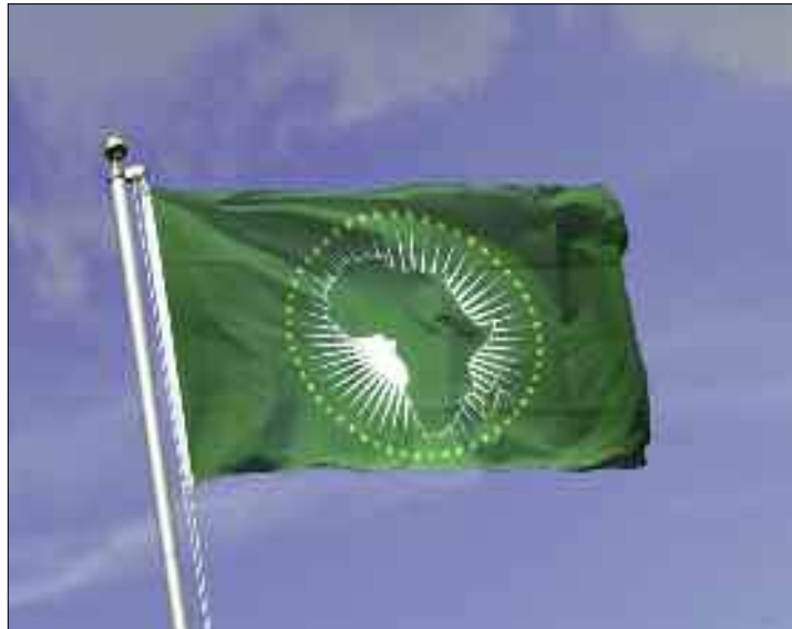
■ L'Algérie devrait bénéficier du PIB de l'Afrique de 2,5 milliards USD et des recettes du marché africain d'une valeur de 3.000 milliards USD.

Le ministre du Commerce, Kamel Rezig a affirmé, avant-hier mardi que son département ministériel est, actuellement, en négociation avec la partie africaine autour du démantèlement tarifaire. «Le secteur du Commerce œuvre, de concert avec les autres secteurs ministériels, à ce que l'accès de l'Algérie à la Zone de libre-échange continentale africaine (ZLECAF) qui compte 53 pays avec une densité de population dépassant 1,2 milliard d'habitants, soit un acquis pour le pays», a-t-il indiqué.