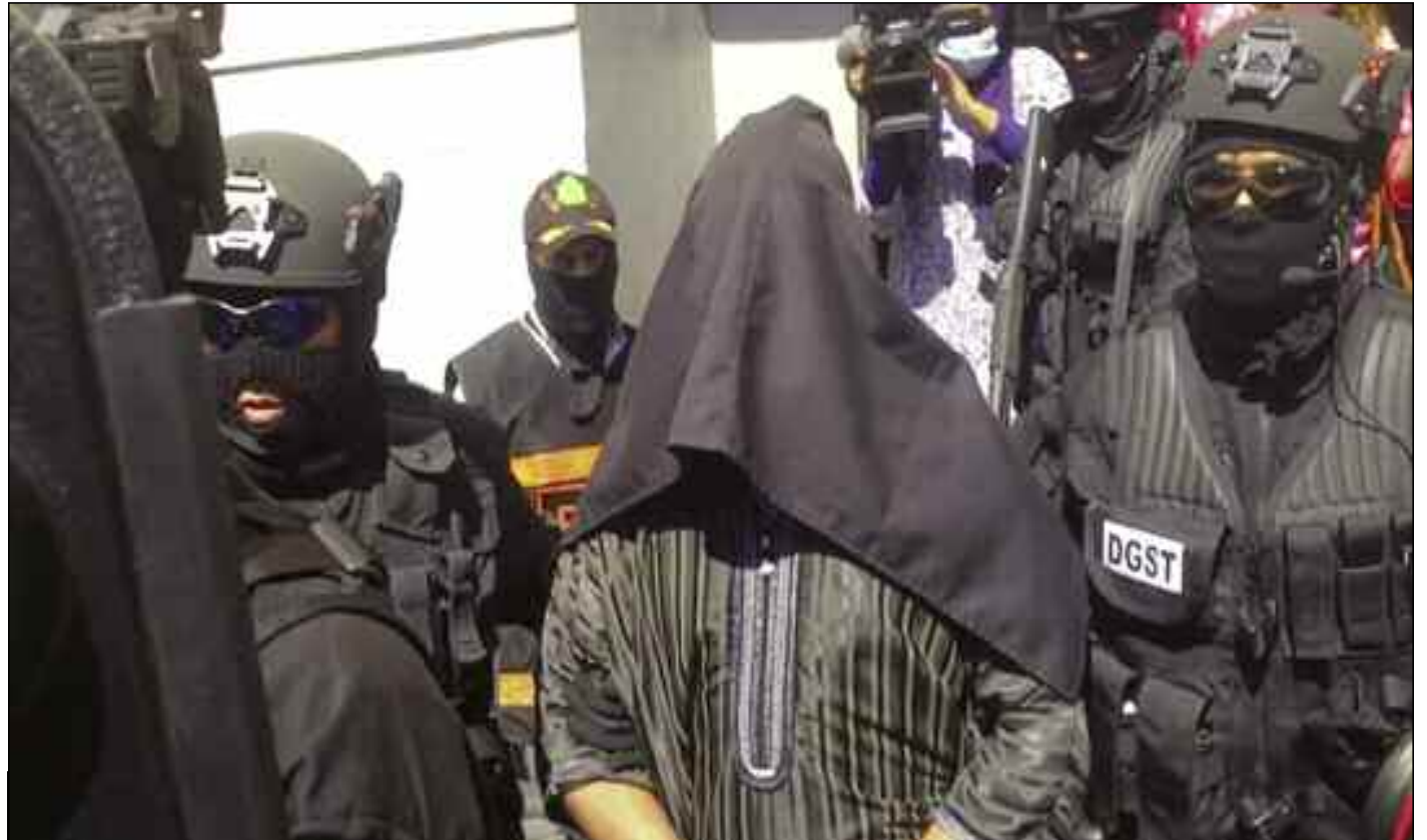
■ Maroc : Arrestation d'une cellule terroriste affiliée à l'organisation de l'Etat islamique (Daech).

Les investigations menées ont dévoilé que les membres de cette cellule, adeptes des méthodes sanguinaires de Daesh, avaient atteint un stade avancé dans la planification et la préparation d'un projet terroriste dangereux visant à attenter à la stabilité du Royaume et à semer la terreur parmi les citoyens, indique un communiqué du ministère de l'Intérieur Marocain cité par l'Agence marocaine. Les enquêtes ont également montré que ces individus, qui projetaient de rallier les rangs de l'organisation Etat islamique dans la zone syro-irakienne ou au niveau de sa section en Libye, avaient reçu des instructions de cette organisation terroriste afin de repérer des installations et des sites stratégiques dans certaines villes du Royaume pour y mener des attaques à l'aide d'armes à feu et d'explosifs et ce, conformément à la stratégie d'expansion de Daesh en dehors des zones sous son contrôle, précise la même source. Les membres de cette cellule entretenaient des