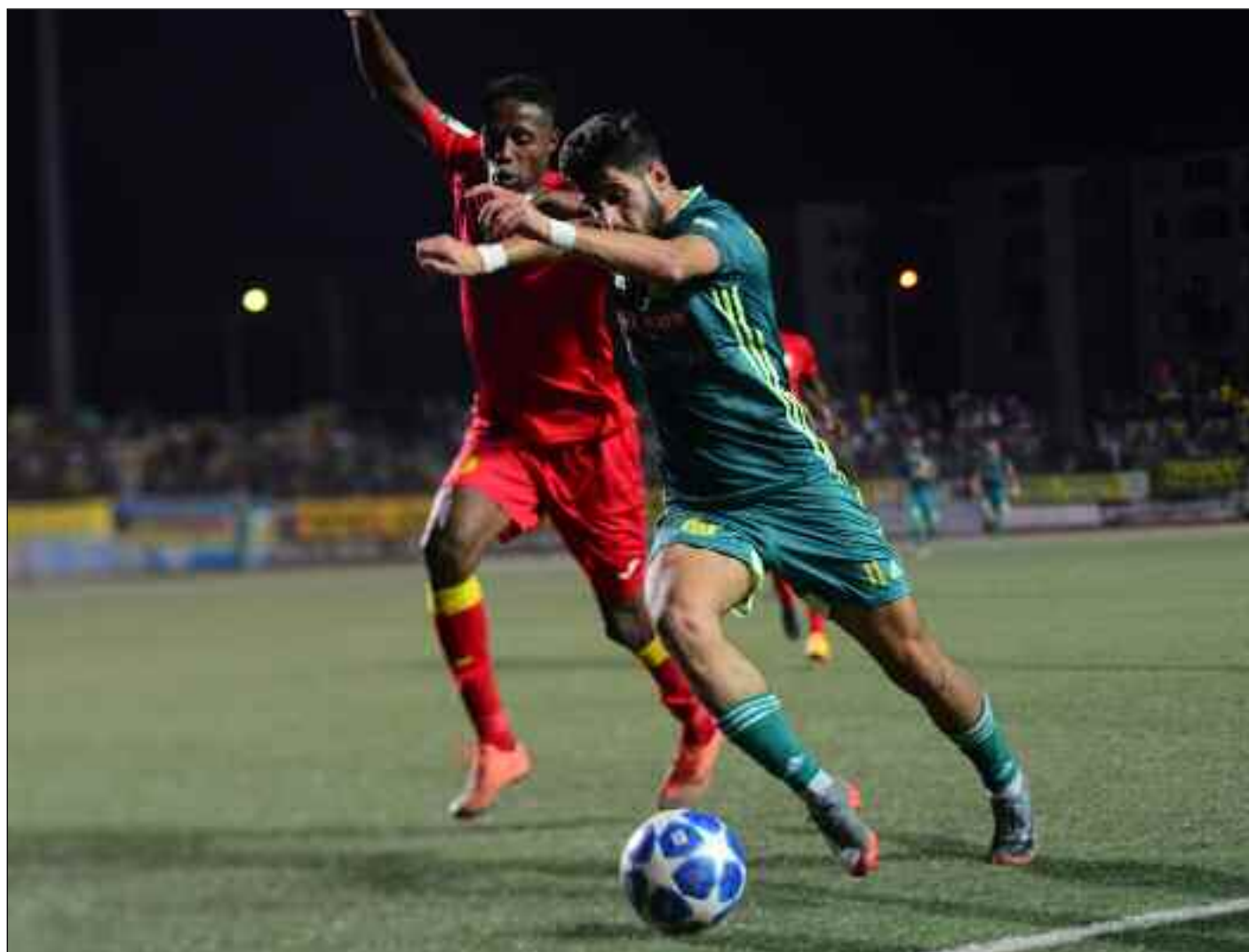
■ La JSK n'a-t-elle pas le droit de jouer la Coupe de la CAF ?