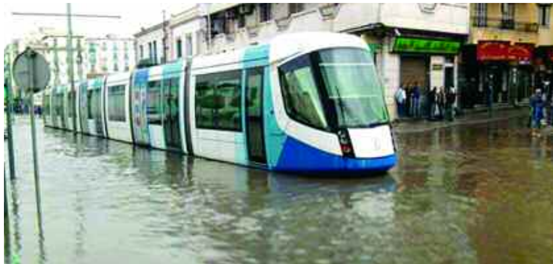
■ A chaque nouvelle précipitation des pluies, le même scénario de désolation voit le jour.

Tébessa, Mila et plusieurs autres régions du pays sont sous les eaux depuis deux jours. Des flux soudains et puissants se sont abattus sur ces villes causant d'importants dégâts matériels. La capitale Alger n'a pas fait l'exception. Les fortes précipitations tombées, au cours des dernières 48 heures, ont inondé plusieurs habitations, commerces et rues dans des quartiers d'Alger et leurs alentours, comme Ruisseau, Oued Romane, Hussein Dey, Bir Mourad Raïs, Bir Khadem, Baraki et Belcourt.