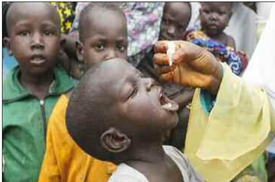
■ Le gouvernement éthiopien a ordonné la destruction de plus de 57.000 flacons de vaccin oral contre la polio de type 2, à la suite d'une épidémie en 2019.

Aussi choquant que cela puisse paraître, cette débâcle des Big Pharma n'est pas nouvelle. Après avoir dé-