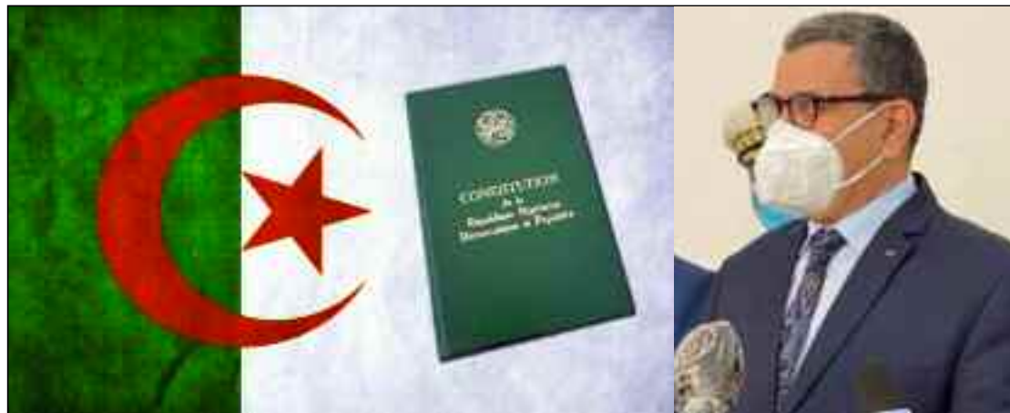
■ La nouvelle Constitution répondra aux aspirations du peuple à construire un État démocratique exempt d'autoritarisme et de tyrannie.

L'amendement constitutionnel «figurerait en tête des promesses électorales faites par le Président Tebboune», a-t-il rappelé. Abdelaziz Djerad a mis en exergue la crédibilité de la démarche du Président Abdelmadjid Tebboune dont les engagements sincères ont commencé à se concrétiser sur