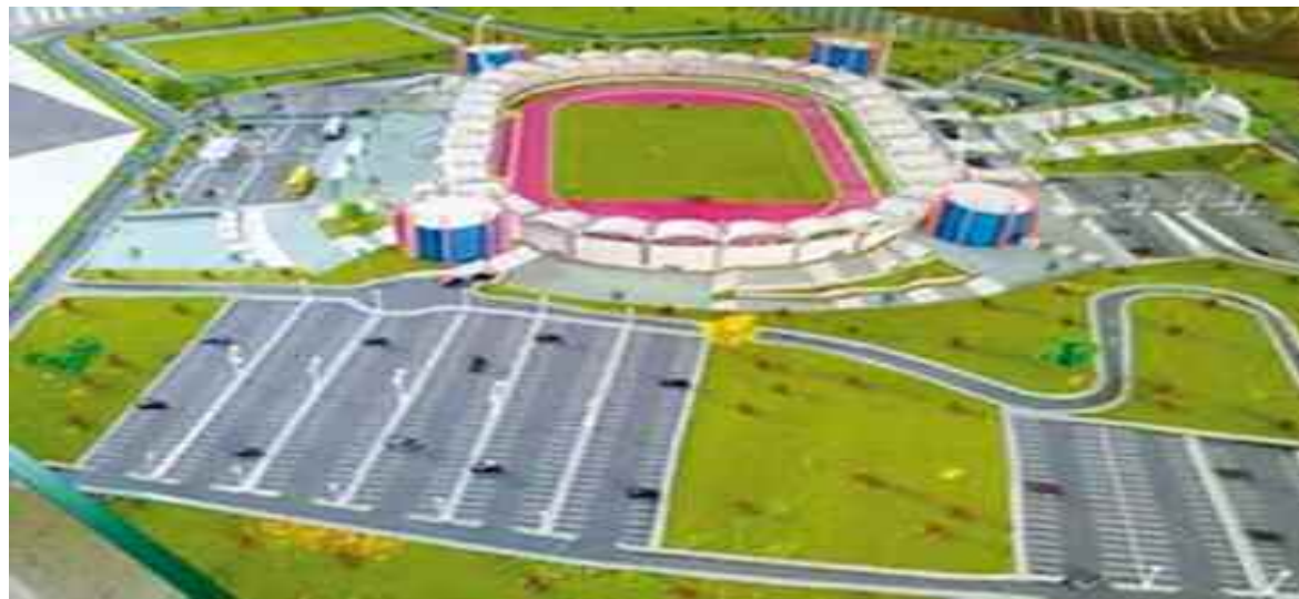
■ Maquette du stade Omnisport de Bordj Ménaïel qui attend toujours de voir le jour.

Bordj Ménaïel ne mérite pas ce qu'il lui arrive car historiquement, le monde sportif sait pertinemment que cette localité est considérée comme le pourvoyeur de grands joueurs, jeunes et doués en foot-