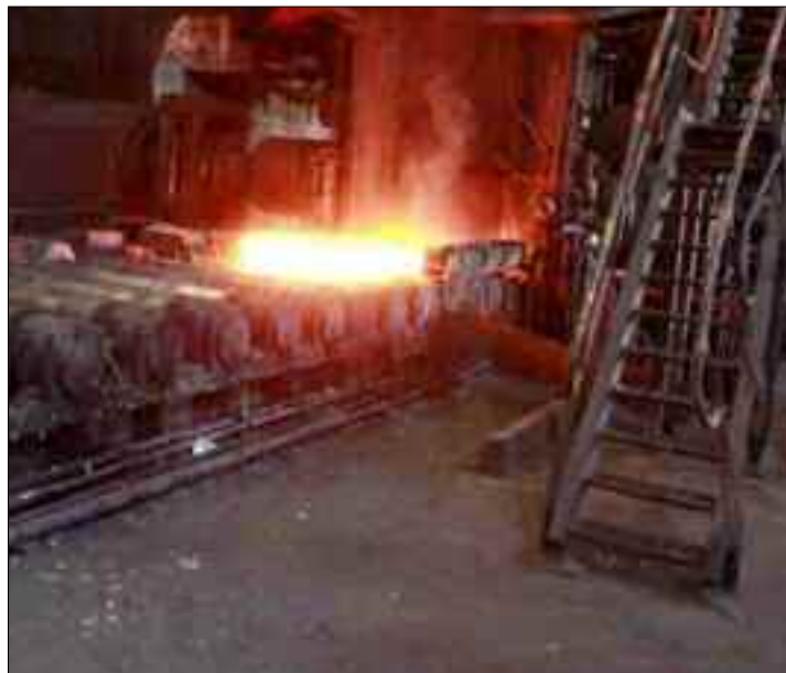
■ Malgré leur bonne volonté, les cadres dirigeants de ces trois institutions économiques ont beaucoup de travail qui les attend.

«Je valorise la maîtrise des nouvelles technologies industrielles et la maintenance observée chez les jeunes cadres des entreprises Cital et Ferrovial et de plusieurs autres filières industrielles du