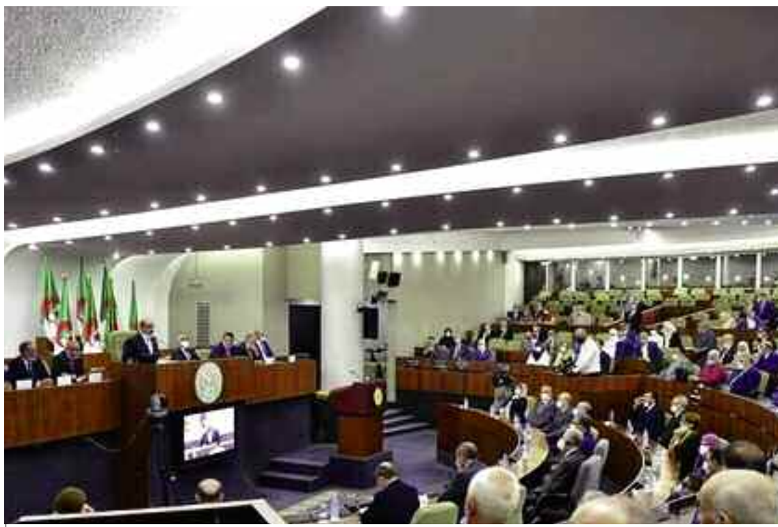
Le projet de révision de la Constitution correspond à l'un des principaux engagements politiques dans le programme électoral du président de la République.

Conformément aux dispositions de la Constitution, article 258, le projet de révision de la Constitution, initié par le Président Abdelmadjid Tebboune et adopté dimanche dernier par le Conseil des ministres, est soumis au vote de l'Assemblée Populaire Nationale (APN) lors de la séance plénière qui a lieu aujourd'hui. Il sera ensuite soumis au vote du Conseil de la Nation, puis au référendum populaire le 1er novembre prochain.