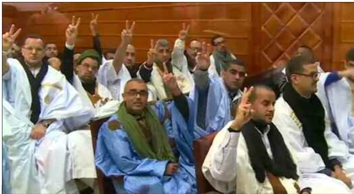
■ L'ancien chef du Comité des Nations unies sur la détention arbitraire, Mads Andeneas, a estimé que la détention du groupe des prisonniers politiques de Gdeim Izik était «arbitraire».

L'Observatoire «Western Sahara Resource Watch» (WSRW) a appelé mardi à la libération «immédiate et inconditionnelle» des prisonniers politiques sahraouis du groupe Gdeim Izik, arrêtés en 2010 pour avoir contesté l'exclusion socioéconomique des sahraouis dans les territoires occupés.