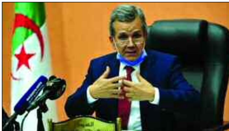
La production des premiers lots de vaccin a débuté, en attendant sa commercialisation prochainement.

La prudence est strictement nécessaire pour soutenir la situation épidémique qui s'est nettement améliorée, ces deux derniers mois. «L'Algérie affiche une relative stabilité du nombre de cas confirmés au Coronavirus durant les trois derniers mois par rap-