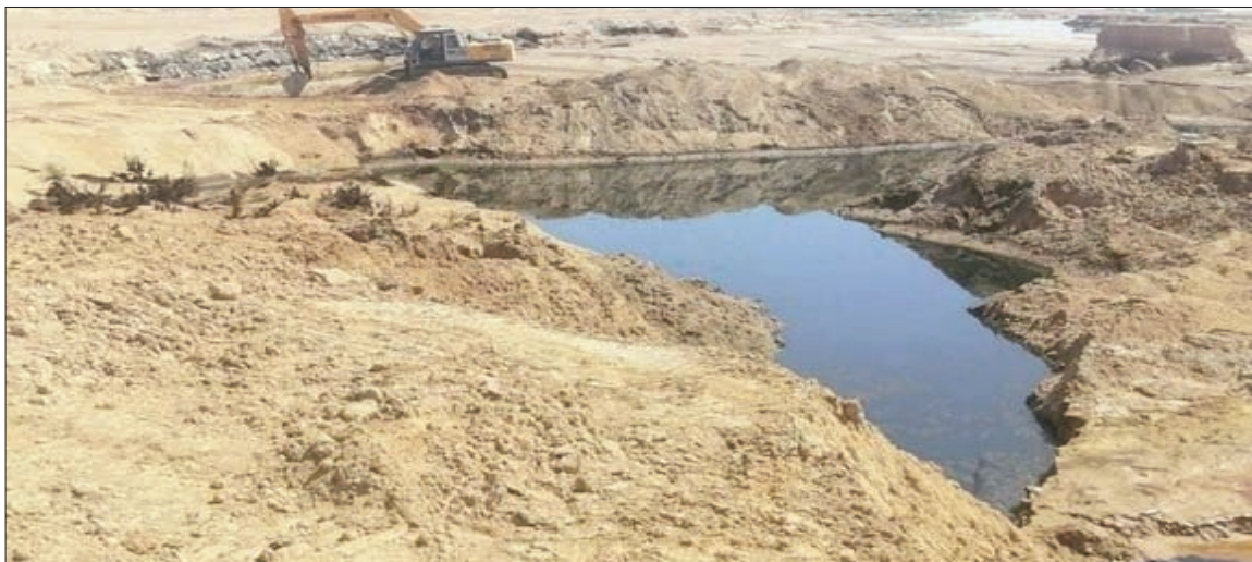
Une délégation de haut niveau du ministère de l'Energie s'est déplacée mercredi au niveau du site de la fuite de pétrole survenue jeudi au niveau de l'oléoduc OK1 à El Oued, a indiqué un communiqué du ministère.

Aucun impact n'a été enregistré sur les eaux sous-terraines à ce jour suite à la fuite au niveau de l'oléoduc OK1 à El-Oued, a assuré mardi à Alger le P-dg de Sonatrach, Tewfik Hakkar. Lors d'un point de presse