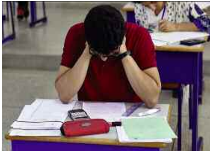
■ L'Etat n'a ménagé aucun effort pour garantir le succès de ces épreuves, et ce, malgré la conjoncture sanitaire particulière.

«Il faut être fiers du métier que vous exercez. Le professeur forme les générations futures et les bons professeurs contribuent à l'édification d'une société éclairée», a-t-il indiqué, mettant en lumière le rôle et la bienveillance des enseignants dans l'accompagnement des élèves durant tout leur processus scolaire. La responsabilité de la réussite de l'examen du BAC est partagée entre les éducateurs, les parents et l'Etat qui n'a ménagé aucun effort pour garantir le succès de ces épreuves, et ce, malgré la conjoncture sanitaire particulière. Il a rappelé, lors de l'ouverture des plis contenant les copies de l'épreuve de langue arabe au centre d'examen du CEM Chaïb Larbi du chef-lieu d'Annaba, l'importance du «strict respect» des mesures de prévention, de sécurité et régle-