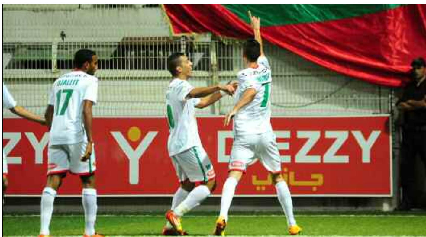
■ Le football national a besoin d'une meilleure organisation.

Une pause est-elle enfin possible pour relire l'histoire, comprendre ce football qui traverse des zones de turbulences souvent violentes ? Rêver d'un championnat sans encombre, débarrassé de ces zones de turbulences, est-ce possible ? De même au monde sportif de vivre une saison dont son sponsor serait la sportivité ? Cela est-il possible ? Lui faire réussir à tirer profit d'une gestion positive qui ferait date dans les annales du football ? Le football, ce sont ces cartes aux valeurs intrinsèques que détiennent les fans d'un club de foot, et qui ressemblent à une institution, au regard du rôle qu'ils jouent. Mais devant la financiarisation du foot, de sa professionnalisation qui traîne, sa mondialisation et l'explosion de sa couverture médiatique, des clubs essayent d'imposer une «image de marque» parfois en désaccord avec son identité passée. Les dernières pages de la saison qui n'ont pas pu y aller jusqu'à son terme est déjà un mauvais investissement pour les annonceurs qui avaient voulu en profiter et tirer profit de ce championnat. La pandémie en a décidé autrement. De plus, un travail de communica-