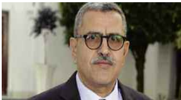
■ M. Djerad : «L'année 2021 devrait être plus prospère en termes de production et de chiffres d'affaires à enregistrer».

Encore une fois, comme lors des sorties similaires destinées à jauger sur le site même des capacités de relance de la production sidérurgique, il y avait beaucoup de monde hier dimanche 13 septembre 2020 à proximité des principales unités de production au complexe sidérurgique El Hadjar. Le rendez-vous était important. Il l'était de par la présence du numéro 2 de l'Etat.