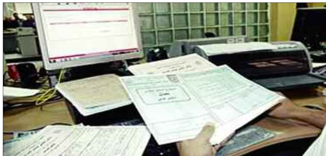
■ Dès hier dimanche, les jeunes et les commerçants ont pu proposer et commercialiser 169 services.

Intervenant sur les ondes de la Chaîne I de la radio algérienne dont il était l'invité de l'émission «La matinale», le ministre du Commerce a affirmé que l'objectif de cette opération est de faciliter la pratique de l'activité commerciale aux jeunes et de satisfaire les besoins des populations dans les zones enclavées et reculées, voire difficiles d'approvisionnement, en leur offrant, a indiqué le représentant du Gouvernement, différents services proposés par le commerçant ambulante. «C'est une mesure qui vise à donner une nouvelle dynamique à l'activité commerciale et à couvrir toutes les