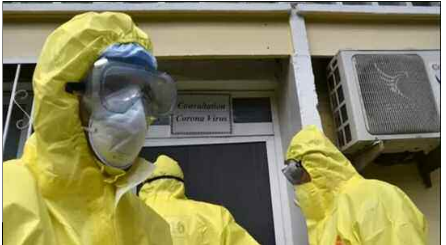
■ L'ONU approuve à l'unanimité une résolution appelant à la coopération en réponse au Covid-19.

«La résolution identifie la coopération internationale, le multilatéralisme et la solidarité comme étant le seul moyen pour le monde de répondre efficacement aux crises mondiales telles que la Covid-19», a déclaré M. Wang, ajoutant qu'elle exhorte les pays membres à promouvoir l'inclusion et l'union, à prendre des mesures fortes contre le racisme, la xénophobie, les discours de haine, la violence et la discrimination, et à s'abstenir de promulguer et d'appliquer toutes mesures économiques, financières et commerciales unilatérales non conformes au droit international et à la Charte des