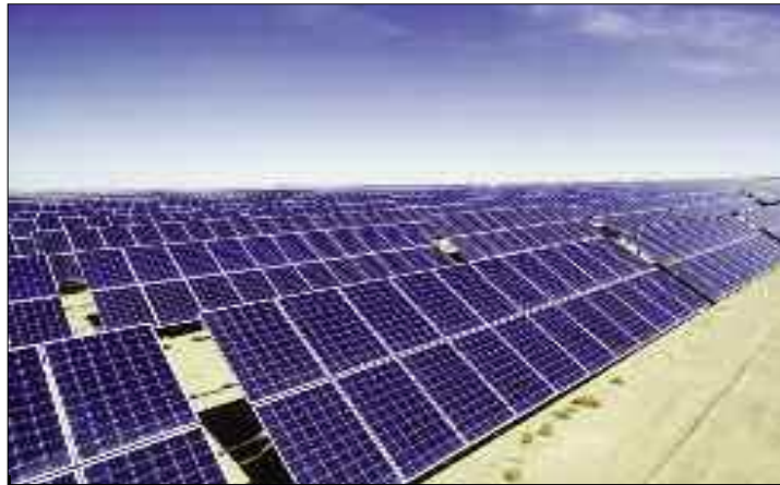
L'abandon définitif du projet Desertec reste un mystère.

L'abandon définitif du méga projet Desertec qualifié de «daté et de dépassé» par le ministre de l'Énergie, Abdelmadjid Attar, traduit-il les intentions latentes des autorités de recourir à l'exploitation du gaz de schiste au détriment du renouvelable ? Ou tout simplement, l'existence d'un projet alternatif plus vaste visant à promouvoir et développer le développement des énergies renouvelables dans le pays.