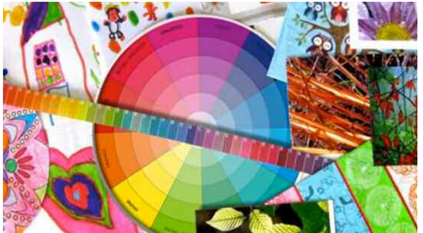
Enseigner les arts aux plus petits, c'est chose facile. Il suffit d'avoir de la patience et une méthode pédagogique.

Ça l'est vraiment et d'autant plus qu'il s'agit de petits apprenants qui entrent pour la première fois à l'école. Pour enseigner l'harmonie des sons, il faut exercer les organes phonatoires par la récitation collective puis individuelle. Rappelons tout d'abord que nous avons affaire à des petits de la classe préparatoire qui aiment aussi chanter des chansonnettes dont l'air suit la cadence ; faisons en sorte que les enfants chantent le plus souvent non pas seulement que le chant est créateur de gaieté mais aussi il éduque. La chanson comme la récitation exécutée avec tonalité et cadence, crée un climat de joie si nécessaire pour l'épanouissement des enfants. Et ce qui les épanouit, c'est surtout les rondes qui suivent le rythme de la chanson. L'important