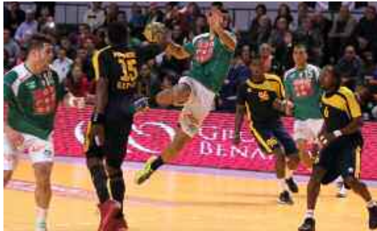
Les Verts préparent le Mondial-2021 qui se déroulera en Egypte.

Le sélectionneur français des «Verts», Alain Portes, a fait appel à 19 joueurs dont sept représentants du GS Pétrolier pour ce stage qui marque le début de la préparation des handballeurs algé-