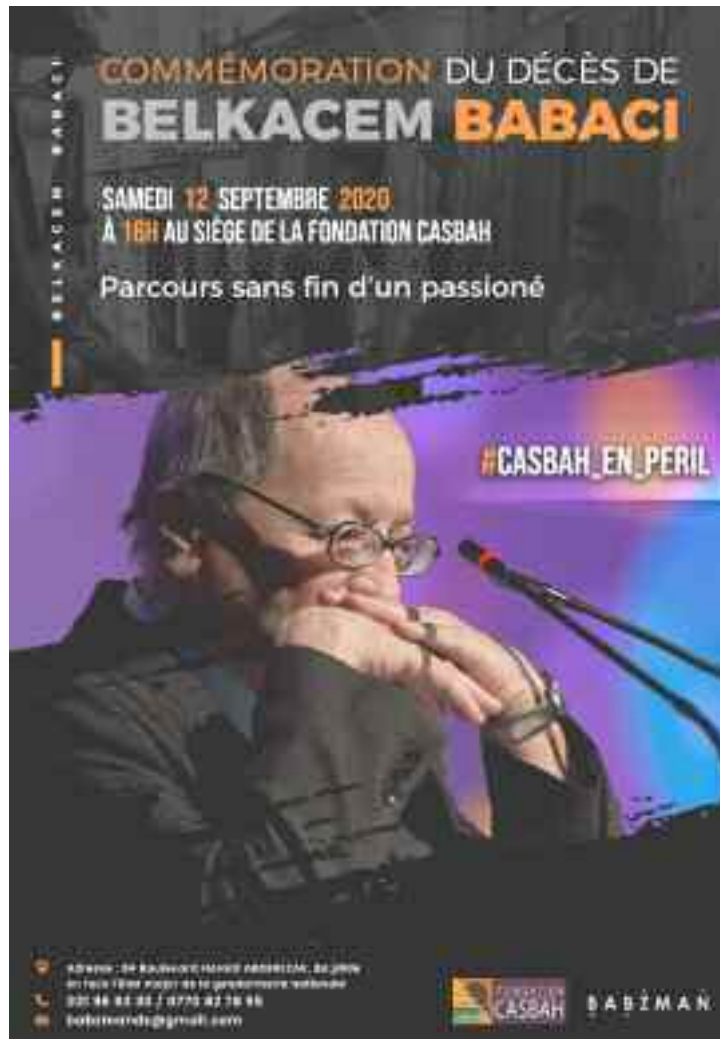
Le 12 septembre 2020, a eu lieu au siège de la fondation Casbah, une commémoration en l'honneur de Belkacem Babaci.

cœur des Algérois. Le maître du récit mettra à profit cette notoriété et des centaines de sorties médiatiques, pour sensibiliser les collectivités et la population sur l'importance du patrimoine et de l'histoire mais, surtout, sur l'urgence de la protection, la sauvegarde et la réhabilitation de La Casbah d'Alger ainsi que la récupération du patrimoine dérobé par la colonisation. En 2009, il devient président de la fondation Casbah, où il mène un combat de sauvetage et d'urgence. Malgré quelques tentatives des autorités locales, rien n'a été sérieusement entrepris afin de protéger cette richesse, reconnue pourtant patrimoine mondial par l'Unesco.