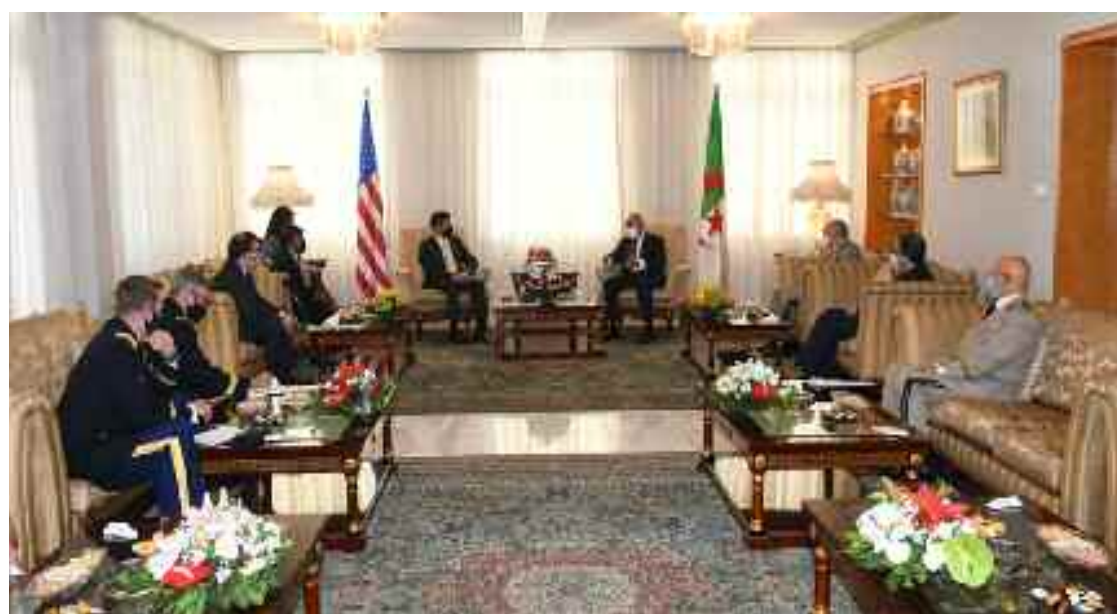
■ Chanegriha : «Grâce à l'ANP, l'Algérie a pu vaincre, à terme, par un combat acharné et sans répit, le terrorisme auquel elle a dû faire face depuis les années 90».

Le communiqué de la Présidence de la République qui donne l'information précise que les entretiens ont porté sur «les relations bilatérales et les perspectives de leur développement dans divers domaines». Après avoir passé en revue les derniers développements survenus en Libye et dans la région du Sahel, les deux parties ont convenu de poursuivre «la concertation et la coordination pour consolider les fondements de la paix et de la sécurité dans la région, dans le cadre du respect de l'unité et de la souveraineté de ces pays». Au terme de ces entretiens fructueux, «le président de la République a offert un déjeuner en l'honneur de son hôte et de la délégation qui l'accompagne. Les deux parties ont échangé des présents symboliques», précise la même source. Le Secrétaire américain à la Défense a fait une déclaration à l'issue de l'audience que lui a accordée le Président Tebboune. «Nous avons évoqué les voies et moyens de renforcer la coopération bilatérale, notamment dans le domaine de la lutte contre le terrorisme et la coopération entre les armées des deux pays», a déclaré M. Esper. D'autres thèmes ont été également abordés comme «le respect de la souveraineté des Etats et les libertés, ainsi que les questions d'intérêt commun», a-t-il affirmé, cité par l'APS. «J'ai également eu l'honneur d'aller au sanctuaire des