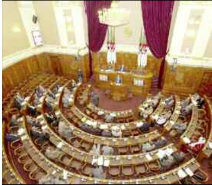
«La peine est la réclusion criminelle à perpétuité si la rixe, la rébellion ou la réunion a entraîné la mort d'une personne autre que les membres de la bande».

Le vote, sans débat, s'est déroulé lors d'une plénière présidée par le président par intérim du Conseil de la Nation, Salah Goudjil, en présence du ministre de la Justice, Garde des sceaux, Belkacem Zeghmati et de la ministre des Relations avec le Parlement, Besma Azouar. Présentant les dispositions du texte, le ministre de la Justice a souligné que l'objectif est de mettre en place un cadre législatif de prévention contre ce phénomène qui a créé un climat d'insécurité dans les cités. Cette nouvelle forme de criminalité «a connu un pullulement, particulièrement dans les grandes villes, la législation nationale en vigueur ne couvrant pas toutes les formes de cette criminalité». Le texte du projet propose «l'application de peines à l'encontre des éléments de ces bandes allant de 2 à 20 ans, pouvant même atteindre la perpétuité en cas de décès». Selon le projet de loi, est considéré comme une «bande de quartiers, tout groupe, sous quelque dénomination que ce