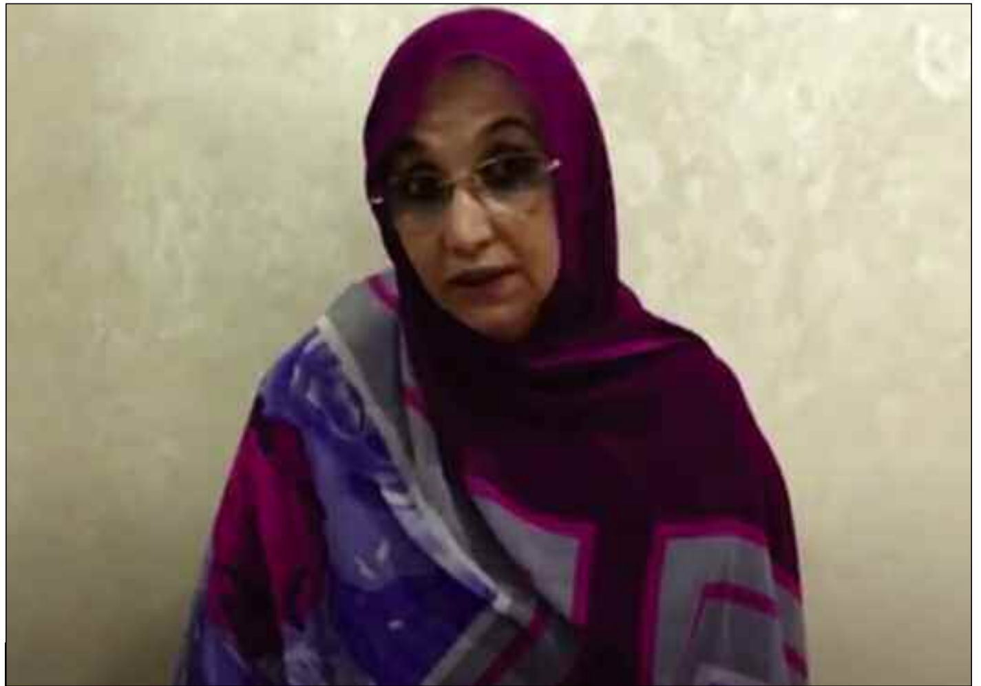
■ La militante sahraouie Aminatou Haider appelle, devant le Conseil des droits de l'Homme à Genève, à la libération des prisonniers politiques sahraouis.

«J'appelle les Nations unies à protéger tous les Sahraouis, pas seulement les défenseurs des droits de l'Homme, et à dépêcher en urgence des commissions pour visiter ce territoire qui est resté à la merci d'une puissance occupante brutale et aussi exiger du Maroc la libération des prisonniers politiques sahraouis», a déclaré la militante sahraouie devant le Conseil des droits de l'homme de Genève, demandant à l'organisation d'assumer sa responsabilité quant à la décolonisation du Sahara occidental. Ayant déjà été victime de «disparition forcée, de torture, détention arbitraire», Aminatou Haider a affirmé qu'«elle fait toujours objet de harcèlement et de diffamation systématique à cause de ses activités pacifiques et sa coopération avec l'ONU», rappelant que cette réalité a été souligné dans le rapport du secrétaire général des droits de l'Homme. «Et mon cas n'est pas unique dans les territoires occupés à cause du manque de protection onusienne», a-t-elle noté. «Les défenseurs sahraouis, journalistes, et toute personne revendiquant le respect de ses droits légitimes