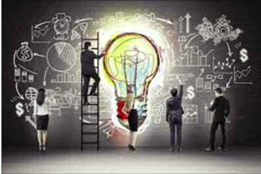
■ L'Etat compte tirer profit de la situation actuelle afin d'encourager la création des micro-entreprises.

Il sera procédé lors de cette rencontre au lancement officiel du fonds des start-ups et l'annonce d'une panoplie de mesures réglementaires devant encadrer et soutenir l'écosystème des micro-entreprises en quête d'un environnement plus favorable pour s'épanouir. Comme annoncée, cette démarche s'inscrit dans la nouvelle approche économique devant répondre aux besoins croissants du marché numérique indispensable pour s'affranchir du modèle économique ancien et révolu. Apporter un réel soutien financier aux écosystèmes des start-ups à long terme constitue un important pilier pour l'émergence et le succès de n'importe quelle start-up. L'Etat compte tirer profit de la situation actuelle afin d'encourager la création des micro-entreprises en mettant à leur disposition un arsenal réglementaire efficace pour les protéger et un appui financier sans précédent. Dans son communiqué, le ministre délégué auprès du Premier ministre, chargé de l'Economie de la connaissance et des start-ups, a évoqué les grandes axes principaux qui seront évalués durant cette rencontre dédiée exclusivement au développement des start-ups en Algérie, au cadre réglementaire, aux mécanismes de financement et aux structures d'accompagnement incubateurs/accelérateurs. La création d'un fonds d'amorçage numérique dédié aux start-ups signifierait le versement accéléré des aides à l'innovation qui sera acté par