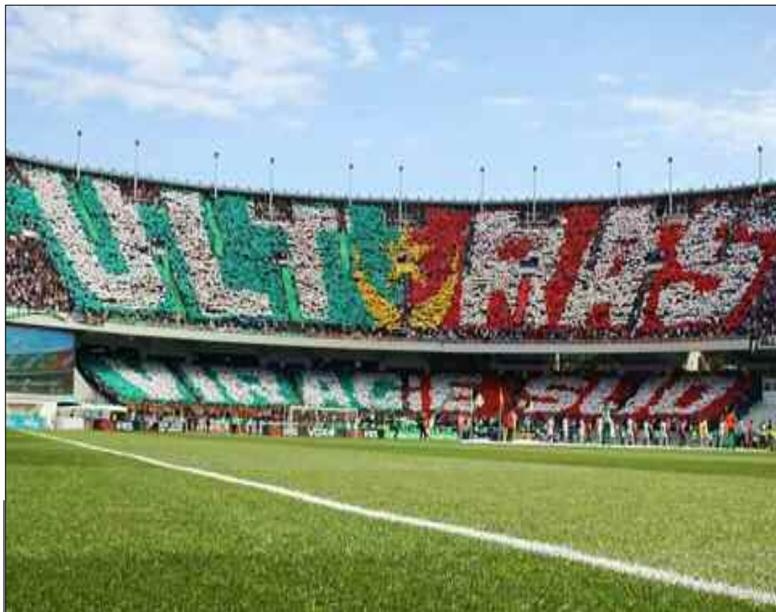
■ Les supporters nous présentent de jolis «portraits».

« Votre club vous échappe » On est clairement en train de leur dire «votre club vous échappe totalement, c'est un objet commercial hors-sol dont vous n'êtes que des clients». On nie la dimension locale d'un club «ancré dans son histoire, dans sa culture, dans le quotidien de ses supporters, ancré dans la vie familiale de génération en génération». Leur place est légitime, «on a besoin du supporter, que ce soit avant, pendant et après la rencontre. Il