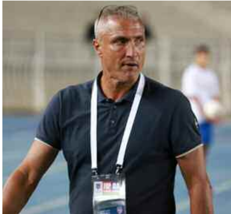
■ Casoni sait ce qui l'attend.

→ Le nouvel entraîneur du MC Oran, Bernard Casoni, a estimé que ses joueurs sont appelés à faire des efforts supplémentaires pour rattraper le retard accusé en matière de préparation en prévision du coup d'envoi du championnat de Ligue 1 de football prévu pour le 20 novembre prochain.