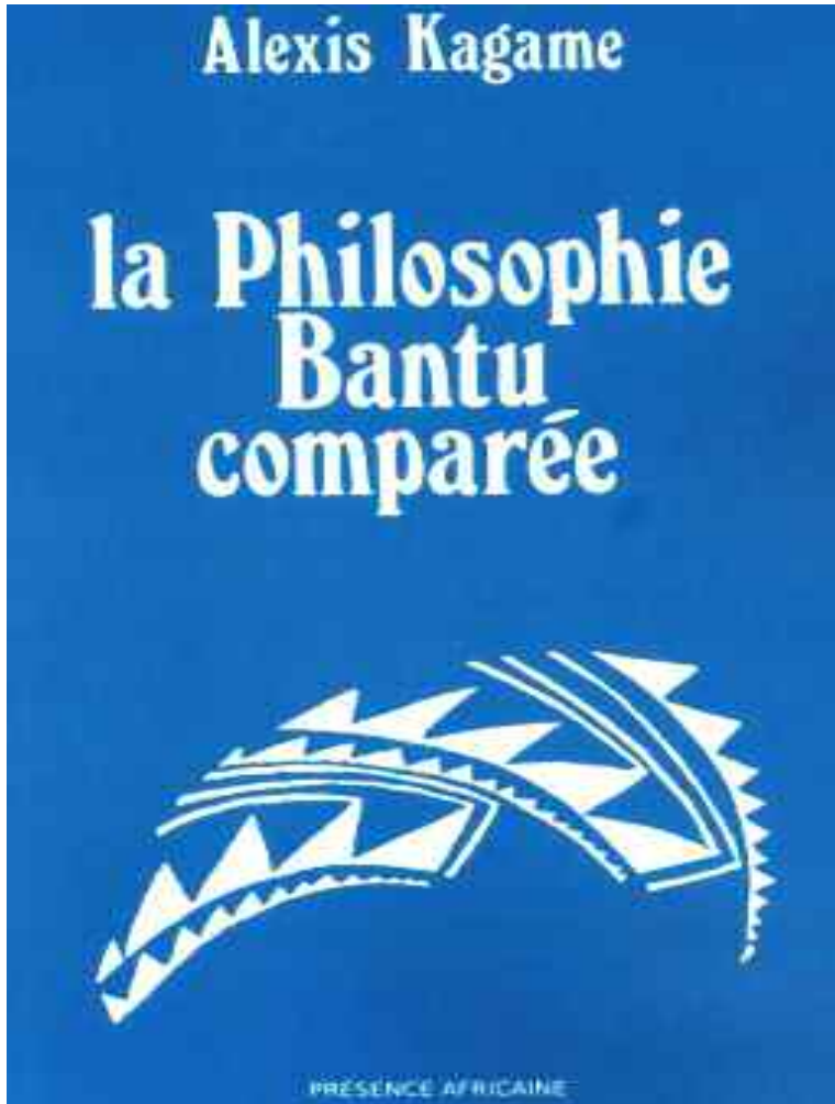
Selon Tempels - dont les travaux sont décriés par Aimé Césaire - la philosophie bantoue s'inspire de la hiérarchie sociale représentée aussi dans la littérature populaire.

Cette sommité de la culture négro-africaine considère cette philosophie comme une tentative de diversion. Elle détourne des problèmes politiques et éloigne de la réalité. Pour Césaire, Tempels se fait le gardien de l'ordre colonial. Dans Discours sur le colonialisme, il dit : «Ces Bantous sont de fiers esprits. Ce qu'ils désirent avant tout et par-dessus tout, ce n'est pas l'amélioration de leur situation économique pour matérielle, mais bien la reconnaissance par le Blanc et