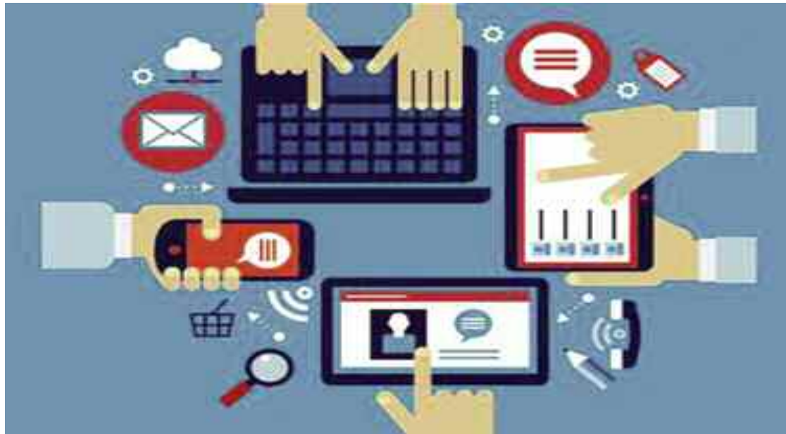
Le Président Tebboune a insisté sur l'impératif de la mise en place d'incubateurs et d'accélérateurs à la hauteur des recommandations et exigences des starts-ups.

pour accompagner le pays dans sa stratégie de sortie de crise. «Ce Fonds contribuera au développement progressif de ces en-