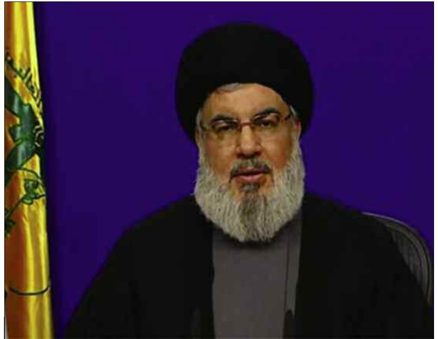
■ Hassan Nasrallah, secrétaire général de l'organisation chiite Hezbollah libanaise, depuis 1982.

Les Libanais n'oublieront jamais le rôle du Koweït et de son émir dans la fin de la guerre civile au Liban, ni leur position à l'égard de l'agression israélienne contre le Liban en 2006 et leur contribution à la reconstruction du Liban, ni leur position ferme face aux pressions sur les pays du Golfe pour normaliser leurs relations avec l'ennemi sio-