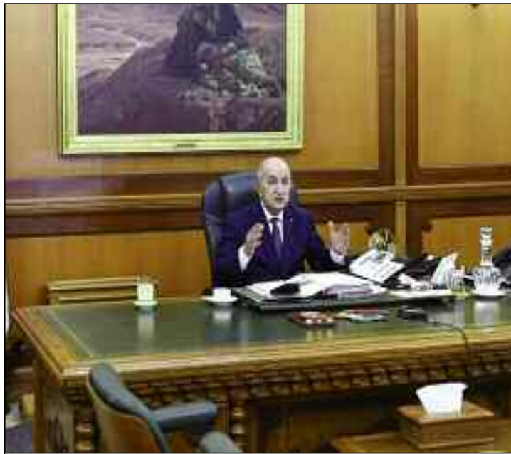
■ M. Tebboune ne prendra pas, seul, la décision d'ouvrir les écoles, au titre de l'année scolaire 2020-2021.

Où en sont les préparatifs de la reprise effective des cours? Cette question a été à l'ordre du jour de la réunion du Conseil des ministres présidée par le Président Abdelmadjid Tebboune, hier, au siège de la présidence de la République, à El Mouradia. On sait que la date de la rentrée scolaire prévue pour hier, dimanche 4 octobre 2020, a été reportée de manière exceptionnelle à une date ultérieure qui sera fixée "sur la base des décisions des autorités publiques concernées par l'autorisation