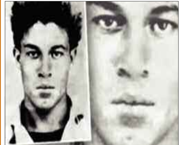
La commune de Miliana (Aïn Defla) a commémoré jeudi le 63 e anniversaire de la mort du chahid Ali Ammar, dit Ali la Pointe, tombé au champ d'honneur le 8 octobre 1957.