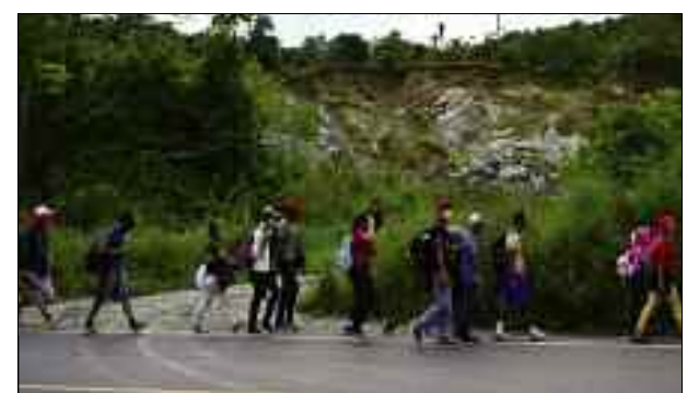
3 millions de migrants bloqués par le Covid-19.