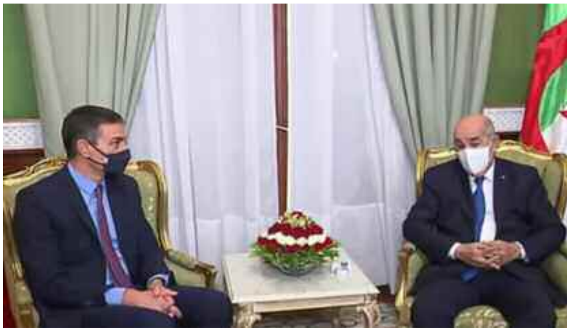
■ Pedro Sanchez : «La coopération peut être établie dans plusieurs domaines, pas seulement dans les domaines de l'énergie et du commerce».

Le chef du Gouvernement espagnol, Pedro Sanchez, estime que le climat d'affaires en Algérie est «très avantageux et encourageant». C'est ce qu'il a affirmé, jeudi, dans une déclaration à la presse au terme de l'audience que lui a accordée le Président Abdelmadjid Tebboune. Un communiqué de la Présidence de la République a fait savoir que la rencontre a été «l'occasion de mettre en avant la richesse des relations d'amitié et de coopération entre l'Algérie et le Royaume d'Espagne dans divers domaines».