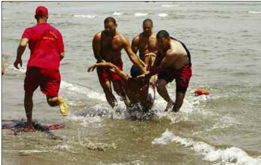
■ Chaque année des campagnes de sensibilisation en faveur des citoyens à travers tout le territoire national sur les risques de noyade sont organisées.

Pour la sécurisation des plages autorisées à la baignade, au nombre de 384 plages, a-t-il poursuivi, pas moins de 13.000 agents et officiers ont été mobilisés au niveau de 14 wilayas côtières, outre la mise en place de tous les équipements nécessaires à la protection des estivants conformément au système d'ac-