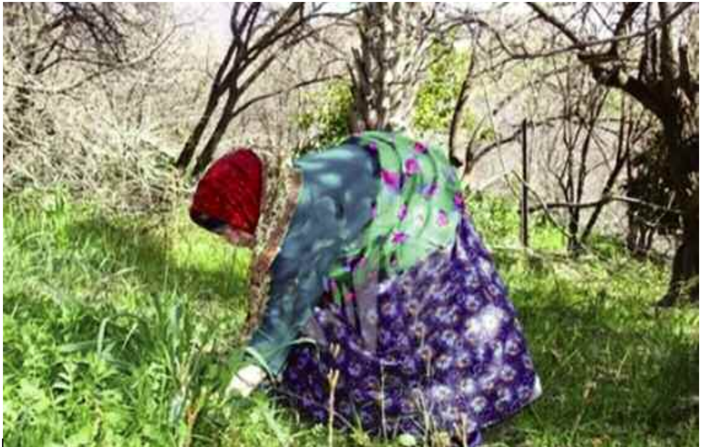
Ministre de la Solidarité : «La femme algérienne se dresse aujourd'hui au côté de l'homme pour construire la nouvelle Algérie».

Dans son allocution prononcée à la salle des conférences Miloud Tahri en présence de représentants de la société civile et des autorités locales, la ministre a indiqué que «la promotion de la créativité de la femme selon des critères internationaux permettra de faire connaître ses compétences économiques à dimension internationale», affirmant que c'est la finalité visée par la conférence à dimension internationale qui sera organisée le 15 octobre courant à Alger à l'occasion de la Journée mondiale de la femme rurale en coordination avec le PNUD. La conférence, a relevé la ministre, «s'inscrit dans le cadre des mesures d'encouragement des initiatives économiques en application des recommandations du président de la République Abdelmadjid Tebboune dans le Plan de relance économique et sociale ayant donné lieu dernièrement au lancement du Fonds spécial de financement des startups comme premier pas d'encouragement de la créativité chez les jeunes». Outre sa grande confiance quant à la volonté et la créativité des jeunes algériens et de la femme algérienne pour «opérer le changement qui soutient l'édification de l'Algérie nouvelle». «La préservation des acquis sociaux et leur conso-