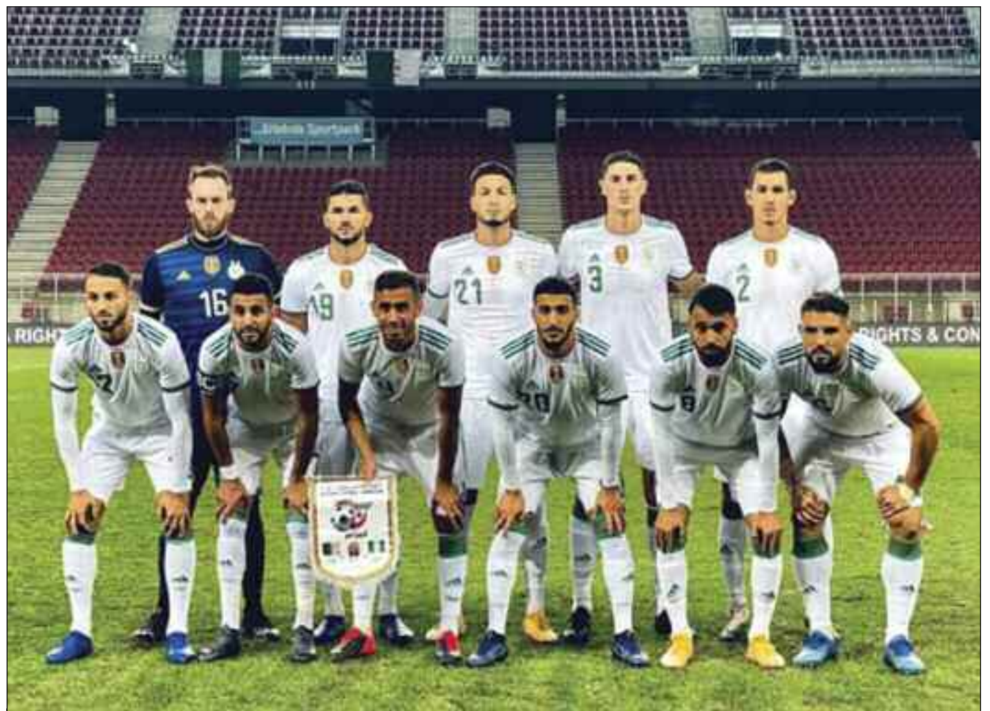
■ Les Verts ne baissent pas les bras.

Le Sénégal s'en souviendra de ce score lourd infligé par les lions de l'Atlas/ (3-1). La différence sur le terrain était palpable, les Lions rugissaient plus fort jusqu'à dominer la partie et à lui faire confir-