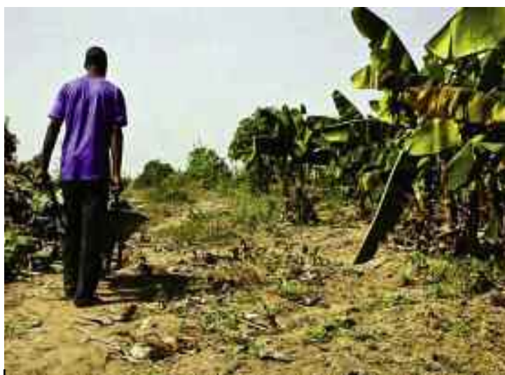
■ La campagne d'olivaison s'annonce prometteuse à Relizane

Les dernières averses enregistrées dans la région ont suscité beaucoup de joie parmi les paysans qui appréhendaient, depuis des semaines, le prolongement de la sécheresse menaçant les filières agricoles. En effet, dans la localité de Mendès, c'est la satisfaction totale parmi les agriculteurs et autres propriétaires de vergers, lesquels ont balayé d'un revers de la main l'angoisse cumulée depuis surtout la saison estivale passée durant laquelle les récoltes ont été mises à mal par une canicule et une sécheresse menaçantes. Pour leur part, les propriétaires d'oliveraies au niveau de cette localité rurale ont poussé un grand ouf de soulagement, après les cumuls de pluie très satisfaisants, lesquels ont revivifié des centaines d'oliviers, qui périllicitaient à cause de la sécheresse et du manque d'eau. «Vous ne pouvez pas imaginer ma joie lorsque des trombes d'eau sont tombées ces derniers jours. Et pour cause. Mes oliviers, qui avaient un aspect inquiétant dû à la canicule ayant sévi le long de l'été passé,