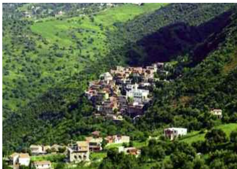
Opération de prise en charge de 134 zones d'ombre dans la wilaya de Guelma.