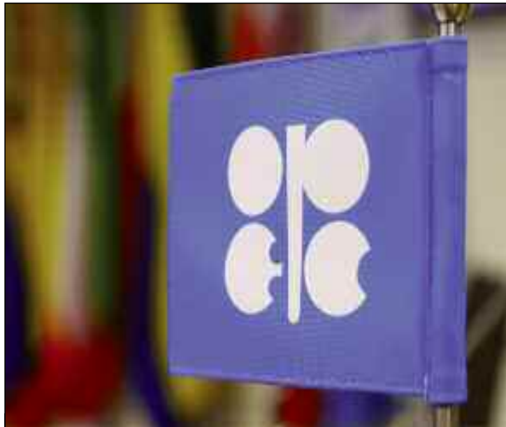
■ L'Algérie a été contrainte au début de la crise de céder son pétrole brut à moins 14 dollars.

Ces derniers encouragent l'exploitation décomplexée du gaz de schiste et tentent d'imposer cette alternative aux autres pays producteurs du pétrole, comme l'Algérie qui n'a d'ailleurs pas exclu le recours à cette option pour subvenir à ses besoins énergétique afin de se libérer de la contrainte pétrolière. Ce qui expliquerait, l'augmentation d'au moins 50% du volume de la production du schiste d'ici dix ans, selon une analyse de l'Agence internationale de l'Energie (AIE), ce qui signifierait conséquemment, la fin prochaine du pétrole, notamment, dans «les pays industrialisés où la consommation diminuera de 1,1 million de barils par jour au cours de ces cinq prochaines années»,