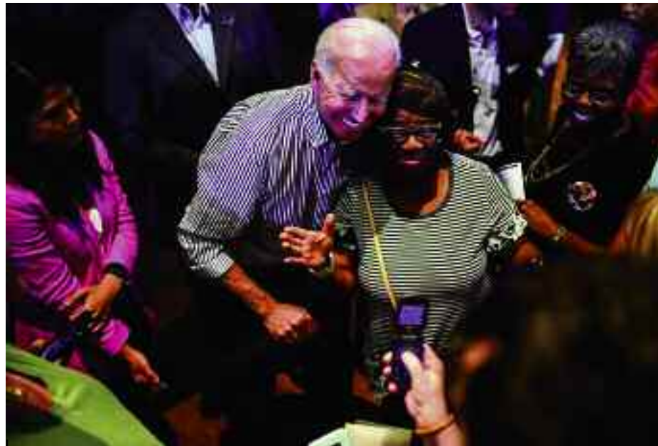
Le débat de la présidentielle du 15 octobre entre Joe Biden et Donald Trump annulé.

Selon les révélations de Newsweek, publiées dernièrement, le secrétaire à la Défense, Mark Esper, avait signé le 1er février des directives secrètes ordonnant au US Northern Command (Northcom) de se préparer à se déployer à l'appui de missions extraordinaires potentielles que pourrait provoquer la pandémie en désactivant le pouvoir exécutif, le Congrès et la Cour suprême. Ainsi, le Pentagone a préparé ces plans pour divers scénarios dont celui de l'affection du président Trump par la Covid-19. Les plans du Pentagone comprenaient aussi l'évacuation d'urgence de Washington et le transfert du pouvoir à des fonctionnaires de rang inférieur, réunis par l'armée à des endroits secrets, mis sous quarantaine. Ces plans incluaient la possibilité d'une certaine forme de loi martiale où des commandants militaires se verraient confier des pouvoirs exécutifs à travers les États-Unis. Ces plans d'urgence « Above-Top Secret » portant les noms de code Octagon, Freejack et Zodiac étaient mis en exécution par le Pentagone. Selon Newsweek, l'un des objectifs de ces plans était de transmettre le pouvoir aux militaires et justifier leurs actions extra-constitutionnelles. Le 30 septembre, deux jours avant l'annonce de l'affection du président Trump par le coronavirus, le quotidien Washington Times a rapporté que la méfiance entre Trump et les généraux du Pentagone avait atteint un niveau presque sans précédent, selon des analystes et des initiés militaires, les deux parties se