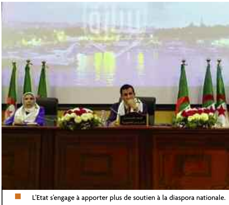
■ L'Etat s'engage à apporter plus de soutien à la diaspora nationale.

La détermination de l'Etat et sa forte volonté d'associer, promouvoir et accompagner la société civile, en tant qu'élément primordial, dans le décollage socioéconomique et la relance du développement est une réalité et non un simple slogan, a précisé M. Berramdane lors d'une rencontre avec des membres de la société civile, tenue à la salle de Conférences de la wilaya de Tipaza. En effet, il est question de réaliser un objectif essentiel, à savoir le passage d'une action associative classique habitée à l'assistantat et l'organisation d'activités inutiles à une action associative professionnelle voire institutionnelle, a-t-il souligné. Dans cette optique, le soutien de l'Etat au profit de la société civile, traduit par l'octroi d'aides financières, ne cessera pas, mais devra se faire, cependant, au titre du sérieux et de l'efficacité dont devront faire montre les associations et organisations au service du citoyen et de la patrie, et non sur la base de la complaisance et du favoritisme, a ajouté le même responsable. Une transition, poursuit-il, qui ne