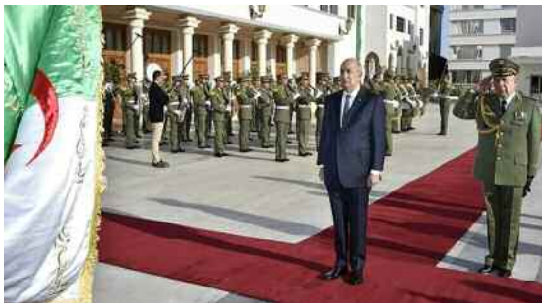
■ Asseoir les bases de l'Algérie nouvelle sous-tendue par deux piliers que sont la souveraineté nationale et une véritable concrétisation de la Justice sociale, conformément aux principes de la Déclaration du 1 er Novembre.

Une nouvelle fois, le Président Abdelmadjid Tebboune a mis l'accent sur la jeunesse qu'il considère comme la pierre angulaire de l'économie du savoir et des start-up, soulignant que ces jeunes «sont en quête d'une telle opportunité pour s'affirmer et laisser éclore les potentialités qu'ils ont démontrées durant la pandémie». Les jeunes bénéficient d'un contexte de libération des initiatives au plan économique à tous les niveaux, a expliqué le Président Tebboune qui s'est engagé à poursuivre la réalisation d'une croissance globale, qui a déjà commencé. Il a également salué «le haut niveau de formation dispensée aux vaillants cadets de la nation dans diverses spécialités».