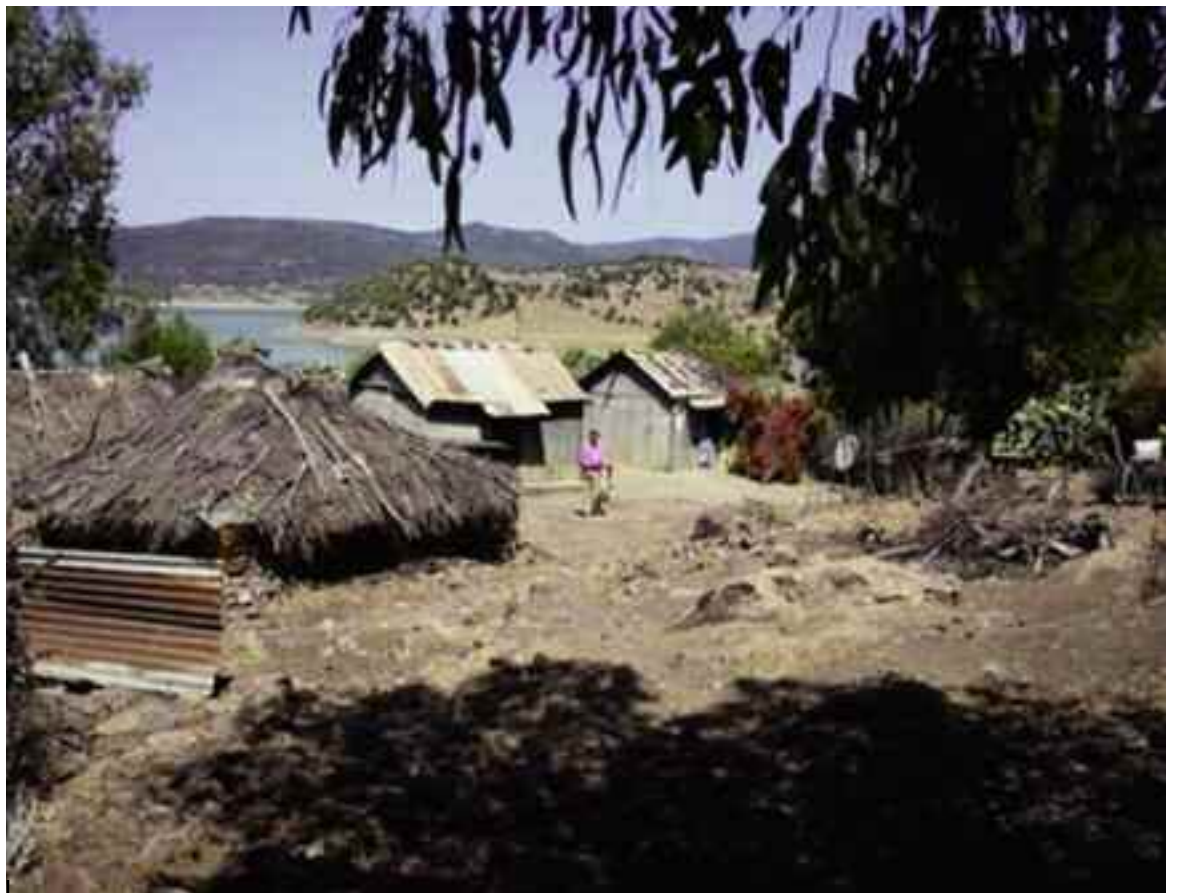
■ Lancement de projets de développement de 185 zones d'ombre à l'échelle de la wilaya d'El Tarf.

Un montant de 184 milliards de dinars sera consacré à la concrétisation de divers projets de développement local au profit de 15.000 zones d'ombres à l'échelle nationale, a-t-il noté lors de sa visite, entre autres, des localités démunies de Oum Hossane, Chouicha, Senhadja et Groun Aicha, relevant des communes de Hamam Beni Salah, Oued Zitoune, Bouhadjar et Ain Kerma. Il a rappelé que le président de la République, M Abdelmadjid Tebboune accorde un intérêt particulier à ces zones d'ombre, en vue de garantir une vie décente aux habitants des zones reculées et déshéritées. M.Merad a, dans ce contexte, mis en