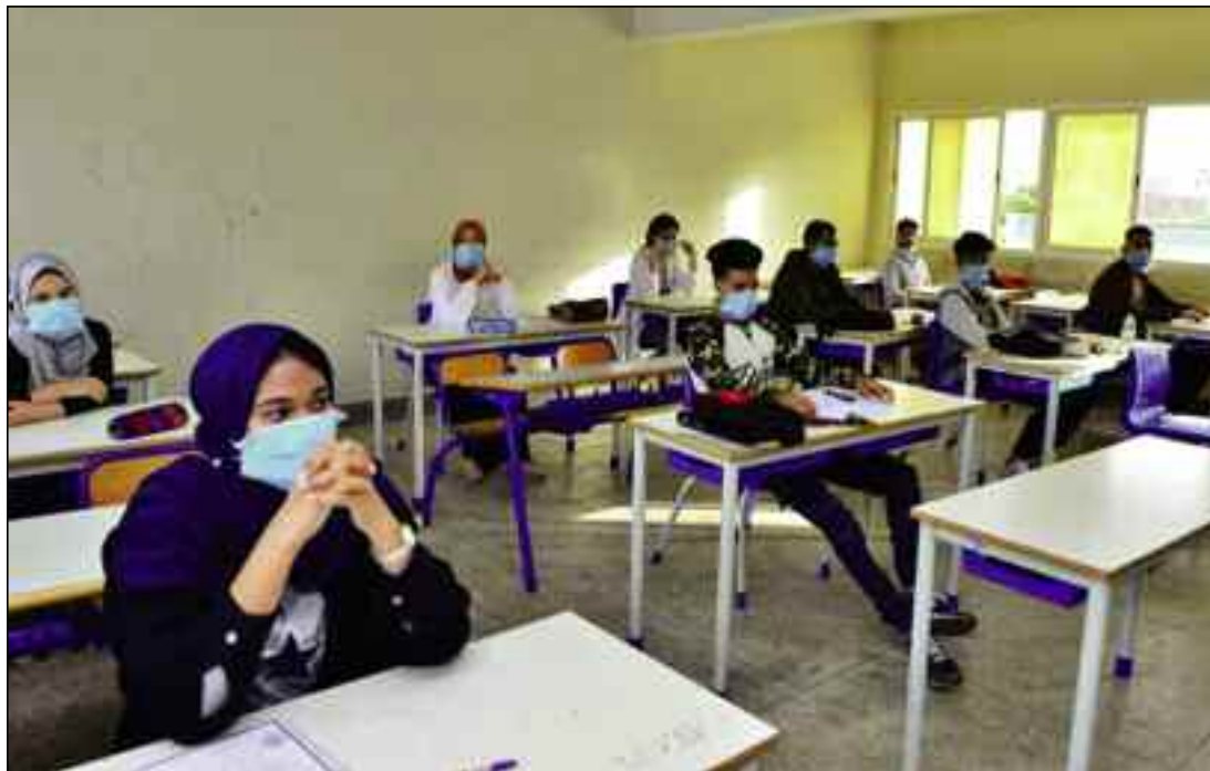
■ Accorder à nos enfants une chance de réussir dans leur parcours scolaire au vu de ce qu'ils ont enduré, plus de 8 mois durant, de pression psychologique sans précédent induite par le confinement à domicile.

Cette décision, a précisé le ministre de l'Education nationale dans une déclaration à la presse au siège de