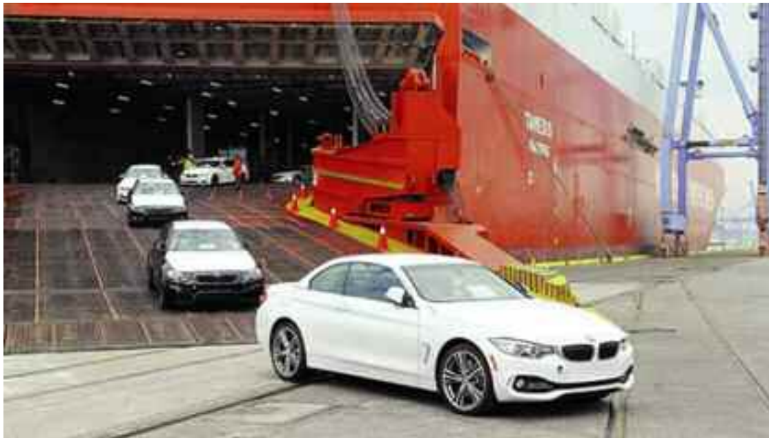
■ «L'importation des véhicules de moins de trois ans n'est pas abandonnée, mais différée à moyen terme».

«L'importation des voitures de moins de trois ans a été gelée», avait annoncé la semaine dernière le ministre de l'Industrie Ferhat Ait Ali Braham, avant de se rétracter ou de se corriger quelques jours plus tard, assurant lors de son intervention à l'antenne de la radio nationale, Chaîne I, que «cette décision n'a pas été abandonnée», arguant qu'il songeait plutôt à la crise financière que traverse le pays actuellement. «L'importation des véhicules de moins de trois ans est juste différée en raison du contexte économique actuel du pays», a-t-il justifié, réitérant, à l'occasion, la volonté de l'Etat de lutter contre le marché informel de la devise et son refus «d'importer de la ferraille».