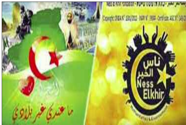
Les praticiens de l'ANS ont tenu à rappeler l'importance du don de sang «un geste noble qui permet de sauver des vies».

D'autres avaient préféré accoster les citoyens pour les sensibiliser sur la nécessité de participer à la collecte de sang. Ils étaient plusieurs dizaines de jeunes filles et garçons à prendre place sur des embarcations pour nettoyer les abords des plages. Un camion de l'Agence Nationale du Sang (ANS) en stationnement à proximité, les accompagnait. A l'aide d'un prospectus aux couleurs et motifs vifs et bien étudiés, ils sensibilisaient les passants. Ils accueillaient au fil de leur arrivée, les donateurs de sang majoritairement des jeunes des deux sexes. Ces derniers étaient, apparemment, en bonne santé et aptes à faire don du précieux liquide au profit des patients nécessitant une transfusion sanguine. Dans le communiqué émis comme dans les contacts entrepris avec les adhérents de la «Fondation Nass El-Kheir» les passants et les estivants, il n'a pas été question d'épidémie du Coronavi-