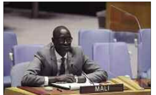
■ Le représentant permanent du Mali auprès des Nations unies, Issa Konfourou.