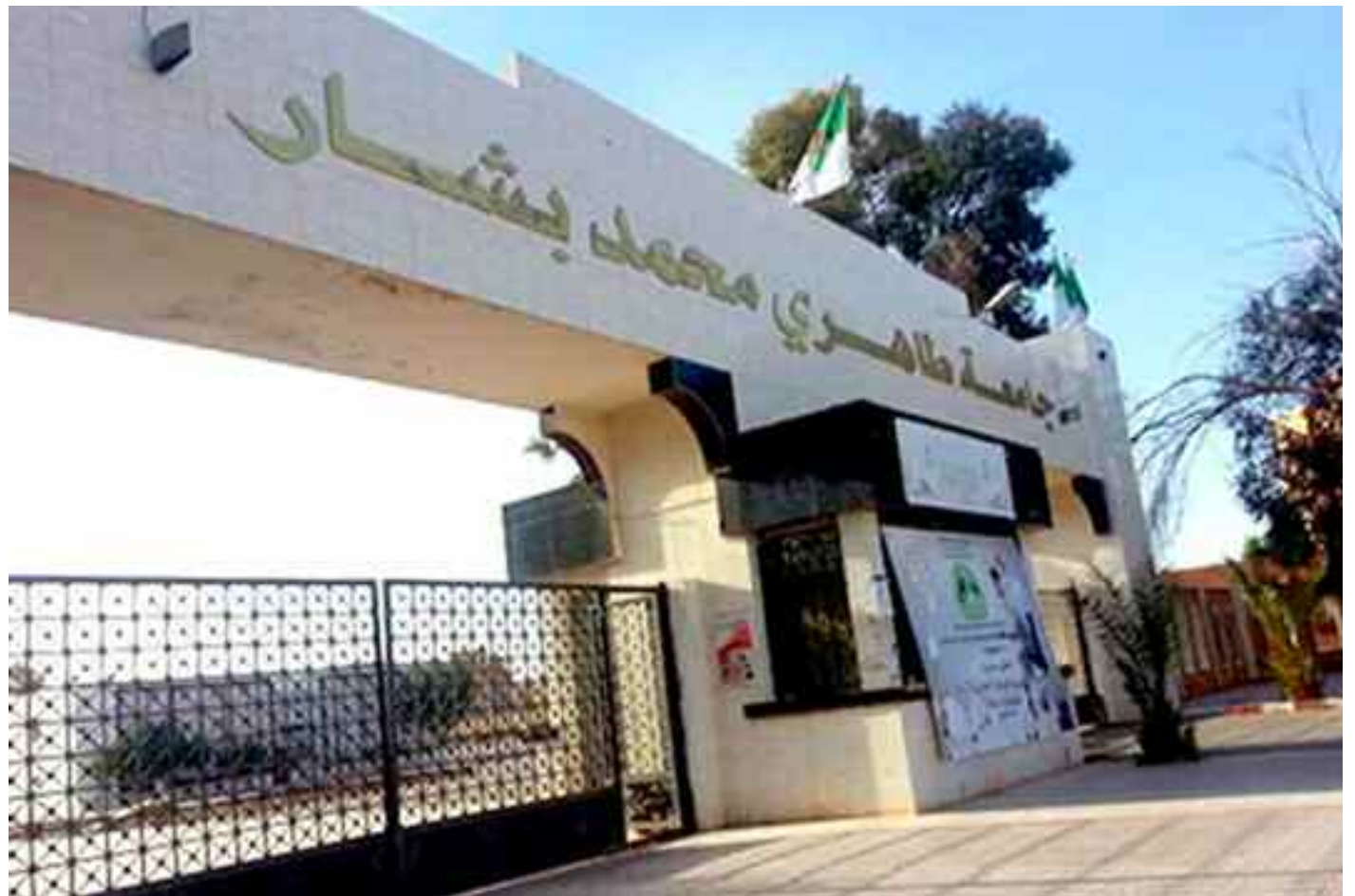
■ L'Université Tahri-Mohamed de Béchar se prépare à la rentrée universitaire dans le respect du protocole sanitaire.