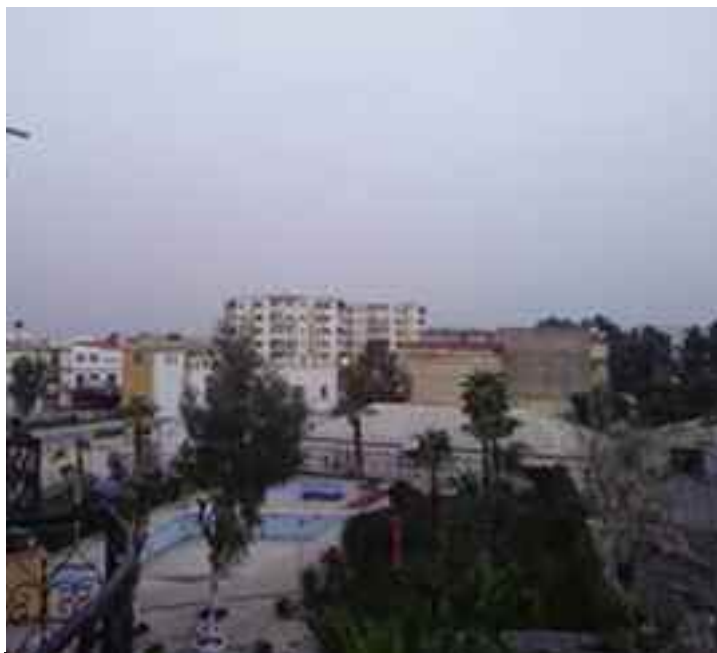
■ Hai El Intissar sinistré par les averses du week-end derniers.

L'éboulement reste en l'état depuis trois années de cela. Le lieu ne représente pas uniquement un danger pour les automobilistes mais également pour toute la population. En effet, le chemin reliant la cité populaire de Hai El Intissar vers le chef-lieu de la commune de Relizane risque d'être coupé à la circulation à tout moment. En cause, un affaissement de terrain non pris en charge et qui date depuis trois années. Après plusieurs mois d'attente, les usagers de cette route, au dense trafic automobile, craignent que l'affaissement n'emporte la petite portion de route encore utilisée par les automobilistes. Les dernières averses du week-end passé en ont grignoté une bonne partie, faisant craindre le pire. La non prise en charge de la voie touchée, voilà maintenant une année, avait provoqué la colère de citoyens qui avaient fermé la mairie cela ça fait deux ans et celle mitoyen du stade Zouggar Tahar. Plu-