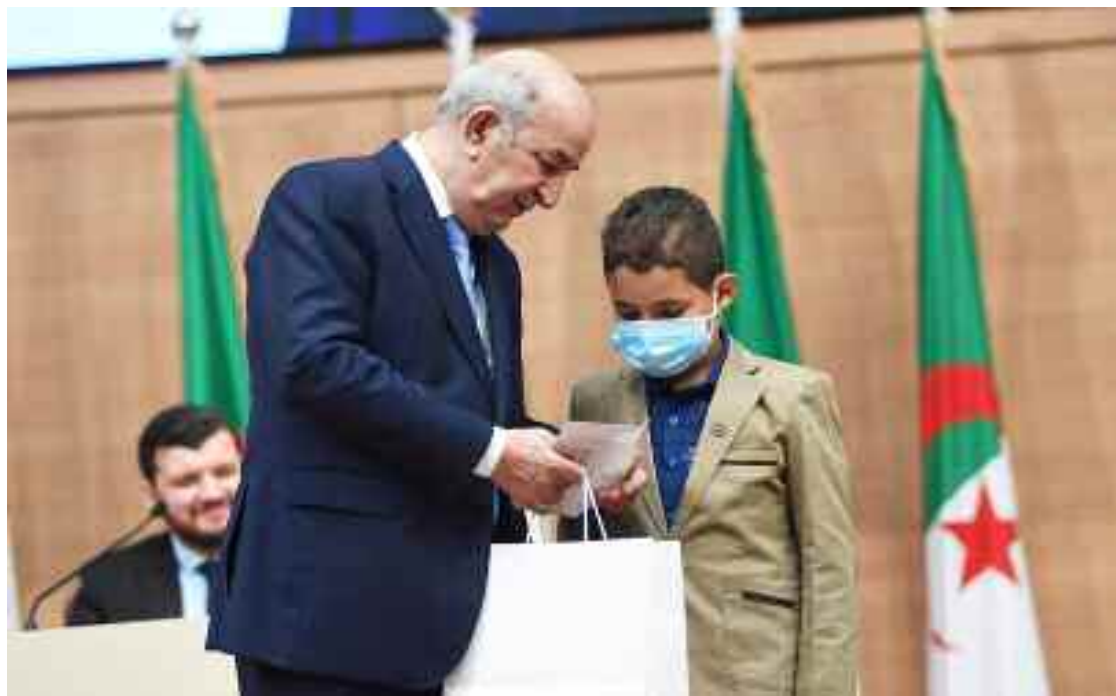
■ Tebboune : «Il suffit à toute personne souhaitant créer une start-up de le déclarer seulement... une fois la production lancée, elle devra obtenir le registre de commerce».

président de la République. Il a également rappelé les incitations fiscales introduites au titre de la loi de Finances complémentaire