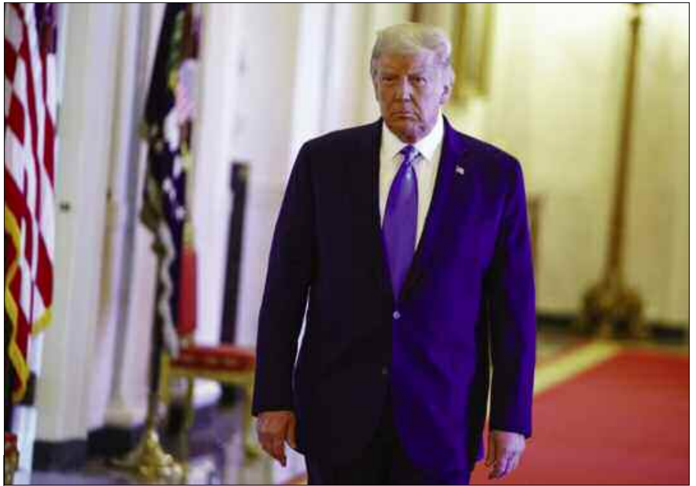
■ Les autorités du Pentagone craignent que Trump ait recours à la force armée pour réprimer des troubles post-présidentiels.

Suite au refus du président américain de s'engager à effectuer un transfert pacifique du pouvoir en cas de défaite électorale, les hautes autorités du Pentagone craignent que Trump n'ait recours à l'armée pour réprimer des troubles post-présidentiels. Parmi les préoccupations des autorités du département de la Défense, la plus importante est de savoir si Donald Trump, président américain et commandant en chef de l'armée américaine, leur ordonnera d'entrer dans de possibles troubles après les prochaines élections.