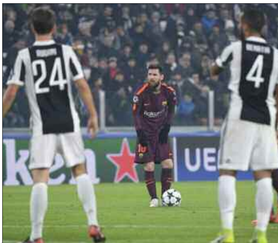
■ Messi aura la tâche difficile pour percer le mur turinois.

Au terme de ce tirage de la Ligue des champions qui s'apprête à reprendre ses droits, il ne laisse quasiment personne indifférent, les poules étant relevées, vont une fois de plus donner de la soif aux supporters et téléspectateurs qui suivront cette folle manifestation sportive où sont lotis les favoris qui