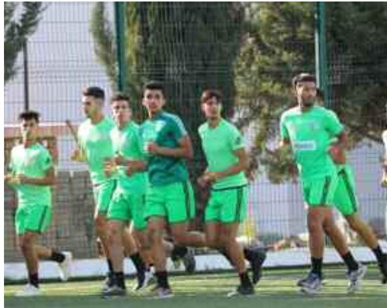
■ Les Verts préparent la CAN-2021 prévue du 16 février au 4 mars en Mauritanie.