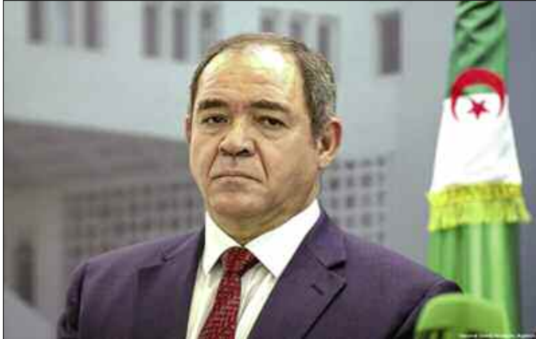
■ M. Boukadoum a rappelé les plans nationaux et sectoriels qui ont permis d'atteindre un ensemble d'objectifs fixés au niveau international.

S'exprimant au Sommet de l'ONU sur la biodiversité, tenu le 30 septembre 2020, en marge des travaux de la 75 ème session de l'Assemblée générale des Nations unies, en sa qualité de représentant du président de la République, M. Abdelmadjid Tebboune, le ministre des Affaires étrangères a rap-