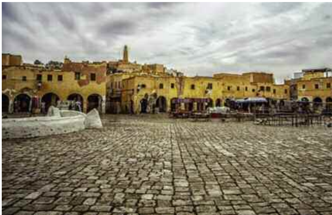
Le wali de Ghardaïa ordonne le déploiement du dispositif de veille «actif» et de vigilance sanitaire.