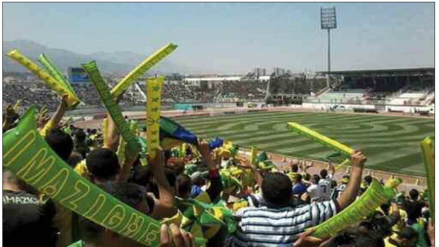
■ Les supporters ont besoin d'une meilleure organisation.

L'autre question qui inquiète les professionnels est de savoir quel serait le rôle du supporter lors de la saison qui s'ouvre prochainement ? Qu'est-ce qui ferait la différence entre les saisons passées et les saisons qui se veulent une réponse à ceux qui doutent du changement annoncé ? Ce samedi 7 novembre, ce sont les supporters du grand club kabyle qui se réveillent pour tenter d'utiliser un autre outil de communication pour faire partir ceux qu'ils considèrent comme étant de mauvais gestionnaires. Sur place, nom-