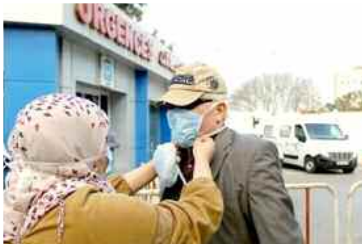
Les mesures consistent aussi bien en interdictions, comme la fermeture de lieux très fréquentés qu'en opérations de désinfection d'espaces publics.