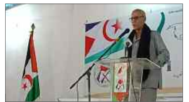
Le président de la République arabe sahraouie, Brahim Ghali.