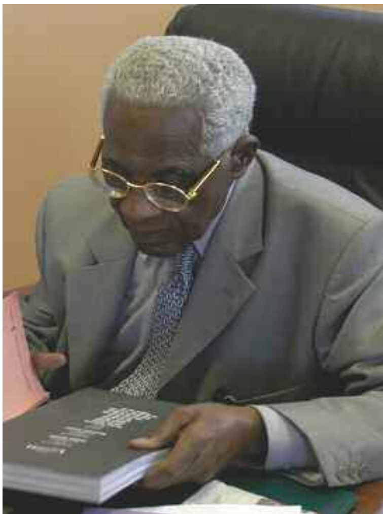
Les mots sont avant tout des signes à sens variable selon le contexte d'emploi ; quant à la culture, c'est un concept dont le sens dépend du niveau de connaissances des classes sociales ou des sociétés.

Les mots sont des signes d'un code, le code linguistique qui comme tout autre code sert à communiquer. Mais il faut savoir coder pour que le message soit cohérent et puisse être décodé par le récepteur. A l'intérieur de la phrase, le mot est dans un axe paradigmatique et fait partie d'un syntagme. Les mots : nom, verbe, adjectif, adverbe, conjonctions, locutions conjonctives locutions prépositives, prépositions ont chacun un rôle syntaxique et un rôle sémantique. Prenons un exemple de mot simple, la préposition «à», le plus petit qui soit mais qui a dans la phrase des rôles syntaxiques et sémantiques importants, et selon les cas. Avec un exemple de la vie courante, on comprendrait mieux ; soit la phrase simple : «Une histoire à dormir debout, sinon, elle pleure à fendre l'âme» où le «à» sert de mot