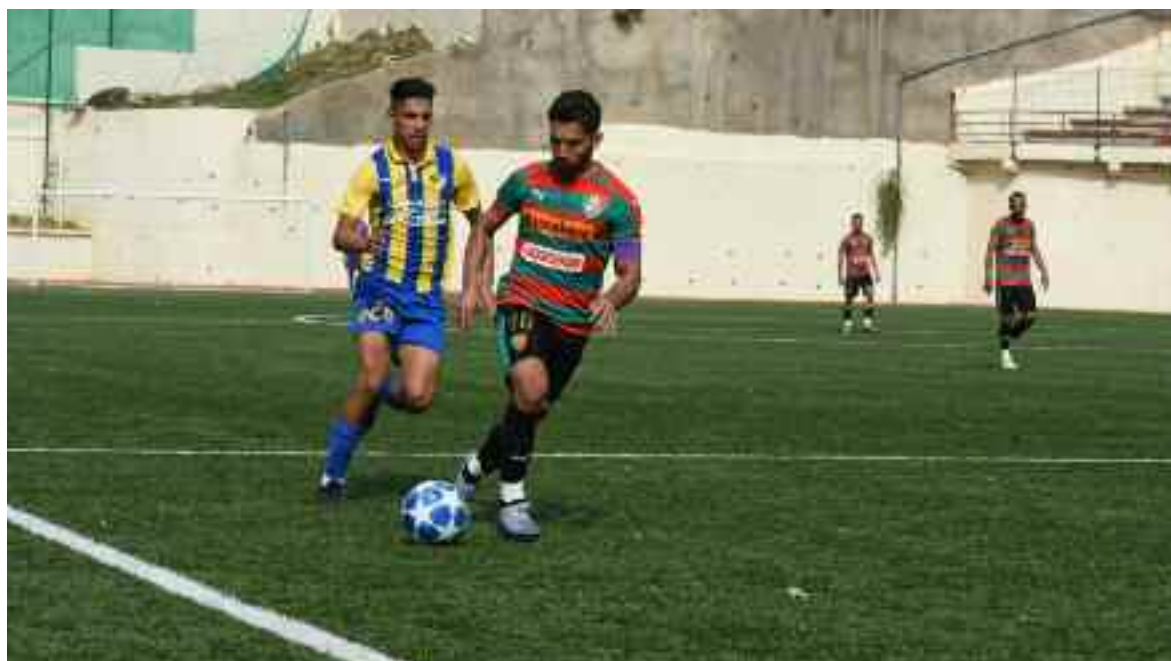
■ Djabou (MCA) face au PAC lors du tournoi Khabatou.

→ Les clubs de Ligue 1 algérienne de football abordent actuellement la dernière phase de leur préparation, en vue de la saison 2020-2021 dont le coup d'envoi est pour l'heure maintenu pour le 28 novembre en dépit de la menace du Covid-19.