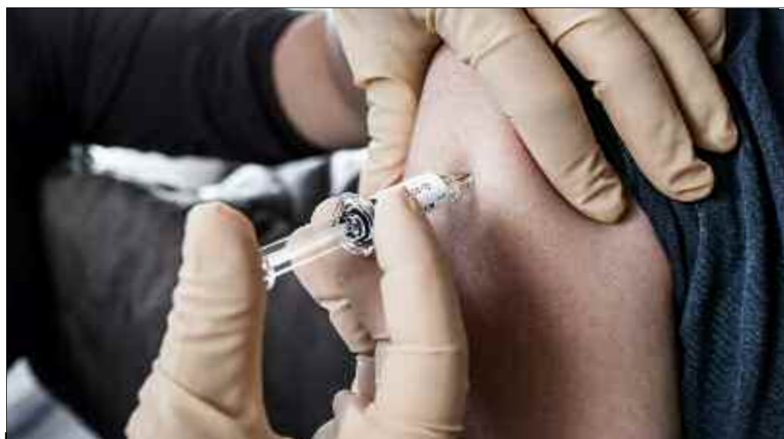
La campagne de vaccination contre la grippe saisonnière à Oum El Bouaghi sera lancée en début de semaine.

Les quantités de vaccin contre la grippe saisonnière réceptionnées sont de l'ordre de 3.169 doses (premier quota), soit 15% de la totalité demandée, le reste 17.956 sera réceptionnée prochainement. Ce vaccin est destiné pour le personnel de la santé, les personnes âgées de 65 ans et plus, les femmes enceintes et les malades chroniques, les