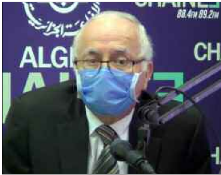
■ Les citoyens doivent faire très attention aux gestes barrières car il y a péril en la demeure.