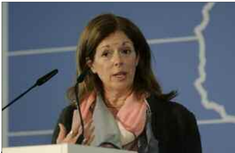
Stephanie Williams, émissaire par intérim de l'ONU en Libye.

A cet effet, l'on indique que la Libye est actuellement déchirée entre deux autorités rivales : le Gouvernement d'union nationale (GNA) dans l'Ouest, basé à Tripoli et reconnu par l'ONU, et un pouvoir incarné par Khalifa Haftar, homme fort de l'Est soutenu par une partie du parlement élu et son président, Aguila Saleh. Les pourparlers réuniront à Tunis, 75 participants libyens représentant des forces rivales : des membres du Parlement de Tobrouk (Est) et du Haut Conseil d'Etat (Ouest), ainsi que des participants sélectionnés par l'ONU, pour tenter de sortir de la crise politique en Libye. Ce dialogue fait suite à des mois de calme relatif dans ce pays qui a sombré dans le chaos après la chute du régime de Mouammar Kadhafi en 2011. Le mois dernier, les deux principales parties au conflit ont signé un accord de cessez-le-feu historique, ouvrant la voie à une reprise de la production pétrolière, économiquement vitale, et à des progrès dans les négociations politiques. Cette réunion est «une opportunité unique» après des années de chaos et d'instabilité, a affirmé dimanche Mme Williams lors d'une conférence de presse à Tunis. «Cela ne