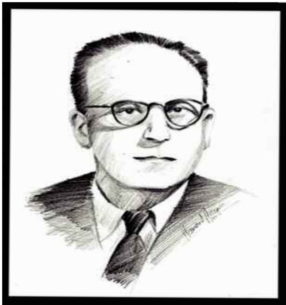
Le Penseur et philosophe algérien, Malek Bennabi.