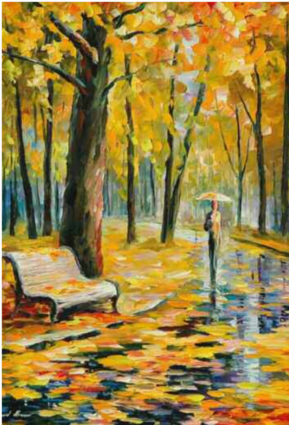
Un sujet qui paraît sans importance, mais détrompons-nous, les couleurs de l'automne, c'est autant de signes en couleurs qui sont autant de symboles désignant l'état de la végétation suivant les saisons.

A l'inverse du printemps qui tire son charme des couleurs éclatantes faites d'un mélange de variétés de blanc, des fleurs touchant légèrement au violet ou à l'orange, selon les arbres fruitiers soumis aux caprices de la nature, on assiste à un tableau flamboyant des feuilles qui jaunissent, rougissent ou roussissent. C'est d'une beauté inouïe, ces arbres devenus naturellement polychromes comme sous l'effet d'une baguette magique. Ainsi, chaque année, comme pour