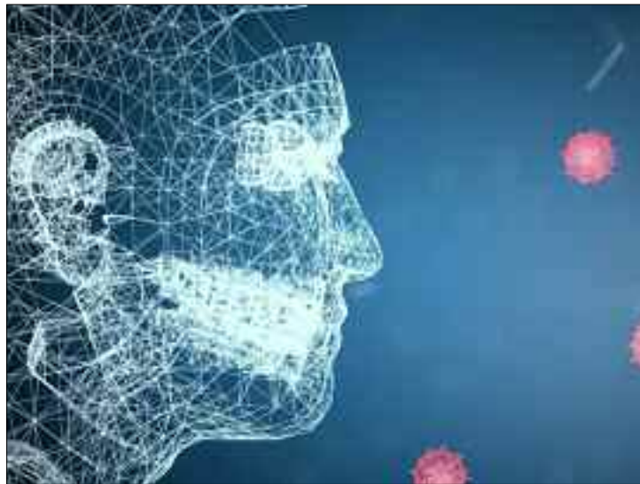
La progression de l'épidémie nécessiterait désormais des restrictions mesurées pour éviter un drame sanitaire.

Dans certaines régions, la situation est déjà affolante, est en passe d'empirer durant les jours à venir. La deuxième vague déferle sur les zones déjà sensiblement affectées par la propagation du Covid-19, en raison du relâchement des mesures barrières dont le port du masque dans les espaces publics, le res-