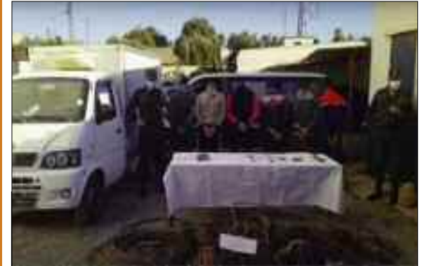
Les services de la Gendarmerie nationale de Mostaganem ont réussi à mettre fin à l'activité et aux agissements d'une bande criminelle composée de 6 personnes, impliquée dans le sabotage des réseaux électriques, à haute tension pour voler les fils de cuivre, a-t-on appris samedi de la cellule de communication et des relations publiques du groupement régional de ce corps de sécurité.