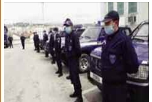
Les services de la Sûreté de la wilaya d'Alger ont mobilisé 17.263 policiers, tous grades confondus, dans le cadre du plan sécuritaire préventif tracé durant et après l'opération du référendum sur le projet de révision constitutionnelle, prévu dimanche, indique samedi un communiqué des mêmes services.