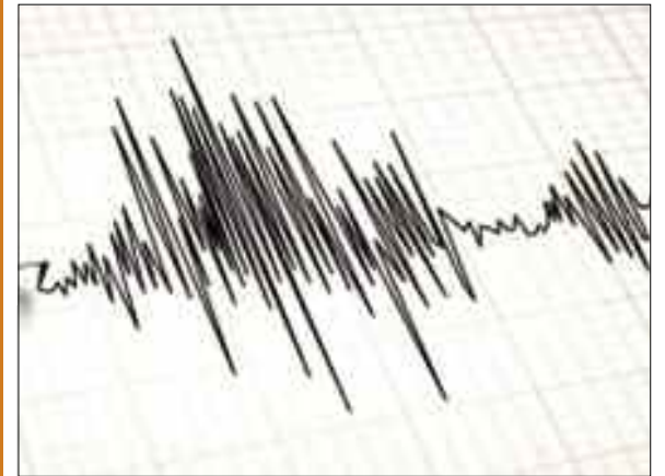
Une secousse tellurique d'une magnitude de 3,3 degrés sur l'échelle ouverte de Richter a été enregistrée samedi à 19H47 au large des côtes de Aïn El Turk, dans la wilaya d'Oran, a annoncé le Centre de Recherche en Astronomie, Astrophysique et Géophysique (CRAAG) dans un communiqué..