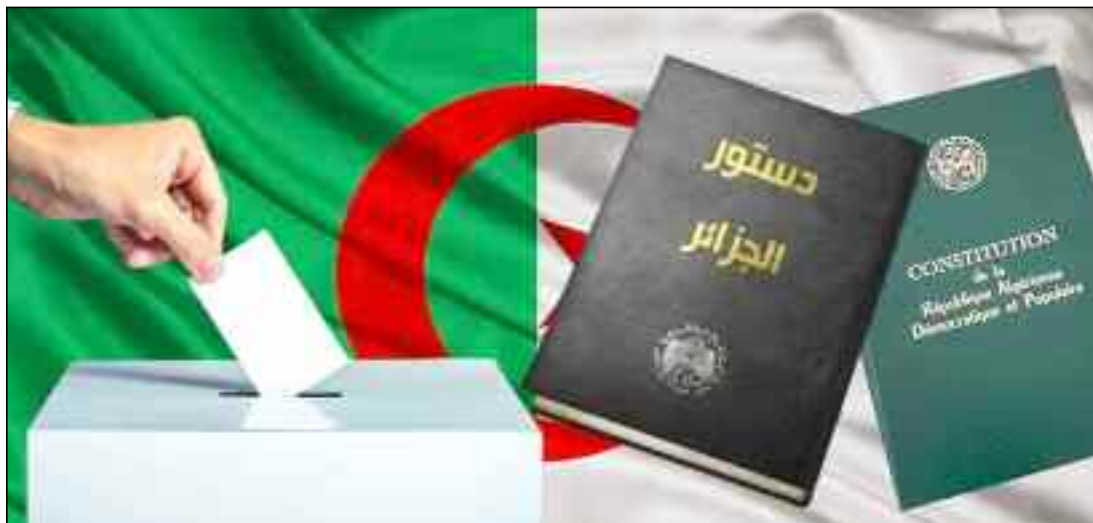
■ Le calme et la bonne organisation dans une ambiance empreinte de sérénité, c'est ce qui a été observé, hier, dans les bureaux de vote.

C'est la première fois, en Algérie, qu'un scrutin se déroule dans les conditions exceptionnelles d'un protocole sanitaire : prise de température à l'entrée du centre de vote, nettoyage des mains à l'aide du gel hydroalcoolique et, naturellement, port du masque obligatoire en plus de la distanciation matérialisée par un marquage au sol.