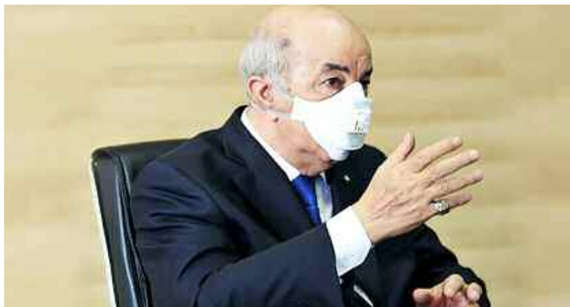
■ Tebboune a salué et exprimé toute sa considération à l'ANP, digne héritière de l'ALN ainsi qu'à tous les corps de sécurité pour protéger les frontières et préserver la sécurité et la quiétude.

martyrs et de leurs prédécesseurs est le meilleur témoignage des sacrifices et haut-faits grâce aux