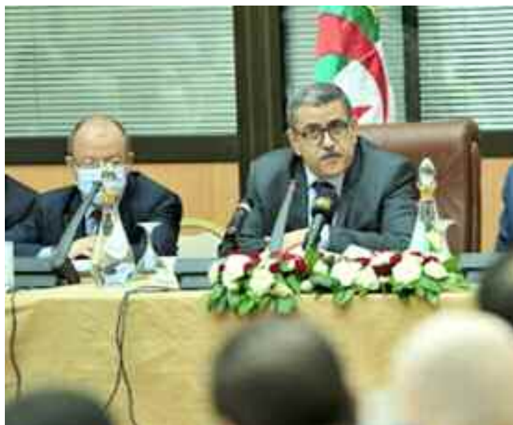
Contenir la propagation de l'épidémie et réunir toutes les conditions humaines et logistiques pour assurer la meilleure prise en charge des malades.

La reprise de l'infection Covid-19 traduite dans l'augmentation des notifications quotidiennes aussi bien des cas confirmés que des cas dépistés, et dans la hausse du nombre de patients hospitalisés, même si elle s'inscrit dans un contexte d'augmentation au niveau mondial et maghrébin, a fait réagir le gouvernement qui a décidé de mettre en place immédiatement un «plan d'action d'urgence» pour contenir la propagation de l'épidémie.