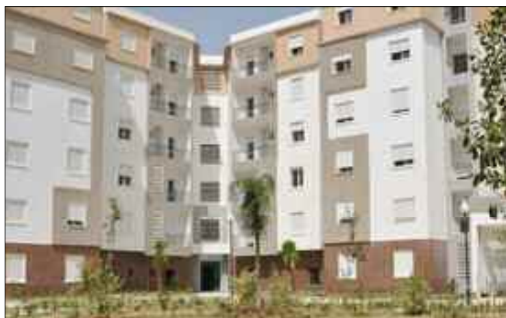
■ Désormais pour bénéficier d'un logement social, il faudrait présenter un dossier exhaustif, justifié par le revenu mensuel entre autres.

L'Etat se dirige vers une nouvelle politique en faveur du logement, en particulier, social. Un secteur à assainir et à recadrer en urgence afin de mettre un terme à la précarité et à un marché de plus en plus fermé et dominé par certains lobbyings. L'objectif serait de trouver l'équilibre entre les impératifs de sécurité et ceux de l'accès équitable au logement social, notamment, au niveau des vieux quartiers et des infrastructures de base.