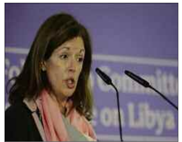
La seule voie de recouvrement de la légalité en Libye est «la voie des urnes».