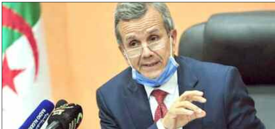
■ Pr Benbouzid : «Sur instruction du Premier ministre, le vaccin sera disponible pour toute la population».

Le ministre de la Santé, de la Population et de la Réforme hospitalière, le Pr Abderrahmane Benbouzid a estimé, avant-hier jeudi à Alger, que la recrudescence de l'épidémie du Coronavirus (Covid-19) est liée à la forme de ce virus qui est incontrôlable et risque d'être plus virulent dans le futur.