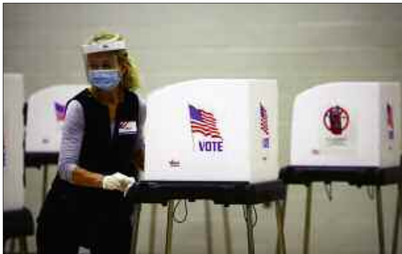
Vote massif aux USA.

Le Président républicain sortant et son adversaire démocrate s'affrontaient dans le contexte d'une polarisation extrêmement forte de la société américaine. Pour emporter la course, il faut obtenir le soutien d'au moins 270 des 538 grands électeurs du Collège électoral dont les membres sont désignés Etat par Etat en fonction notamment de leur poids démographique. Ces Etats indécis où ni les républicains ni les démocrates ne disposent d'une base électorale suffisamment stable pour se lancer dans la bataille avec des certitudes. Selon les dernières projections de l'institut Edison Research disponibles jeudi dernier, Joe Biden est crédité de 243 grands électeurs contre 214 pour Donald Trump. Les projections d'AP et de la chaîne Fox sont plus favorables encore à l'ancien vice-président de Barack Obama, qu'elles créditent de 264 grands électeurs, à portée de la barre fatidique des 270 voix. Plus de 100 millions d'électeurs ont voté par anticipation avant cet élection, soit par voie postale soit en personne dans des bureaux ouverts à l'avance : un record qui a retardé les opérations de dé-