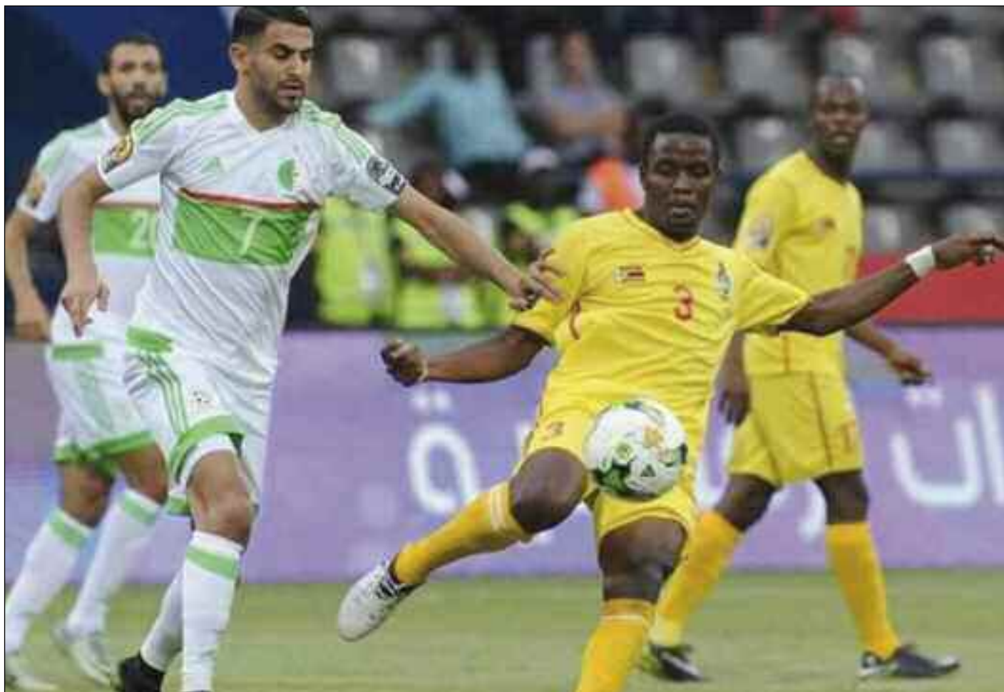
■ Les Verts veulent terminer sur la lancée face au Zimbabwe.

L'objectif des Verts est de tenter de poursuivre sa route vers une 3 e CAN. Il s'agit, ce 12 novembre au stade 5-Juillet, de sauter la première barrière, celle d'une équipe emmenée par le sélectionneur Zdravko Logarusic, laquelle fut, faut-il le rappeler, éliminée lors de la CAN-2019, au premier tour, après deux défaites et un match nul. Mais elle reste musclée pour promettre d'aller le plus loin possible. Les interrogations se musclent aussi, justement au fur à mesure que la date du 12 novembre arrive. Elle laisse un grand nombre de supporters, et même d'observateurs en attente du spectacle, pas n'importe quel spectacle, puisqu'il sera aux couleurs africaines. Mais quelque chose avait coïncé et qui a failli tout annuler. Que s'est-il donc passé ? Pourquoi ces doutes, à quelques