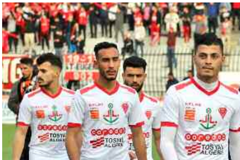
■ Une douzaine de joueurs ont renforcé les rangs du MCO.

Par ailleurs, la formation phare de la capitale de l'Ouest du pays a clôturé