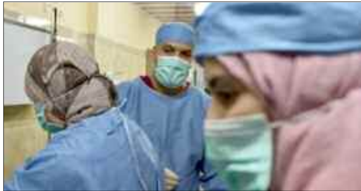
■ C'est la première fois qu'on vit une pandémie mondiale de ce genre, affirme un praticien médical.

Maintes fois et sur ces mêmes colonnes alors que la situation était encore maîtrisable, l'alerte avait été donnée sur la situation de laisser-aller à laquelle était, est toujours confronté, le pays en termes de contamination au Covid-19 avec des cas mortels.