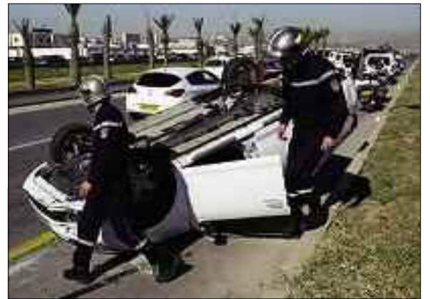
Dix (10) personnes ont trouvé la mort et 158 autres ont été blessées dans des accidents de la circulation enregistrés au cours des dernières 48 heures à travers le pays, selon le bilan des dernières 48 heures établi samedi par les services de la Protection civile. (Photo)