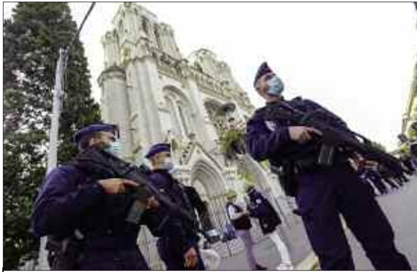
La France menace d'expulser 231 étrangers radicalisés originaires du Maghreb.

Une collégienne de 12 ans a diffusé une photo macabre de Samuel Paty, les faits d'apologie du terrorisme explosent en France depuis l'assassinat mi-octobre du professeur, tué pour avoir montré des caricatures de Mahomet. Cet assassinat, qui a choqué la France, provoque aussi des réactions sinistres. Selon France Info, près de 200 enquêtes ont été ouvertes au cours de la dernière semaine d'octobre pour apologie du terrorisme, menaces de mort, injures ou provocations à la haine en lien