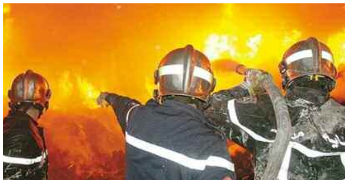
■ La pyromanie semble prendre d'inquiétantes proportions.