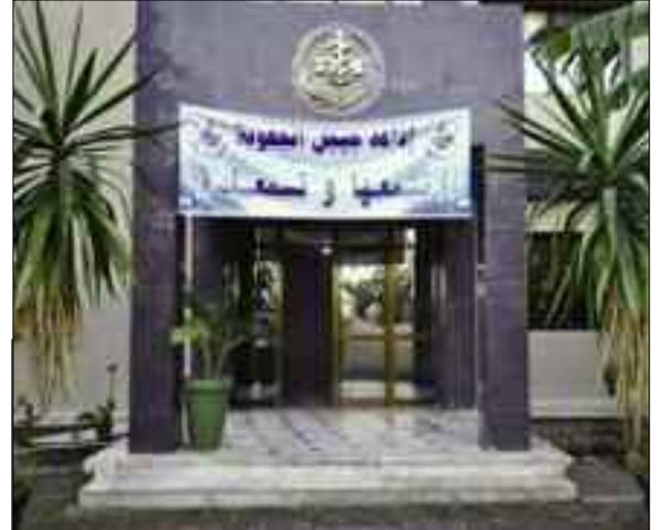
Un radiothon de solidarité au profit des trois hôpitaux de Tahir, d'El Milia et du Chef-lieu de la wilaya de Jijel a été organisé samedi par Radio Jijel sous le slogan «notre conscience nous consolide, ensemble nous vaincrons».