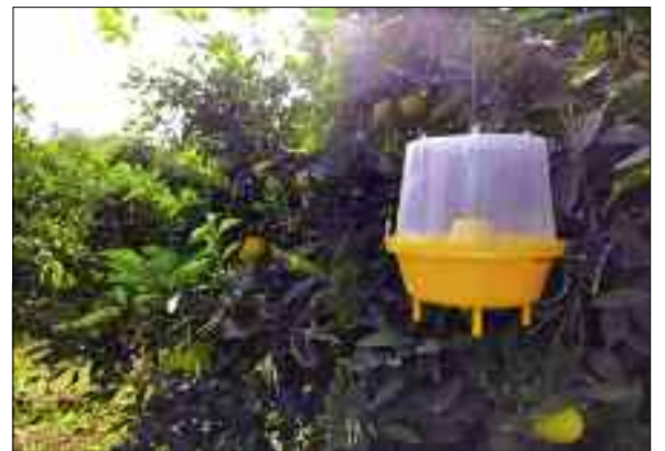
Des producteurs d'agrumes (oranges) d'Oran ont réussi à mettre un terme aux nuisances de l'insecte de la Méditerranée (cératite) qui menace les champs d'arbres fruitiers en général à un traitement anticipé, a-t-on appris auprès de la station régionale de protection végétale de Misserghine.