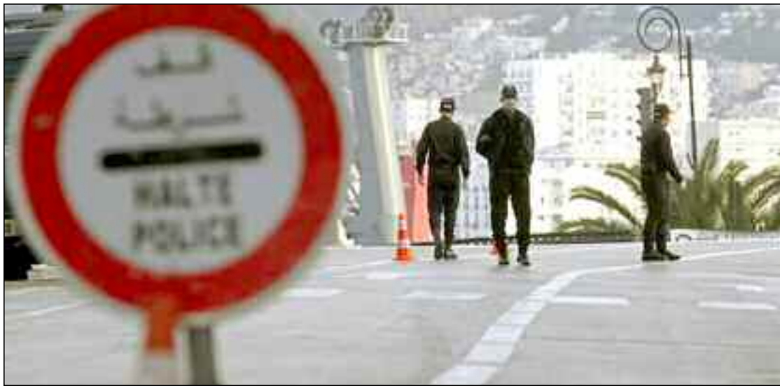
■ Devant l'ampleur des dégâts causés par la pandémie du Coronavirus, il était grand temps de prendre de nouvelles mesures de confinement.

La rentrée universitaire prévue initialement le 22 novembre est officiellement reportée. En effet, la nouvelle date à annoncer est tributaire de l'évolution de la situation sanitaire très inquiétante. Aussi les horaires du confinement partiel à domicile concernent désormais 29 wilayas et s'étaleront, à partir du 10 novembre, de 20h à 5h du matin le lendemain et ce, pour une durée de 15 jours renouvelables.