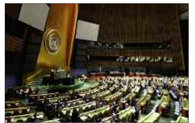
Quatrième commission de l'Assemblée générale de l'Onu.