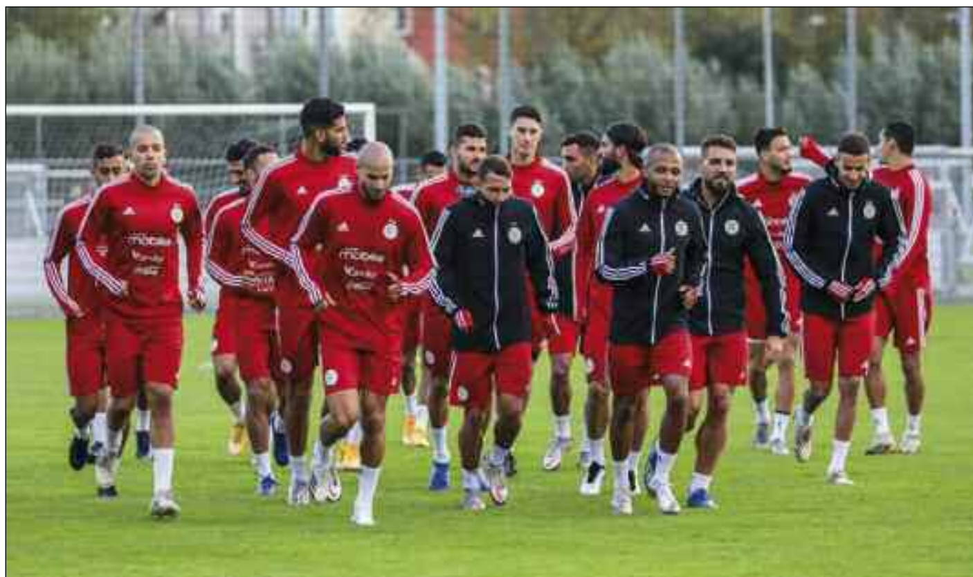
■ Les Verts ne pourront pas compter sur leurs supporters...

Les premières réactions qui fusent de partout se rejoignent sur un même point central. Comment rester connecté à cette course sans être dans les gradins ? La chose est claire, elle s'est même exprimée par les spécialistes du football qui soulignent que le football sans ambiance ne peut exister. Côté joueurs, la perception est la même. «Cela dénature un peu le football, le spectacle. On perd ce parfum de la CAN, la musique, les supporters, les tifos. C'est ce qui va manquer», regrette la majorité des supporters. Mais ce huis clos est compris et a donc été accepté par les supporters qui se préparent à être au rendez-vous entre le 11 et le 17 novembre 2020, eux qui sont les principaux concernés par cette mesure. Ils comprennent globalement la prudence de la CAF, mais refusent d'être les oubliés de la reprise de la programmation des 48 matches.