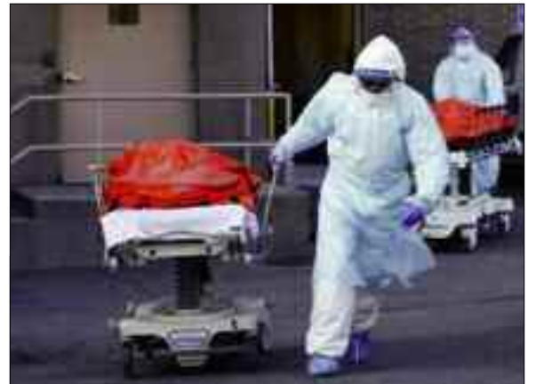
Plus de 1,2 million de décès liés au nouveau coronavirus (Covid-19) ont été recensés dans le monde, selon un nouveau bilan établi lundi à partir de sources officielles. Au moins 1.200.042 décès pour 46.452.818 cas ont été déclarés.