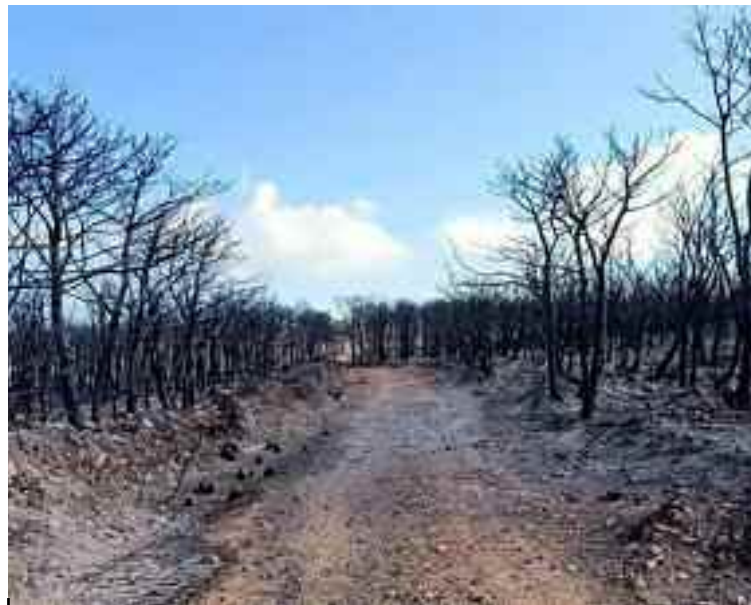
Un plan de reboisement de la forêt de Madagh est en cours d'étude.

ORAN - La forêt de Madagh à Oran, récemment ravagée par un incendie, vient d'être déclarée «zone sinistrée», ce qui implique une interdiction d'accès aux citoyens pour lui permettre de se régénérer, a-t-on appris dimanche auprès de la Direction de l'environnement. Cette déclaration signée par les autorités locales (daïra de Boutelilis), interdit ainsi aux citoyens de fréquenter tous les périmètre dévoré par le feu au cours de l'incendie, en attendant la régénération naturelle, a précisé la directrice de l'Environnement, Samira Dahou. Les dégâts de l'incendie, qui s'est déclaré le 6 novembre courant, ont détruit 100 hectares de forêts, 200 hectares de maquis et 100 hectares de broussailles, selon un