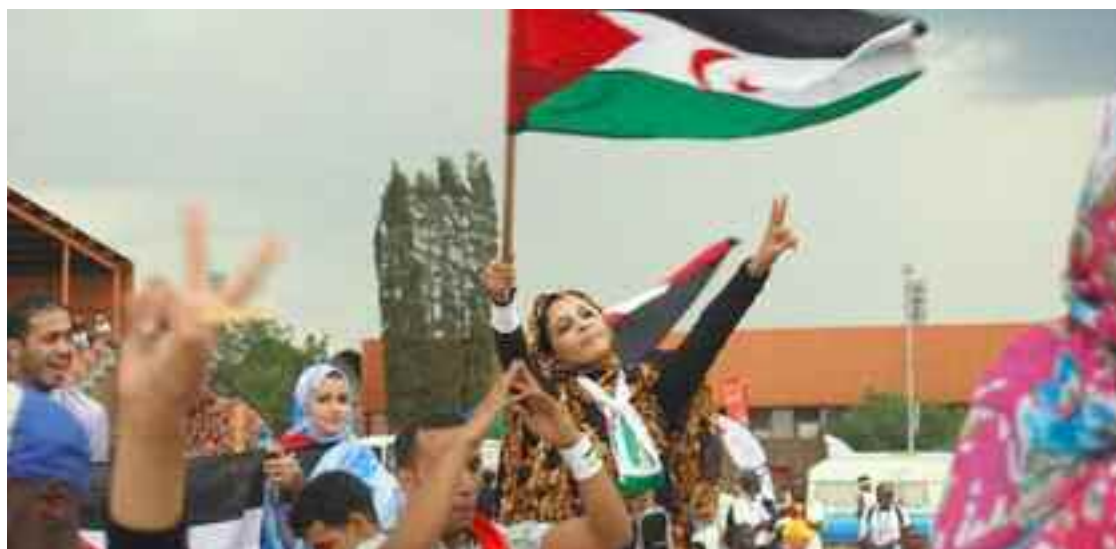
Comme à son habitude, le Maroc continue ses attaques contre les civils sahraouis.