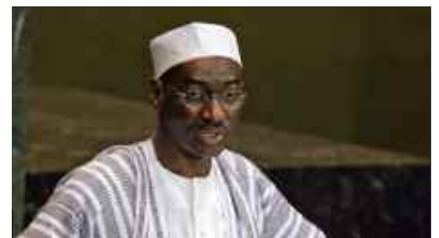
Le Premier ministre malien, Moctar Ouane.