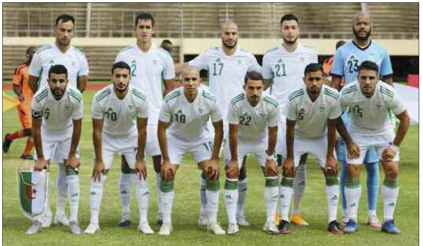
👉 L'essentiel est fait, les Verts sont qualifiés à la prochaine CAN.

→ Même bousculés et rattrapés au score par le Zimbabwe sur son terrain, le score (2-2) ne fait pas lâcher aux Fennecs ses 10 premiers points à l'occasion de la 4 e journée des éliminatoires de la CAN-2021, lesquels assurent leur qualification en phase finale. Vainqueurs 3-1 à l'aller, avec ce nul, les Algériens signent un vingt-deuxième match sans défaite. Ce point ramené de Hararé reste suffisant pour aller en phase finale. Ce qui satisfait le coach Djamel Belmadi qui visait une qualification «rapide» pour permettre aux joueurs «de se relâcher par la suite».