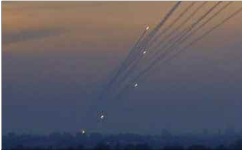
Les frappes de roquettes palestiniennes confirment la fragilité du Dôme de fer israélien.