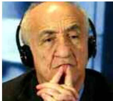
■ Mustapha Larfaoui, un monument du sport algérien

Je vous explique : en 1992, fin de mandat. Les USA proposent de changer la règle de un terme à deux termes pour me permettre de poursuivre mon programme. En 1996, suppression de la règle. Réélection en 1996, 2000, 2005. Plus aucun concurrent depuis 1992. En 2009, malgré la pression des membres qui me demandaient de profiter des réalisations, j'ai décidé de me retirer ? C'est alors que les statuts ont été enrichis par un article portant sur l'élection par le congrès d'un président d'honneur à vie, membre du bureau exécutif. C'est cette position que j'occupe aujourd'hui. Enfin, je me dois de préciser également que Juan Antonio Samaranch m'avait sollicité en 1995 comme membre du CIO. Il insista parce qu'il avait reçu l'autorisation de choisir deux présidents de fédérations internationales en cette qualité. Il avait choisi l'athlétisme et il souhaitait avoir la natation. Il m'a été impossible de décliner cette proposition, une marque de confiance que j'ai beaucoup appréciée. Je dois souligner que les présidents du CIO Samaranch et Rogge m'ont beaucoup