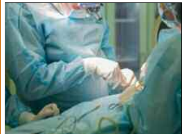
L'Organisation mondiale de la santé (OMS) a lancé mardi une stratégie visant à éliminer le cancer du col de l'utérus, estimant que cinq millions de vies seraient sauvées d'ici 2050 grâce à l'accès généralisé à la vaccination, au dépistage et au traitement.