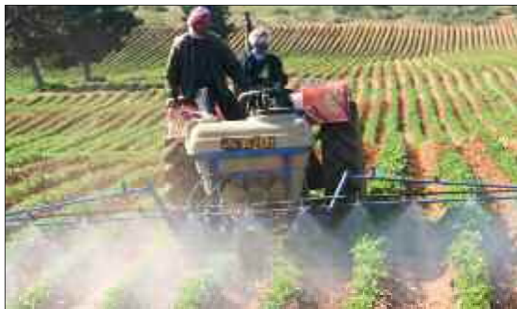
■ La mise à jour de plusieurs centaines de projets de création d'unités de transformation agricole ont été livrés à l'abandon.

Bien que le secteur soit confronté à une période de sécheresse qui se poursuit, le développement rural reste concentré sur sa mission essentielle : celle d'être un moteur de croissance et de diversification économique. Ce que confirme, du reste, l'intensification de la production dans les filières agroalimentaires stratégiques et le développement des territoires ruraux.