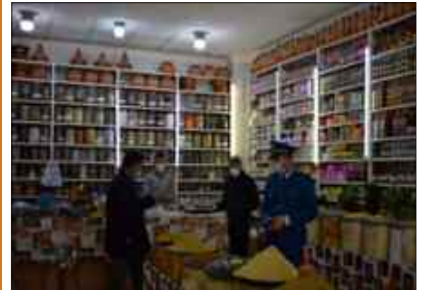
Les mesures de prévention entreprises ces deux derniers jours par les autorités de la wilaya de Djelfa pour faire face à la propagation de la Covid-19 sont totalement respectées par les citoyens, a-t-on constaté.