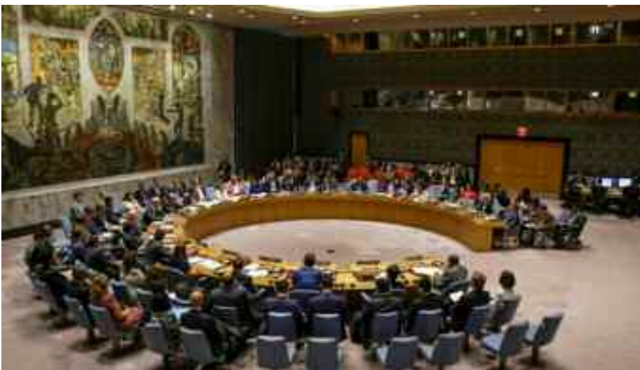
Le recours fréquent au droit de veto a limité l'efficacité du Conseil de sécurité.

Depuis le déclenchement de la pandémie de Covid-19 en début d'année, le Conseil de sécurité n'a tenu que très peu de réunions consacrées au virus. Il lui a fallu plus de trois mois pour dépasser des divergences entre les Etats-Unis et la Chine pour adopter le 1er juillet