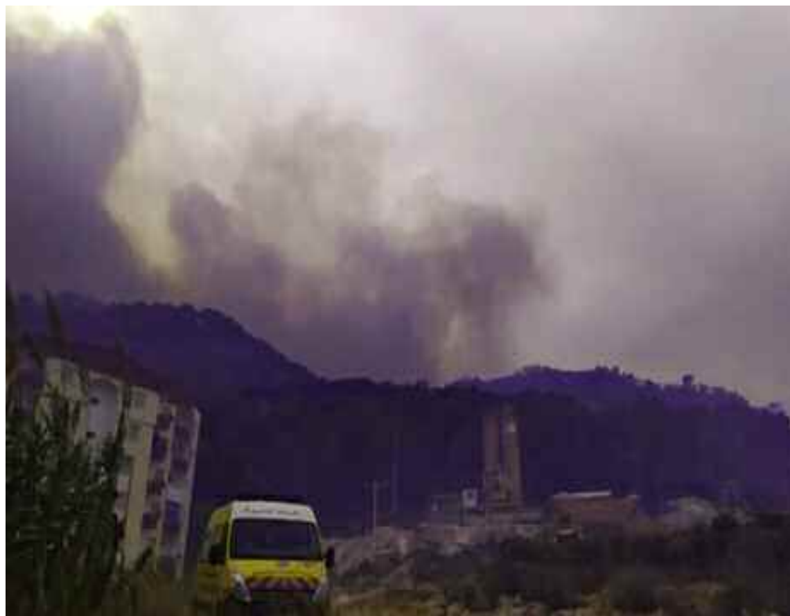
Cette opération a permis l'arrestation d'une «bande de malfaiteurs» composée de 19 individus.

Dans un point de presse animé au siège du tribunal de Cherchell en vue d'informer l'opinion publique de cette affaire, le procureur de la République, Kamel Chenoufi, a indiqué que les services de la Gendarmerie nationale et de la Sûreté de wilaya de Tipasa ont mené, suite à l'ouverture d'une instruction judiciaire, des «enquêtes et de larges investigations pour déterminer les causes du déclenchement simultané des incendies à travers plusieurs régions de la wilaya, causant la mort de deux personnes, en plus de dégâts considérables occasionnés aux biens des citoyens, entre habitations, ressources animale, agricole et forestière». Cette opération a permis l'arrestation d'une «bande de malfaiteurs soupçonnés d'être impliqués dans ces incendies suspects», a-t-il ajouté, précisant qu'il s'agit de «19 individus entendus par le juge d'instruction près du même tribunal qui a ordonné leur mise en détention provisoire et la délivrance