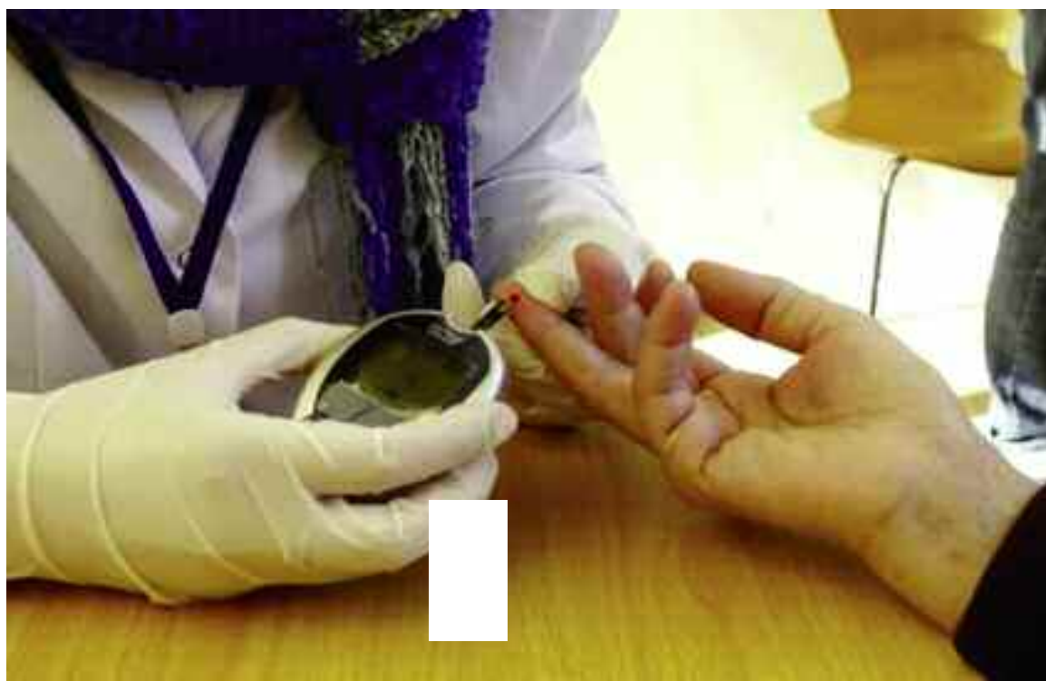
Les personnes atteintes de maladies chroniques sont plus exposées au risque de contamination.

Comment la Covid-19 se transmet-elle ? Pourquoi les personnes atteintes de diabète sont-elles plus exposées que d'autres ? Comment s'en prémunir ? Où s'informer ? Selon le diabétologue, docteur Boumediène, l'ensemble de la population est exposée au risque de contamination par le Coronavirus. Toutefois, comme pour beaucoup de maladies infectieuses, certaines personnes sont plus exposées au risque de développer des complications sévères en cas d'infection, en raison de leur âge et de leur état de santé, notamment les personnes atteintes de maladies chroniques (diabète, maladies cardiovasculaires, maladies respiratoires...) ou ayant une immunité affai-