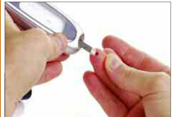
Des diabétologues et des spécialistes en médecine interne ont affirmé, samedi à Alger, que 5% seulement des diabétiques de type 2 «ont réellement besoin d'un traitement médicamenteux innovant».