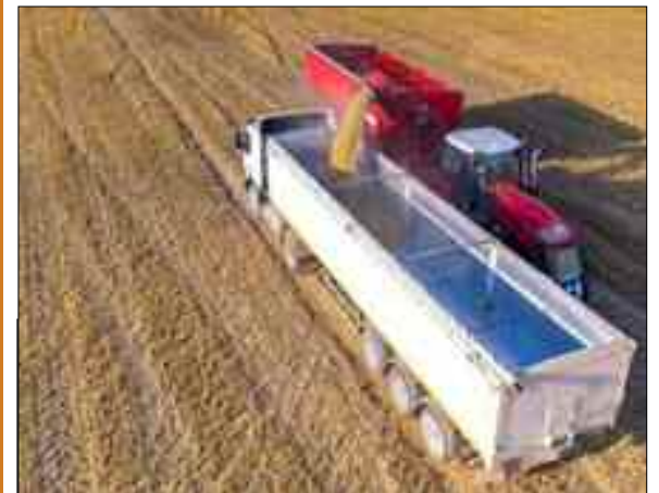
Les prix du blé étaient en recul, lundi à la mi-journée, dans un mouvement de consolidation des marchés, alors que la demande internationale demeure importante.