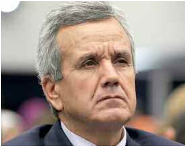
■ Contenir I.