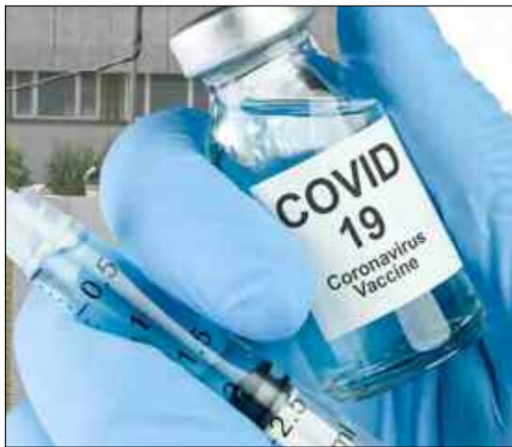
■ Les Algériens attendent avec impatience l'acquisition de ce vaccin anti-Covid-19.

Lors de cette réunion, les membres du Gouvernement ont examiné un projet de Décret présidentiel et quatre projets de Décrets exécutifs. Le Gouvernement a entendu un exposé présenté par le ministre de la Justice, Garde des Sceaux relatif au projet de Décret exécutif fixant les conditions d'exemption de l'exigence de présentation du certificat de nationalité et du casier judiciaire dans les dossiers administratifs. Ce texte s'inscrit dans le cadre des