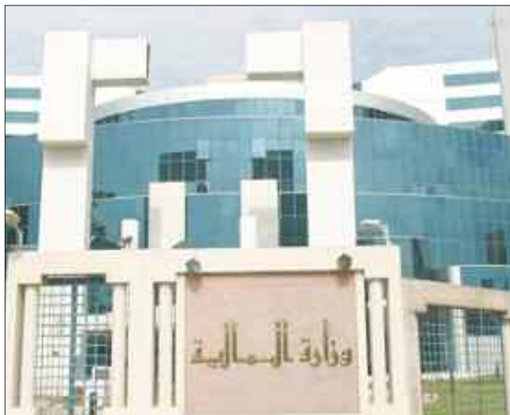
■ L'année 2021 s'annonce très «difficile» pour les ménages, mais aussi pour l'Etat.

nances publiques par une compression des dépenses et la diversification des sources de financement des caisses de l'Etat, le gouvernement s'est éloigné de la réalité des finances locales et du projet des réformes financières globales. La fixation de nouvelles taxes n'implique, malheureusement, pas l'adoption d'une véritable perspective de sortie de crise comme souhaité par les citoyens et les opérateurs économiques, eux-mêmes confrontés à la question de l'adaptabilité des dispositions, notamment, fiscales, de ce projet de loi à la situation réelle des ménages et des entreprises, gravement impactés par la double crise économique et sanitaire. Ils ont besoin plus que jamais de soutien et de perspectives pour surmonter la crise financière qui risque de s'abattre particulièrement sur la politique salariale, de l'emploi et sur la qualité de vie des citoyens, notamment, de la classe moyenne. Le projet de loi de Finances 2021 (PLF 2021) présenté jeudi dernier