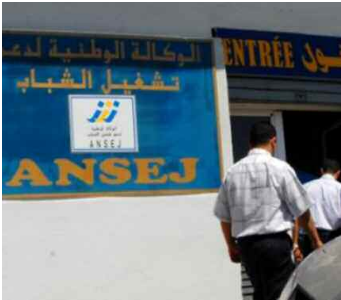
L'Ansej de la wilaya de Aïn Témouchent est à l'écoute des jeunes promoteurs et porteurs d'idées novatrices.

Le même communiqué a évoqué les objectifs de cette opération de sensibilisation et d'information, la reconnaissance réelle de ces zones, écouter les citoyens et enregistrer leurs préoccupations, l'explication des axes de la nouvelle stratégie de l'appareil de l'Ansej consistant à booster l'emploi des jeunes et présenter les différentes étapes pour la création d'une micro-entreprise et élucider certains points d'ombre en ouvrant un dialogue direct et clair, encouragement des porteurs d'idées innovatrices dans les secteurs de l'agriculture, les services conformément aux décisions arrêtées par le ministère de tutelle. Les animateurs ont également insisté sur l'importance de la communication pour échanger les informations. Ils ont mis en exergue les opportunités des conventions. Et pour stimuler ces jeunes, les animateurs ont donné des exemples vivants