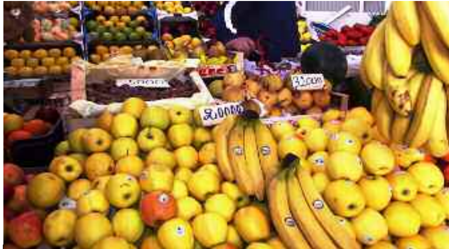
■ Nouvelle flambée des prix des fruits et légumes à Mostaganem.

Ceux-ci redoutent l'inaction des pouvoirs publics sur la question délicate des nouveaux prix affichée par la plupart des commerçants, ce d'autant les garanties du ministre du commerce, qui à chaque hausses des prix, d'ailleurs « crié » sur le toit de notre unique télévision, ne produisent pas toujours les effets souhaités par les smicards et les fonctionnaires, qui touchent entre 25.000 à 35.000 dinars, qui sont toujours gringalet à joindre les deux bouts. En effet, malgré les mesures coercitives et