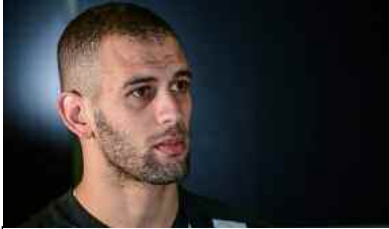
■ Slimani pourrait remplacer Memphis ou Dembélé à Lyon.

Selon la même source, l'attaquant algérien, sous contrat avec Leicester City (Angleterre) jusqu'à la fin de saison, se retrouve désormais en position de force autour de la table des négociations et pourra bientôt signer dans le club de son choix. Une situation