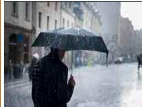
Des pluies, parfois sous forme d'averses, toucheront plusieurs wilayas de l'Est du pays à partir de la soirée de ce dimanche, indique l'Office national de la météorologie (ONM) dans une alerte météorologique.