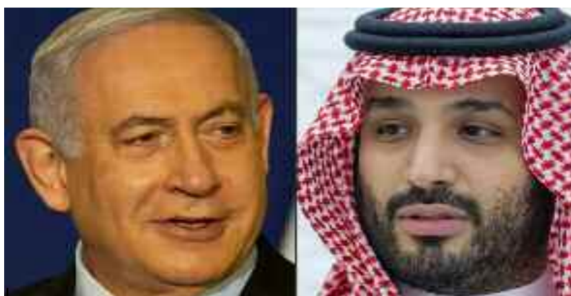
Le Premier ministre israélien Benjamin Netanyahu s'est rendu en secret dimanche en Arabie saoudite pour y rencontrer le prince héritier Mohammed ben Salmane.

«Notre partenariat sécuritaire et écono-