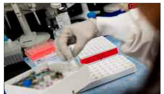
Les États-Unis est le pays le plus endeuillé du monde par le coronavirus avec 255.800 décès.