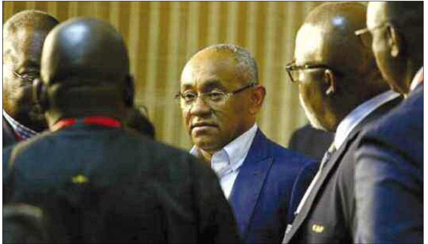
■ Les tractations ont déjà commencé et les contacts se multiplient.

Le terrain où se jouera cette élection est marocain. Le prochain élu n'aura pas la tâche facile, ce qui relève de l'évidence même. Ce qui ne l'est pas, c'est le respect de bout en bout de ses engagements qui seront annoncés le 12 mars. Un rituel devenu à la longue un fait de séduction qui s'affaiblit au fil du mandat. Ce qui sera attendu du président-élu, c'est cette lourde tâche qui est celle de développer le football sur le continent africain durant les quatre ans de son mandat. Éviter les erreurs du passé qui n'ont pas musclé ce football souvent mis en échec par rapport à des attentes qui n'épousent pas