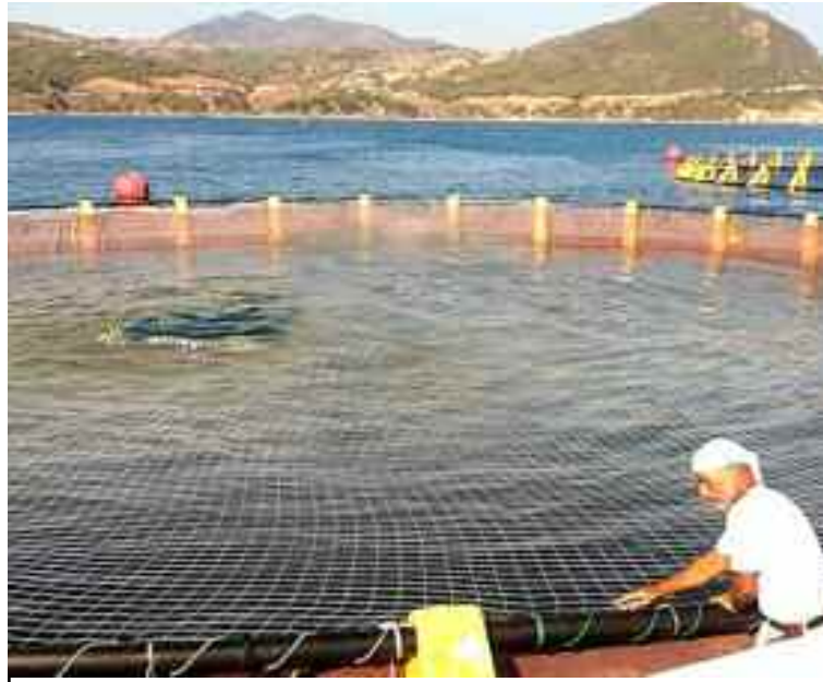
Honaïne est en passe de devenir un pôle aquacole d'excellence.

La wilaya de Tlemcen comptait, jusqu'à cette année, une seule ferme aquacole «Aquadora», implantée au large de la ville côtière de Honaïne. En production depuis 2016, avec une capacité de 600 tonnes annuellement, cette ferme produit la daurade et le loup de mer. Elle dispose de 12 cages flottantes de 23 mètres de diamètre, a-t-on indiqué à la direction locale de la Pêche et des Ressources halieutiques. Une autre ferme, fruit d'un investissement de 15 millions DA, sera opérationnelle dès la pose des cages flottantes prévue à partir de cette semaine à Honaïne, a annoncé, de son côté, son propriétaire, Achour Fouad. Le responsable de la société «Royaume du poisson» a ajouté que 20 emplois sont créés au départ avec une capacité de production annuelle de daurades et de loups de mer de