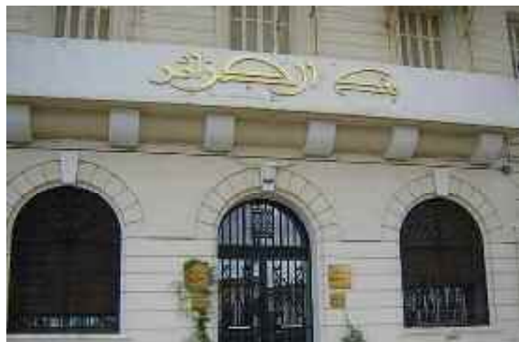
■ L'Etat prévoit de revoir sa stratégie de prévention des risques naturels et comprendre les défaillances qui accompagnent leur gestion.

L'impact du changement climatique sur les aléas naturels, ces deux dernières décennies, est de plus en plus croissant, en Algérie. Pour faire face à ces risques majeurs (séismes, incendies et inondations), l'Etat tente de mettre en place une véritable stratégie de prévention contre les risques naturels qui coûtent chers aux sinistrés et aux pouvoirs publics.