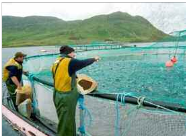
■ Malgré les aléas créés par la pandémie de la Covid-19, ils ont réussi à produire 130.000 tonnes de poissons tout type confondu.

Une activité de la pêche ressuscitée après plusieurs années d'asphyxie, un marché du poisson sous toutes ses formes qui, frétilant quotidiennement de produits de la mer et de l'aquaculture, différentes unités de pêche et d'entretien des embarcations sérieusement prises en charge pour être réparées, entretenues et remises à flot pour s'adonner de nouveau à la pêche grâce à la dextérité de jeunes ingénieurs algériens en travaux maritimes, une disponibilité de tout instant grâce à ces mêmes jeunes de pièce de rechange et de compétences maritimes, ont bien accueilli les fortes pluies de ces derniers jours.