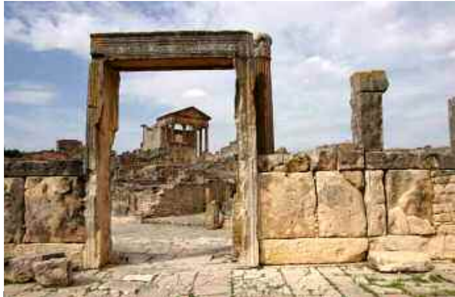
Le patrimoine culturel algérien menacé par les pilliers d'antiquités.

Les éléments de la Brigade mobile de la police judiciaire (BMPJ) de Berrahal, ont réussi un joli coup pour arrêter un groupe d'individus spécialisé dans l'atteinte au patrimoine culturel, ce mois de novembre 2020. Ils ont pu récupérer un lot de pièces archéologiques et du matériel de détection de métaux, apprend La Nouvelle République auprès des services de sécurité de la wilaya d'Annaba. Deux des trafiquants, âgés entre 24 et 49 ans sont originaires de cette wilaya, alors que le troisième est natif de Skikda. Le premier mis en cause a été interpellé au niveau du pôle urbain Kalitoussa de Berrahal, en possession de quelques pièces de monnaie ancienne.