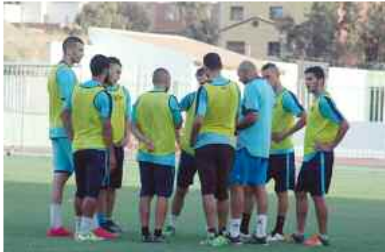
■ L'entrée en scène du RCR en Ligue 1 s'annonce sous de mauvais auspices.

Les joueurs en question ne sont toujours pas qualifiés par la Ligue de football professionnel (LFP) à cause des dettes du club envers d'anciens éléments ayant saisi la Chambre nationale de résolution des litiges (CNRL). Cette situation met le nouvel entraîneur des