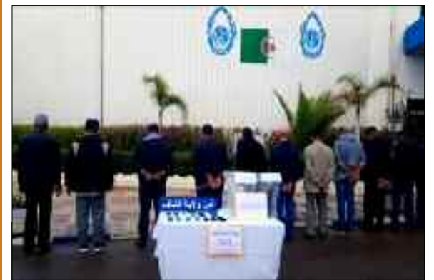
Onze individus suspectés d'être impliqués dans les incendies des forêts de la commune de l'Oued Goussine, déclenchés, dans la nuit du 6 au 7 novembre courant, dans le sillage d'une série d'incendies qui a touché plusieurs wilayas du centre et de l'ouest du pays, ont été arrêtés par les éléments de la police judiciaire relevant de la sûreté de wilaya de Chlef, a-t-on appris, dimanche, auprès de ce corps sécuritaire.