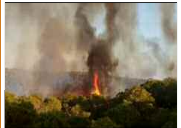
Les services de la Protection civile de la wilaya de Aïn Témouchent ont décidé d'installer un poste avancé fixe à la forêt de Sassel, suite à un incendie qui s'est déclaré dans le même site, a-t-on appris dimanche du directeur de wilaya de la Protection civile, le commandant Mourad Bensalem.