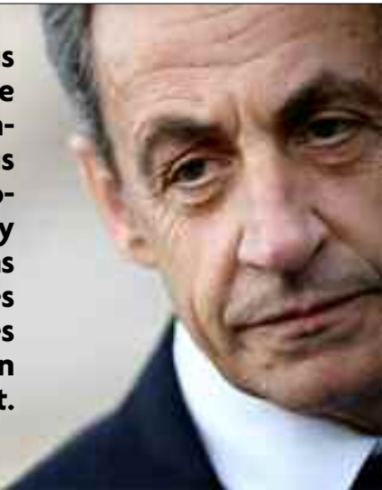
Lex-président français Nicolas Sarkozy, jugé pour corruption, clame son innocence.

Pour la première fois dans l'histoire de l'après-guerre, un ancien président français est jugé pour corruption : Nicolas Sarkozy comparait lundi dans l'affaire dite des «écoutes» aux côtés d'un ami avocat et d'un ancien haut magistrat.