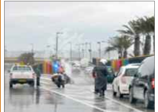
La Direction générale de la Sûreté nationale (DGSN) a mobilisé ses services pour fluidifier le trafic routier, notamment dans les wilayas Centre et Est du pays, où d'importantes chutes de pluies ont été enregistrées.