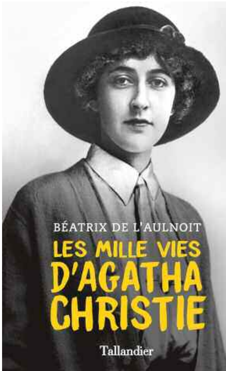
Une nouvelle biographie sur la reine du polar revient sur l'énorme business qu'elle a généré avec son œuvre et ses centaines de millions de livres vendus.

La romancière mènera une vie tambour battant, divorçant d'un mari volage pour convoler avec un archéologue courant le monde... Tout cela a un prix, les romans vont le financer, aussi bien pour assurer son train de vie que pour payer des extra. « Je me disais, j'aimerais bien transformer la serre en véranda, où l'on pourrait s'asseoir à l'aise, racontait-elle un jour. Combien cela me coûterait-il ? Je me faisais faire un devis, m'installais devant la machine à écrire, prenais ma tête à deux mains, et, en moins d'une semaine, une histoire s'élaborait dans mon esprit. Le moment venu, je la rédigeais et j'avais ma véranda... » Dès les années 1920, elle s'entoure d'un agent littéraire entreprenant, Edmund Cork, qui lui fait entrevoir des publica-