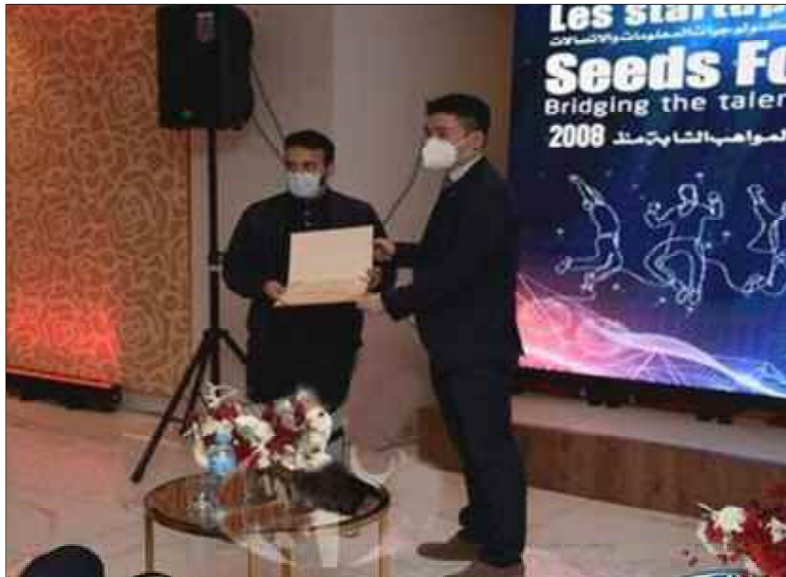
■ Lancement de la 6 e édition du programme de développement des jeunes talents (Seed For The Future).

Les étudiants ont suivi, durant cette période, une formation sur les technologies de la 5G, l'Intelligence artificielle (IA) et l'internet des objets (IoT), ainsi que des cours de développement personnel et de leadership sur la «conscience culturelle» et «l'efficacité personnelle». Ils ont également suivi des présentations sur l'histoire et les valeurs de l'entreprise de Huawei ainsi que des