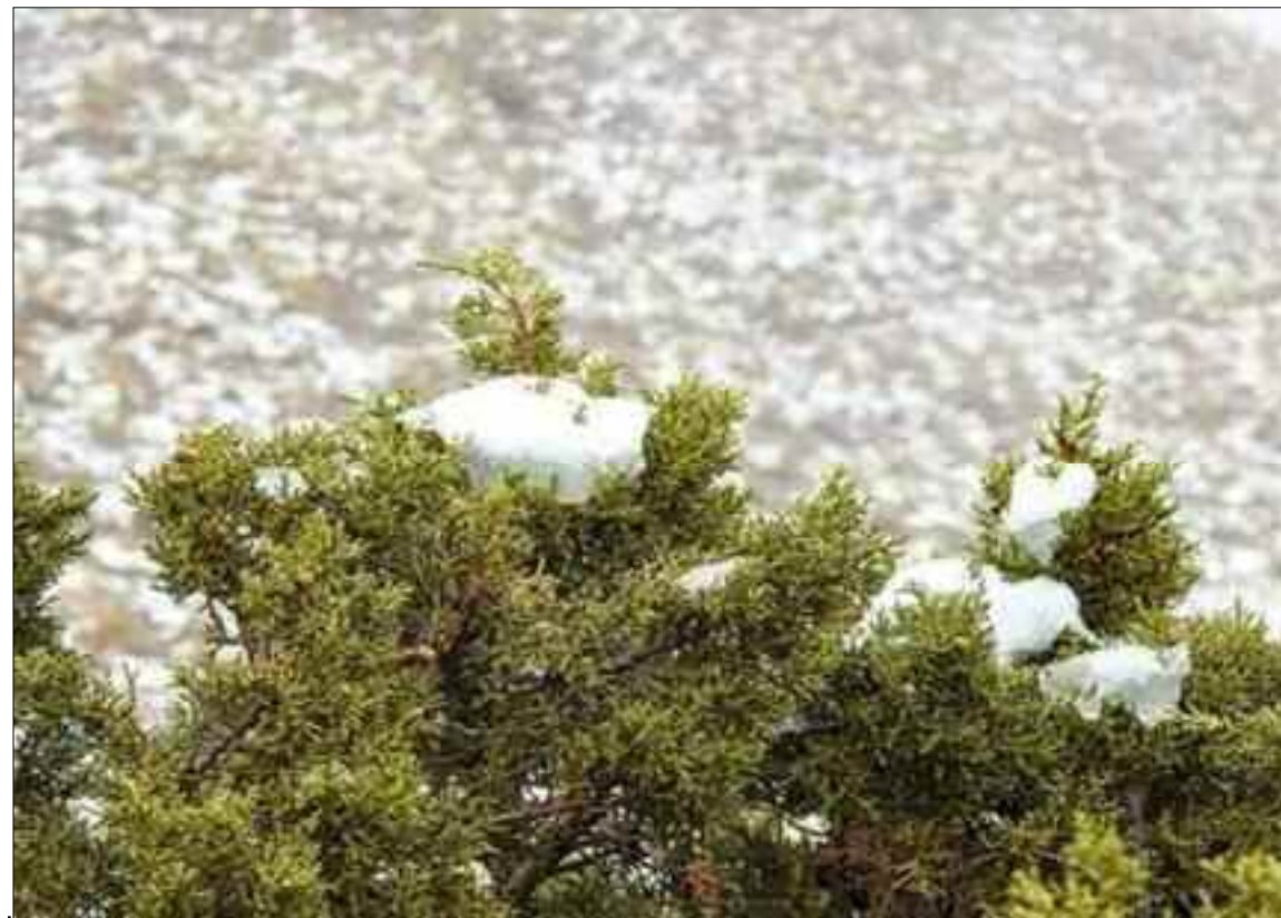
De fines couches de neige ont commencé à couvrir les sommets montagneux de la wilaya de Nâama.

La situation météorologique n'a pas affecté le trafic automobile dans la wilaya, a-t-on fait savoir, hormis un ruissellement constaté au niveau du tronçon de la route nationale n°6 (RN-6) reliant la commune d'El Bayodh