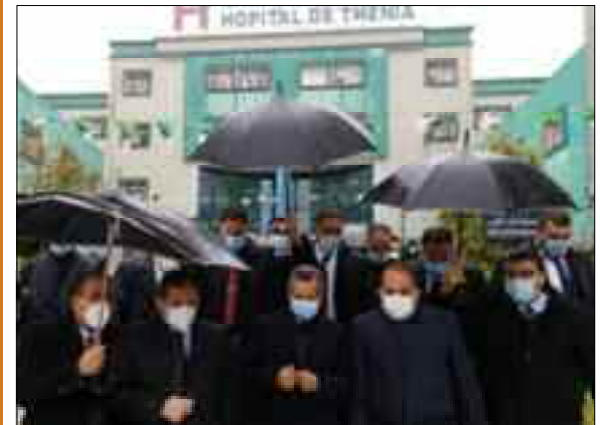
Le ministre de la Santé, de la Population et la Réforme hospitalière, Abderrahmane Benbouzid a annoncé, samedi à Boumerdès, que le taux d'occupation des lits destinés à la prise en charge des malades atteints par la Covid-19 au niveau de cette wilaya, est de près de 60%.