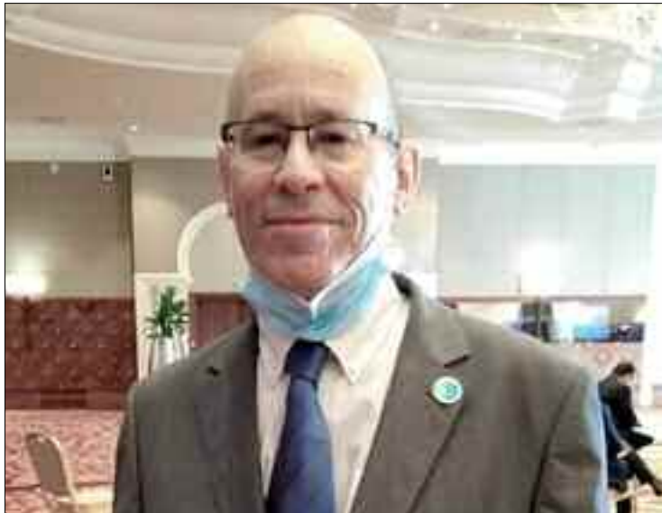
«Les efforts pour surmonter la double crise sanitaire et économique doit être équitablement réparti au niveau des différents acteurs de la société».