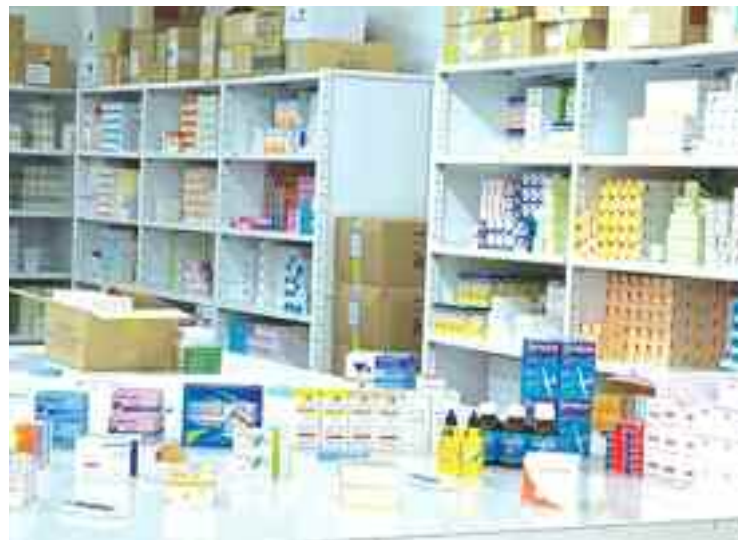
La polémique sur la rupture de «Lovenox» enflamme et relance le débat sur les raisons de cette pression relative aux problèmes d'approvisionnement de médicaments.

La situation sanitaire globale du pays continue de s'aggraver. L'impact de l'épidémie du nouveau Coronavirus ne se résume pas uniquement à l'ampleur de sa progression, mais aussi à celui des effets collatéraux qu'elle cause à tous les autres secteurs, particulièrement, pharmaceutique. Un secteur en souffrance depuis des années.