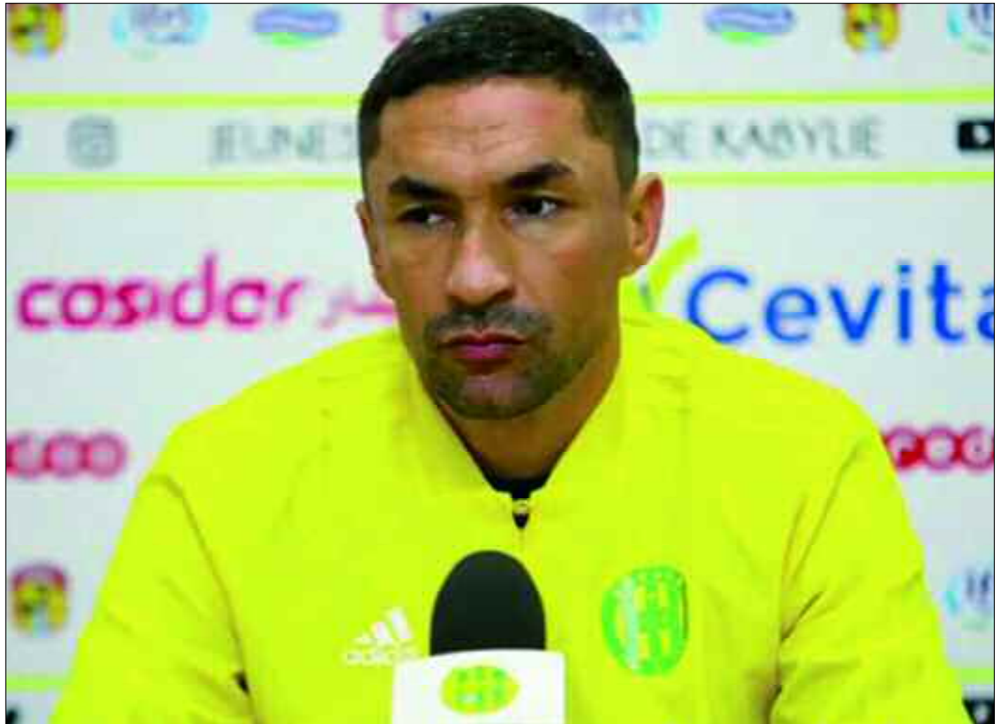
■ Zelfani (JSK) est le 2 e entraîneur à quitter la Ligue 1 après Ciccolini (USMA).