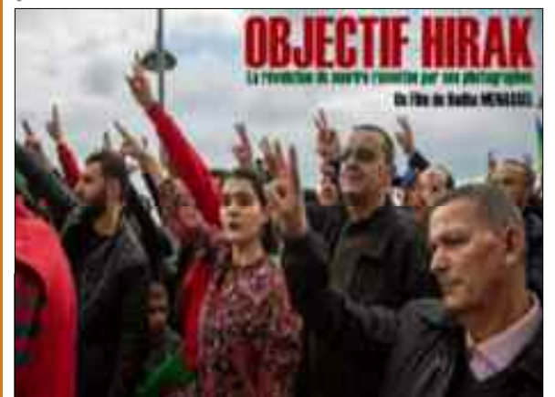
Le court métrage documentaire «Objectif Hirak», réalisé par le journaliste Redha Menassel, a remporté samedi le «Prix du meilleur montage» au «Buddha International Film Festival» qui s'est tenu dans la ville indienne de Pune, a-t-on appris auprès de l'équipe du film.