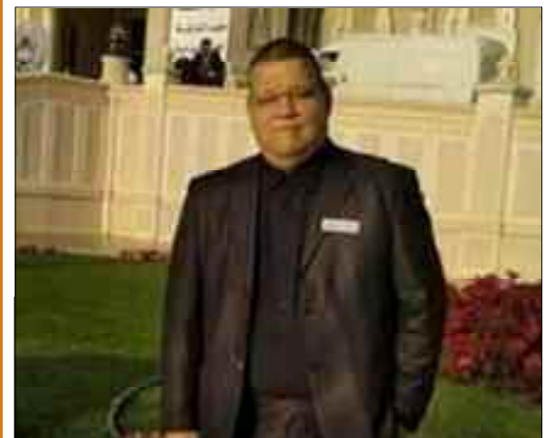
Le comédien Mahmoud Bouhmoum, célèbre pour ses rôles dans des sitcoms est décédé samedi à Alger à l'âge de 57 ans des suites d'une infection au coronavirus, a-t-on appris auprès de ses proches.