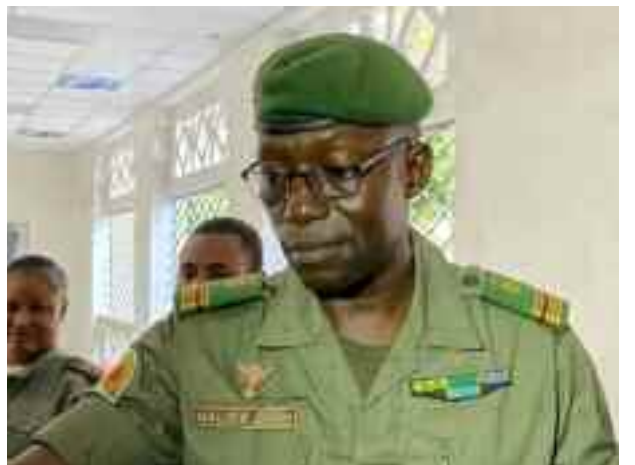
■ Mali : le colonel Malick Diaw, président du CNT.