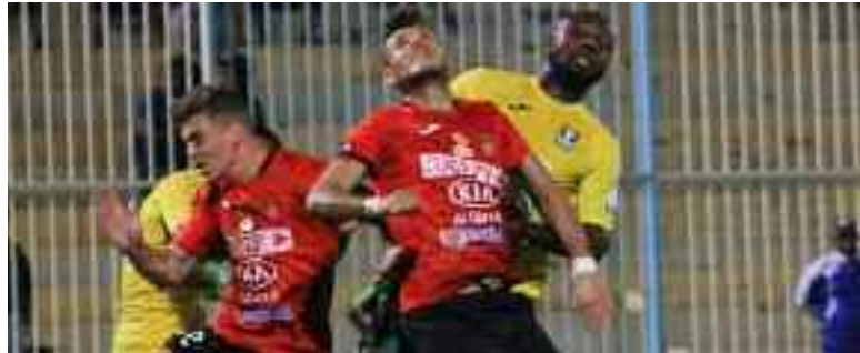
La JSS s'est contentée du partage des points avec l'USMA.

De son côté, la JSS s'est contentée de partager les points avec son adversaire