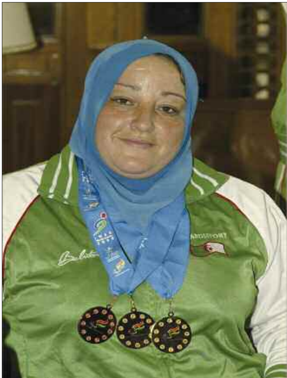
■ Le handisport algérien a inondé l'Algérie de médailles.