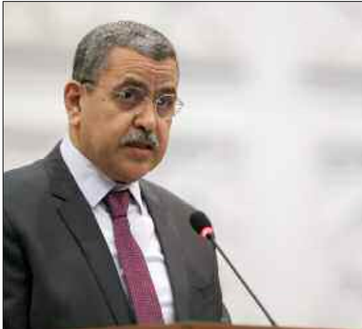
■ Pour l'Algérie, le projet «faire taire les armes» ne saurait aboutir sans l'éradication des résidus du colonialisme en Afrique.

«C'est une démarche qui s'appuie nos efforts de lutte antiterroriste», a-t-il expliqué. Le Premier ministre a mis l'accent sur l'importance de «consolider la concertation afin d'éradiquer l'extrémisme violent, lutter contre le terrorisme et assécher