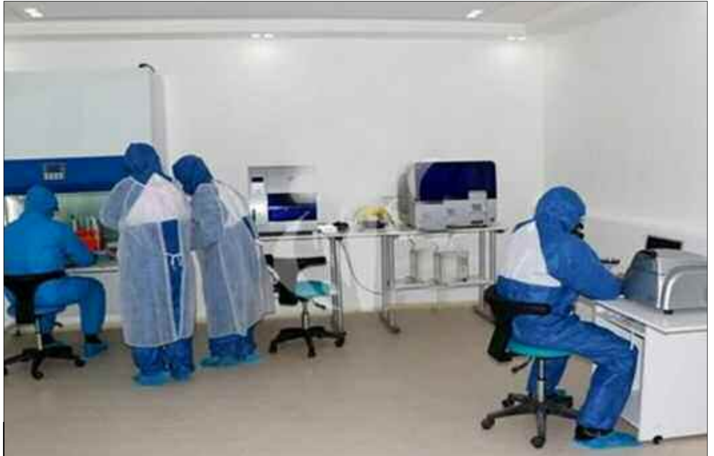
La nouvelle unité des urgences médico-chirurgicales de Mustapha-Pacha constitue une expérience pilote à l'échelle nationale.

Il a précisé que cette nouvelle unité médico-chirurgicale (ex-garderie du CHU Mustapha-Pacha), dont les travaux sont en cours, sera un petit hôpital pilote pour la prise en charge optimale des cas urgents en vue d'alléger la pression sur les deux services d'urgences du même hôpital. Une enveloppe financière a été mobilisée par la wilaya d'Alger pour la réalisation des travaux sur 3 étages afin d'aménager des salles de soins, d'orientation, et de réanimation aux normes in-