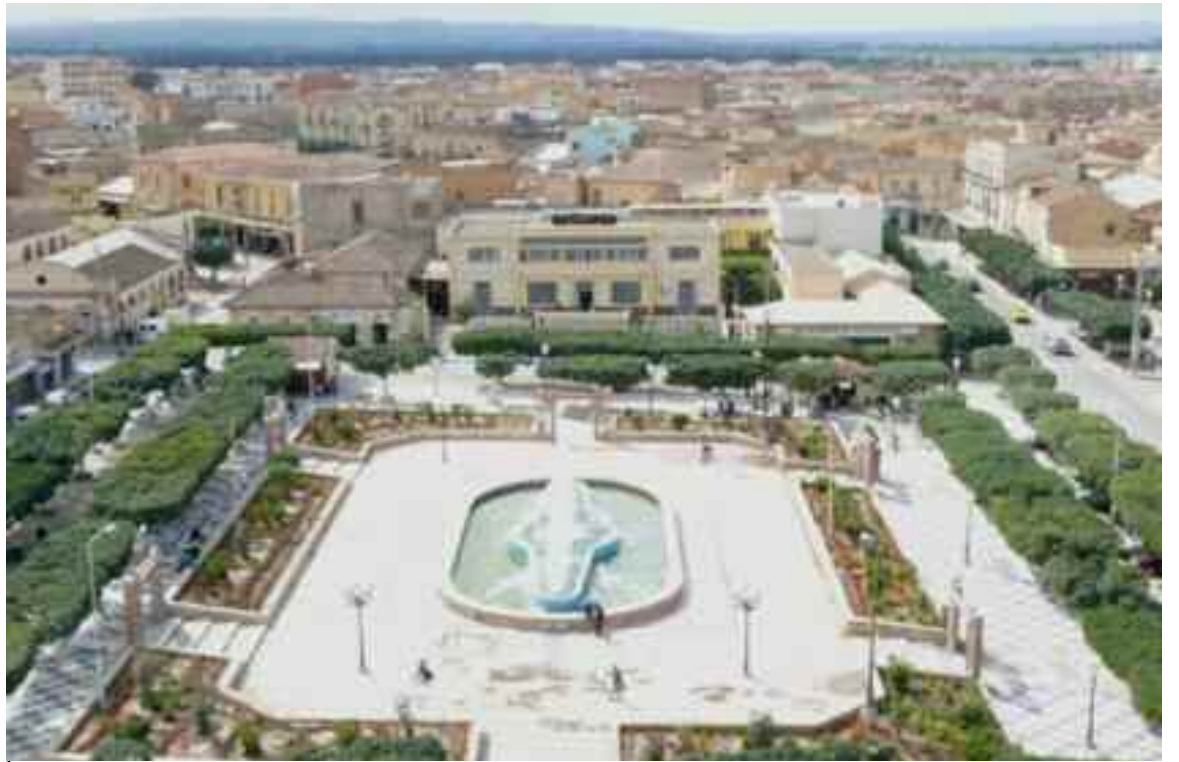
Relizane : campagne de nettoyage et d'enlèvement d'ordures dans la commune de Dar Ben Abdallah.

Pour instaurer un environnement sain, une grande opération de nettoyage et d'enlèvement d'ordures, ayant mobilisé les moyens nécessaires comme les camions, les tractopelles, impliquant le CET, la DTP, la DRE, les services de l'APC, des citoyens et des associations, a été menée au niveau de la commune de Dar Ben Abdallah, relevant de la daïra de Zemmoura qui compte près de 15.000 habitants, en ce début de semaine pour débarrasser les endroits où étaient entreposés les dépotoirs ici et là d'ordures ménagères, du fait de l'insuffisance des bacs à ordures.