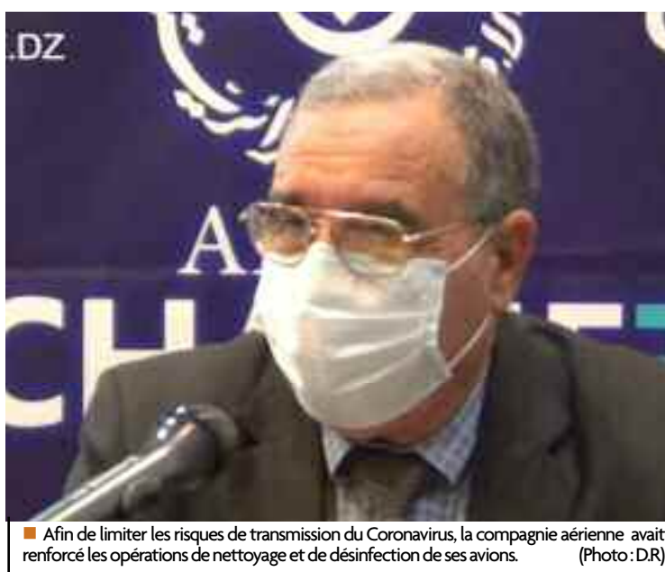
■ Afin de limiter les risques de transmission du Coronavirus, la compagnie aérienne avait renforcé les opérations de nettoyage et de désinfection de ses avions.

Revenant sur la reprise, depuis hier dimanche, des vols domestiques qui concerne, rappelle-t-on, la totalité des dessertes de et vers les wilayas du Sud du pays et, dans une première étape, 50% des vols desservant celles du Nord du pays, mais aussi de