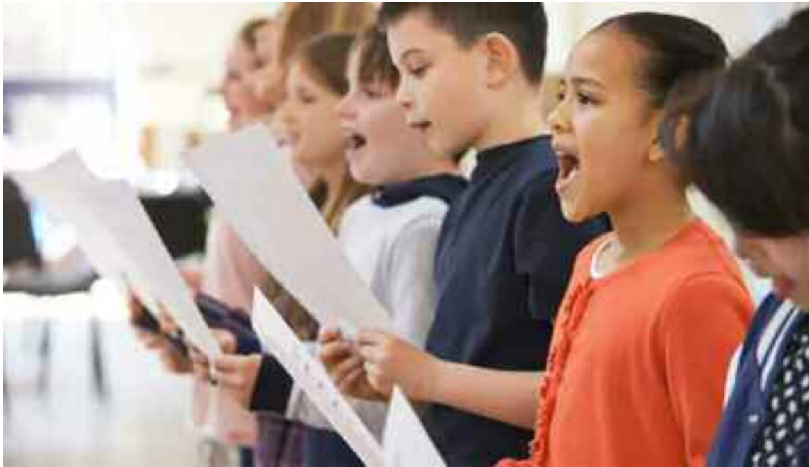
Mais si cet atout est capital, il n'est cependant pas suffisant, il faut avoir la maîtrise de la langue en ayant le pouvoir de la plier à l'exigence des idées.

Le livre sacré des musulmans est la parole de Dieu Tout Puissant, composé dans un langage recherché. Que de fois on le chante,