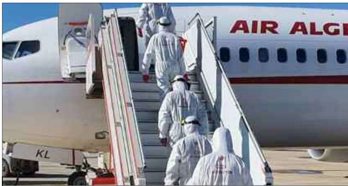
Le P-dg de la compagnie Air Algérie n'a pas caché son optimisme quant à réaliser une certaine amélioration.

«Cette opération, approuvée par le Gouvernement en 2018, est suspendue en raison des derniers