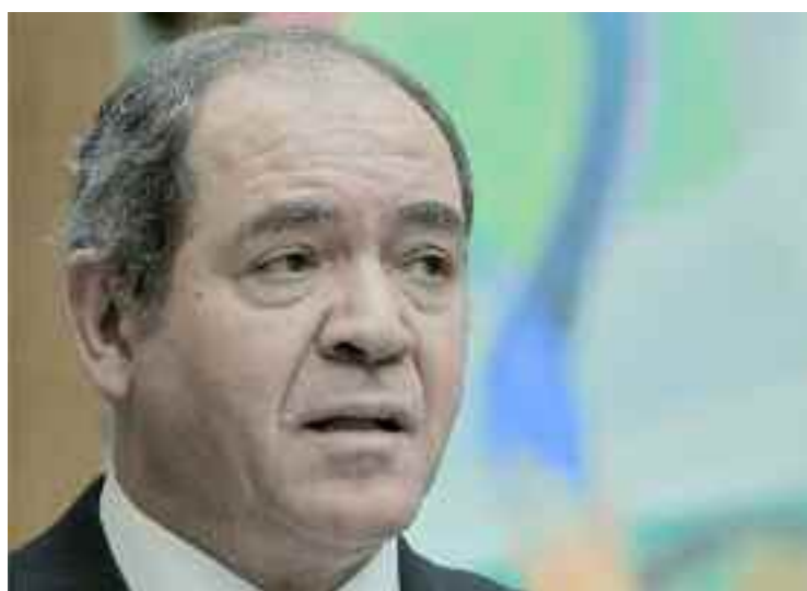
■ L'Algérie n'a jamais démantelé les derniers droits de douane prévus initialement en 2017 avant d'être repoussés au 1 er septembre écoulé.

Aujourd'hui, l'Algérie est convaincue de l'impératif de revoir certains points de l'Accord d'association avec l'UE afin de mettre son intérêt en avant. «En tant que négociateurs algériens, nous sommes assez conscients des manquements en matière de l'application de l'accord d'association notamment dans son aspect commercial. L'essentiel qu'il y a une volonté de dialogue de part et d'autre et il est évident que quand il y a déséquilibre nous intervenons pour le corriger», a déclaré le ministre des Affaires étrangères, Sabri Boukadoum, en marge des travaux de la 12 ème session du Conseil d'association Algérie-UE par visioconférence, hier. Il a réitéré, à cet effet, la disposition de l'Algérie à poursuivre les négociations jusqu'à trouver un compromis sur un principe équilibré «gagnant-gagnant» et non «gagnant-perdant». L'Accord d'Association a été signé avec l'Union européenne et revu à maintes reprises en raison des réserves émises particulièrement par les opérateurs économiques qui ont critiqué plusieurs aspects notamment commerciaux de cet accord. Ils se sont sentis exclus des négociations. Ils