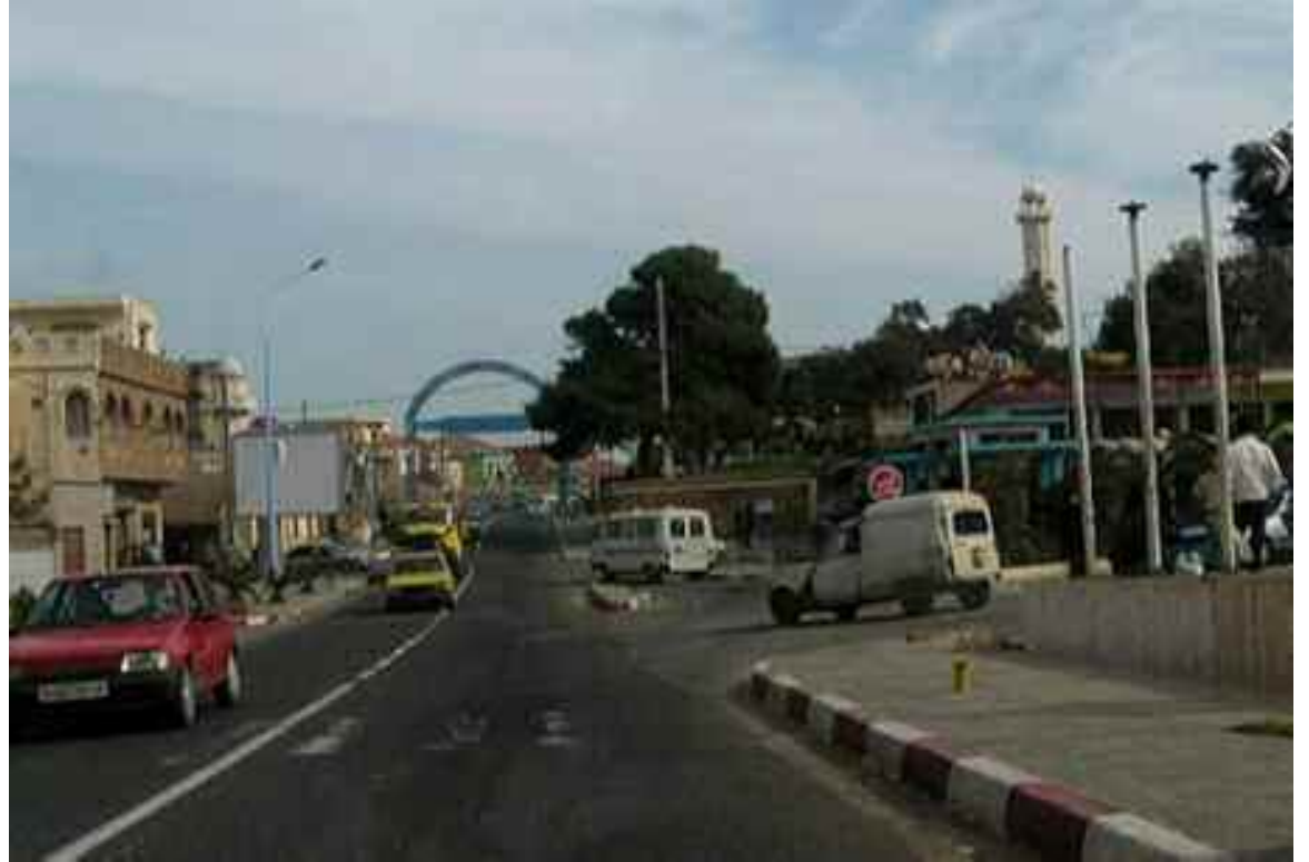
Campagne de prévention sanitaire au profit des écoles primaires enclavées de la wilaya de Tipasa.

Ainsi, des activités récréatives sont attendues dans le programme pour sensibiliser cette action et, le cas échéant, faire passer le message parmi les audi-