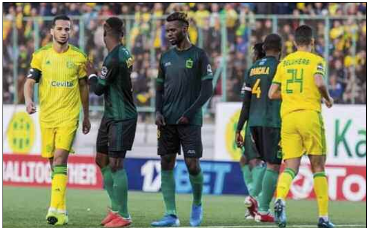
■ La JS Kabylie débute contre la Gendarmerie nationale du Niger.

Chamboulés par la pandémie de la Covid-19, les matches se disputeront, une fois de plus à huis clos, ce qui amène une partie des rencontres à être disputées dans un silence de béton. Ce sera certes un exercice difficile à accepter, mais la santé des joueurs demeure l'un des priorités. Les fans des équipes commencent dès mainte-