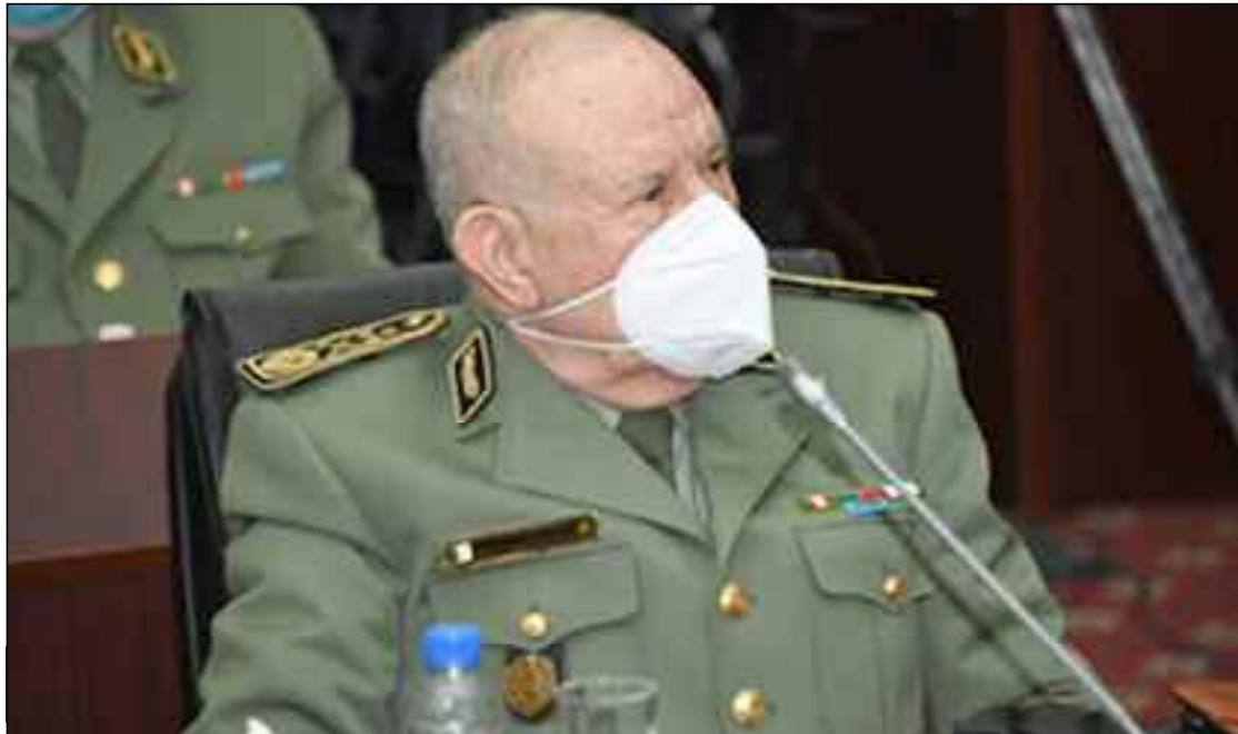
■ Chanegriha, a expliqué que «de telles positions honorables ne sont pas étrangères aux valeurs de notre ANP, digne héritière de l'Armée de libération nationale (ALN)».

la gestion des risques majeurs, à l'instar de sa participation efficace, lors des tremblements de terre ayant touché les villes de Chlef en 1980 et Boumerdès en 2003, ainsi que lors des inondations de Bab El-Oued à Alger en 2001, le général de Corps d'Armée, Saïd Chanegriha, a expliqué que «de telles positions honorables ne sont pas étrangères aux valeurs de notre ANP, digne héritière de l'Armée de libération nationale (ALN), qui était et restera toujours aux côtés de notre vaillant peuple, glorifiant le lien Armée-Nation et répondant, comme à son accoutumée, à l'appel du devoir national, à travers la mobilisation de toutes ses potentialités humaines et matérielles, et la capitalisation de sa