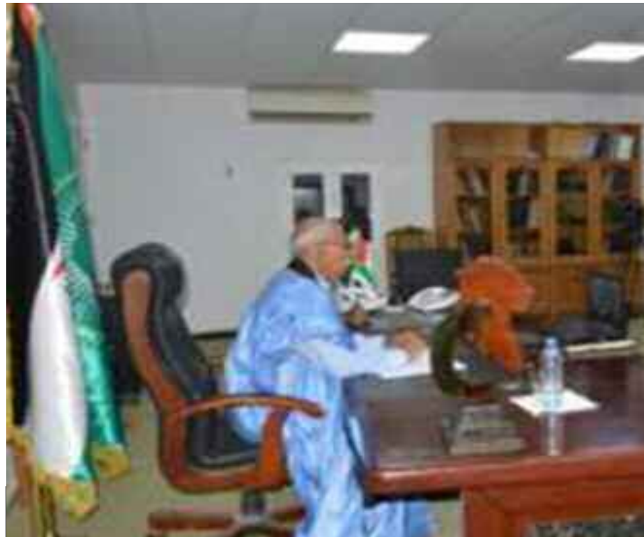
Brahim Ghali appelle l'UA et le CPS à assumer leurs responsabilités au Sahara occidental.

Réagissant aux fausses allégations formulées par le président de la délégation marocaine lors des travaux du Sommet, le président sahraoui a réaffirmé que «la République sahraouie n'est pas marocaine», invitant par là même le ministre délégué auprès du ministre des Affaires étrangères et de la Coopération internationale chargé de la Coopération africaine, Mohcine Jazouli, à se conformer et se référer aux déclarations de l'UA et l'ONU. M. Ghali a déploré «le fait que le sommet n'ait pas pris de positions pré-