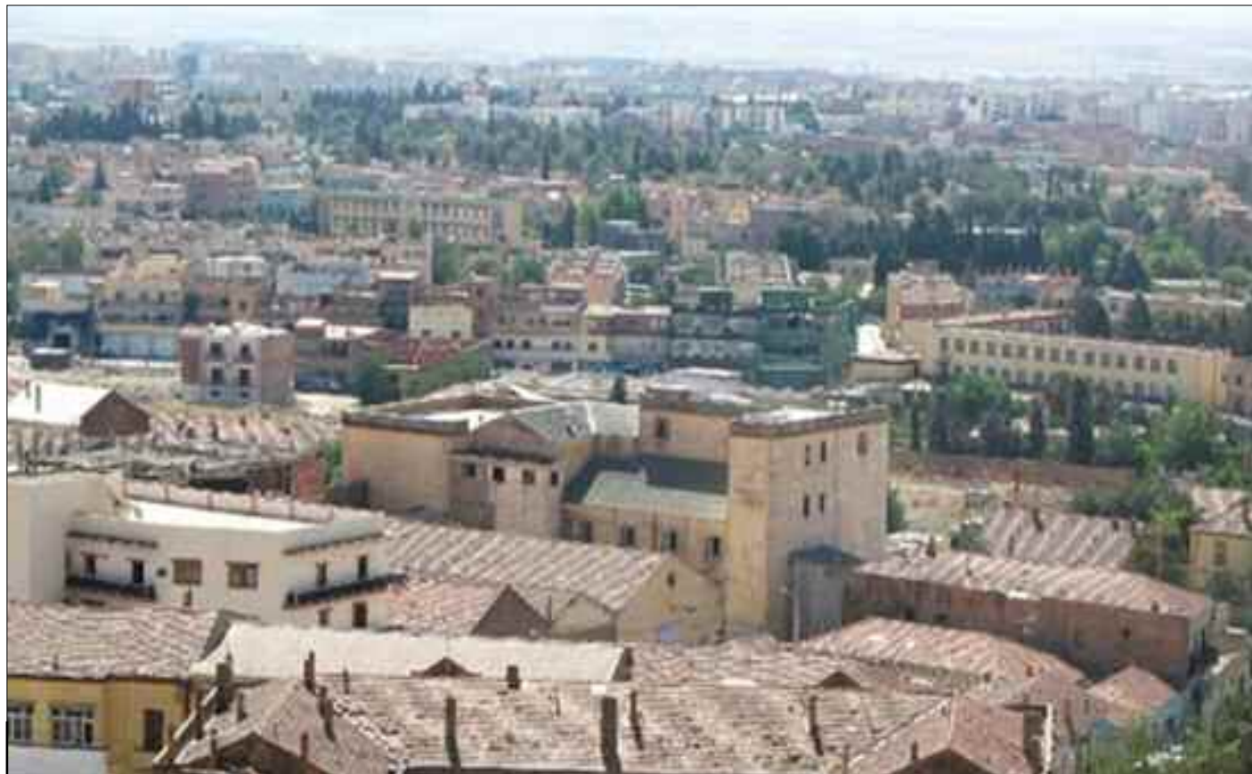
Inauguration à Tiaret d'un nouveau centre régionale de la télévision algérienne.

Ceci, en plus de l'impact positif qu'il ne manquera pas de susciter sur l'impulsion de la dynamique de développement dans la wilaya de Tiaret qui renferme d'importants atouts, a estimé le wali