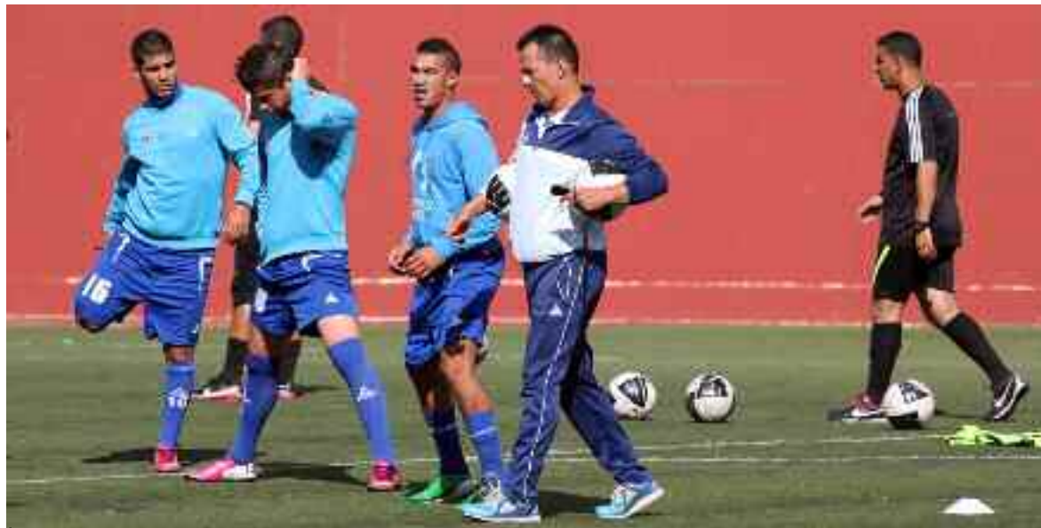
Le WAT parmi les premiers à recevoir leurs licences professionnelles.

«La Fédération algérienne de football s'apprête, par le biais de la direction de contrôle de gestion et des finances, à remettre aux clubs de la Ligue 1 les licences professionnelles pour la saison 2020/2021. Cette remise sera faite aux Sociétés sportives par actions ayant déjà satisfait tous les préalables établis pour l'octroi de la LCP, à savoir : la JS Saoura, la JS Kabylie, le Paradou AC, le NC Magra, le WA Tlemcen et l'AS Aïn M'lila», a indiqué l'instance fédérale dans ce communiqué, diffusé sur son site officiel. «Les autres clubs, dont le dossier est incomplet, recevront leurs licences ultérieurement», a ajouté la FAF, en précisant que trois parmi ces 14 clubs n'ont que deux documents à remettre pour être au complet, alors que pour les autres, «le nombre de pièces manquantes