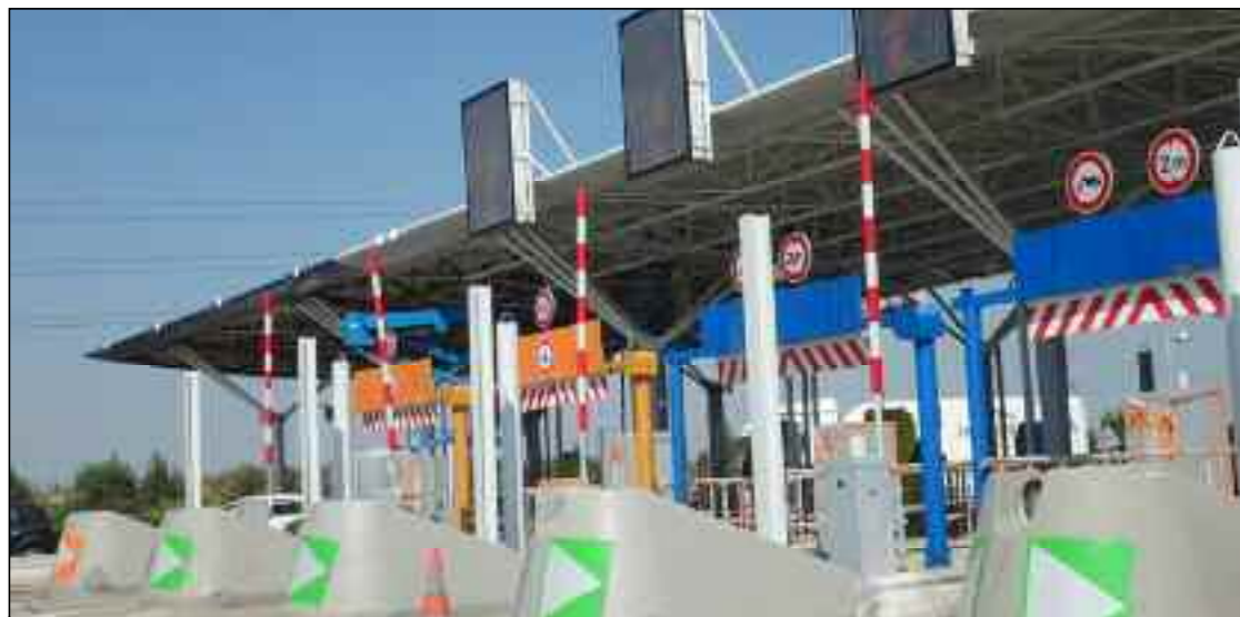
Le Gouvernement a entendu un exposé présenté par le ministre des Finances relatif à deux projets de Décret exécutifs.

Lors d'une réunion du gouvernement qui s'est tenue par visioconférence sous sa présidence, M. Djerad a «donné des instructions pour la finalisation, avant la fin de l'année 2021, du dernier tronçon de l'autoroute Est-Ouest avec la mise en service des stations de péages», est-il noté dans le communiqué. Conformément à l'ordre du jour, les membres du Gouvernement ont examiné trois projets de Décrets exécutifs présentés par le ministre des Finances ainsi que par le ministre des Travaux publics. Le Gouvernement a entendu un exposé présenté par le ministre des Finances relatif à deux projets de Décret exécutifs fixant : (I) les modalités d'établissement de l'état des effectifs accompagnant le projet de loi de finances de l'année (II) les conditions de rétablissement de crédits. Le premier projet de Dé-