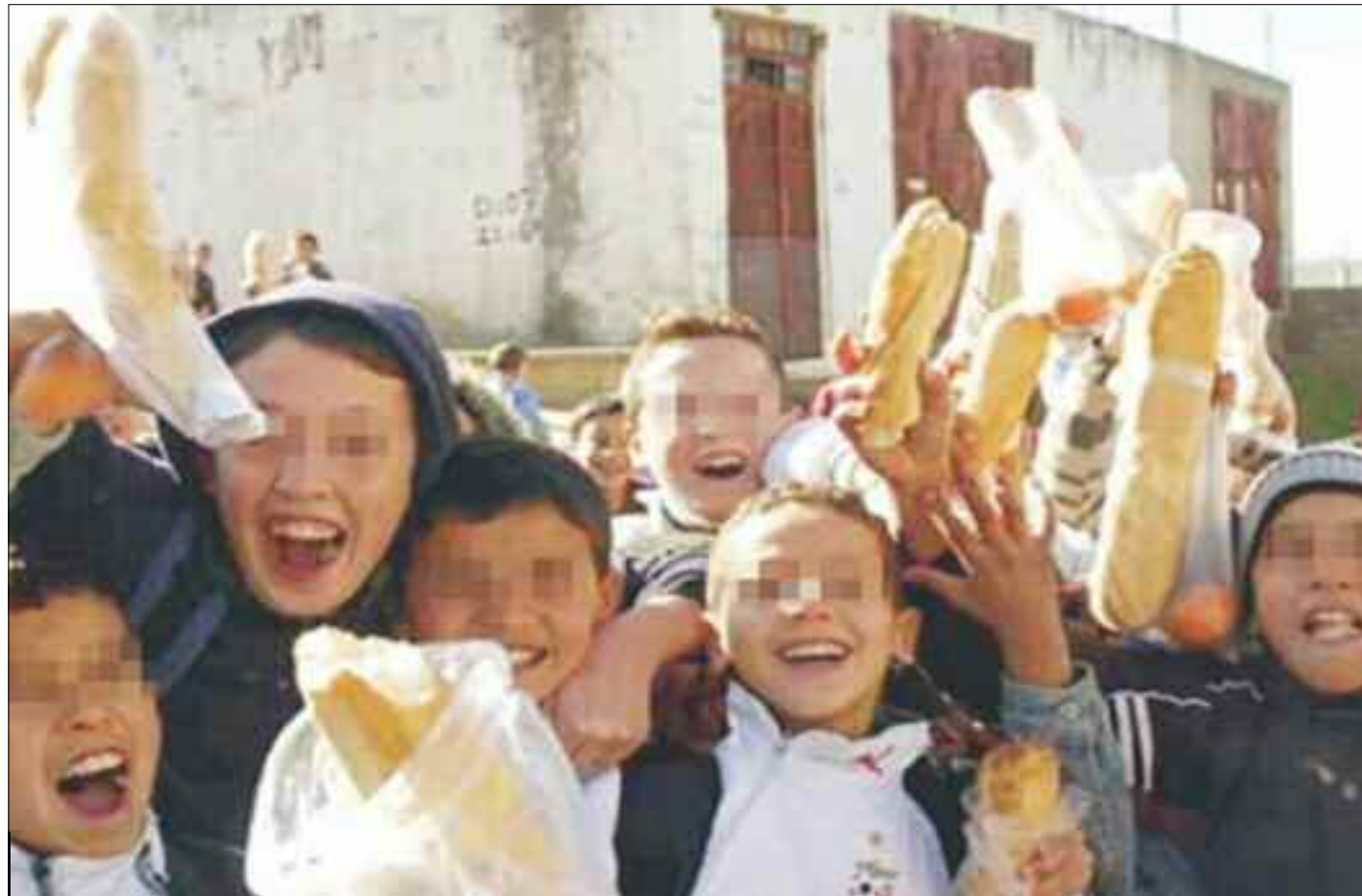
■ Les établissements scolaires de la région souffrent du manque d'équipements dans les cantines.

Le manque d'équipements dans les cantines a été aussi soulevé dans cette commune. Par ailleurs, le problème de la surcharge des classes plane toujours sur de nombreux établissements sur les hauteurs