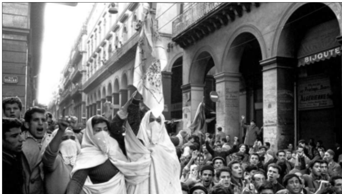
■ Drapeaux algériens brandis très haut, les manifestants poursuivent leur marche encouragés par les youyous stridents des femmes.

Durant ces jours d'hiver particulièrement rigoureux, des femmes, des enfants et des adolescents dont nombre d'entre eux avait ou un frère ou une sœur, ou un père, ou plusieurs membres de la famille et proches, emprisonnés, ou au maquis, ou tombés au combat sont sortis dans les rues, brandissant le drapeau vert et blanc, frappé de l'étoile et du croissant rouges, qui ornera par la suite, toutes les manifestations pour l'indépendance, organisées en divers points du territoire. Les Algériens sont entrés dans cette bataille avec des slogans et des inscriptions qui ne laissent aucun doute sur la revendication de l'indépendance totale, rejetant et le mot d'ordre des ultracoloniaux, «Algérie française», et celui, ambigu, de la troisième voie, «Algérie algérienne», suggéré par De Gaulle, alors président français. Les manifestants ont affronté les mains nues l'appareil de répression colonial français. Les envoyés spéciaux de la presse française reconnaissent qu'il s'agissait d'une explosion populaire qui démentait toutes les constructions de la propagande colonialiste et sonnait le glas de la «troisième force» que De Gaulle voulait opposer au FLN. Les 10, 11 et 12 décembre 1960, furent les «trois jours qui ébranlèrent la France», selon les termes du journaliste français, Claude Estier. Les manifestations pour l'indépendance de leur pays que les Algériens ont lancé en décembre 1960, ont mis en échec la tentative du gé-