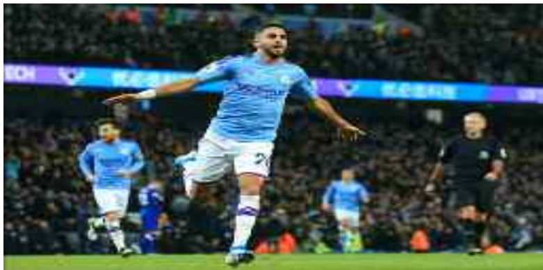
■ Mahrez et Man City étaient qualifiés avant cette ultime journée.

Qualifiée avant cette ultime journée, l'équipe anglaise de Manchester City n'a pas fait dans la dentelle pour dominer mercredi les Français de l'Olympique Marseille (3-0) et terminer en tête du groupe C avec 16 points, devant le FC