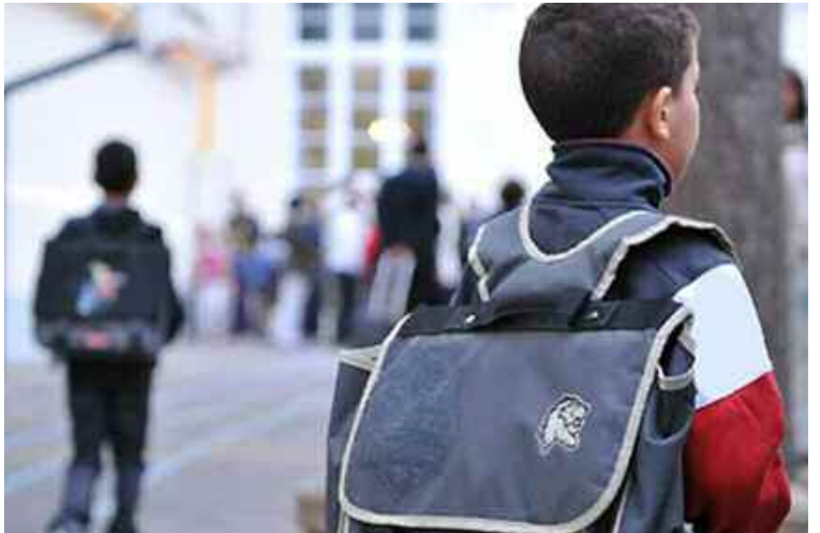
Des personnes étrangères à l'éducation occupent les logements d'astreinte de l'établissement.

En effet le mur le plus long longe les classes de l'établissement et il est sorti de son axe de 15 centimètres, tandis que l'autre mur qui ceinture les logements d'astreinte est sorti de son axe de 45 centimètres, d'où le risque de s'effondrer à n'importe quel moment du fait que les deux murs entourent le portail d'entrée de l'école. Des dizaines de parents d'élèves sont à la rentrée et à la sortie devant cet établissement pour accompagner leurs progénitures et par conséquent eux aussi sont en danger permanent. Pourtant, la directrice de l'établissement a envoyé plusieurs requêtes à l'APC de Hadjout, la daïra de Hadjout ainsi qu'à la direction de l'éducation nationale de la wilaya de Tipasa pour les alerter sur le danger qu'encourent les élèves en date du 12 octobre 2019, 20 octobre 2019 et le 26 novembre 2019. Jusqu'à ce jour, aucune réponse n'a été émise sinon un silence qui en dit long.