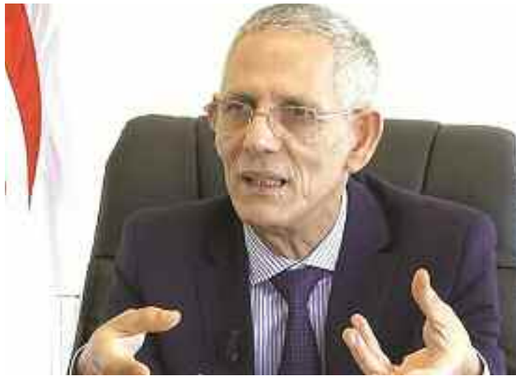
■ L'Etat ne peut supporter davantage les pannes répétitives de trésoreries de l'Eniem dont l'activité est à l'arrêt pour une période d'un mois.

Pour qu'elles ne disparaissent pas, le ministre de l'Industrie, Ferhat Ait Ali parle de recapitalisation des entreprises publiques mises à mal par les multiples crises de trésorerie, évoquant les options de leur désendettement afin de les sauver.