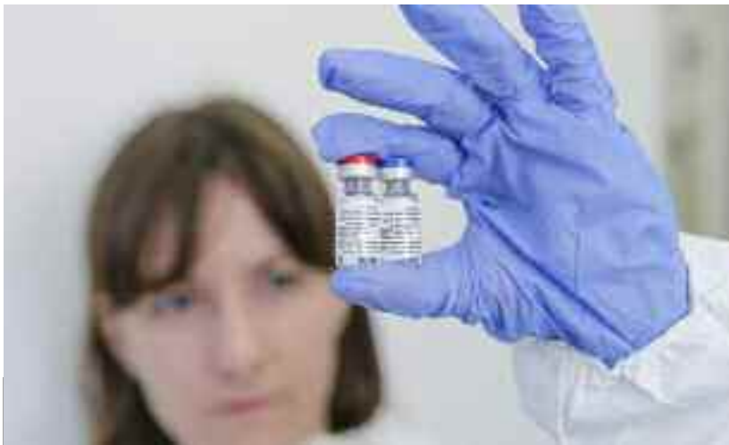
La Russie est prête à produire son vaccin Sputnik V en Algérie

l'Ouzbékistan, le Qatar, Singapour, la Syrie, le Tadjikistan et la Thaïlande. Le Sputnik V a été développé par le centre de recherche Gamaleïa. Les