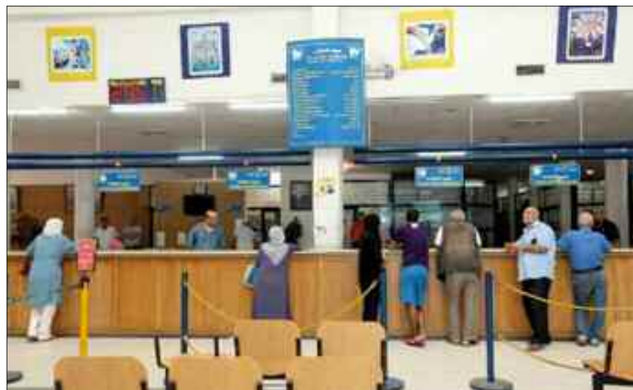
■ Des mesures préventives ont été prises par la direction d'Algérie Poste pour la protection des travailleurs.