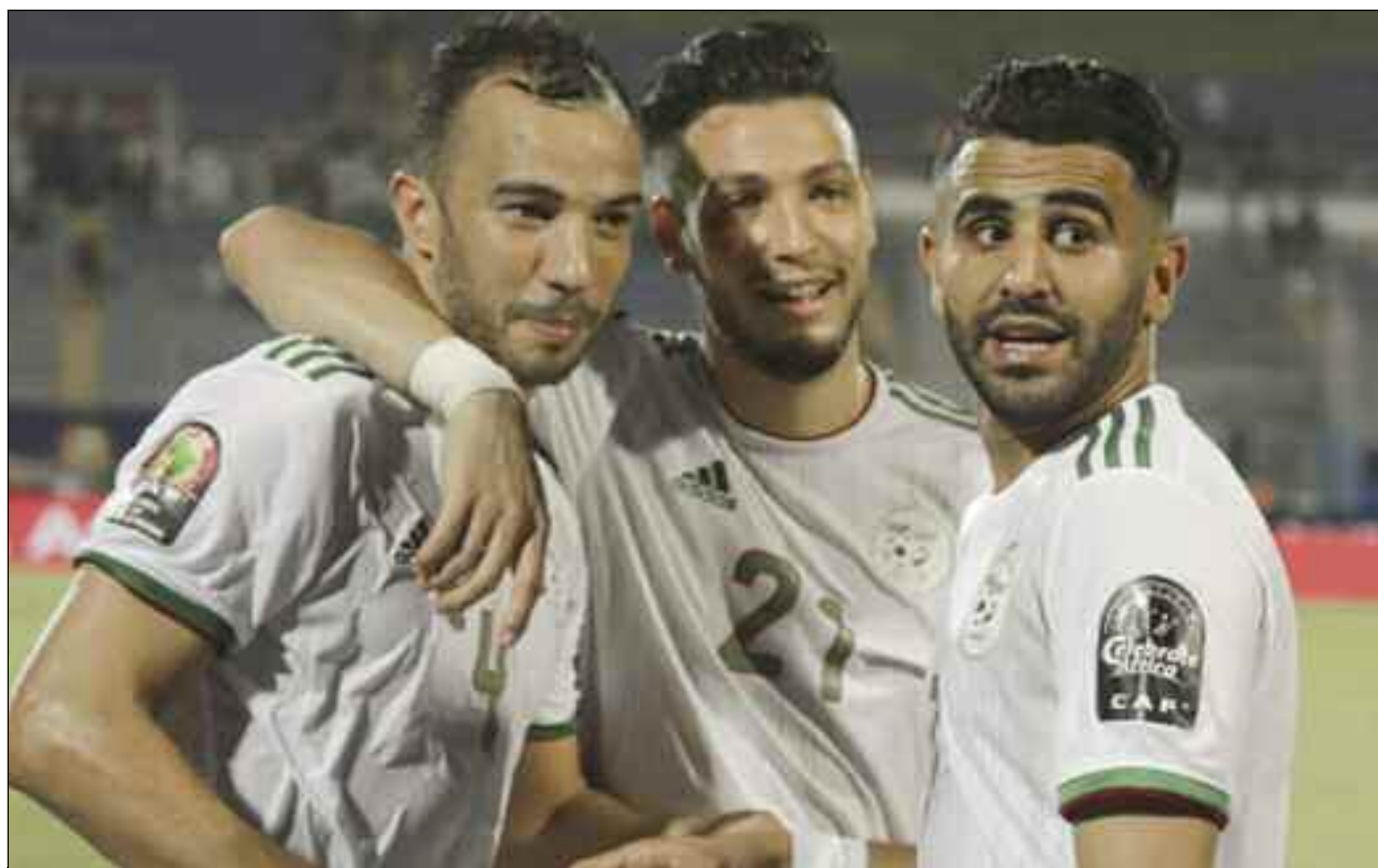
■ L'Algérie boucle l'année à la 31 e place.

Le titre de «Progression de l'Année» va à la Hongrie et ses 44 points. Le Burundi fait le plus grand bond en avant, en termes de places. Ainsi, on notera qu'en 2019 il y avait 1 082 rencontres internationales «A» disputées, soit le total le plus élevé depuis l'introduction du classement en 1993, signale la FIFA qui remarque qu'à l'inverse, 352 matches ont eu lieu en 2020. Jamais depuis 1987 (323 matches), aussi peu de matches se sont déroulés au cours d'une année civile. 2020 a certes été grandement perturbée, il n'en demeure pas moins que la Belgique remporte pour la troisième fois consécutive, le titre d'Équipe de l'année du classement mondial FIFA/Coca-Cola. Plus en détails, et pour situer la place qu'occupe la Belgique, la Fifa explique que les «Diables rouges» enregistrent six victoires sur les huit matches joués en 2020. Les trois poursuivants - la France (2 e ), le Brésil (3 e ) et l'Angleterre (4 e ) ne bougent pas de leurs places respectives. Le seul changement dans le Top 5, par rapport à 2019, est le Portugal qui fait son apparition à la 5 e place de la hiérarchie mondiale. L'Algérie occupe, quant à elle, la 31 e place alors qu'en 2014, elle occupait la 18 e place, sa mauvaise place s'est située en 1999, soit à la 86 e .