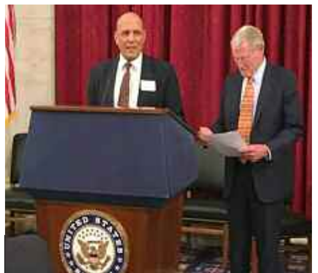
Trump reconnaît la marocanité du Sahara occidental.