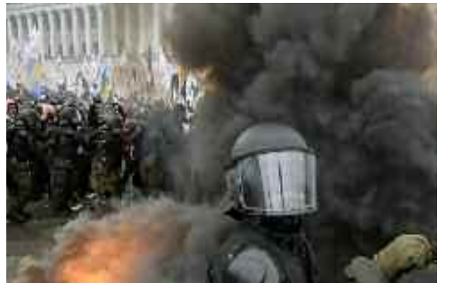
■ Manifestations anti-confinement à Kiev.