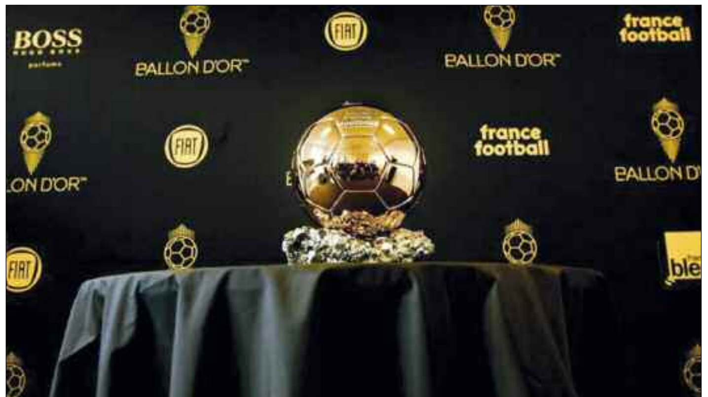
■ Le Ballon d'or devra attendre encore.

Le report d'une compétition telle que l'Euro 2020 avait quelque peu rebattu les cartes, et quelques joueurs, auteurs d'une saison exceptionnelle, auraient pu prétendre à ce trophée, «Je pense qu'un joueur comme l'attaquant français Karim Benzema du Real Madrid aurait toutes ses chances, au regard de ce qu'il peut faire. Je pense que