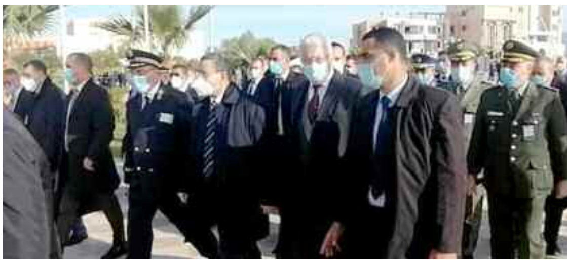
«Nous avons entamé, il y a quelques mois, à travers nos canaux diplomatiques et nos médecins, les contacts avec les laboratoires de production, et examinons les moyens de choisir le vaccin qui sera utilisé dans notre pays».

Revenant sur l'acquisition du vaccin anti-Covid-19, Abdelaziz Djerad, considère que l'existence d'un vaccin ne doit pas être synonyme de relâchement. Réaffirmant que l'Algérie acquerra le vaccin présentant des garanties certaines.