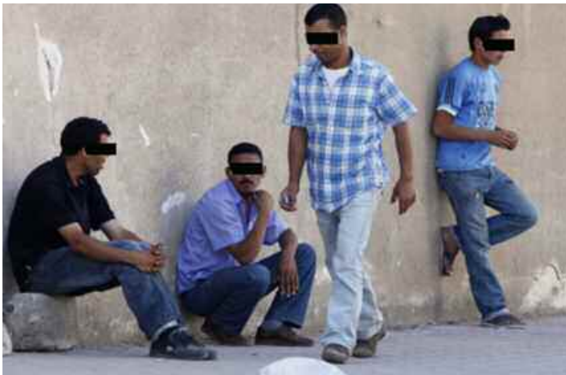
Les chômeurs de Relizane exigent des emplois pérennes à la hauteur de leur qualification.

Ils demandent à ce qu'ils soient recrutés selon les qualifications de chacun d'eux. Selon les protestataires, cette entreprise n'a jamais employé les jeunes de plusieurs localités depuis qu'elle a ouvert ses portes, et ce en dépit des nombreuses demandes qui y ont été déposées. Ce fait a été très positivement commenté par tous ceux qui se trouvaient aux abords de routes ralliant la zone industrielle de Sidi Khettab au centre-ville de Relizane. «Dire non à tout ce qui nous divise», a crié un passant. Ces jeunes, estiment que le rassemblement du jour et celui organisé à Relizane devant la direction de l'Emploi, au cours de ce mois sont un message d'espoir pour une nouvelle ère à la région de l'Est de Relizane. «Nous voulons d'une ère