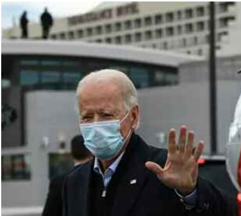
■ Lancement de la campagne nationale de vaccination aux Etats-Unis.

Dans le même temps, le pays, confronté à un rebond spectaculaire de l'épidémie depuis plus d'un mois, a déploré 2.706 morts de la maladie, selon un relevé effectué chaque jour à 20h30 locales par l'AFP des chiffres de l'univer-