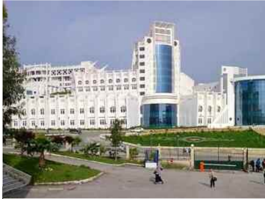
■ L'université Larbi Ben M'hidi d'Oum El Bouaghi compte 3.300 nouveaux inscrits au titre de l'année universitaire 2020-2021.