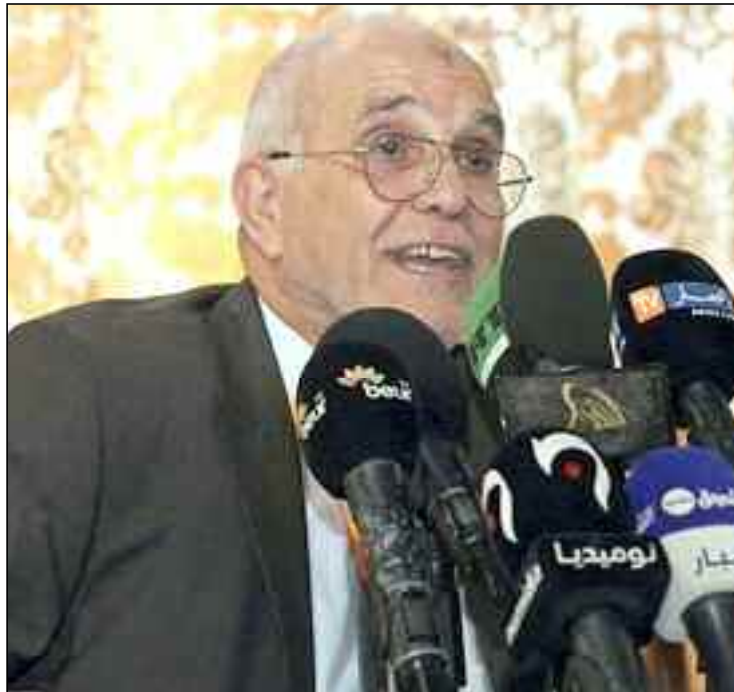
■ En matière d'élections, le Président Tebboune veut une rupture totale avec les mauvaises pratiques du passé.

Le président de l'Autorité nationale indépendante des élections (ANIE), Mohamed Charfi, a fait savoir, lors de son passage lundi soir à la télévision publique, que la Constitution ne fixe pas de délai-butoir au président de la République pour la signature du