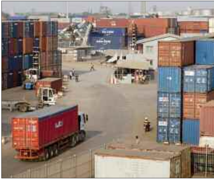
«Le début des échanges commerciaux dans le cadre de la ZLECAf est la réalisation d'un rêve».

Entrée en activité, la zone de libre-échange intercontinentale africaine (ZLECAf) offre d'importantes perspectives à l'Algérie qui souhaite profiter des potentialités qu'offre le marché africain.