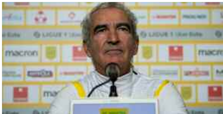
Domenech heureux de retrouver le terrain.

→ Dans une conférence de presse animée au lendemain de sa première prise de contact et séance d'entraînement avec l'équipe du FC Nantes, l'ancien sélectionneur de l'équipe de France, Raymond Domenech qualifie très vite sa première sortie de «bonheur». Mieux encore, il trouvera vite les mots qu'il faut pour faire partager avec les dirigeants et les supporters en disant «je suis venu ici égoïstement pour me faire plaisir».