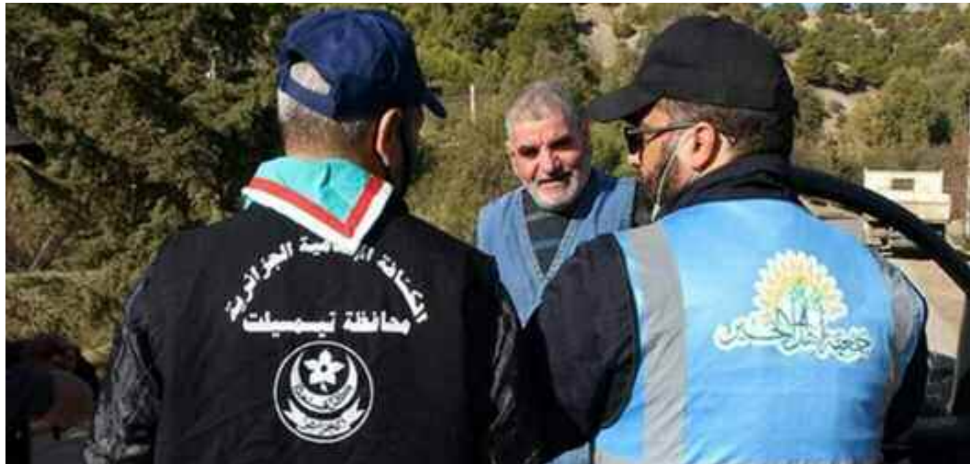
Les associations caritatives locales continuent de mener un grand effort de prévention sanitaire et de sensibilisation des citoyens.