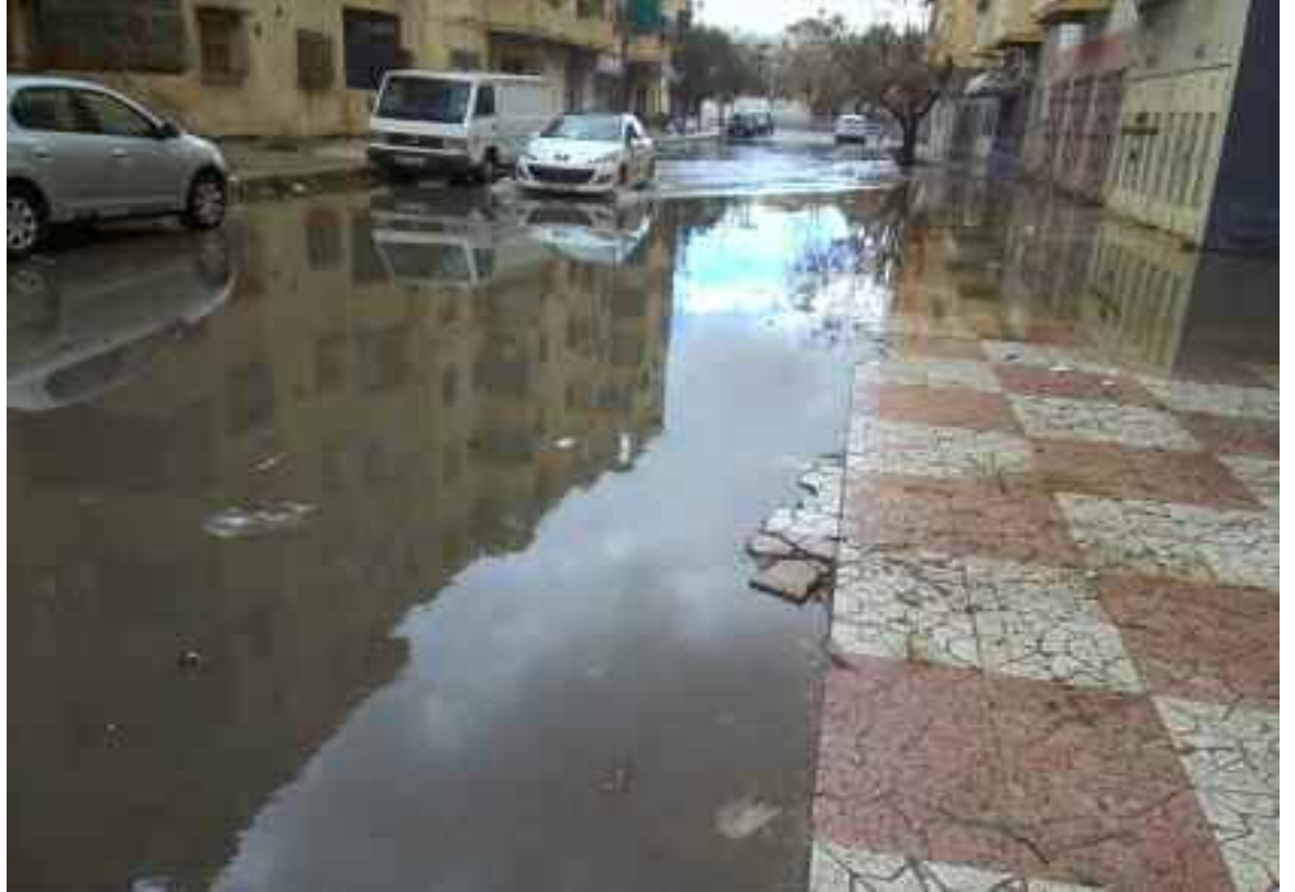
■ A Sidi Djillali, à cause des intempéries, les égouts débordent en raison de l'absence d'entretien.

Les services de l'Office national de l'assainissement nettoient, ou croient nettoyer au regard de cette eau qui reprend son cours temporairement, s'en vont, et les eaux usées refont surfaces après seulement deux ou trois jours. Semblable au jeu du «chat avec la souris». Les