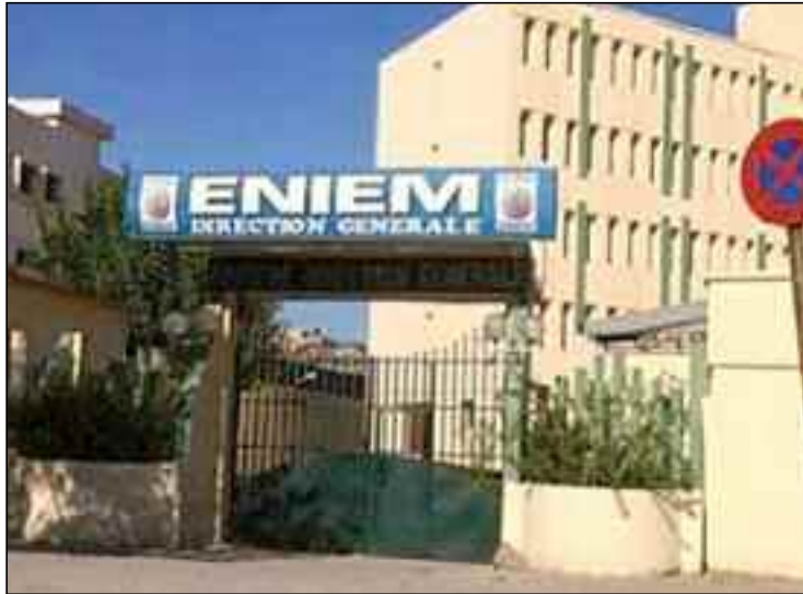
La relance de l'entreprise et sa restructuration exige des fonds au vu des dettes qui pèsent sur cette entreprise.

«Nous lançons un appel à tous les travailleurs et travailleuses