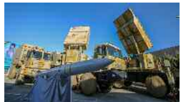
Les factions palestiniennes condamnent la normalisation.