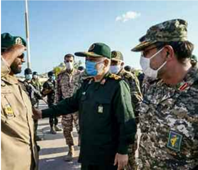
Hossein Salami, chef des Gardiens de la révolution islamique d'Iran.

Les tensions entre les Etats-Unis et l'Iran ont augmenté à l'approche de l'anniversaire de l'assassinat du puissant général iranien Qassem Soleimani, chef de la force Qods tombé en martyr suite à une frappe américaine à Bagdad le 3 janvier 2020. L'Iran avait alors riposté en tirant des missiles sur des bases américaines en Irak. Fin novembre, le