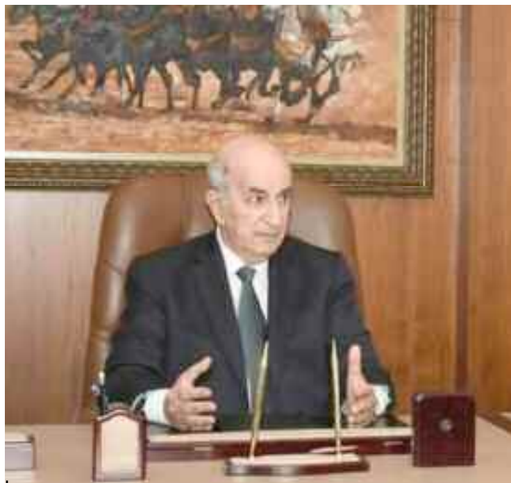
■ Tout se passe bien entre les deux pays comme le prouvent l'échange de visites au plus haut niveau.

En effet, le ministère de l'Intérieur, des Collectivités locales et de l'Aménagement du territoire (Miclaf) et l'Agence allemande de coopération (GIZ) ont procédé en décembre dernier à Alger à la signature du contrat d'exécution du projet «communes vertes» afin d'appuyer les communes dans leurs efforts de développer l'utilisation des technologies d'efficacité énergétique et d'énergies renouvelables. Ce projet ayant pour objectif de faire contribuer les communes à