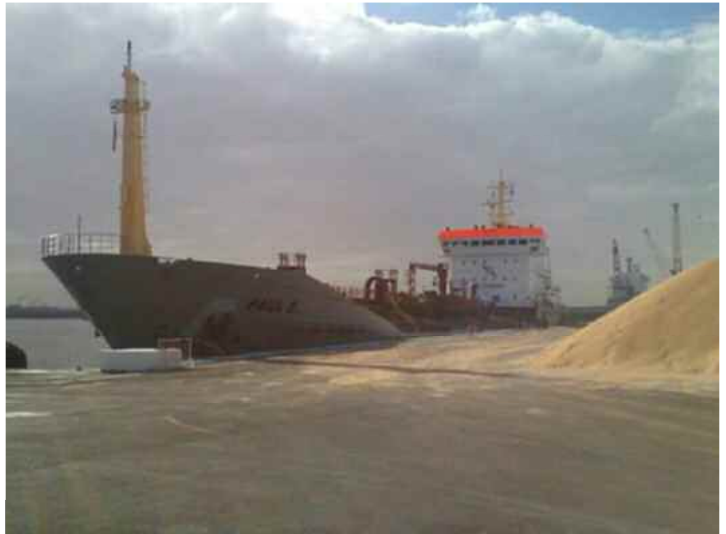
Amnesty International et Human Rights Watch s'alarment de l'aggravation des droits de l'Homme au Sahara occidental.

L'amélioration de l'action de la jeunesse sahraouie et son utilisation dans le renforcement des différents fronts ouverts dans le combat pour le droit à l'existence et la confirmation de la souveraineté sahraouie sur les registres diplomatique, juridique, humanitaire et des droits de l'homme, ont également été prônées lors du forum. Les recommandations ont