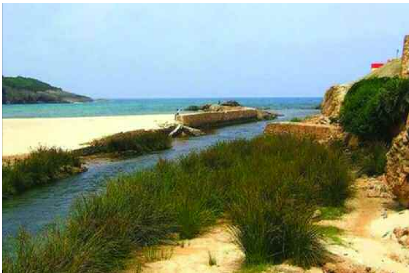
La concrétisation de projets touristiques dans la wilaya d'El Tarf va permettre de booster l'activité économique.