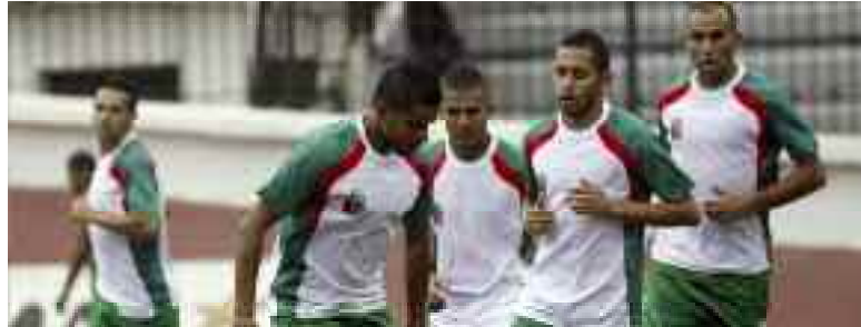
Est-ce le bout du tunnel pour l'USMBA ?

→ Un nouveau Conseil d'administration de la société sportive par actions de l'USM Bel-Abbès sera élu la semaine prochaine après l'ouverture du capital social pour permettre l'intégration de nouveaux actionnaires, a-t-on appris mercredi de ce club de Ligue 1 de football.