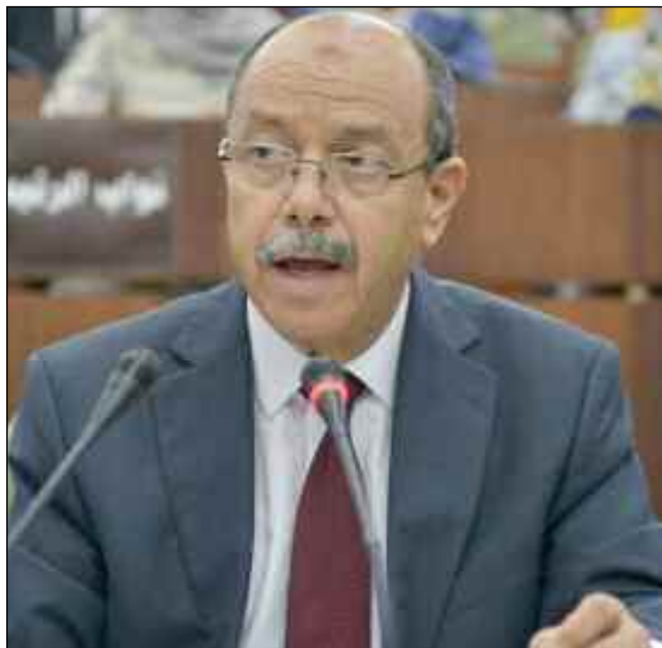
■ Zeghmati : «La loi est claire, tout agent public ou administratif qui refuse de se conformer à la loi s'expose à des poursuites judiciaires».

En réponse à une autre question relative «au refus» de certaines administrations l'exécution de décisions de justice définitives, le ministre a souligné que la loi est «claire, tout agent public ou admi-