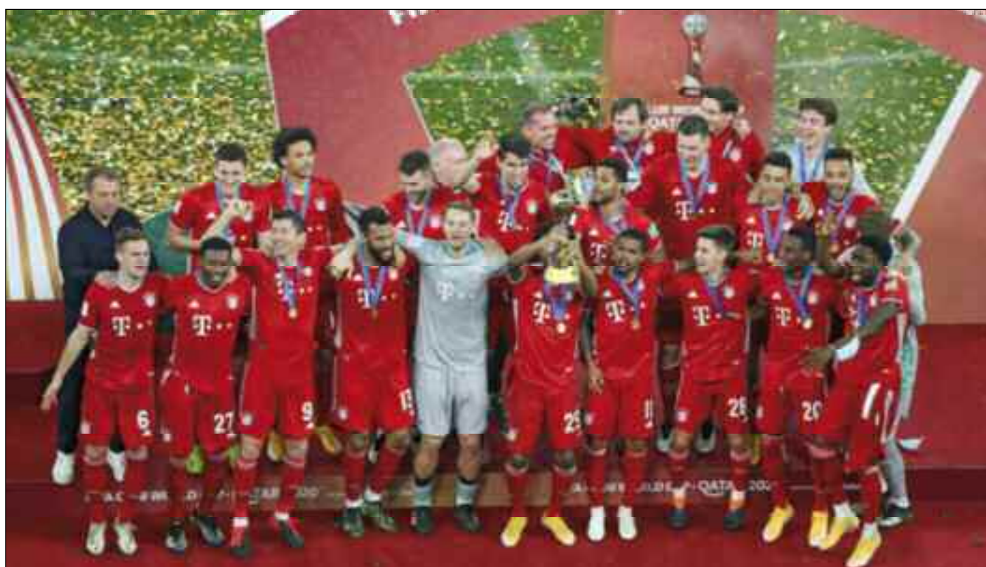
■ Et de six pour le Bayern Munich !

Le Bayern Munich fait carton plein question trophées avec ce succès en finale de la Coupe du monde des clubs. Bundesliga, Coupe d'Allemagne, Supercoupe d'Allemagne, Ligue des champions, Supercoupe d'Europe et donc Coupe du monde des clubs : c'est un sextuplé, c'est un carton plein et cela récompense l'excellence bavaroise. «A Doha, en finale