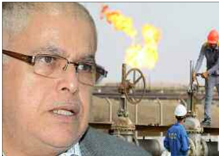
Le ministre a écarté la possibilité de réduire les prix du gaz en hiver.

«Les subventions étatiques sur le gaz et l'électricité coûtent au Trésor public des sommes considérables, d'où la nécessité de prendre des mesures spéciales pour orienter ces aides vers les catégories vulnérables, notamment avec la hausse du niveau de consommation nationale de gaz (47 milliards de m 3 en 2020),