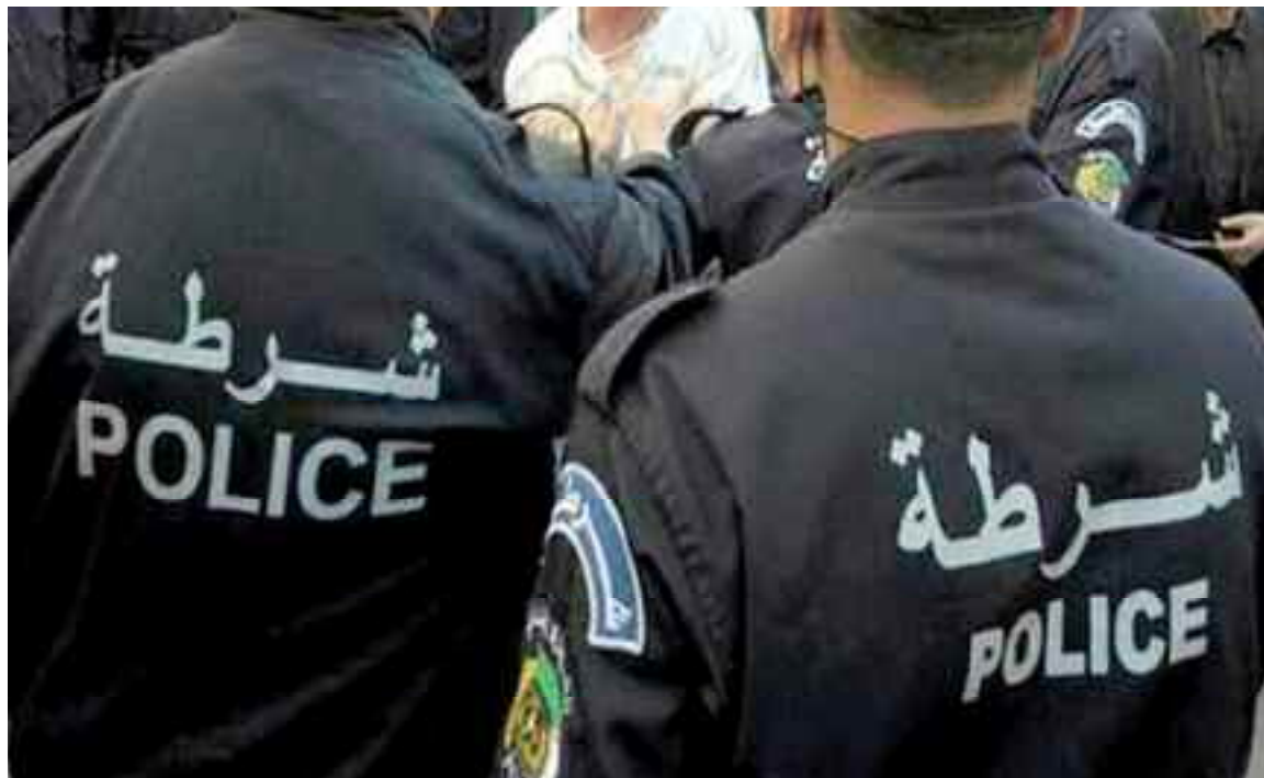
21 réseaux organisés d'émigration clandestine ont été démantelés en 2020.

Pas moins de 1.435 affaires de trafic de stupéfiants ont été traitées sur les 1.436 affaires enregistrées par les services de la Sûreté de wilaya, soit un taux de 99,93%, a précisé M. Douissi, lors de la présentation du bilan annuel 2020 des activités de ce corps de sécurité, signalant l'arrestation de 1.959 suspects de sexe masculin, 18 autres de sexe féminin et 12 étrangers. L'année 2019 a vu la saisie de 465,826 kilos de résine de cannabis, 110.052 comprimés de psychotrope et 5.377,71