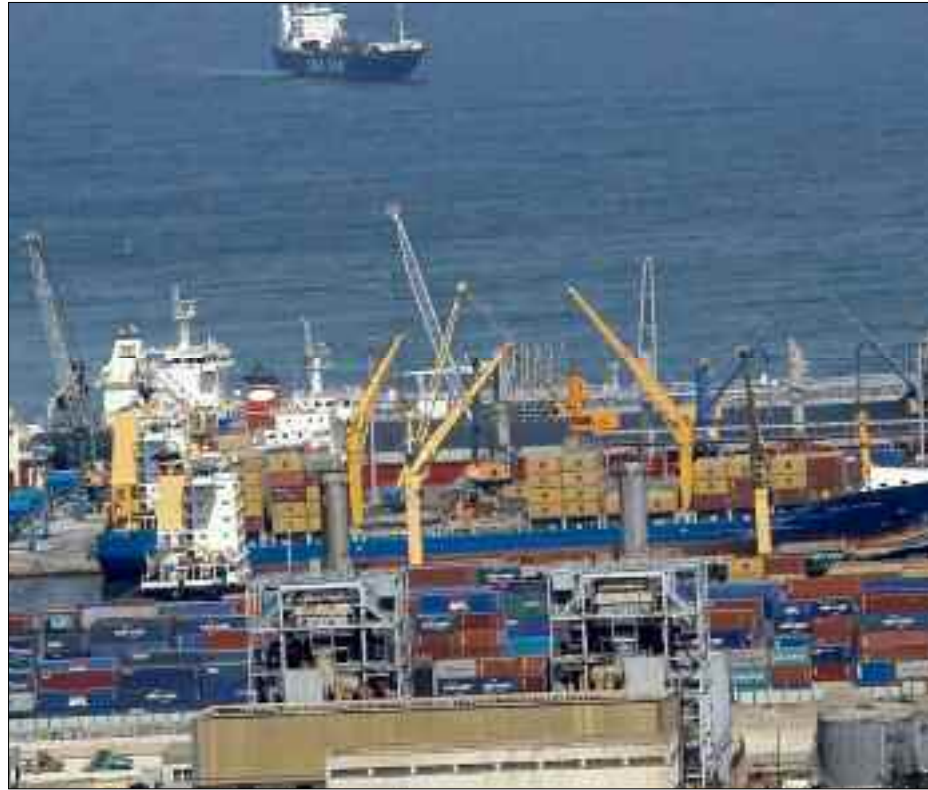
■ Le port d'Alger a enregistré l'accostage de 348 navires dont 326 opérants, atteignant 87% de l'objectif fixé et une diminution de 37,18%.

Le bilan fait, par ailleurs ressortir que le tonnage de la jauge brute des navires en entrée, prévu pour le 3 e trimestre 2020 à 4,1 millions de tonnes, a été réalisé à 85%. Il est passé de 7,8 millions de tonnes au