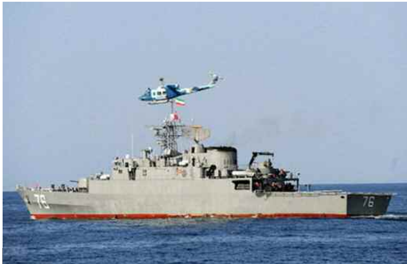
La politique de pression maximale des États-Unis a laissé de profonds stigmates sur l'économie iranienne.

«La Révolution islamique a fait son chemin dignement, l'indépendance est la grande cause de la nation iranienne et pour sa pleine réalisation, nous devons rester debout et résister», a noté le général Hatami. La Révolution islamique s'est épanouie grâce au sang des martyrs qui ont défendu l'armée, le CGRI, les