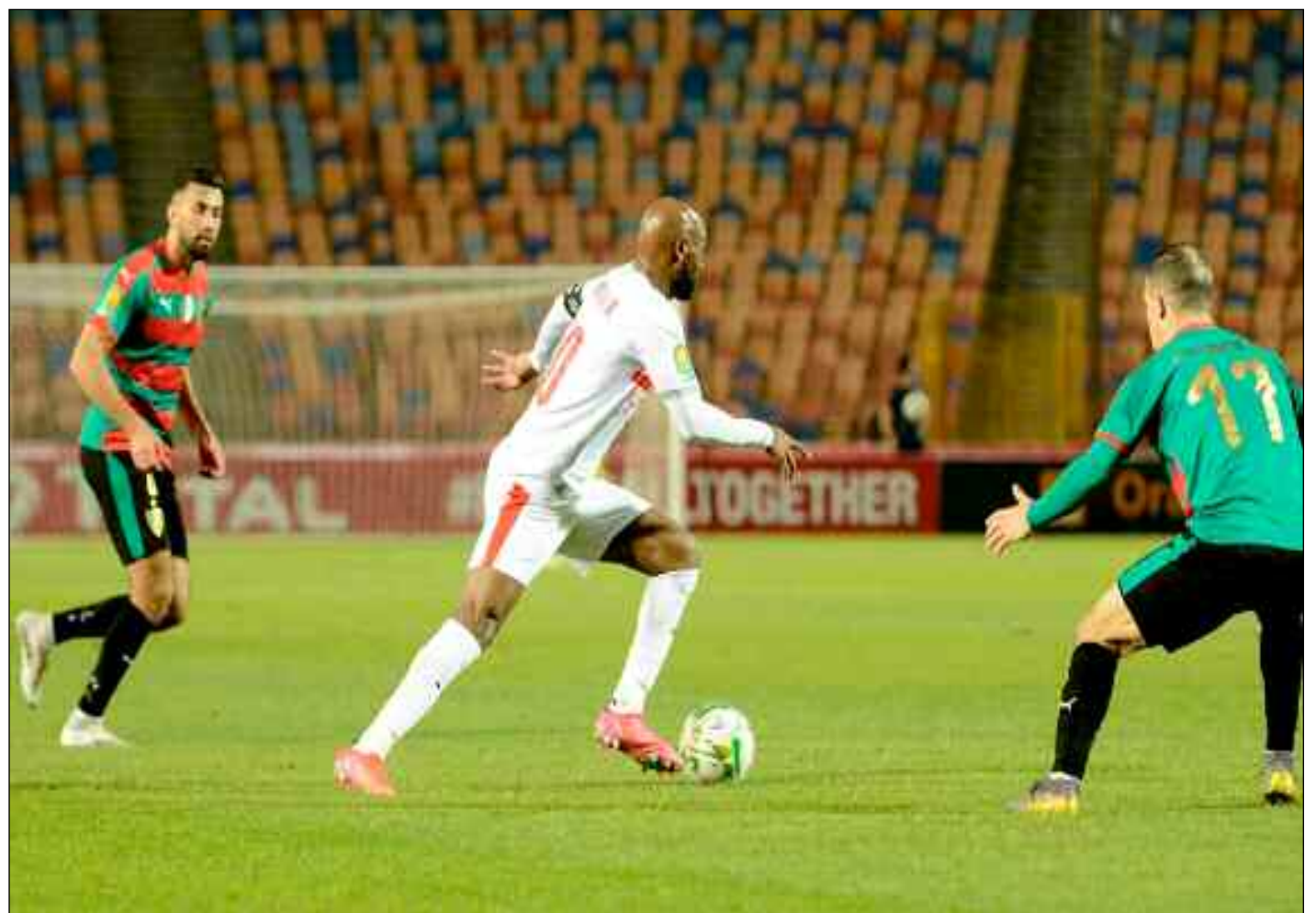
■ L'Egyptien Shikabala n'a pas pu trouver les filets.

Le Mouloudia donnait cette impression de perdre tous les repères qui pouvaient lui permettre de remonter vers le carré du Zamalek, mais l'excès de précipitation faisait échouer ses tentatives. Ce sont les locaux qui produisaient un meilleur jeu très technique faisant perdre tous les