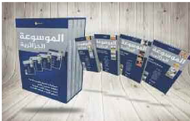
La version arabe de l'«Encyclopédie algérienne» sur l'histoire, la politique, la culture, la littérature, les arts, les vestiges et les monuments historiques est parue récemment aux éditions «Kalma».