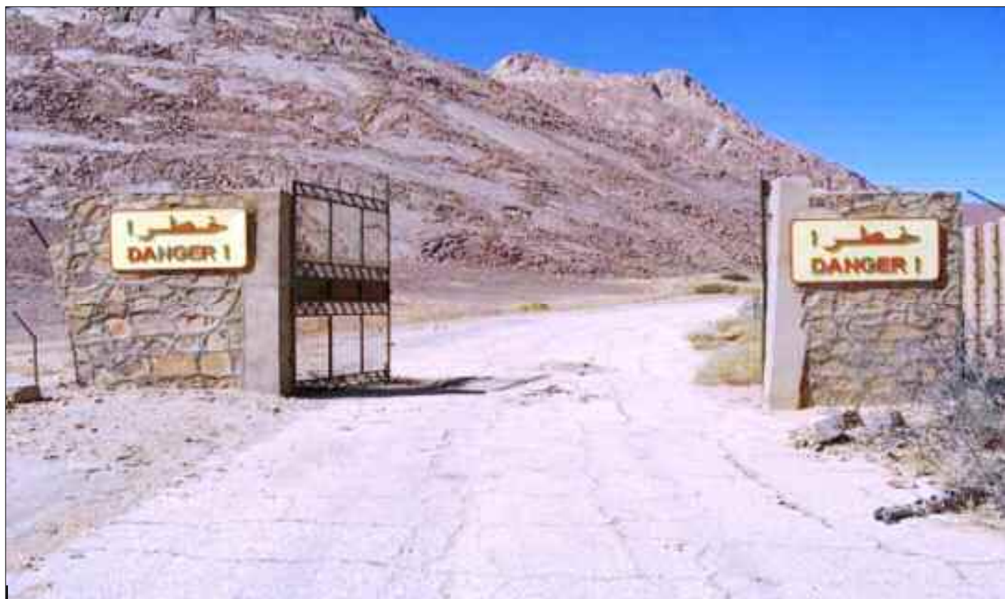
■ Les nomades continuent à ce jour à payer le prix fort de ces essais nucléaires.

Deux autres, plus redoutables, l'une le 13 juillet 1960 et l'autre le 1 er mai 1962 ont été expérimentées au lieu-dit Polygone de Reggane. Moulay Abdeslam, âgé de plus