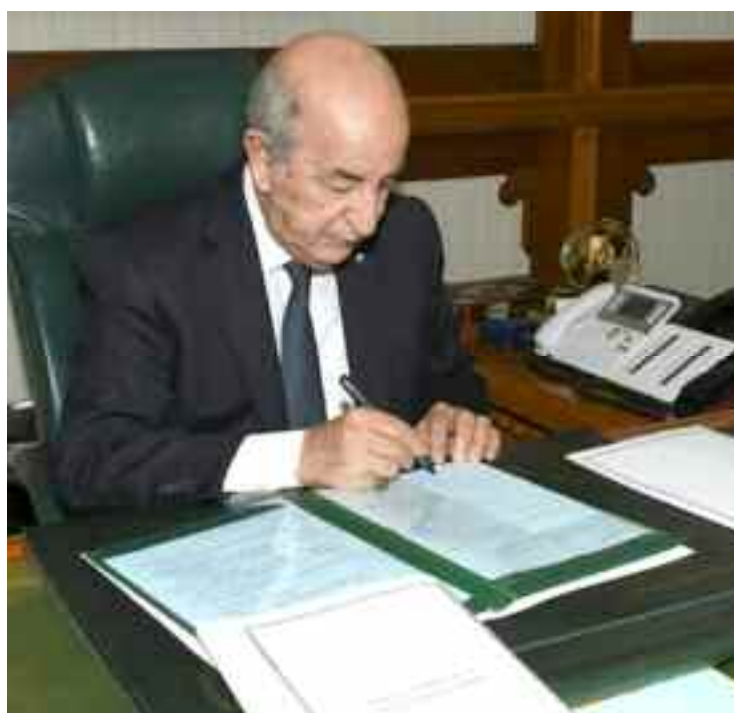
■ Le Président Tebboune va faire ce que les Algériens attendent de lui, c'est-à-dire faire passer le pays à la vitesse supérieure et rattraper le retard.

La situation sanitaire créée par le Coronavirus, défavorable à l'activité économique du pays, s'est sensiblement améliorée avec une évolution de l'épidémie mieux maîtrisée et le début