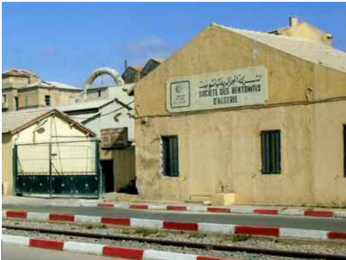
Le bilan financier de L'ENOF n'a toujours pas été clôturé pour des raisons inconnues.

Malgré plusieurs postulants de la région Est qui est terriblement frappée par un chômage endémique pour un poste d'emploi dans l'entreprise, le directeur d'unité, originaire de l'Ouest a choisi de recruter un personnel de sa région. Ainsi, tous ses achats concernant l'entreprise se font chez des privés lointains qui sont installés notamment à Biskra, à Oran et ses environs, mais jamais dans l'Est. A titre illustratif, les exemples de factures sont des preuves irréfutables. Il va sans dire qu'il y a, selon les accusations des collaborateurs et des délégués du personnel des factures faramineuses d'achats de pièces de rechange et de réparation. Une certaine magouille financière se joue quelque part dans cette unité. D'ailleurs, le bilan financier n'a toujours pas été clôturé et bloqué pour des raisons très floues. Selon le chef de service de