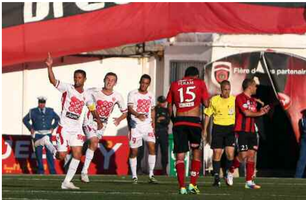
■ Si le MCO a réussi son match, l'USMA est tombé à domicile.

→ La défaite à domicile de l'USM Alger face à l'AS Aïn M'lila (0-1) et l'éclatante victoire du MC Oran (6-0) face à l'US Biskra ont probablement été les faits saillants des matches de vendredi, pour le compte de la 13 e journée de la Ligue 1 algérienne de football, au moment où quatre rencontres ont été renvoyées à une date ultérieure, en raison de la participation de l'ES Sétif, du CR Belouizdad, du MC Alger et de la JS Kabylie aux différentes joutes continentales.