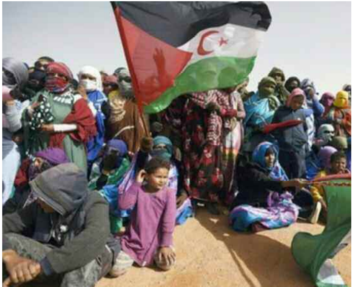
■ La République arabe sahraouie démocratique est un Etat fort de ses institutions et de la volonté du peuple.

La République arabe sahraouie démocratique (RASD) est un Etat fort de ses institutions et déterminé à faire face à l'occupation marocaine jusqu'au par-