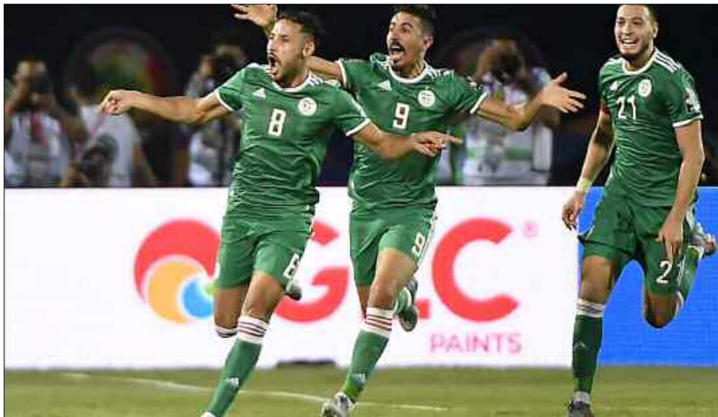
■ Les Verts veulent terminer les éliminatoires en beauté.

Installée à la 81 e au classement FIFA, la Zambie tentera d'effacer le 5-0 ramené d'Alger le 14 novembre 2019. Quant aux hommes de Belmadi, il s'agit plutôt de tenter de poursuivre la reconstruction de leur image, ce que le sélectionneur de l'équipe nationale a très bien compris et ses déclarations tiennent bien la route, la preuve se confirme sur les pelouses. Il sait trouver les mots pour transformer les individualités en collectif pour rassembler son groupe autour d'un seul objectif : la gagne. De toute façon, tout le monde l'a remarqué, il est aussi le technicien qui sait gérer les égos des joueurs, non seulement, mais aussi et surtout comment ne pas perdre ou fausser la connexion avec ses supporters sans pour autant céder à