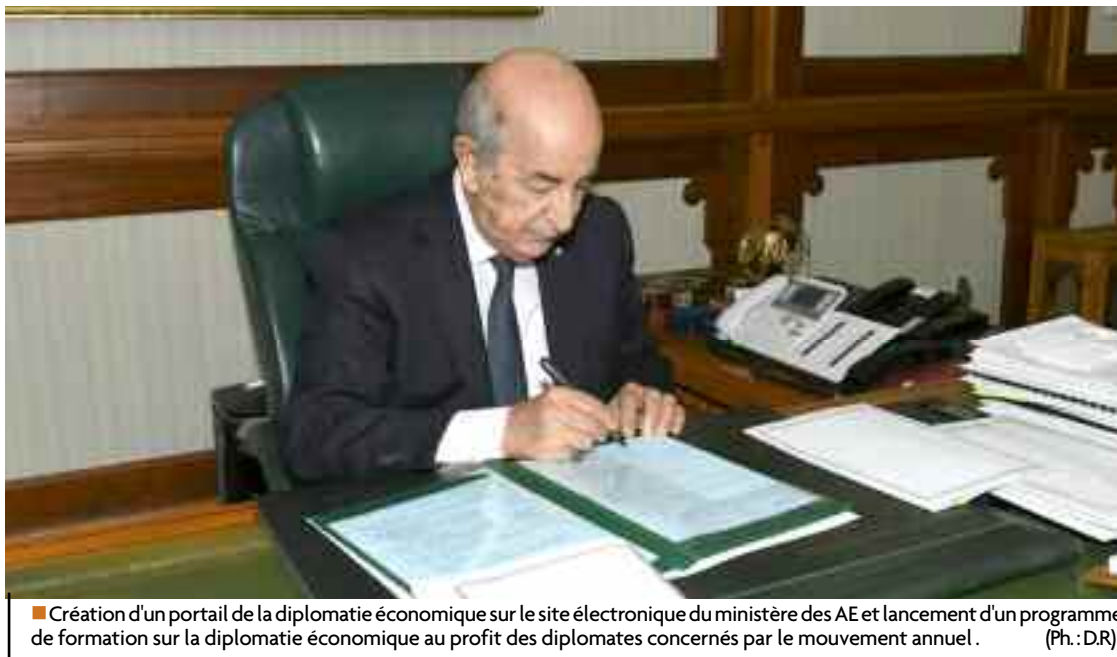
■ Création d'un portail de la diplomatie économique sur le site électronique du ministère des AE et lancement d'un programme de formation sur la diplomatie économique au profit des diplomates concernés par le mouvement annuel.

de l'économie et l'investissement créateur d'emploi et de richesses, en s'écartant de l'économie fourvoyée, axée par le passé sur l'importation et la surfacturation». Dernièrement, le ministre des Affaires étrangères, Sabri Boukadoum, a fait état de mesures pour contribuer à la promotion de la diplomatie économique, dont no-