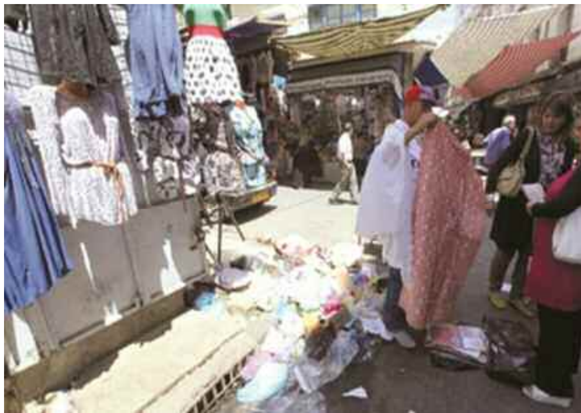
Les espaces publics et les trottoirs sont devenus des «bazars» à ciel ouvert.

D'ailleurs, les conditions sont réunies pour qu'un scénario pareil arrive un jour. Nul n'est à l'abri d'un accident, a tenu à marteler un parent d'élève, qui n'a pas d'ailleurs hésité à qualifier cette situation de «rocambolique». Elle l'est certainement par son caractère un peu particulier. Les piétons empruntent souvent la même voie que les voitures, dans un décor invraisemblable qui dénote clairement de cet aspect anarchique caractérisant la ville de Relizane. Une anarchie qui