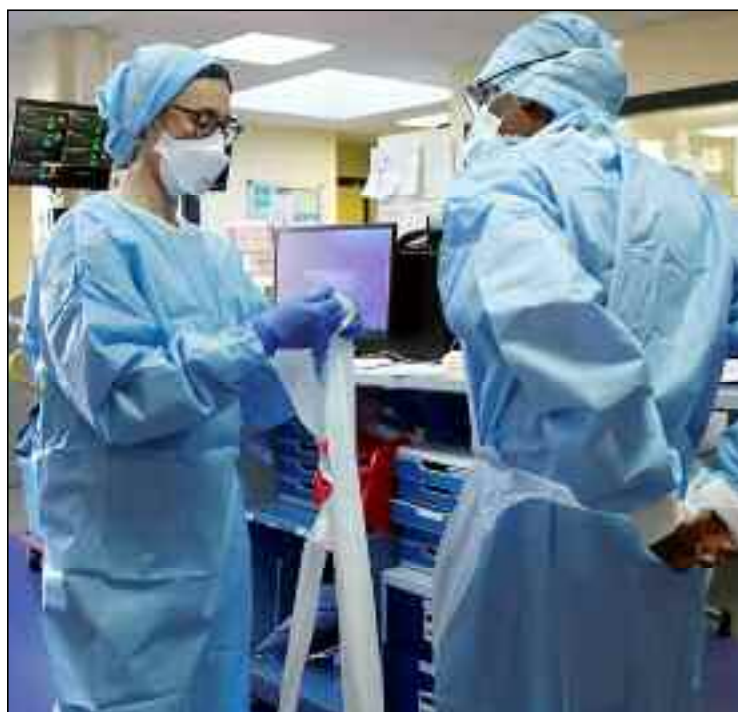
■ L'identification d'un patient positif au Coronavirus et, à plus forte raison quand il s'agit d'un variant, nécessite au moins trois jours.

Intervenant sur la Chaîne de télévision Echourouk TV, le Pr Fawzi Derrar a affirmé que l'identification d'un patient positif au Coronavirus (Covid-19) et, à plus forte raison quand il s'agit d'un variant, nécessite au moins trois jours.