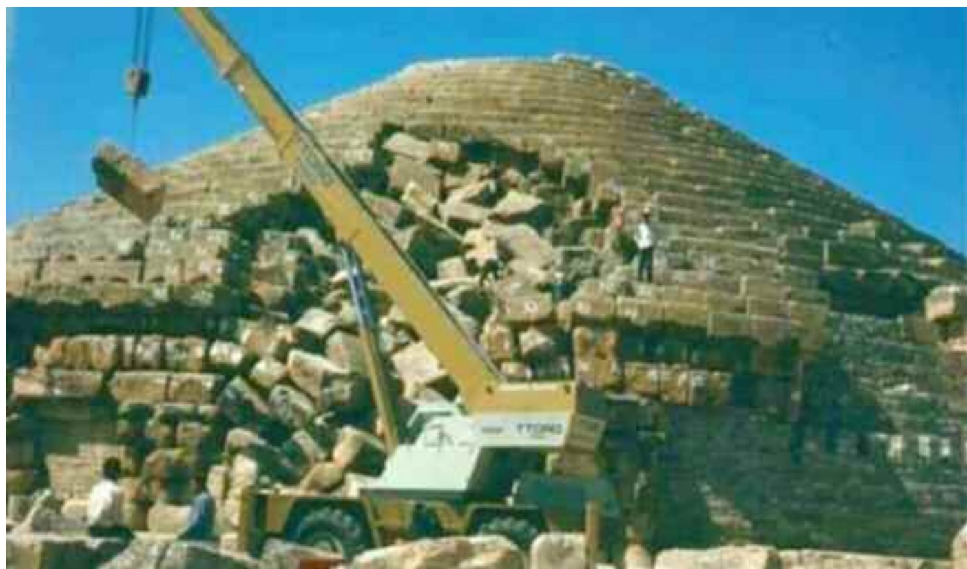
Le tombeau d'Imedghassen, situé dans la commune de Boumia, à Batna, a bénéficié d'un programme budgétaire de restauration ambitieux.

«L'association des Amis d'Imedghassen contribuera à ce projet à travers le suivi