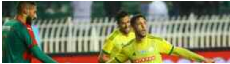
La JSK se refait une santé sur le dos du MCA.

→ L'Entente de Sétif s'est réappropriée le leadership de la Ligue 1 algérienne de football, en battant l'ASO Chlef (3-0), samedi pour le compte de la 15 e journée, ayant vu la JS Kabylie surprendre le MC Alger dans le Clasico (1-2), alors qu'elle était réduite à dix.