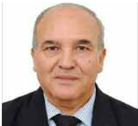
Professeur des universités, expert international D' Abderrahmane Mebtoul

1- Nous assistons à des tensions géostratégiques au niveau des frontières de l'Algérie, la chute des prix du pétrole et surtout du gaz naturel plus de 70% depuis 2010 procurant 33% des recettes de Sonatrach (98% des recettes en devises avec les dérivés) qui en plus connaît une baisse de la production en volume physique tant du pétrole que du gaz, l'Algérie ne profitant que très peu de la remontée actuelle des prix du pétrole qui ont un impact sur le niveau des réserves de change.