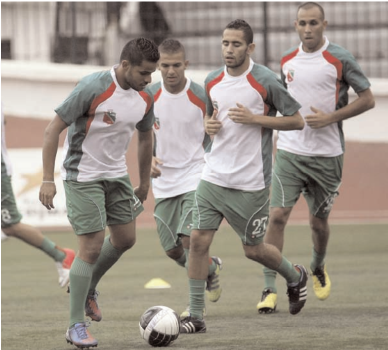
■ Cette opération vise au renflouement des caisses du club.

Initiée par un député de l'APW, cette opération vise à faire participer les supporters au renflouement des caisses du club, précise-t-on de même source, ajoutant que les procédures administratives et réglementaires d'usage auprès des services concernés ont déjà été enclenchées. Cette démarche intervient après quelques jours de la montée au créneau des joueurs de l'équipe pour réclamer la régularisation de leur situation financière, tout en dénonçant les conditions «déplorables» dans lesquelles ils préparent leurs matches.