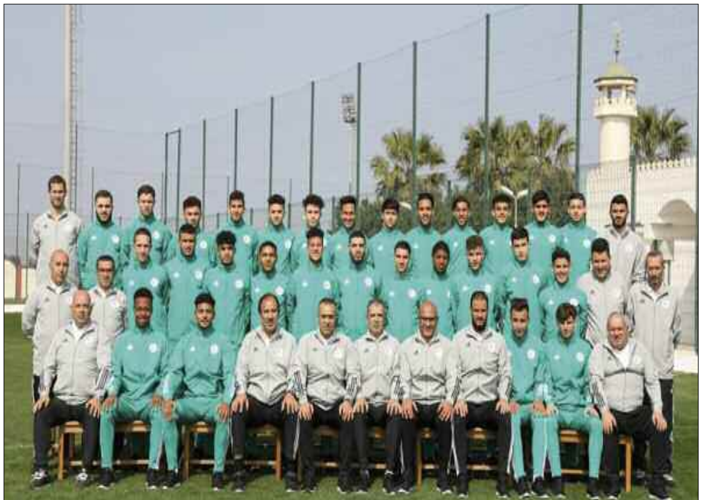
■ Les Verts étaient prêts pour la CAN.

On évoque que «cette décision fait suite à la mesure récemment prise par les autorités marocaines qui ont fermé leur espace aérien jusqu'au 21 mars inclus pour cause de Covid-19 avec un vingtaine de pays dont certains faisaient partie des qualifiés, comme l'Algérie, qui se retrouvait ainsi dans l'incapacité de rejoindre le Royaume chérifien avant le coup d'envoi du tournoi», rappelant comme le fait un médias africain qu'un report ou une délocalisation de la compétition dans un autre pays avaient été envisagés, mais ces alternatives n'ont finalement pas été sélectionnées. Pour rappel, la FIFA a elle-même annulé la Coupe du monde des