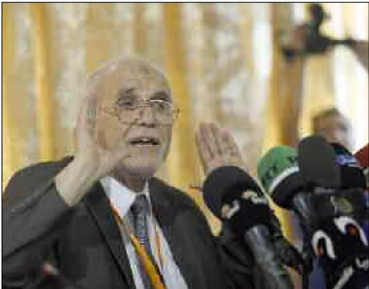
La création du Comité est à même de renforcer les capacités de l'ANIE en matière d'organisation et de contrôle de l'opération électorale dans toutes ses étapes.

«L'édification d'institutions d'Etat intègres requiert, d'emblée, le contrôle et le suivi des sources de financement de l'opération électorale à la faveur de mécanismes efficaces», a-t-il indiqué. S'exprimant à l'issue de l'audience qu'il a accordée à l'ambassadeur d'Italie à Alger, Giovanni Pugliese, le président de l'ANIE a assuré que la création de ce Comité en vertu de la loi électorale est à même de renforcer les capacités de l'ANIE en matière d'organisation et de contrôle de l'opération