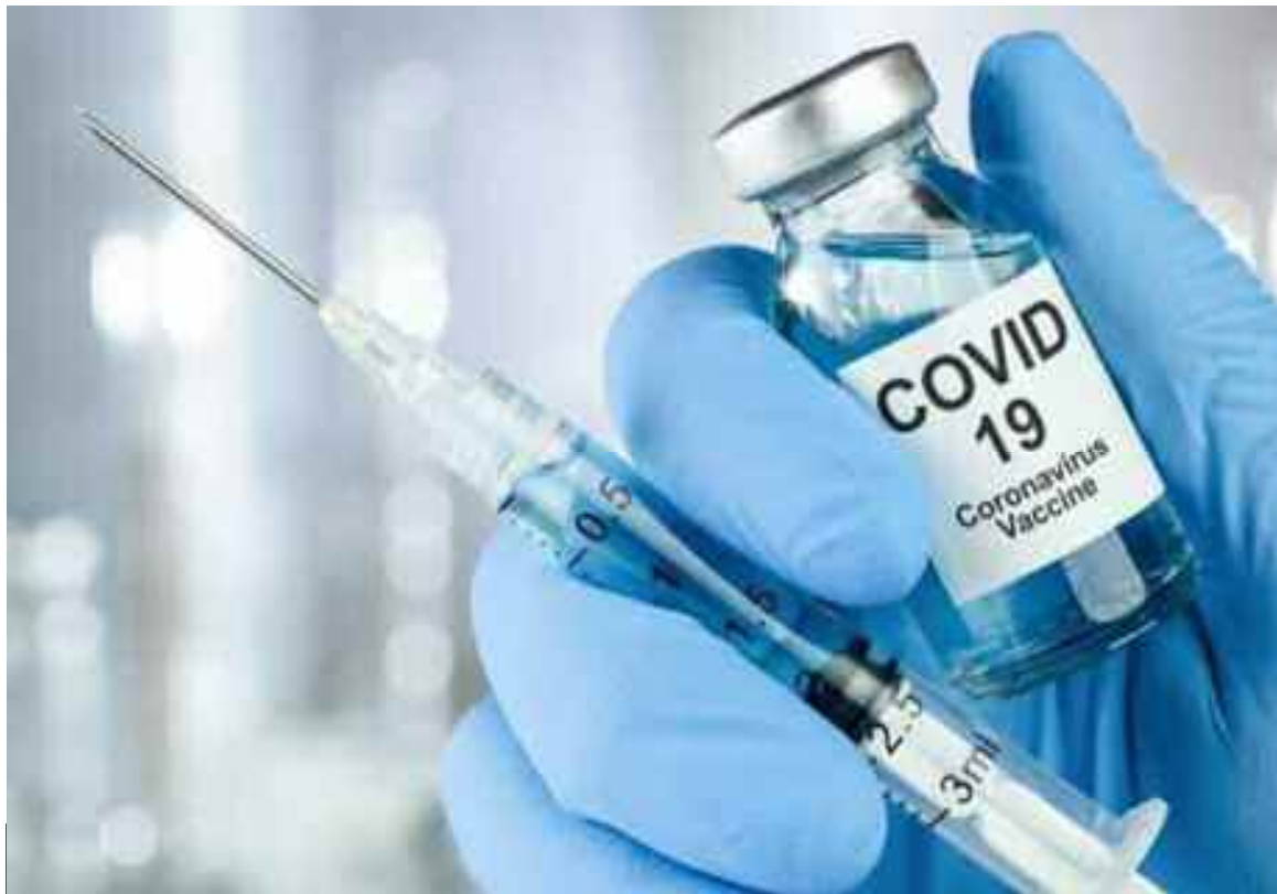
La wilaya de Relizane a reçu un quota de 3.600 doses du vaccin chinois anti-Covid Synopharm.

La direction de la santé et de la population (DSP) de la wilaya de Relizane a reçu son deuxième quota du vaccin chinois anti-Covid Synopharm, soit 3.600 doses. Le deuxième quota permettra de prendre en charge un grand nombre de patients et d'élargir la population ciblée, a-t-il souligné, officiellement lancée le 9 février dernier à Relizane, rappelant que la première phase a surtout concerné le personnel de la santé. Une partie de ce deuxième quota sera réservée aux personnes âgées souffrant