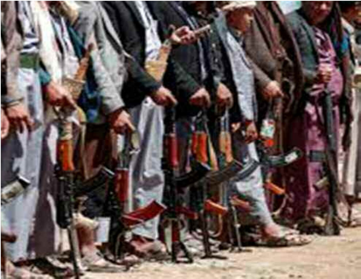
Des éclats d'obus provenant d'un missile balistique sont tombés près de Saudi Aramco dans la ville de Dahrán.

Côté saoudien, le ministère de l'Energie a indiqué dans un communiqué que «l'un des parcs des réservoirs pétroliers du port de Ras Tanoura dans la région orientale (...) a été attaqué ce matin par un drone venant de la mer». Plus tard dimanche, «des éclats d'obus provenant d'un missile balistique sont tombés près de Saudi Aramco dans la ville de Dahrán », est-il précisé. Les attaques n'ont pas fait de victimes ni de dégâts, a ajouté le ministère. La mission américaine en Arabie saoudite a pour sa part publié un avis évoquant de possibles attaques et ex-