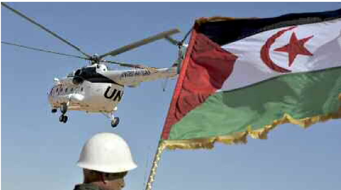
■ Réaffirmer l'impératif de redynamiser et renforcer le rôle de l'UA pour mettre fin aux résidus du colonialisme dans le continent.

Le débat entre les chefs des 15 Etats membres du CPS, à la lumière des développements et des graves dépassements enregistrés dans les territoires sahraouis occupés, a été l'occasion de rappeler les références historiques et ju-