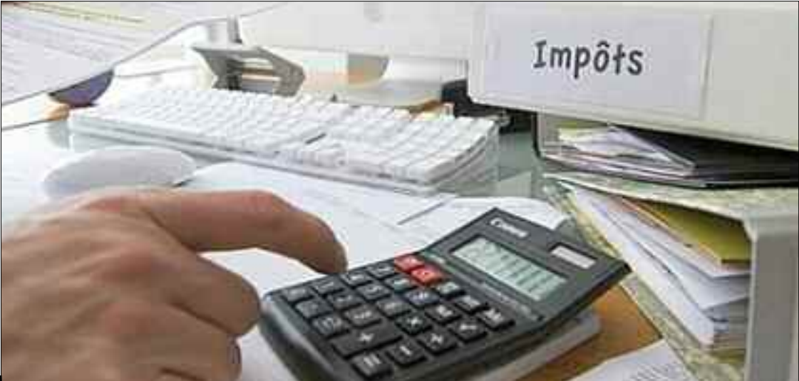
■ Agli : «Pour passer à la réalisation des 62 propositions, il faut une rupture réelle et une grande volonté politique pour concrétiser des solutions qui versent dans l'intérêt collectif et l'intérêt de la souveraineté économique du pays».

Ainsi, inventer en collaboration avec les autorités, un nouveau modèle économique axé sur la liberté d'entreprendre, loin de la dépendance et des verrous bureaucratiques. L'objectif majeur est de lutter efficacement contre la délinquance financière et la prolifération du marché noir hors du contrôle qui ont anesthésié l'économie nationale depuis des années. Les opérateurs économiques privés adoptent un discours plus au moins optimiste et veulent s'impliquer dans la nouvelle opportunité que leur offre l'Etat. Dans cette perspective, la CAPC propose une feuille de route en 62 axes, basés particulièrement sur les valeurs de l'investissement, de la production, mais aussi sur l'assainissement de l'économie nationale à travers l'application à nouveau d'un programme de l'amnistie fiscale, l'emploi et l'économie circulaire. L'objectif serait, notamment, de soutenir la relance durable des secteurs productifs et libérer toutes les potentialités existantes et exploitables et remettre de l'ordre dans le secteur économique, à l'agonie. La crise du Covid-19 n'a fait qu'aggraver une situation déjà désastreuse. La CAPC veut relever ce défi et se prépare d'ores et déjà à affronter les ravages à venir des conséquences de la crise du Coronavirus, du dispositif du confinement et surtout de la fermeture des frontières qui dure depuis une année. Le président de la CAPC, Samy