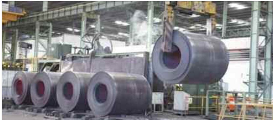
■ Mme Labiod : «La direction de Sider El Hadjar ambitionne d'engager la seconde phase du plan d'investissement pour laquelle une enveloppe financière de 45 milliards DA a été affectée».

Le recul du volume de la production du complexe Sider El Hadjar en 2020 est la conséquence de la pandémie du Coronavirus qui a affecté les activités du complexe qui couvre les besoins en produits