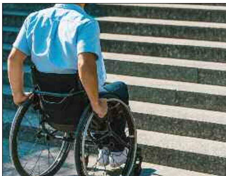
■ La Cncppdh a recommandé l'élaboration et la mise en œuvre d'une stratégie nationale pour le handicap, suivant les principes et les normes de la Convention.

«Le ministère de l'Industrie pharmaceutique s'emploie à l'adop-