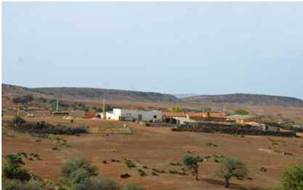
Mise en service d'un réseau de gaz naturel dans le village de Nadhor.

Il a ajouté, à ce propos, que les projets de développement en rapport direct avec les préoccupations des citoyens sont à même de contribuer à la fixation des populations dans leurs régions. Lors de cette visite de travail, le chargé de mission à la Présidence de la République a procédé au lancement d'un projet de cantine scolaire et du revêtement d'une aire de jeu en gazon synthétique au village de Sahn-Lassoued dans la commune de Trifaoui (15 km d'El-Oued).