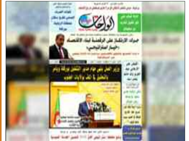
Le paysage médiatique national vient de s'enrichir avec la parution à Ouargla du 1er numéro du journal local en papier «Les Oasis Aujourd'hui».