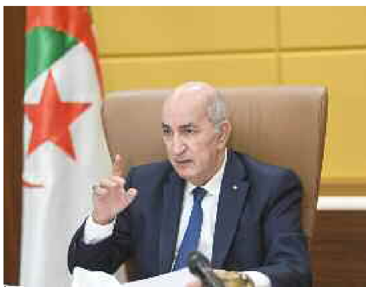
■ Dans certaines circonscriptions électorales, des femmes n'étaient pas du tout préparées à l'action politique et à contribuer à l'effort législatif.

Dans ce cas, l'Autorité indépendante valide ces listes et prononce leur recevabilité. L'article 202 ne sera pas appliqué lors des prochaines élections locales (Assemblée populaires de wilayas et communales) et sera remplacé par la disposition suivante : la liste des candidats présentée sous le parrainage d'un parti politique ou à titre indépendant, doit être appuyée par, au moins, 35 signatures des électeurs de la circonscription électorale concernée pour chaque siège à pourvoir. On sait que plusieurs partis politiques avaient émis des réserves sur ces dispositions - les «4%» et la «parité homme/femme» - considérant que la première disposition excluait les petites et les nouvelles formations et en outre prenaient comme référence des élections qui ont été entachées par les pratiques de fraude et dominées par l'argent, et n'étaient donc pas représentatives ; la disposition concernant l'obligation de la parité homme-femme sur les listes a été jugée inapplicable dans nombre de localités où la participation de la femme à la vie sociale et politique était encore trop insuffisante pour l'amener à se porter candidate à l'élection législative.