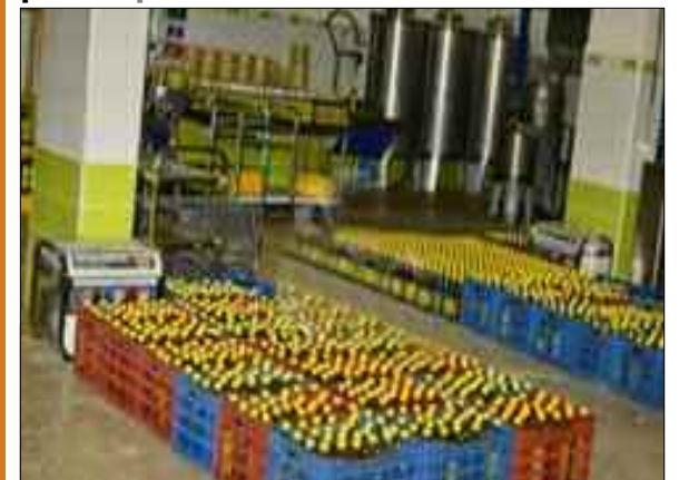
Le président de l'Association nationale des commerçants et artisans, Hadj Tahar Boulouar, a affirmé, samedi à Sidi Bel-Abbes, que «les stocks d'huile de table sont suffisants pour répondre à la demande, durant les prochaines semaines après la pénurie enregistrée dans quelques wilayas».