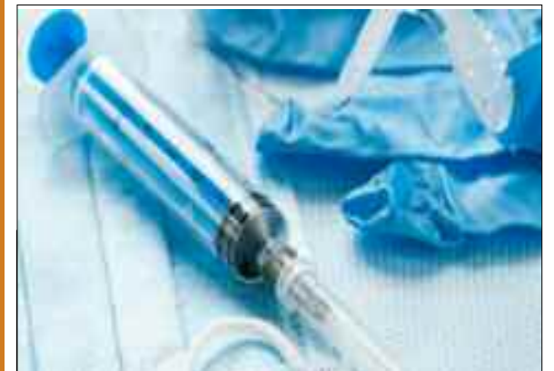
Le ministre de l'Industrie pharmaceutique, Lotfi Benbahmed a annoncé dimanche à Alger la préparation en cours de textes d'application «organisant et encadrant» le marché des fournitures médicales, notamment celles destinées aux personnes à besoins spécifiques.