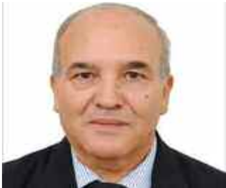
Professeur des universités, expert international D' Abderrahmane Mebtoul

Certaines personnes, sous le couvert de la démocratie, à laquelle je suis depuis de longues décennies profondément attachée (voir mes écrits www.google.com 1974/2011), face à des partis politiques rejetés par la population et une société civile atomisée inorganisée, dans un but de déstabilisation, s'attaquent ouvertement à la seule institution organisée dans le pays à savoir, l'ANP et les forces de sécurité, dont la vocation est de protéger le territoire national et assurer la sécurité des biens et personnes et ce, au moment où de vives tensions géostratégiques se trament au niveau de la région.