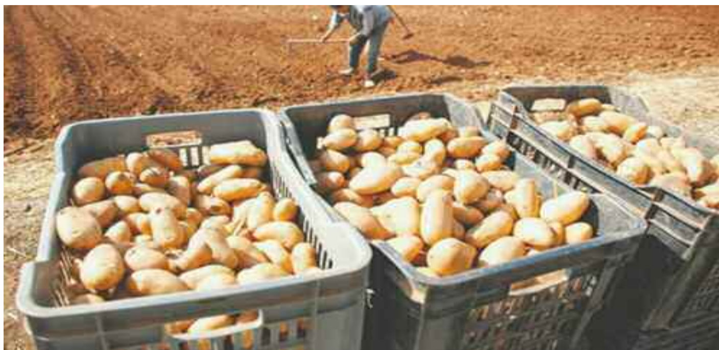
A quelques mois seulement des législatives du 12 juin prochain, la pomme de terre fait déjà sa campagne et ce, devant le silence des premiers concernés de cette situation qui s'empire d'année en année ; aucune solution ne semble être arrêtée pour séparer le bon grain de l'ivraie.

Le prix de 70 dinars le kilogramme qui est concédé actuellement sur le marché du gros n'aménage nullement notre clause de travail des plus pénibles, et dont sûre-