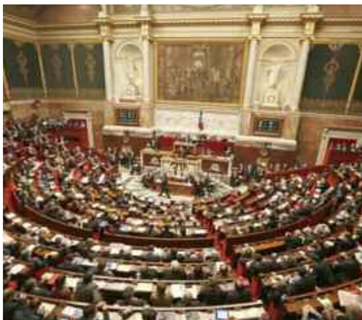
La Convention, signée en janvier 2019 entre les ministres algérien et français de la Justice, stipule l'extradition entre les gouvernements respectifs des deux Etats.

Il y a quelques jours, la loi autorisant l'approbation de la convention d'extradition entre l'Algérie et la France, signée le 27 janvier 2019 entre les deux pays, a été promulguée après son adoption par le Parlement français.