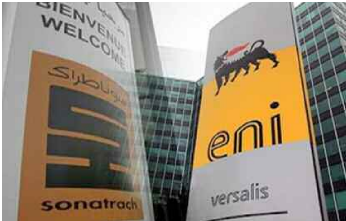
■ En décembre dernier, les deux groupes avaient signé un accord renforçant le partenariat dans le bassin de Berkine, sous l'égide du nouveau dispositif légal et réglementaire régissant les activités d'hydrocarbures.

Le premier accord signé s'inscrit dans le cadre du processus de conclusion d'un nouveau contrat d'hydrocarbures sous l'égide de la nouvelle loi d'hydrocarbures 19-13, indique la même source, expliquant que cet accord vise la réalisation d'un «ambitieux» programme pour la relance des activités d'exploration et de développement dans la région du bassin de Berkine et prévoit la réalisation d'un hub de développement de gaz et de pétrole brut à travers une synergie avec les installations existantes du périmètre 405b. Le second accord signé consiste