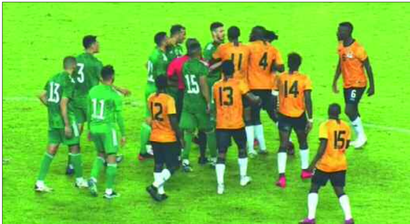
■ Ça a failli dégénérer sur le terrain à cause de l'arbitre.

Les Verts qui se sont présentés avec une équipe amoindrie par les absences de Mandi, Bensebaini, Bennacer, Feghouli et Mahrez ont aligné un 4-4-2 inhabituel avec notamment la titularisation de Rachid Ghezzal, de retour après deux ans d'absence, et la doublette Slimani-Bounejdjah alignée en pointe. Les Fennecs entraînent fort bien dans la partie en imposant un pressing haut qui étouffait leur adversaire. Mais les Algériens sortent de la Zambie avec un 1 point. Un nul parrainé par un arbitre des Comores qui était loin de lui faire gagner des points. Des penaltys magistralement offerts par cet homme des Comores qui voulait certainement plier les Algériens. Cette simulation aurait