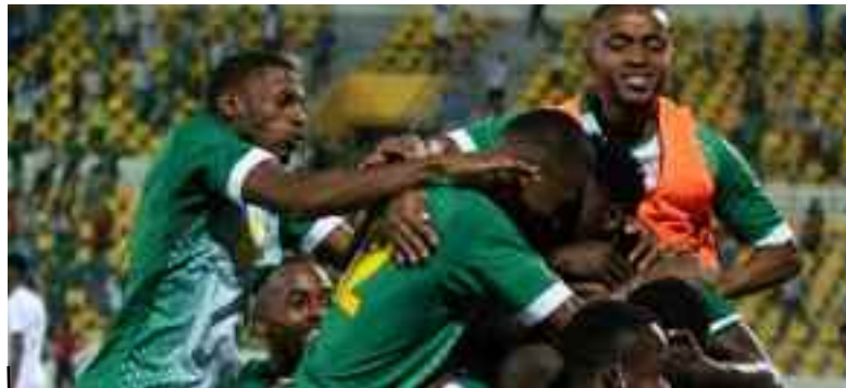
■ Une première pour les Comores.

→ Les éliminatoires de la Coupe d'Afrique des nations offrent souvent du bon spectacle et attire des millions de supporters africains.