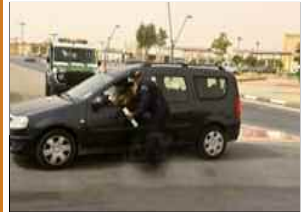
La Direction générale de la Sûreté nationale (DGSN) a lancé, dimanche, une large campagne nationale de sensibilisation sur la sécurité routière pendant le mois de Ramadhan visant à réduire les accidents de la circulation et à sensibiliser le citoyen quant à l'importance du respect du code de la route.