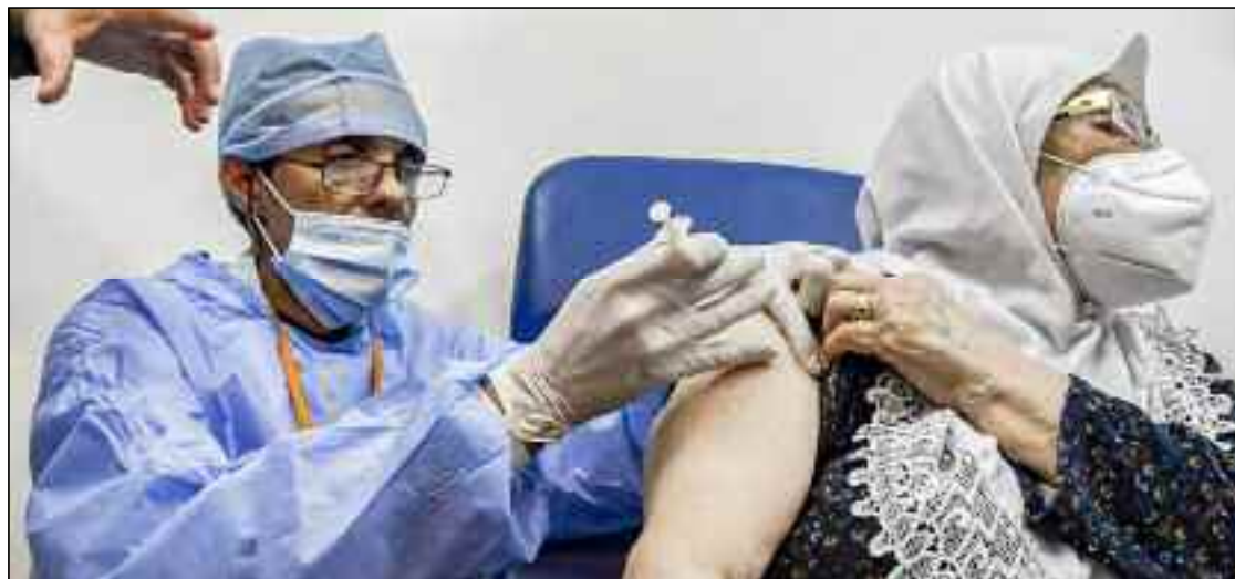
■ L'usage de tous les types de vaccins contre le Coronavirus, n'invalide pas le jeûne au même titre que les vaccins et les seringues.

«La Commission de la Fatwa a réaffirmé le contenu du communiqué (11) rendu public juste avant le Ramadhan dernier, lequel affirmait l'absence de corrélation entre le jeûne et l'atteinte de la