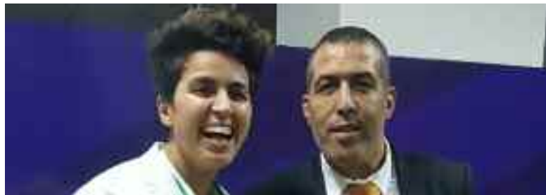
Yacine Silini lors des championnats d'Afrique de 2017.

→ Yacine Silini a été élu nouveau président de la Fédération algérienne de judo (FAJ) pour le mandat olympique 2021-2024, lors de l'Assemblée générale élective (AGE), tenue samedi au siège du Comité olympique et sportif algérien (COA) à Alger.