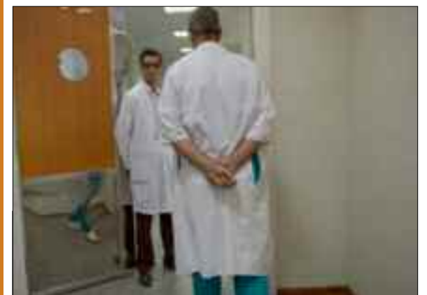
Le ministre de la Santé, de la Population et de la Réforme hospitalière, Abderrahmane Benbouzid, a annoncé dimanche la dotation des établissements sanitaires dans les wilayas du Sud et les Hauts-Plateaux en nombre de médecins lauréats du concours organisé les 6 et 7 avril à Ouargla, indique un communiqué du ministère.