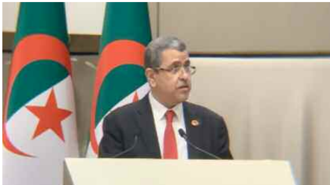
■ M. Djerad : «En dépit des conditions exceptionnelles, nous avons pu, avec la contribution de l'ensemble des opérateurs dans le domaine, réaliser nombre d'acquis».

Le Premier ministre a déclaré que l'État continuerait à encourager les investisseurs dans les industries manufacturières en accordant des incitations importantes et en finançant, comme promis par le Président Tebboune, jus-