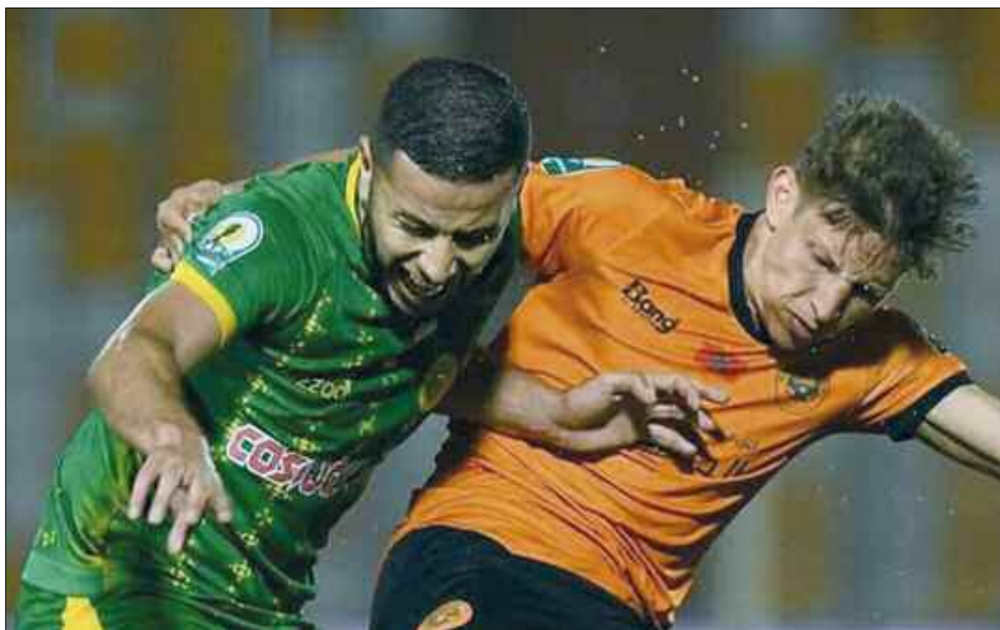
■ La JSK méconnaissable face à Berkane.

Cela commence à sentir bon aussi pour les Camerounais du Coton Sport qui ont écrasé les Zambiens de NAPSA Stars (5-1), et pour les Sud-Africains des Orlando Pirates, tombeurs 3-0 d'Al Ahly Benghazi, qui trônent en tête de leur groupe respectif. Comme à l'aller, la JS Kabylie et la RS