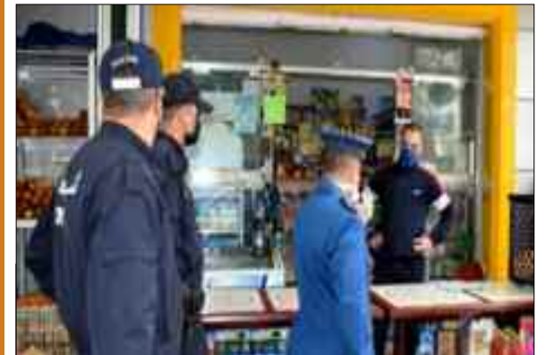
La Protection civile a appelé, dimanche, les citoyens à respecter «pleinement» les mesures décrétées pour lutter contre la Covid-19 et à faire preuve de «prudence» pour éviter les accidents de la route ainsi que les accidents domestiques, alors que débute cette semaine le mois de ramadhan, dans un contexte sanitaire marqué cette année encore par la persistance de la pandémie du Coronavirus.