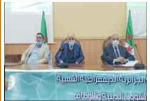
Le ministre des Affaires religieuses et des Waqfs, Youcef Belmahdi, a appelé dimanche à Tizi-Ouzou, à la veille du mois de Ramadhan, à la préservation des symboles de la société algérienne et ne pas prêter le flanc aux tentatives de stigmatisation d'une quelconque partie de la société algérienne.