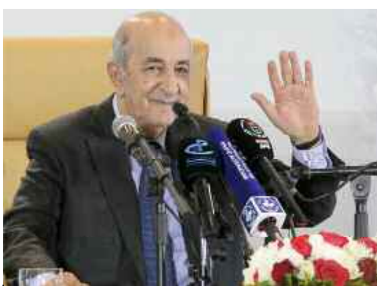
■ Tebboune : «Les prémices de la contribution des jeunes dans la création de la richesse et des emplois commencent à donner les résultats escomptés».

Après avoir salué «les efforts consentis par les entreprises à l'effet de préserver les postes d'emploi et les salaires en dépit de la situation difficile», le Président Tebboune s'est félicité de «l'accès de nos jeunes au monde de l'entrepreneuriat, valorisant leurs capacités à créer des opportunités d'investissement avec ce qu'ils possèdent comme savoir-faire et innovation».