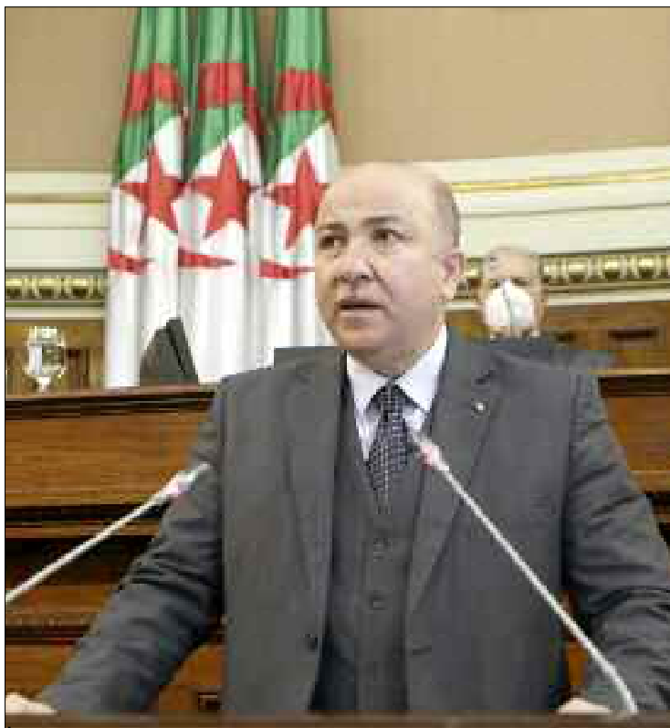
Depuis quelques mois, les banques publiques tentent d'améliorer la performance de leur service et d'intégrer progressivement les services digitaux.

Dans cette perspective, le ministre des Finances vient d'annoncer d'importants changements à la tête des six banques publiques et d'inclure une nouvelle procédure de séparation du rôle de la direction et du rôle de la gestion au niveau des banques publiques dans l'objectif de «relever le niveau de gestion aux normes internationales afin d'améliorer leur contribution au financement de l'économie nationale», a fait savoir le ministre des Finances, Aymane Benabderrahmane, jeudi dernier, à Alger, lors de la cérémonie de nomination des DG et des PCA des six banques publiques. Un premier cap franchi dans la mise en œuvre de la réforme de gouvernance de ces banques qui s'accaparent de 90% du marché financier national. Il a affirmé, à ce propos que «cette mesure fait partie de la réforme de la gouvernance des banques