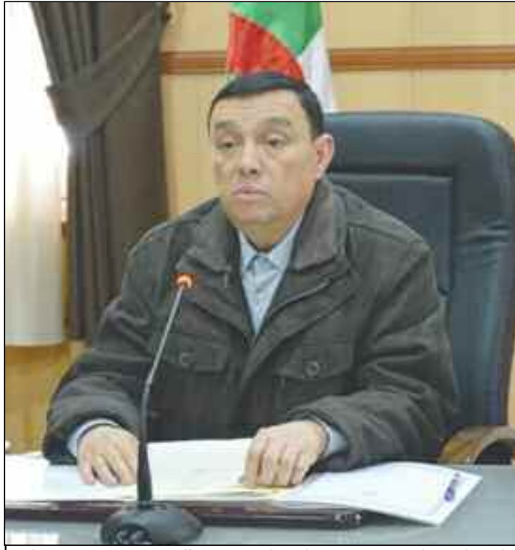
■ Il ne sera ménagé aucun effort pour améliorer la situation et prendre en charge les préoccupations soulevées par l'ensemble des membres de la famille éducative.

Appelant, au passage, la communauté éducative à faire preuve de responsabilité et à adhérer aux efforts de dialogues de manière à assurer la stabilité du secteur au service de l'élève et du savoir. C'était lors d'une conférence tenue par visioconférence avec les directeurs de l'Education des wilayas sur les mouvements de