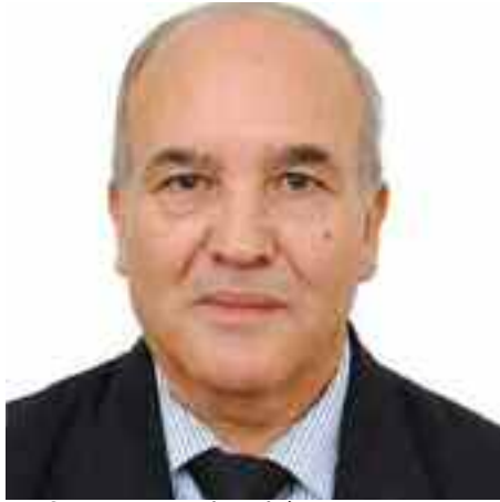
Professeur des universités, expert international D' Abderrahmane Mebtoul

Le monde traverse une crise inégalée où selon le FMI, la Banque mondiale et l'OCDE, le chômage et l'exclusion sociale tend à s'étendre au niveau planétaire, touchant surtout les pays les plus vulnérables. Dans un contexte marqué par une incertitude exceptionnelle, avec une dette publique qui explose, 98% du PIB mondial en 2020 contre 84% en 2019, le Covid-19 a alourdi la dette mondiale de 24 000 milliards de dollars en 2020. Selon l'OIT au total en 2020, on a enregistré des pertes d'emplois sans précédent au niveau mondial atteignant 114 millions d'emplois si l'on compare à 2019. En termes relatifs, les pertes d'emplois ont été plus élevées chez les femmes (15%) que chez les hommes, et chez les jeunes travailleurs (8,7%), par rapport aux travailleurs plus âgés. Et l'économie mondiale selon le FMI, devrait connaître une croissance de 5,5% en 2021, puis de 4,2% en 2022, ne devant revenir au niveau de 2019, qu'en 2022 sous réserve de la maîtrise de l'épidémie du coronavirus. En Algérie, contrairement aux propos du ministre des Finances et le rapport du FMI de mars 2021 le confirme, nous assisterons pour 2021, avec moins d'intensité qu'en 2020, à la détérioration des indicateurs économiques et sociaux (décroissance du PIB, baisse des réserves de change, inflation, chômage) dont l'extension de la sphère informelle liée à la logique rentière.