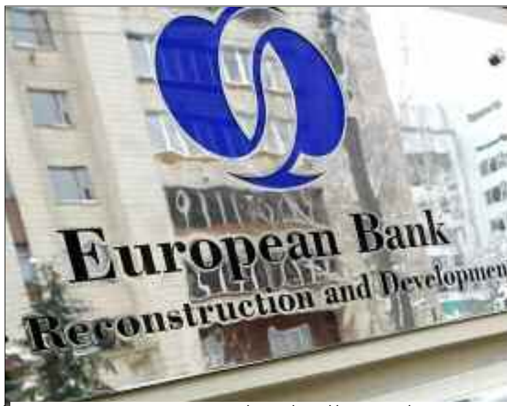
La mauvaise gouvernance et gestion des marchés publics ainsi que la corruption sont à l'origine de la double crise financière et économique que vit aujourd'hui le pays.

La BERD pourrait, également, l'aider à évaluer les incidences et les effets de la crise sanitaire du Covid-19 sur son économie et la société afin de faciliter aux pouvoirs publics l'élaboration d'un modèle économique plus concurrentiel et profiter, en contrepartie, de toutes les opportunités d'investissement présents pour stimuler la compétitivité du secteur privé et améliorer la qualité et l'efficacité des services publics dans le pays.