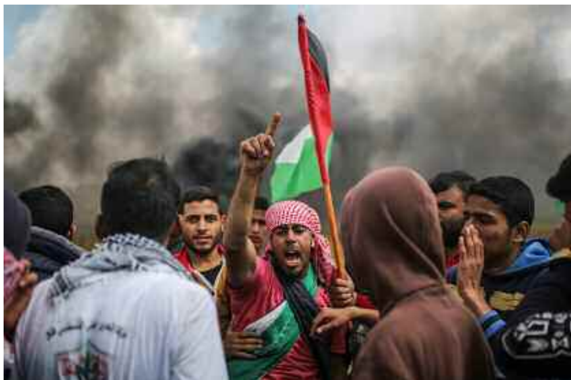
Des massacres incommensurables ont lieu en Palestine occupée, faisant des centaines de victimes dont des enfants, sans pour autant faire bouger le Conseil de sécurité à l'ONU...