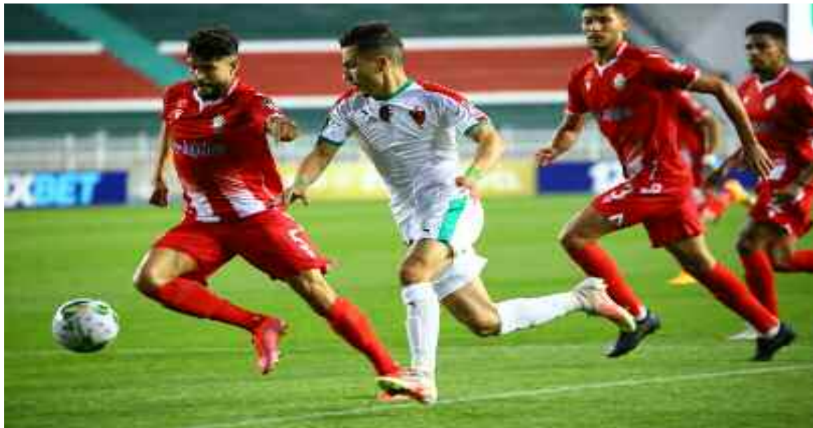
■ Difficile sera le match retour pour le MCA.

L'addition aurait même pu être plus salée pour les Vert et Rouge au vu de la physionomie de la première mi-temps, pendant laquelle le Wydad avait dominé les débats, avec la possibilité de scorer au moins une fois.