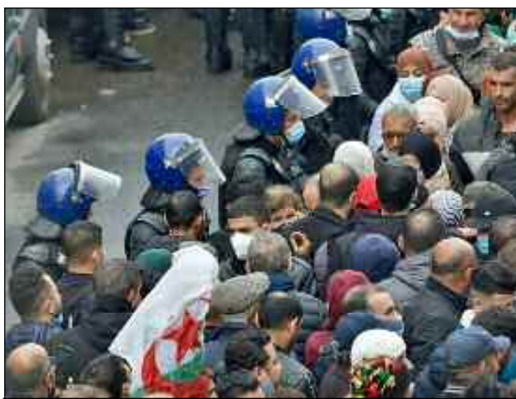
La police, en tenue et en civil, déployée en force, a tenté d'empêcher les rassemblements des manifestants venus réclamer un Etat civil, Etat de droit...

Il a été constaté, avait relevé la même source, récemment que les marches hebdomadaires commencent à enregistrer de graves dérapages et dérives en termes d'indifférence aux désagréments causés aux citoyens et d'atteintes aux libertés du fait d'individus changeant, à tout moment, l'itinéraire sous prétexte d'être libres de marcher dans n'importe quelle direction et à travers n'importe quel axe, ce qui est contraire à l'ordre public et aux lois de la République. «Le non-respect de ces