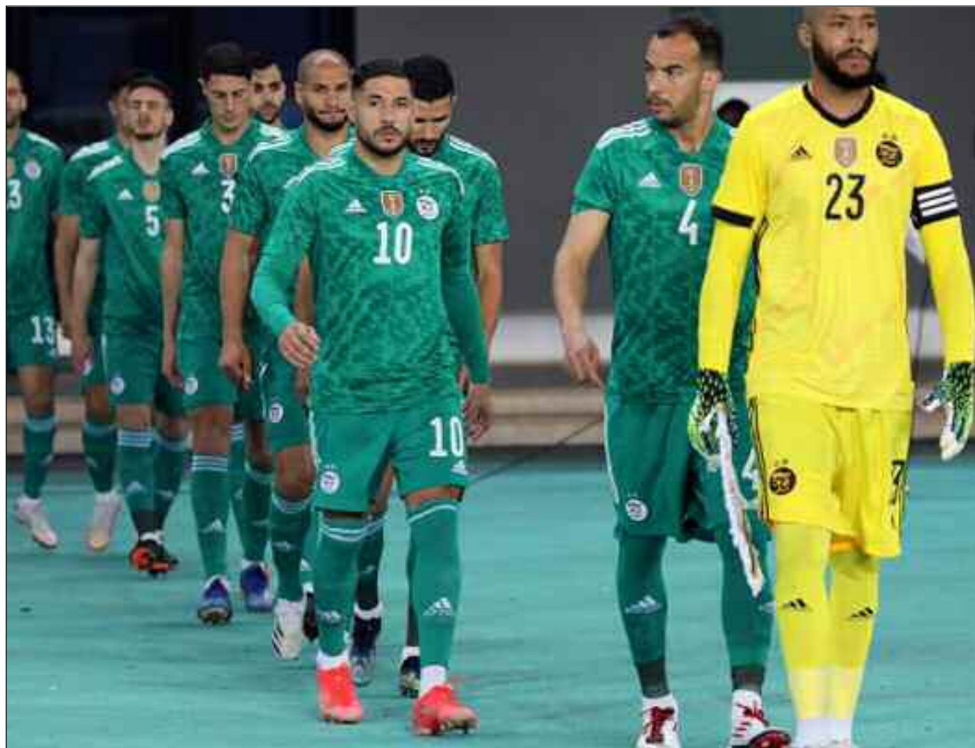
■ Le mois de juin sera chargé pour les Verts.

Durant ces dates FIFA, le Sénégal, selon la