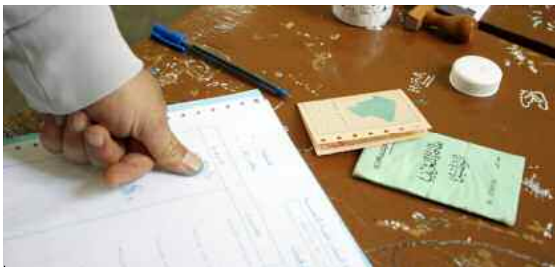
■ Fait nouveau : un collectif regroupant des listes d'indépendants intervenant dans le monde agricole et rural a été créé jeudi au premier jour de la campagne.

l'Algérie», faisant part de son «optimisme» quant au succès de ce rendez-vous électoral. Il a exhorté, à l'occasion, les citoyens à participer massivement aux législatives du 12 juin prochain, rappelant que son parti préconise depuis 2012 «la moralisation de l'action politique et l'édification d'une nouvelle Algérie», devenues,