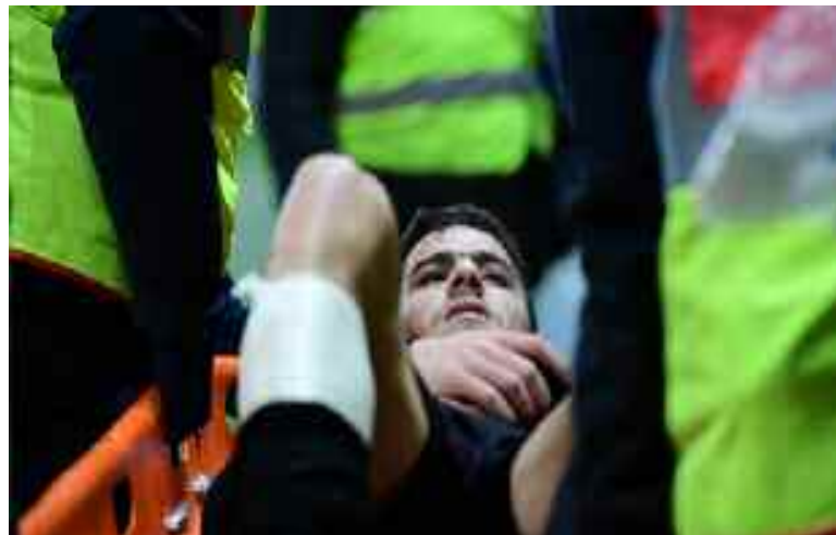
■ Atal collectionne les blessures musculaires.

→ Et revoilà, le latéral champion d'Afrique, l'Algérien Youcef Atal qui souffle tout juste ce lundi dernier 17 mai sa 25 e bougie, atterrir sur les espaces médiatiques, du fait de son indisponibilité pendant trois semaines pour cause de lésion musculaire à la cuisse droite.