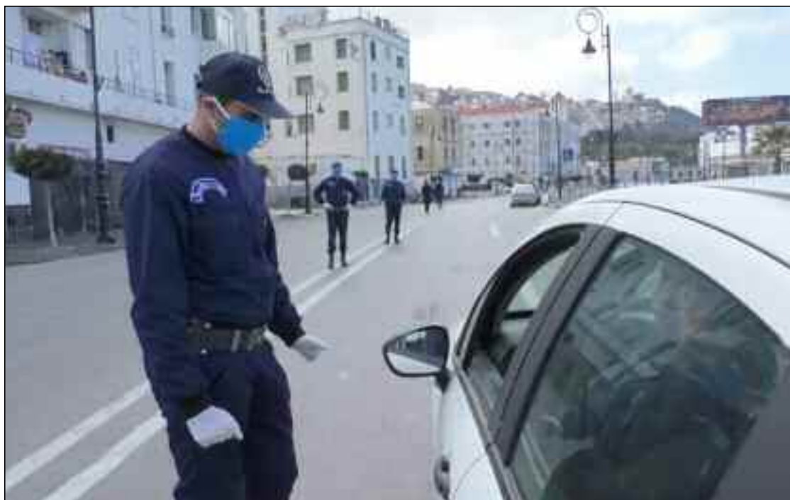
■ Ces 111 nouveaux cas de variants découverts, a poursuivi la même source, s'ajoutent aux 180 cas détectés entre le 25 février et le 3 mai.

En continuant, a indiqué, avant-hier jeudi, un communiqué des services du Premier ministre, à observer scrupuleusement les mesures barrières préconisées, telles que la distanciation physique, le port du masque obligatoire et le lavage fréquent des mains. Annonçant, à l'occasion, la décision du Premier ministre, Abdelaziz Djerad, d'étendre les mesures de confinement partiel à domicile de minuit (00 heure) jusqu'à quatre (4) heures du matin à 19 wilayas pour une durée d'un mois à compter d'aujourd'hui 22 mai 2021, et ce, au titre du dispositif de gestion de la crise sanitaire liée à la pandémie du Coronavirus (Covid-19). La mesure de confinement partiel à domicile de minuit (00 heure) jusqu'au lendemain à quatre (4) heures du matin, a précisé la même source, est applicable, à partir d'aujourd'hui samedi 22 mai, dans les dix-neuf (19) wilayas suivantes, Adrar, Laghouat, Batna, Béjaïa, Blida, Tebessa, Tizi-Ouzou, Alger, Jijel, Sétif, Sidi Bel-Abbès, Constantine, M'Sila, Ouargla, Oran, Boumerdès, El Oued, Tl-pasa et Touggourt. « Les walis