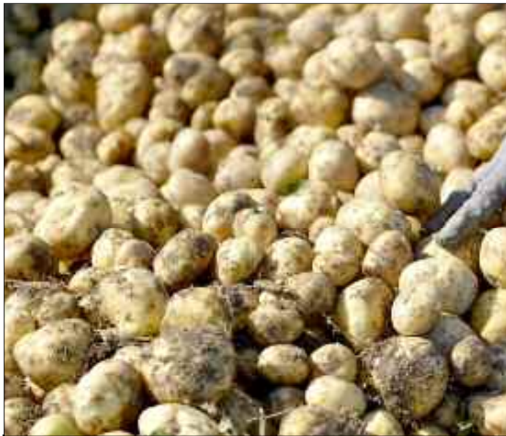
■ «La filière de pomme de terre avait utilisé 80% des semences locales pour la production de la pomme de terre destinée à la consommation».

L'objectif serait, également, de réduire la dépendance du secteur à l'importation des graines ou de la semence qui pose des problèmes de rendement et de disponibilité des produits agricoles sur le marché. Le ministre a cité l'exemple de la semence de la pomme de terre qui vise de passer de la dépendance aux importations à la résilience locale en essayant d'aborder les défaillances locales afin de renforcer les capacités de production et de rendement. La nouvelle feuille de route adoptée par le ministère de l'Agriculture a permis de réduire, en un temps record, les importations de la semence de la pomme de terre qui ont baissé, durant la campagne en cours une «baisse