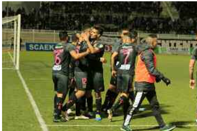
■ L'Entente de Sétif conforte sa place de leader.

→ L'Entente de Sétif a conforté sa place de leader en atomisant le mal-classé USM Bel-Abbès (8-0), en match disputé samedi après-midi au stade du 8-Mai 1945, pour le compte de la 22 e journée de Ligue 1, ayant vu la lanterne-rouge, le Chabab Ahly de Bordj Bou-Arréridj, remporter sa première victoire de la saison, en dominant l'avant-dernier au classement général, la JSM Skikda, sur le score d'un but à zéro.