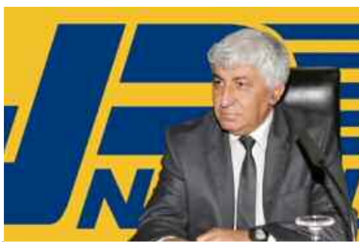
■ L'Algérie devra aussi investir dans la production de l'essence afin de couvrir la demande locale et arrêter effectivement l'importation de carburants.

L'Algérie abandonne définitivement l'essence super avec plomb. A partir du mois de juillet de l'année en cours, ce carburant qui contient du plomb ne sera plus commercialisé au niveau des stations-services nationales et devra être remplacé par deux types d'essence, à savoir, l'essence sans plomb et l'essence normal, comme annoncé par le ministre de l'Energie et des Mines, quelques mois plus tôt.