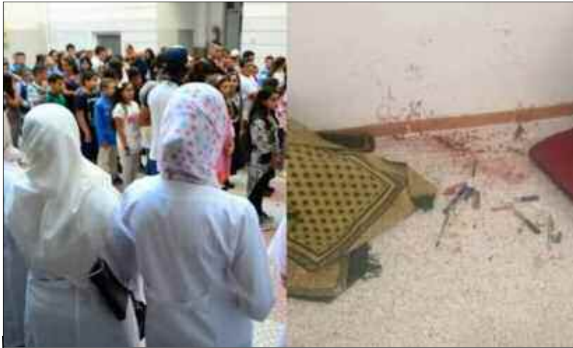
■ Un syndicat de l'Education a indiqué à la presse, que les enseignantes se sont plaintes des provocations, intimidation et de menaces qu'elles auraient fait l'objet avant cette agression.

Ces derniers expliquent que le groupe avait subtilisé les affaires des enseignantes pour contourner le véritable objectif à savoir : « Terroriser les jeunes femmes ». Ecoutez Mme Fadila : « Je pense que les enquêteurs et les magistrats vont certainement procéder à la requalification des faits car plusieurs paramètres et indices montrent que le but recherché par les assaillants avait pour but de terroriser les femmes afin qu'elles gardent à vie les sé-