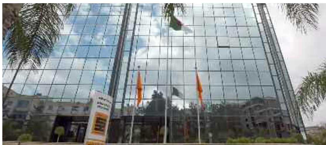
■ Les conditions sécuritaires risquent d'être difficiles à garantir, en cas de retour des affrontements militaires.

tour des affrontements militaires. Certes, la NOC ne peut pas se prononcer sur l'avenir du pays, mais affirme son engagement de mettre en place les moyens nécessaires pour assurer la sécurité des investisseurs étrangers. Ces derniers manifestent, d'ailleurs, depuis