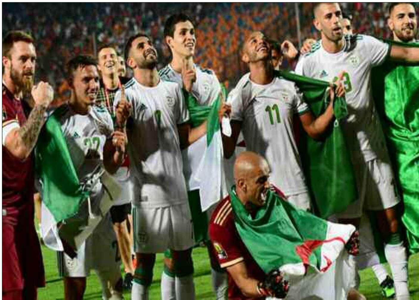
■ Il sera difficile de succéder aux Verts.

En attendant, des sélectionneurs des équipes nationales africaines commencent à communiquer sur les Verts, pour eux, à l'image de l'ancien entraîneur de la Tunisie, le Français Alain Giresse qui s'exprimait sur la Coupe d'Afrique des nations prochaine. Pour lui, il ne faut surtout pas croire que les Verts, champions d'Afrique actuels, résisteraient sur les terrains de football du Cameroun lors de cette