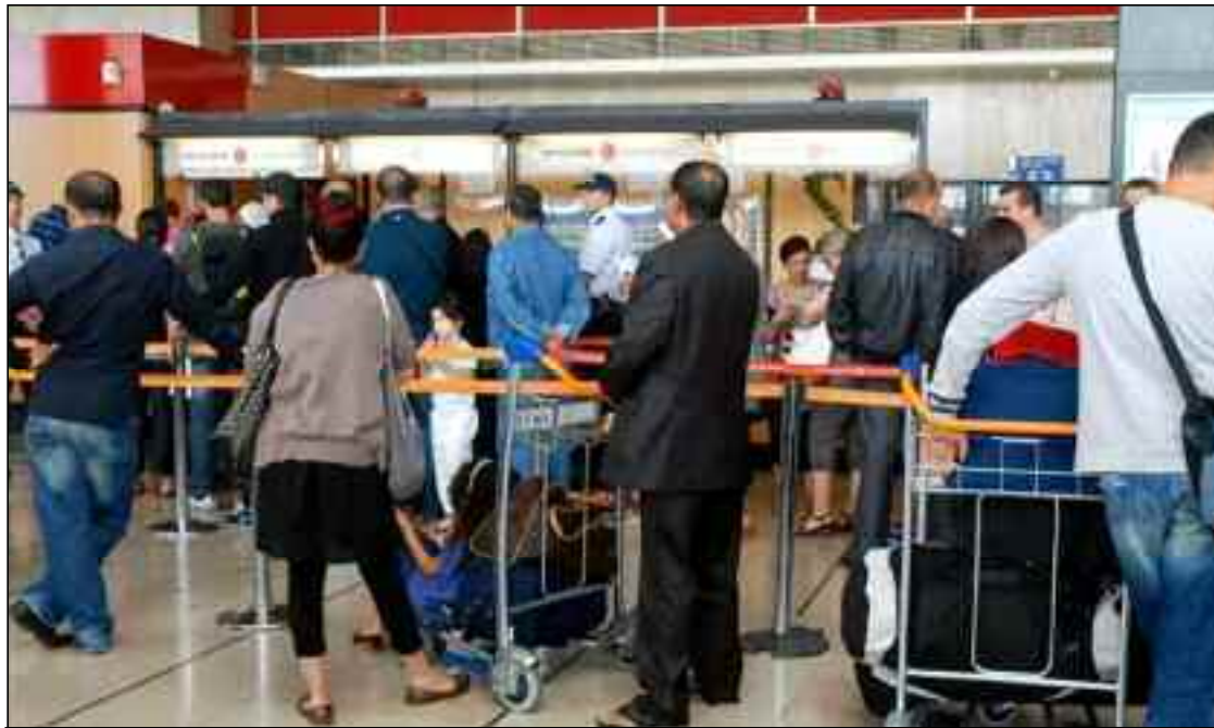
■ Air Algérie a expliqué que la modification du billet est gratuite dans la même classe tarifaire, ajoutant qu'en cas de nécessité de vérification de billet, par ses services, une réservation temporaire sera accordée au concerné.

Concernant le programme de vols, les pays concernés sont la Tunisie (Tunis), la Turquie (Istanbul), la France (Paris et Marseille) et l'Espagne (Barcelone). Le vol Constantine-Tunis-Constantine se fera tous les vendredis, Alger-Istanbul-Alger (tous les dimanches), Alger-Paris (Orly)-Alger (tous les mardis et jeudis), Alger-Marseille-Oran (tous les samedis) et Alger-Barcelone-Alger (tous les mercredis). Cela signifie que nos ressortissants, s'ils ne se trouvent pas dans les villes étrangères desservies, devront s'y rendre pour pouvoir prendre un vol à destination d'Alger, Oran ou Constantine et, éventuellement, de là rejoindre leurs destinations finales. Concernant les conditions d'entrée en Algérie, la compagnie a expliqué qu'en plus d'un billet d'avion confirmé sur le vol réservé, les personnes plus