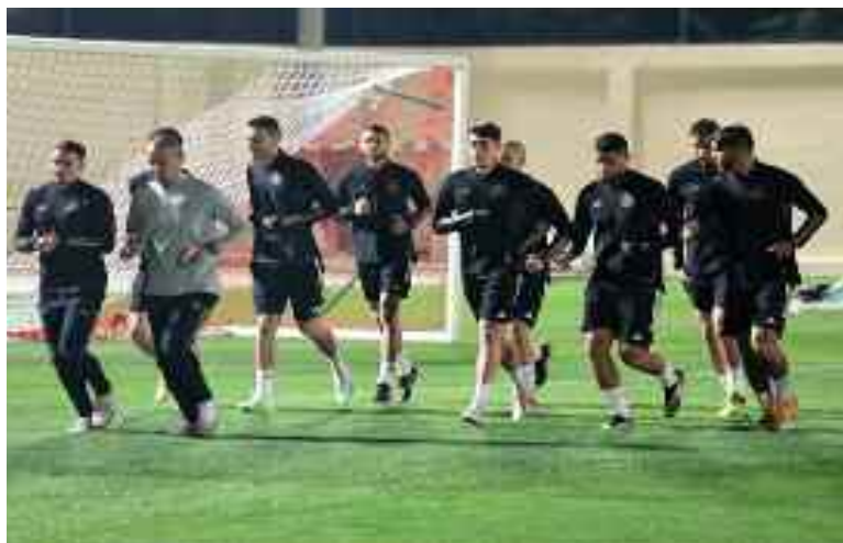
■ C'est la rentrée des classes pour les Verts.