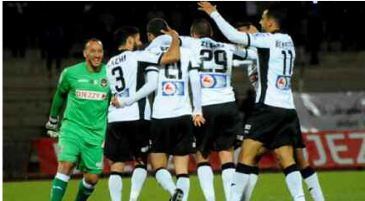
■ L'ESS n'a pas raté l'occasion d'ajouter trois précieux points à son capital.