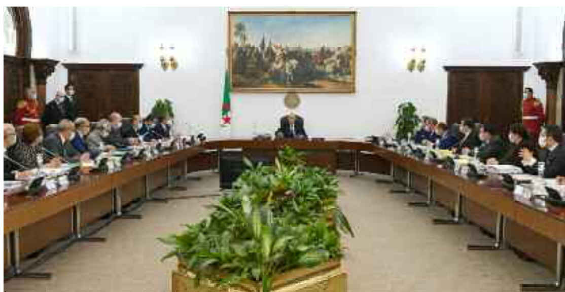
■ Aucun fonds, aucun avoir financier ni aucune ressource économique ne peut être mis directement ou indirectement à la disposition de ces personnes et entités.

marchés et des rassemblements populaires dans plusieurs régions du pays, en sus de la saisie d'armes de guerre et d'explosifs destinés à l'exécution de ses plans criminels, une dangereuse conspiration ciblant le pays, fo-