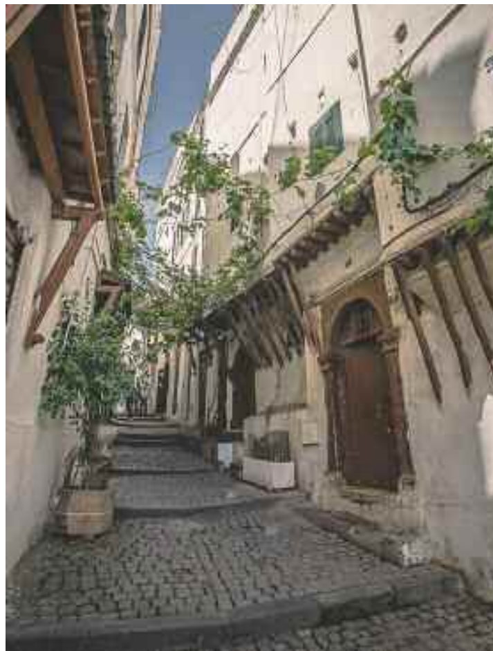
Il est des villes qui ont été marquées à vie par une civilisation et une longue histoire. Elle a vécu dans les traditions anciennes et porte encore les stigmates de son passé.

des nappes souterraines qui se trouvaient au Fort l'Empereur, et l'eau arrivait au moyen de canalisations aménagées jusqu'à chacune de ces sources.