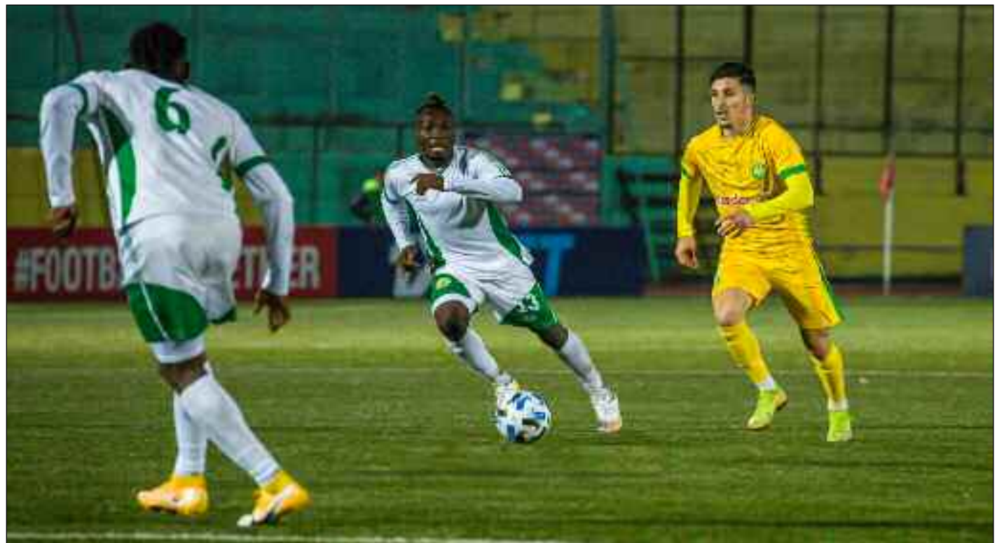
■ La JSK veut reconquérir l'Afrique.