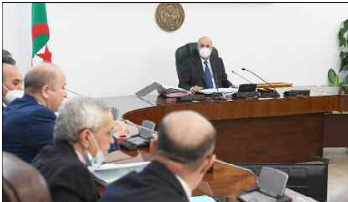
■ Mihoubi avait suggéré la mise en place d'une société algérienne expérimentée pour la réalisation de stations de dessalement de l'eau de mer.

Lors de cette rencontre périodique, a poursuivi la même source, le chef de l'Etat a également ordonné la réalisation de nouvelles stations de dessalement de l'eau de mer en tenant compte, a indiqué un communiqué du Conseil des ministres, de la rapidité de réalisation et du choix stratégique des sites et la création d'une agence nationale chargée de la supervision de la gestion des stations de dessalement de l'eau de mer, sous la tutelle du ministère de l'Energie. Mais aussi l'activation de toutes les lignes des stations de dessalement de l'eau de mer en vue