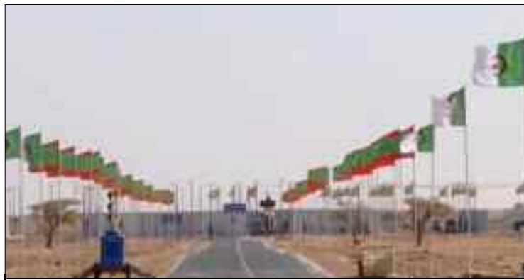
La visite du chef du Gouvernement libyen d'unité nationale en Algérie avait une portée plus symbolique que politique.

Le succès de la période de Transition en Libye dépend en grande partie du succès de la réhabilitation des secteurs énergétiques, productifs, industriels et de l'investissement étrangers pour surmonter les difficultés financières du pays. L'Algérie a toujours tendu la main à son voisin pour l'aider à mieux gérer le douloureux héritage de la guerre qui a paralysé le pays pendant deux décennies. La visite inédite du chef du Gouvernement libyen